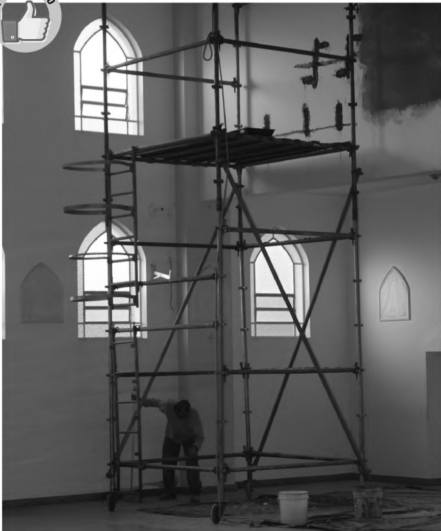
REFORMA GERAL - A igreja de São José, no Jardim Ubirama, está em obras. Será trocado o teto de gesso e o espaço vai receber pintura interna e externa. A torre vai ter um sino e será colocado piso em toda calçada. O ambiente interno vai ter ar condicionado. As obras deve ser concluídas em um mês.