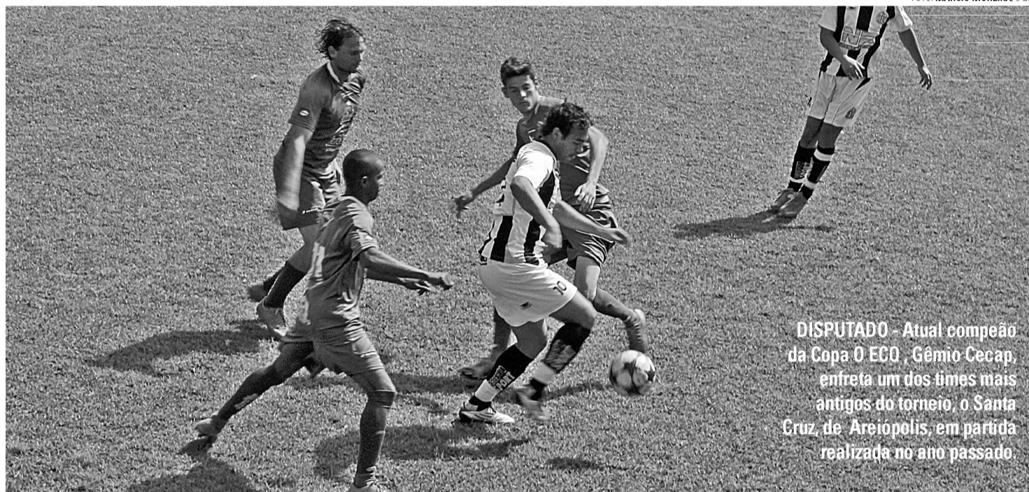
DISPUTADO - Atual campeão da Copa O ECO, Gênio Cecap, enfrenta um dos times mais antigos do torneio, o Santa Cruz, de Areiópolis, em partida realizada no ano passado.

Algumas das equipes inscritas chegam com um admirável histórico de conquistas, outras com a gana e a determinação de ir buscar seu primeiro troféu, mas todas com um mesmo objetivo: se sagrar campeã da competição. É nesse ponto que reside a beleza do espetáculo. A Copa une a novidade e a tradição. O peso da camisa, com a leveza de não ter "obrigação de vencer". Um contraste que, dentro das quatro linhas, se