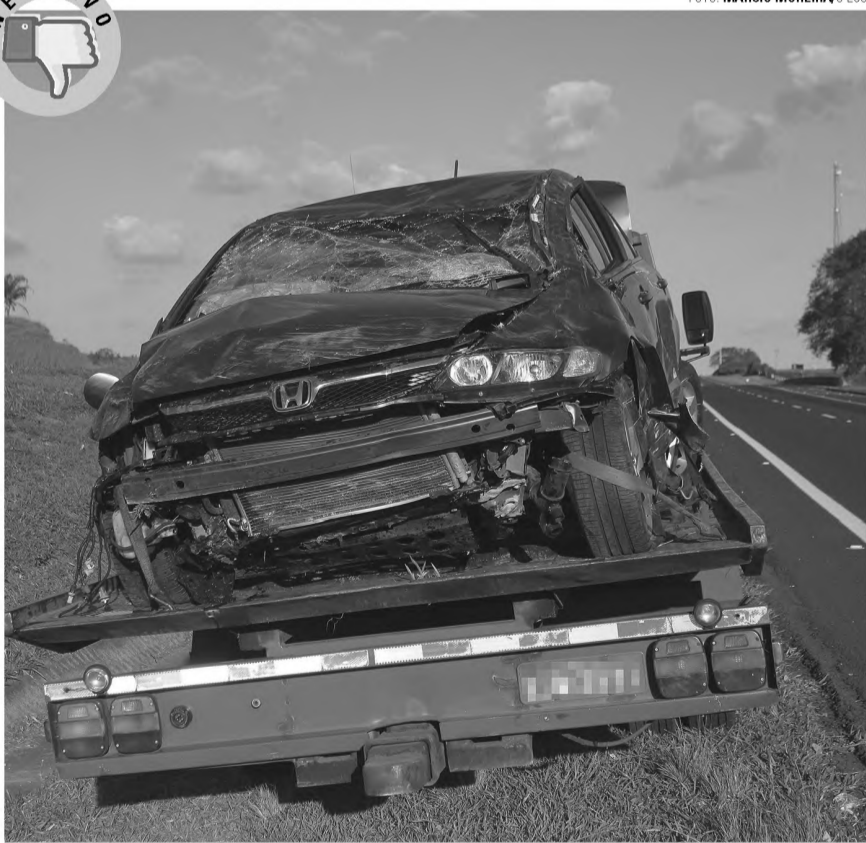
ACIDENTE - Por volta das 17 horas do sábado, 02, um carro da marca Civic, com placas de Botucatu, capotou na Rodovia Marechal Rondon, em frente à Usina Barra Grande com sentido a São Manuel. Estava no carro o motorista e mais duas crianças. Segundo informações do socorro da estrada nada aconteceu de grave. Todos foram encaminhados para o hospital mais próximo.