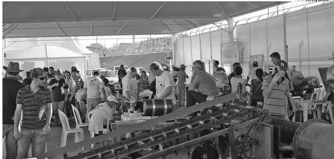
MOVIMENTO – Agrifam recebeu 30 mil pessoas e movimentou cerca de R$ 19 milhões

O presidente afirmou que do ponto de vista negócios, a feira deve superar a marca dos R$ 19 milhões. “Tem um detalhe importante. Muitas empresas ganham também no pós-feira. Eu mesmo falei com uma empresa que disse que já agendou uma demonstração de um novo tipo de motoniveladora