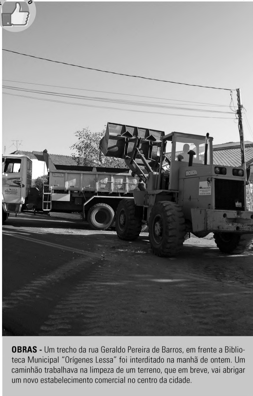
OBRAS - Um trecho da rua Geraldo Pereira de Barros, em frente a Biblioteca Municipal “Orígenes Lessa” foi interditado na manhã de ontem. Um caminhão trabalhava na limpeza de um terreno, que em breve, vai abrigar um novo estabelecimento comercial no centro da cidade.