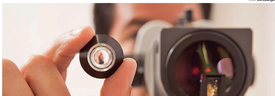
CUIDADOS - Para evitar a perda de visão é preciso frequentar periodicamente especialistas em doenças oculares

Entre os mais velhos, o glaucoma é considerado uma