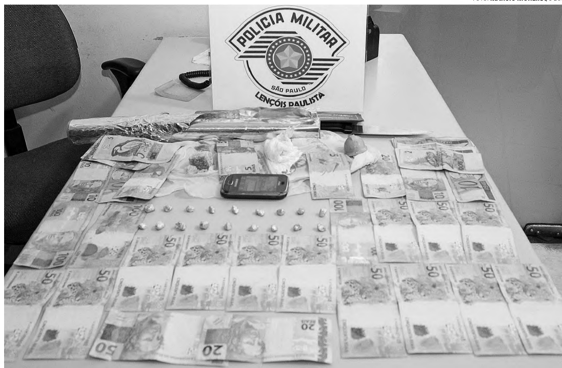
DENUNCIA - Polícia chegou até suspeito após receber série de telefonemas alertando sobre comércio de drogas