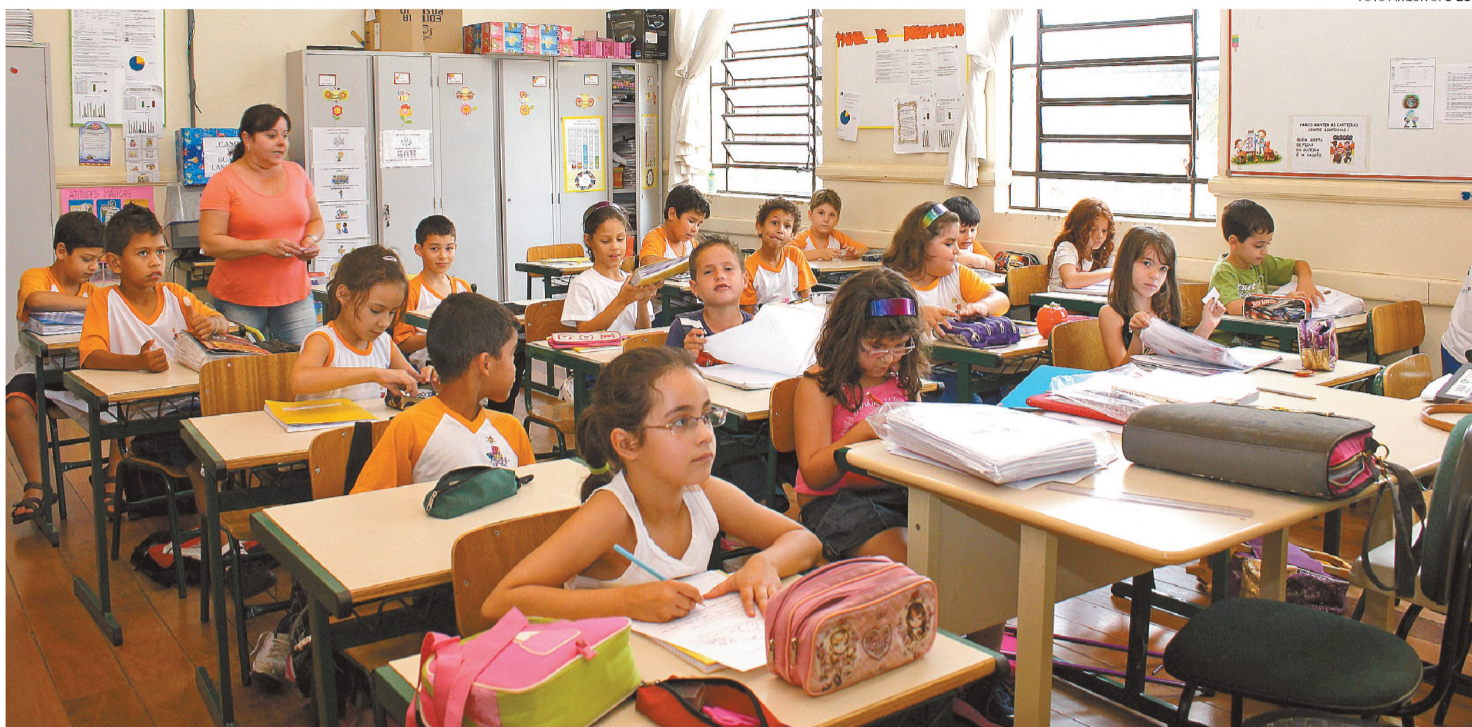
ATENÇÃO – Crianças que trocam as letras na hora de falar, se não receberem tratamento, podem apresentar a mesma dificuldade na escrita

Pais podem ajudar filhos em distúrbios de leitura e escrita; tratamento deve iniciar o quanto antes