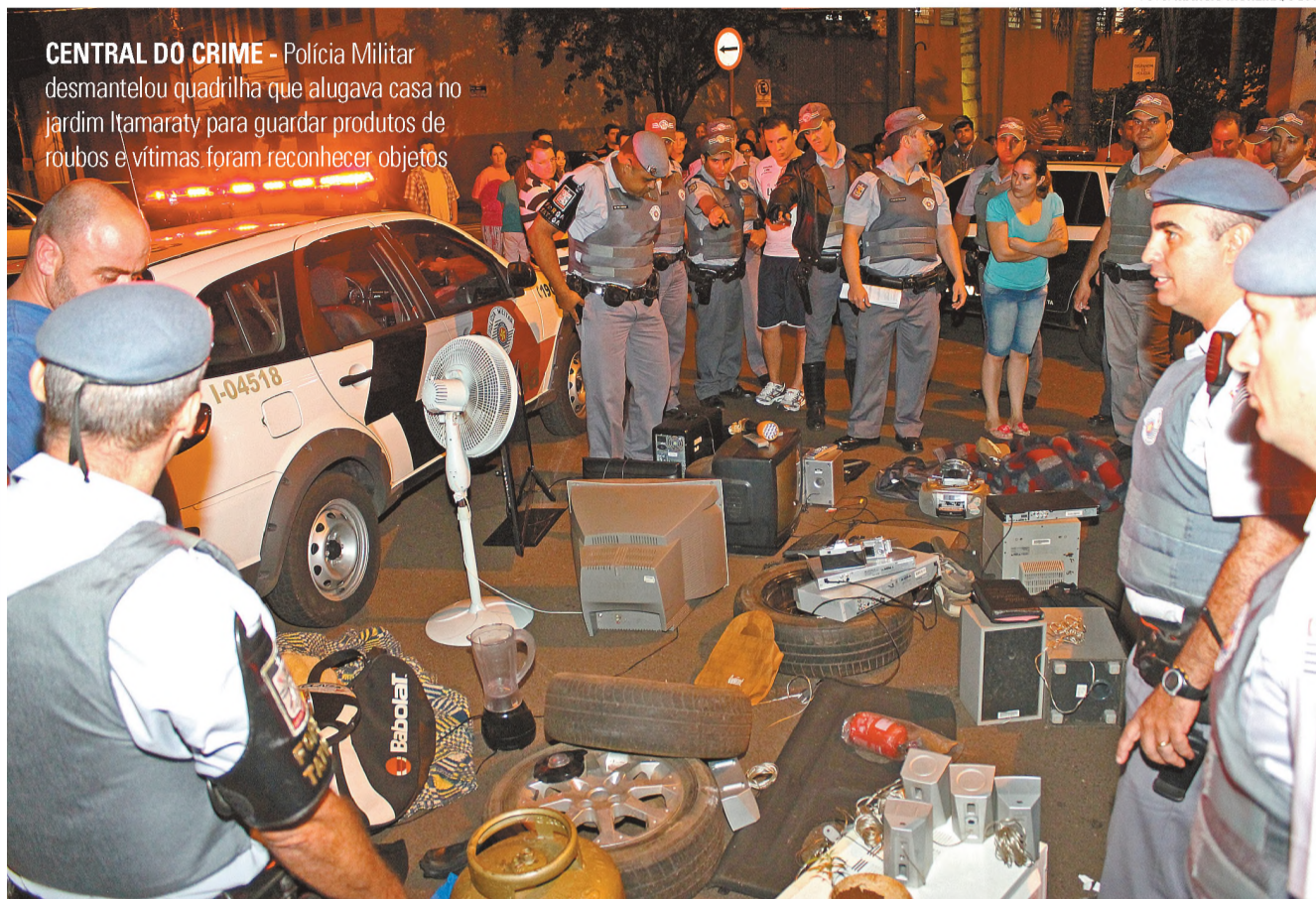
CENTRAL DO CRIME - Polícia Militar desmontou quadrilha que alugava casa no jardim Itamaraty para guardar produtos de roubos e vítimas foram reconhecer objetos