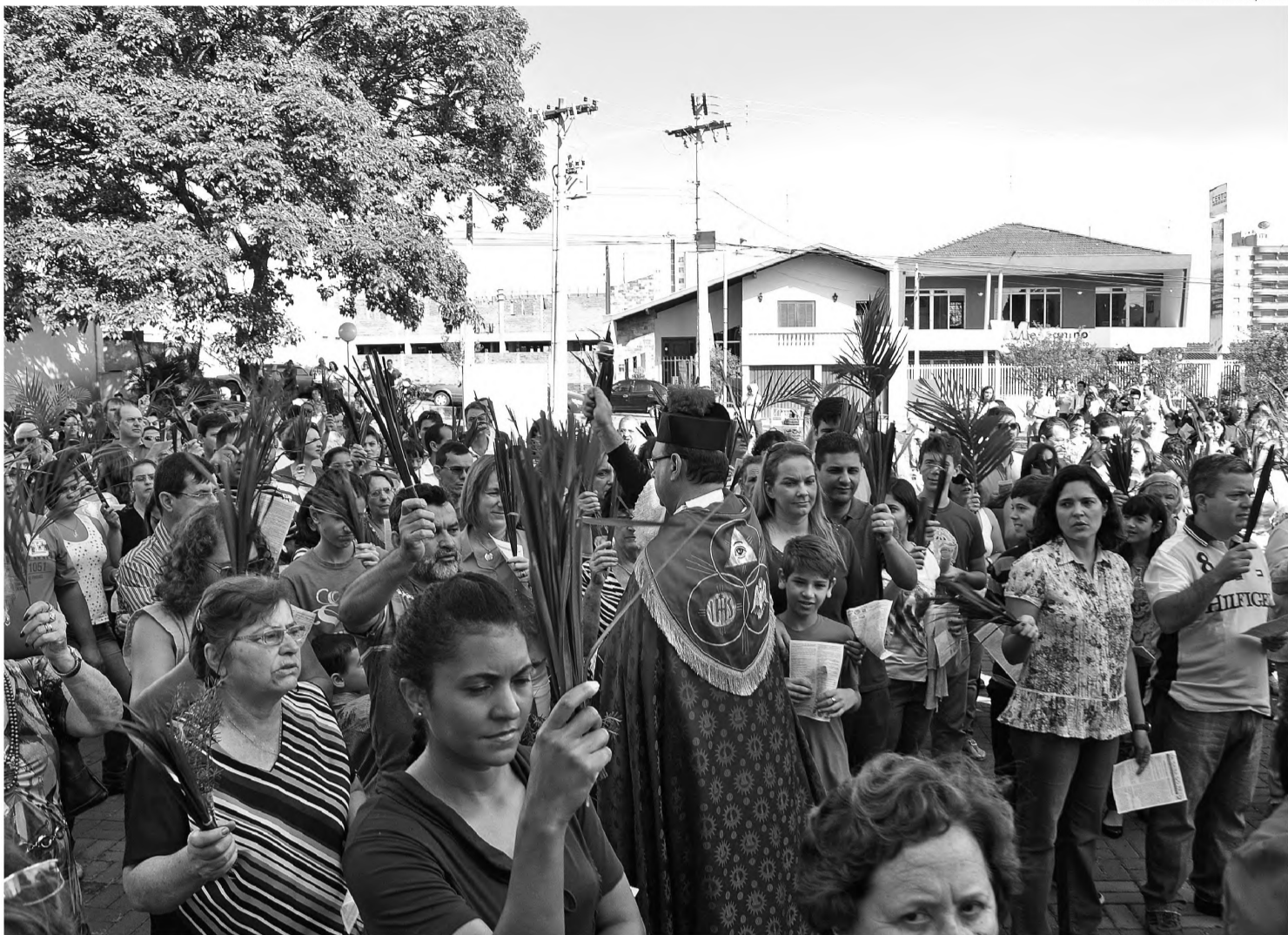
TRADIÇÃO – Domingo de Ramos inicia as celebrações da Semana Santa para católicos; quinta-feira tem missa de Lava-Pés