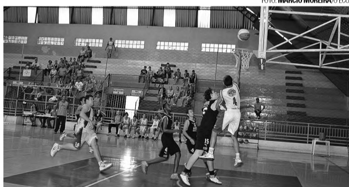
PRIMEIRA - Alba venceu o Banespa com tranquilidade pelo Campeonato Paulista da FPB; Alexandre foi o destaque da partida

Diferentemente dos outros jogos em que errou alguns fundamentos como defesa e rebotes, o Alba entrou em quadra disposto a vencer e continuar na briga pela classificação. Superiores durante todo o jogo, os lençoenses dominaram os quatro-quartos. "Os