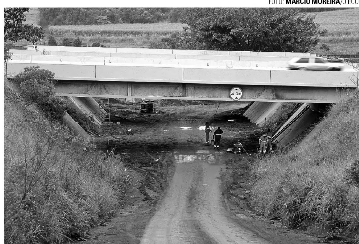
MÃOS NA MASSA - Equipes atuam na instalação de guias sob viaduto

uma extensão de 23 metros de comprimento. A previsão é que as obras sejam concluídas dentro de 120 dias. O investimento é de R$ 497.151,09. Deste total, R$ 405 mil foram liberados pelo Ministério da Integração Nacional, via Secretaria Nacional de Defesa Civil. Como contrapartida a Prefeitura aplicou mais R$ 92.151,09 com recursos próprios. (com assessoria de imprensa)