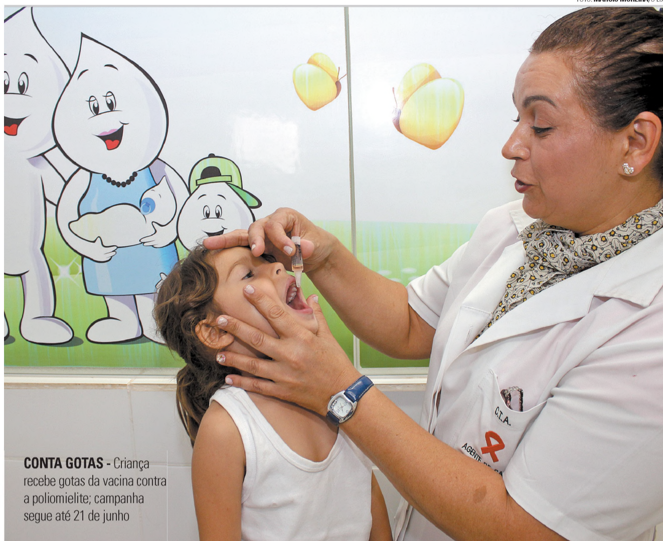
CONTA GOTAS - Criança recebe gotas da vacina contra a poliomielite; campanha segue até 21 de junho