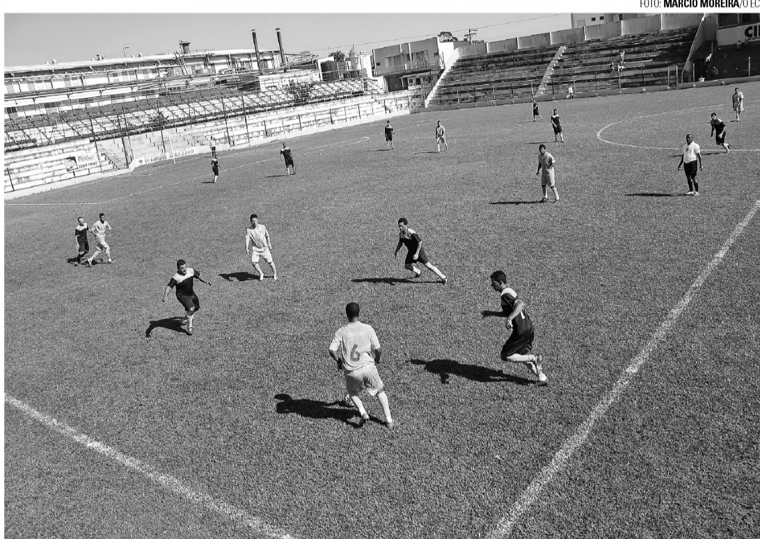
GOLEADA – Maringá não tomou conhecimento e aplicou a maior goleada até o momento da Copa O ECO: 6 a 0