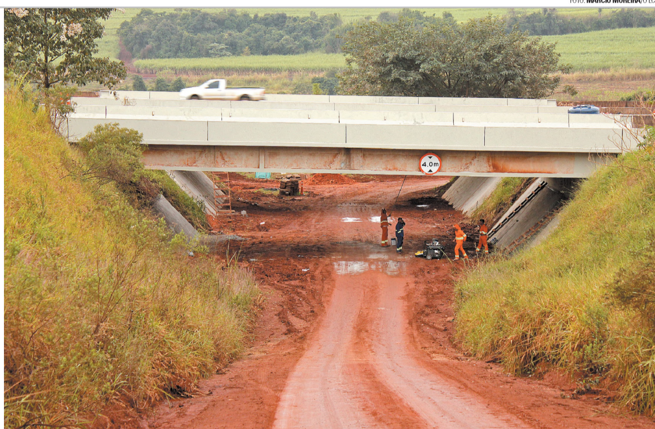
ROTATÓRIA - Região do bairro Progresso recebe rotatória ligando com a Marechal Rondon e melhora entradas e saídas do município