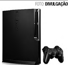
Donos do Playstation 3 devem tomar cuidado com atualização disponibilizada pela Sony. Usuários têm reclamado de travamento.