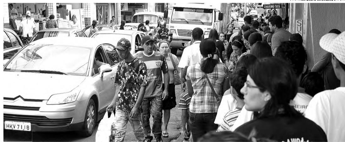
VENDAS - Comércio espera 4% de aumento nas vendas de natal

Cerca de 400 mil cupons serão distribuídos aos consumi-