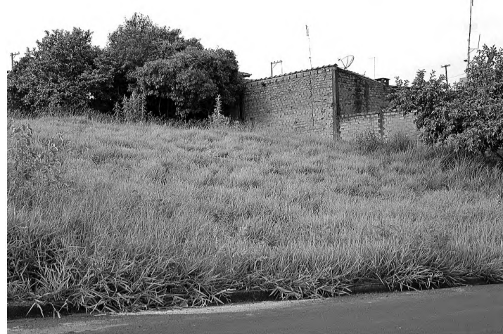
PESANDO NO BOLSO - Mato alto e entulho podem gerar multa de R$ 0,59 o metro quadrado para proprietário de terreno

Proprietários de locais com mato alto e entulhos podem levar multa