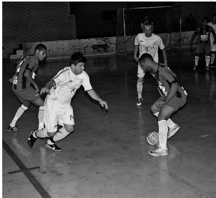
DECISIVA – Quartas de final do futsal começam hoje, no Tonicão