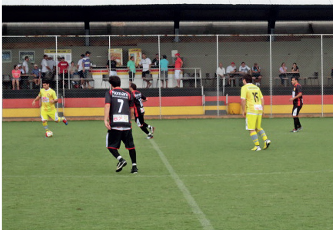
QUASE LÁ – Hot 107 enfrenta a Frigol por uma vaga na final da Copa Coplacana categoria Principal