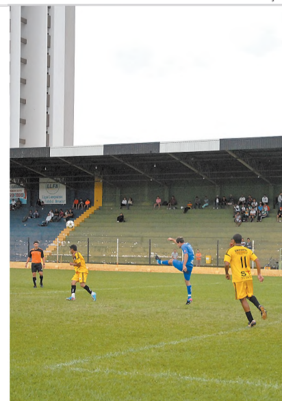
GOLEADA - Santa Luzia (amarelo) fez 4 a 0 e eliminou o Grêmio Cecap