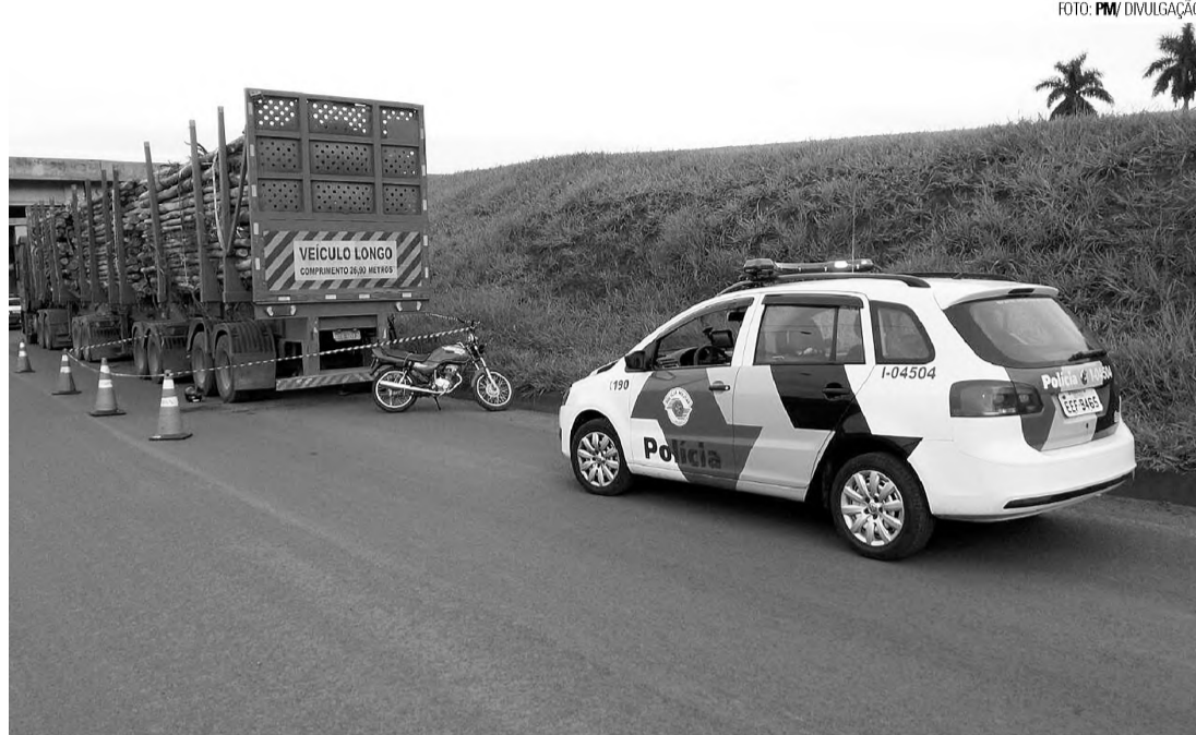
NA TRASEIRA - Motociclista bateu em caminhão carregado de madeira que estava estacionado perto da Dizimag