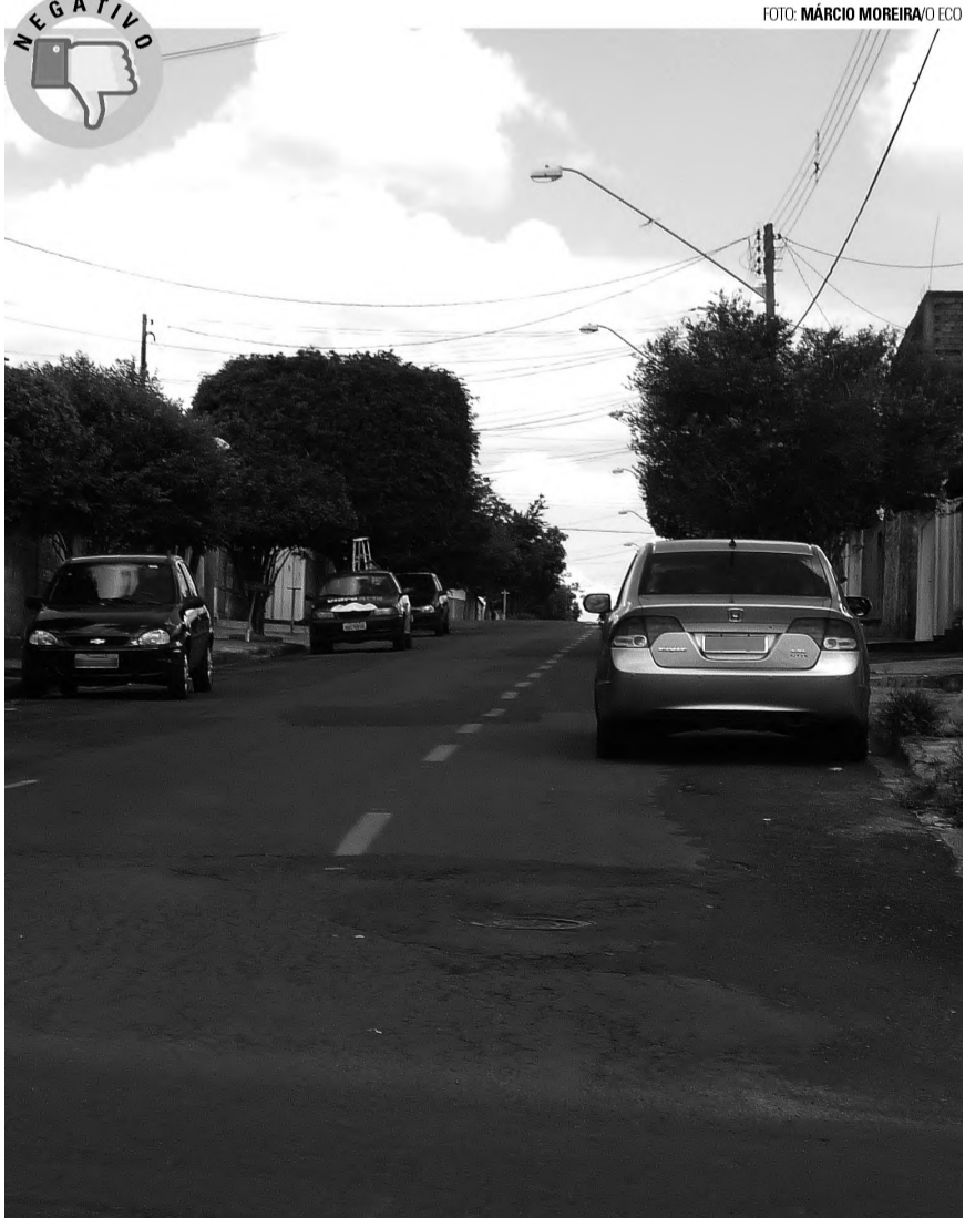
PROIBIDO - A reportagem do jornal O ECO flagrou, na tarde de segunda-feira, um veículo Honda Civic prata estacionado em local proibido, obrigando os demais carros que trafegavam pela rua Adriano da Gama Kury, na Cecap, no sentido centro/bairro, a invadirem a faixa oposta durante a passagem. Alguns condutores se esquecem que as leis de trânsito se aplicam em todos os lugares, seja no movimentado Centro ou nos bairros.