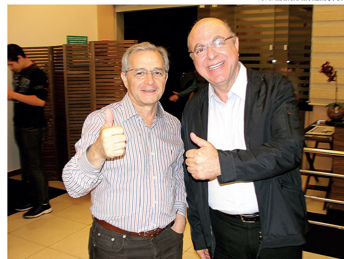
AFINADOS - Marise e Arnaldo Jardim durante a campanha eleitoral do ano passado quando obteve 4.296 votos em Lençóis Paulista

O deputado federal Arnaldo Jardim (PPS), eleito com 155.278 mil votos e o mais votado em Lençóis Paulista, será empossado na próxima quinta-feira, dia 8, às 10h, no Palácio dos Bandeirantes, como o Secretário de Agricultura do Estado de São Paulo. Ligado ao setor agrosucreenergético, Jardim, que já foi secretário da Habitação entre 1992 e 1993, vai atuar no governo de Geraldo Alckmin em defesa de toda cadeia produtiva e será mais uma importante ponte entre Lençóis Paulista e o Palácio dos Bandeirantes. Uma comitiva de empresários, políticos e amigos do deputado já