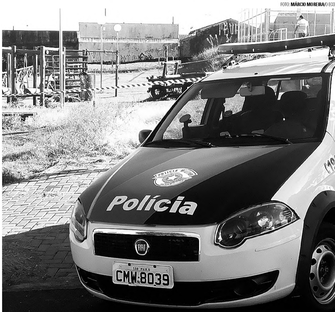
CRIME - Primeiro homicídio do ano ocorreu na madrugada de sábado; autor se entregou na segunda-feira

Namorada teria sido o pivô do crime; rapaz tem 20 anos, já esteve internado na Fundação Casa e se apresentou segunda-feira à polícia de Lençóis