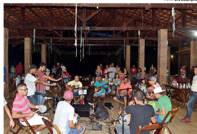
NA RODA - Com muito samba ASP Folia agitou o carnaval no distrito

A Associação dos Servidores Públicos de Lençóis Paulista (ASP) entrou no clima de carnaval e realizou no domingo, dia 15, o ASP Folia. O evento, aberto também a não associados, aconteceu no Recanto do Café, no distrito de Alfredo Guedes e, apesar do tempo chuvoso,