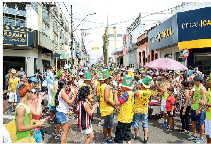
ABREALAS - Bloco na Contramão abriu programação do carnaval em Lençóis

foram os integrantes da AMALP (Associação de Música e Artes de Lençóis Paulista) que puxaram o bloco com as antigas canções de carnaval, entoadas pelas dezenas de instrumentos de sopro e percussão. O grupo partiu da concentração, na Praça do Constitucionalista,