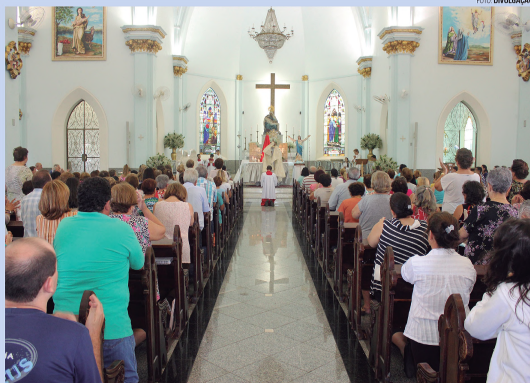
CORRENTE - Fiéis iniciam semana de oração do Cerco de Jericó na próxima segunda

O pároco comenta que este ano o tema do cerco será a cura entre as gerações.