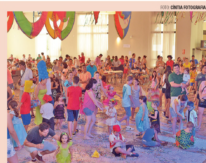
A CARÁTER - Garotada, toda fantasiada, dominou a pista na matinê

Ao final do desfile, os integrantes do bloco se concentraram no Paradão, onde um palco foi montado pela Diretoria de Cultura. A festa se estendeu por lá até às 14h.