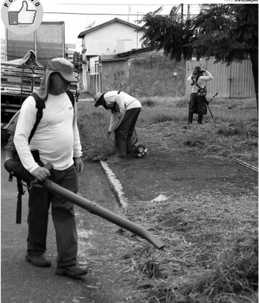
LIMPEZA - A Diretoria de Agricultura e Meio Ambiente realizou ontem a manutenção de áreas públicas no Jardim Granville e Chácara Corvo Branco. Já o serviço de manutenção em áreas vitalizadas está sendo executado na Vila Repik, Praça Mãe Rainha e Praça Nilton Lourenço Prado Varasquim no Jardim das Nações.