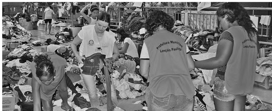
DO TAMANHO DO CORAÇÃO - Doações de toda a região já lotam por completo o Tonicão

Todas as pessoas que tiveram suas residências atingidas pela enchente devem se cadas-