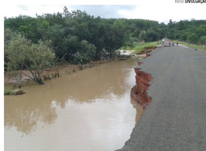
DANOS - 32 pontes na área rural, foram destruídas pela força das águas

O Rio Batalha - que tem sua nascente em Agudos -, foi diretamente afetado após o rompimento de mais de dez represas, fazendo com que a