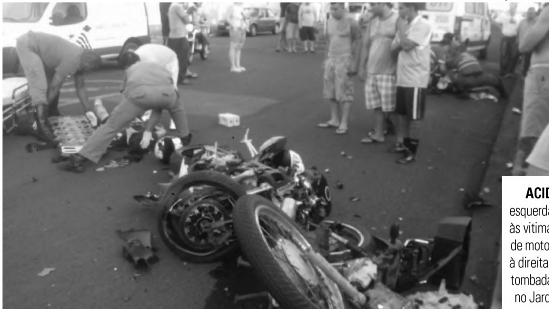
ACIDENTE - À esquerda atendimento às vítimas do acidente de moto na São João; à direita , caminhonete tombada em acidente no Jardim Itamaraty