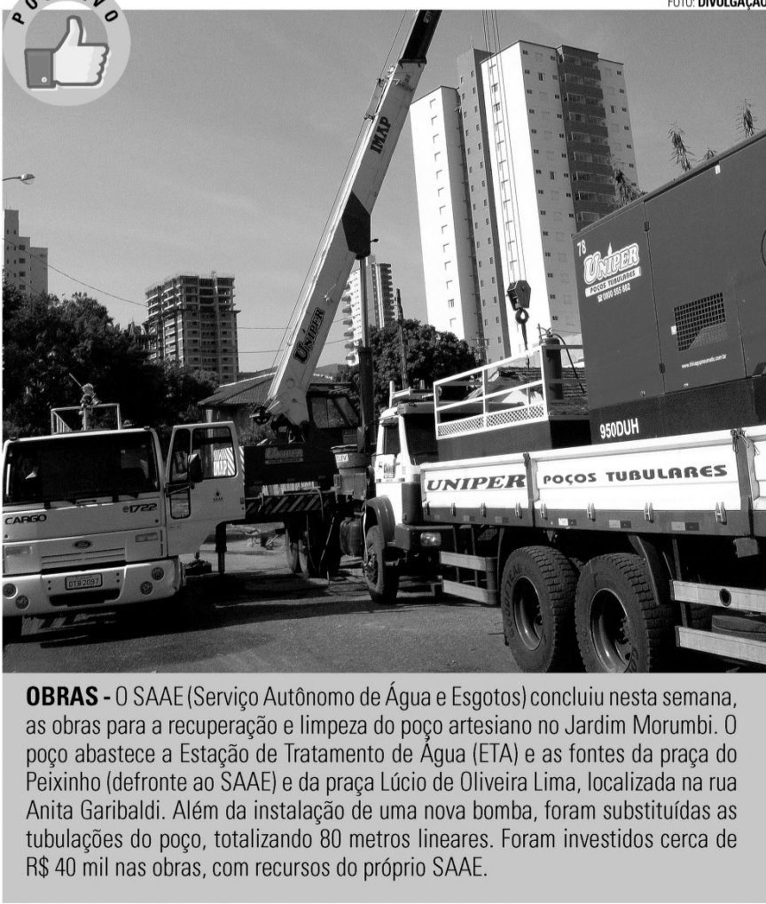
OBRAS - O SAAE (Serviço Autônomo de Água e Esgotos) concluiu nesta semana, as obras para a recuperação e limpeza do poço artesiano no Jardim Morumbi. O poço abastece a Estação de Tratamento de Água (ETA) e as fontes da praça do Peixinho (defronte ao SAAE) e da praça Lúcio de Oliveira Lima, localizada na rua Anita Garibaldi. Além da instalação de uma nova bomba, foram substituídas as tubulações do poço, totalizando 80 metros lineares. Foram investidos cerca de R$ 40 mil nas obras, com recursos do próprio SAAE.