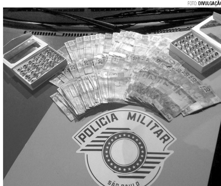
APREENSÃO - Dinheiro e bijuterias apreendidas pela polícia com homem que furto loja no centro

Segundo consta no Boletim de Ocorrência, ela confirmou ter comprado o celular furtado de um usuário de drogas por R$ 200. Diante disso, o delegado de plantão confirmou o flagrante e prendeu a mulher por receptação.