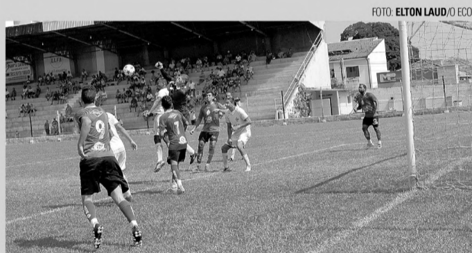
UM CAI - Após fazer a melhor campanha da primeira fase, Grêmio Cecap encara o São José, último colocado por vaga nas quartas de final