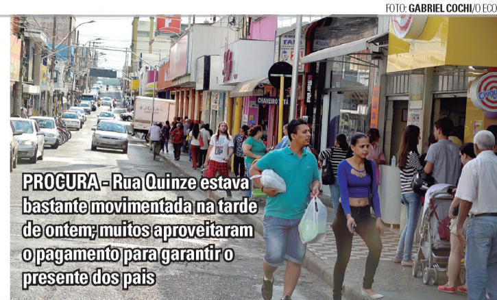
PROCURA - Rua Quinze estava bastante movimentada na tarde de ontem; muitos aproveitaram o pagamento para garantir o presente dos pais

A variedade é grande. É possível encontrar produtos para todos os perfis e gostos, com preços que variam de R$ 4,90 até mais de R$ 1 mil. Tênis, sapatos, calças, bermudas, camisetas, camisas, blusas, jaquetas, óculos de sol, relógios, carteiras, cintos, cuecas, meias, perfumes, celulares, eletrônicos. Uma infinidade de produtos que pode até deixar os filhos em dúvida na hora de escolher. Confira nos destaques algumas sugestões.