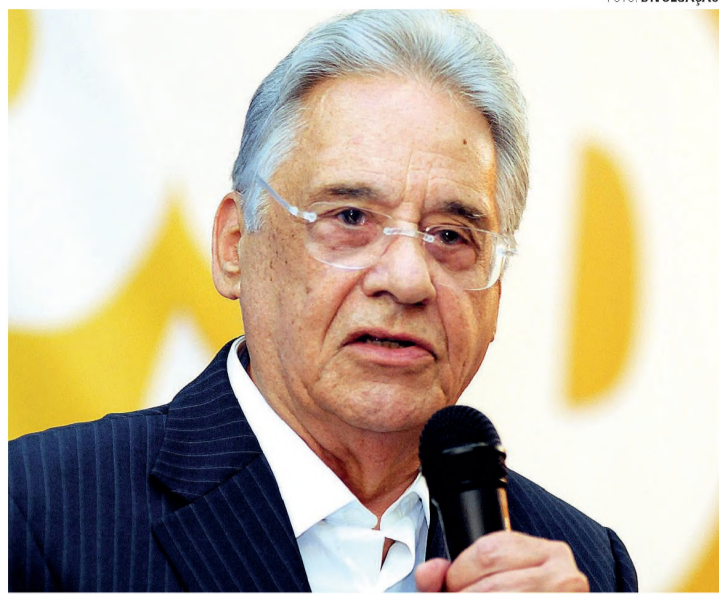
FHC - Executivo só funciona nomeando ministro do Legislativo

A Cetesb, que fiscaliza as indústrias é a mesma que acompanha e atesta