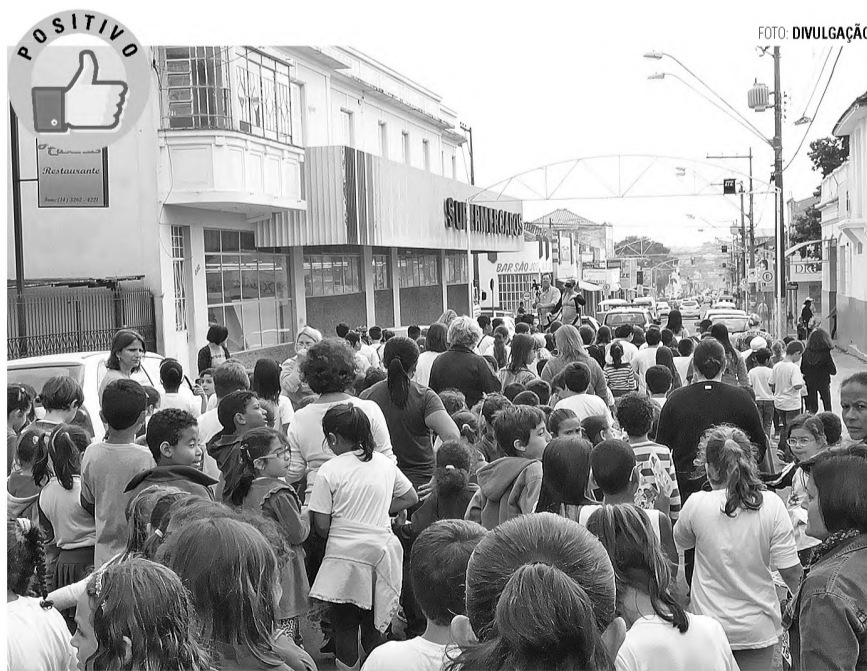
CAMINHADA - Os alunos da Rede Municipal de Ensino de Agudos saíram às ruas na manhã de ontem para conscientizar a população sobre os riscos da dengue. Com cartazes, faixas e panfletos, as crianças chamaram a atenção dos moradores sobre a importância da eliminação de criadouros do mosquito. Durante a semana passada, o tema foi discutido em todas as escolas.