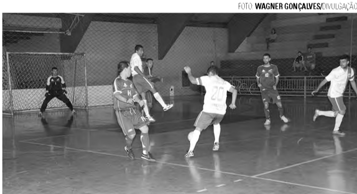
SEMIFINAL - UME (uniforme escuro) e Desacreditados tentariam vaga na decisão na noite de ontem contra União Esporte e Vanglória, respectivamente

Semifinais foram disputadas na noite de ontem