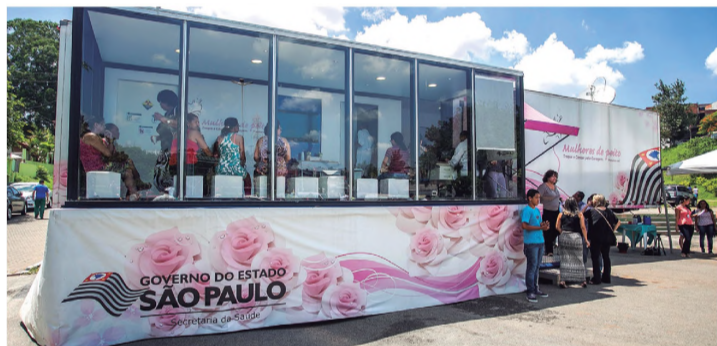
MULHERES DE PEITO - Carreta vai ficar na praça da Concha Acústica