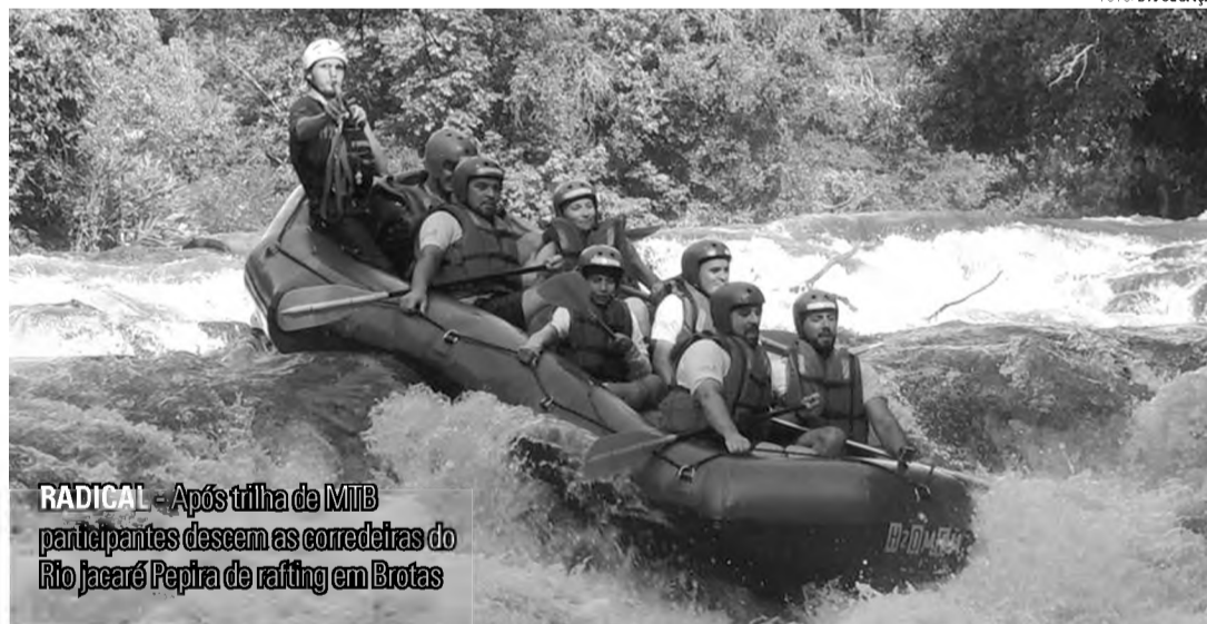
RADICAL - Após trilha de MTB parte a equipe desce as corredeiras do Rio Jacaré Pepira de rafting em Brotas

A excursão dos aventureiros parte de Lençóis Paulista por volta das 7h e se concentra às 8h30 no Brotas Eco Resort, local previsto para o início da trilha. Serão liberadas 200 inscrições, mas apenas um ônibus com 45 lugares será disponibilizado para o trajeto de ida e volta de Lençóis a Brotas - os demais terão que ir de veículo próprio.