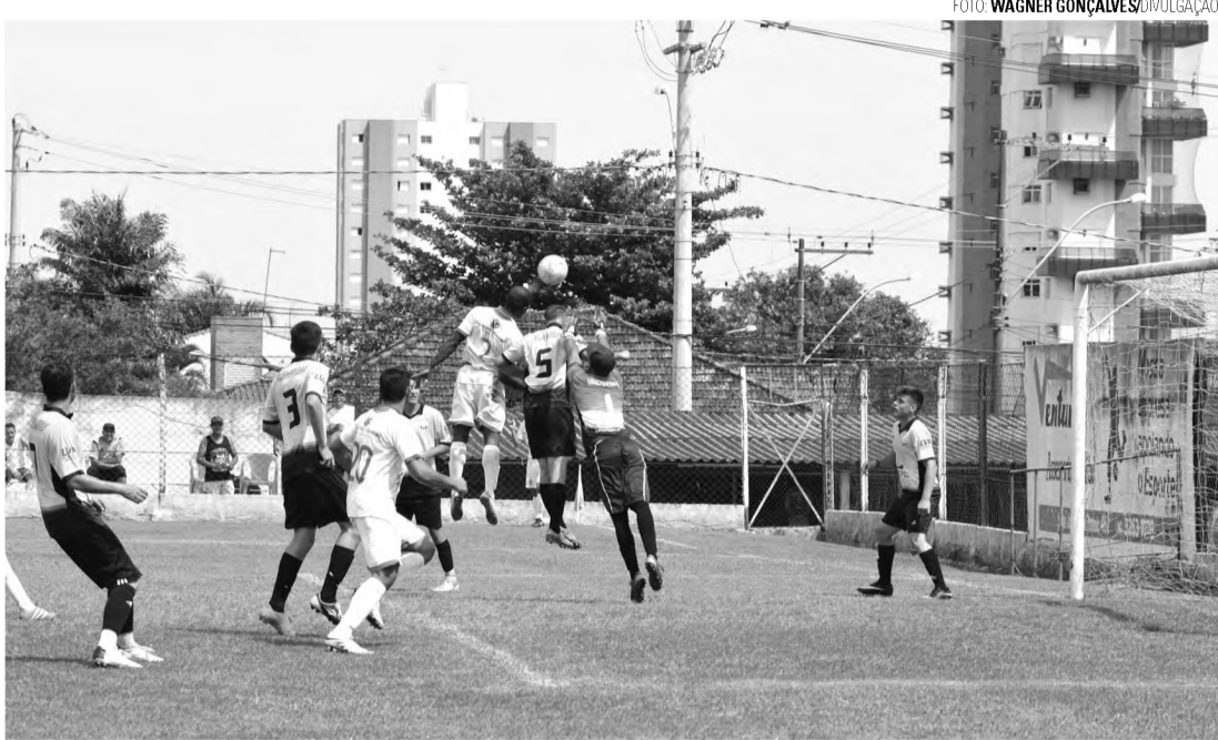
NA FRENTE - São José (branco) garante vitória nos minutos finais contra o Santa Luzia

Equipes levaram a melhor diante de Grêmio Cecap e Santa Luzia, respectivamente