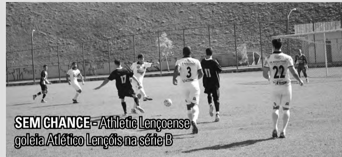
SEM CHANGE - Athletic Lençoense goleia Atlético Lençóis na série B

Jogo terminou com o placar de 4 a 1; Sport Lençóis venceu o União da Vila por 3 a 2