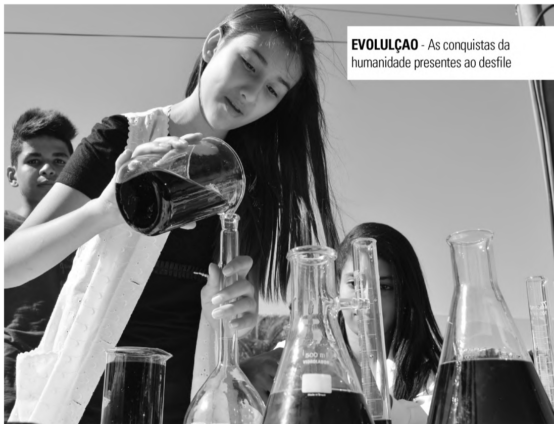
EVOLUÇÃO - As conquistas da humanidade presentes ao desfile