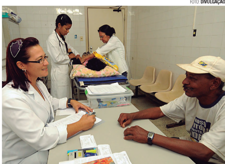
SOLUÇÃO - Apesar das inúmeras queixas e da falta de uniformidade dos serviços entre as localidades, SUS é visto como modelo a ser seguido

“Talvez o mais importante componente do Estratégia Saúde da Família seja o uso extensivo e eficaz dos agentes comunitários de saúde. Cada agente