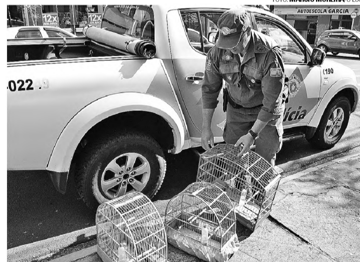
AUTOSCOOLA GARCIA GAIOLAS - Pássaros silvestres foram encontrados no Jardim Carolina

O jovem, segundo informações da polícia, já tem antece-