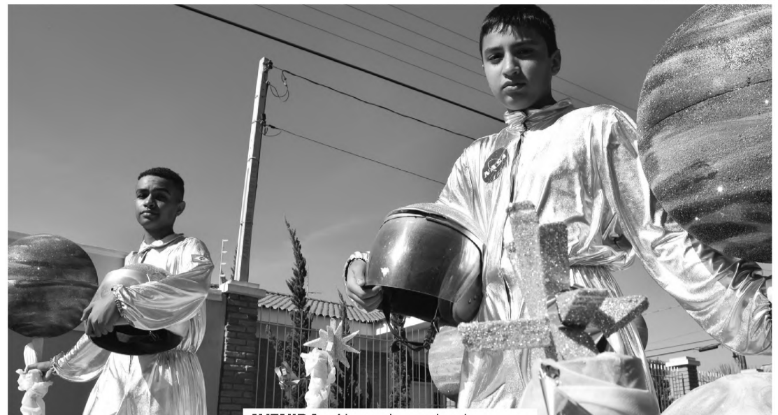
AVENIDA - Alunos de escolas de Macatuba e região fizeram bonito no desfile de aniversário da cidade

O município segue com a programação comemorativa até o dia 30 deste mês.