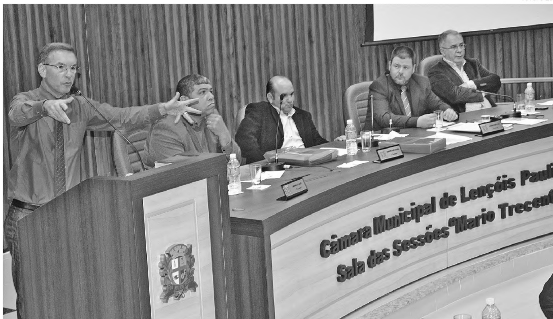
TRIBUTOS - Câmara aprova em primeira votação desconto para devedores de impostos municipais; Tipó quer incluir parcelamento

Em sua justificativa à Câmara, a prefeita informa que até a data de 31 de janeiro passado, os créditos do município em IPTU (Imposto Predial e Territorial Urbano) não pagos somavam R$ 3.813.307,65 e os de ISSQN (Imposto Sobre Serviços de qualquer Natureza) somavam R$ 9.806.743,14. Noutro trecho, a mensagem afirma que "os benefícios des-