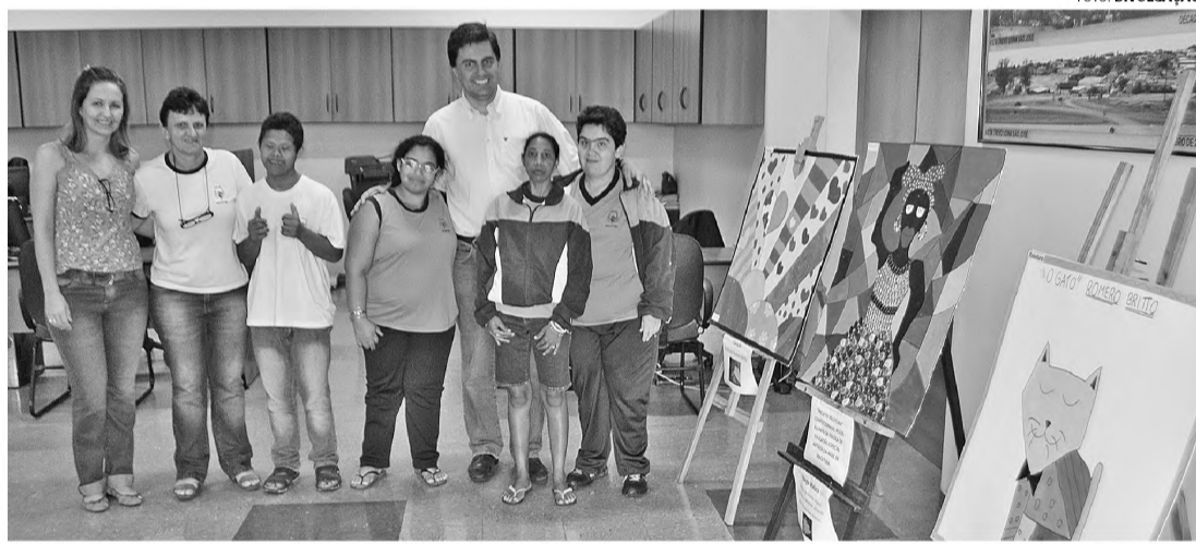
ESPECIAL - O prefeito Tarcísio Abel, os alunos e professores da Apae de Macatuba

O prefeito Tarcísio Abel fez questão de recepcionar pessoalmente os professores e alunos da entidade, que visitaram o Paço Municipal para abrir a exposição. "Para nós, é motivo de orgulho ter o Paço Municipal incluído no circuito de exposições de trabalhos nesta Semana Nacional da Pessoa com Deficiência. A inclusão social acontece