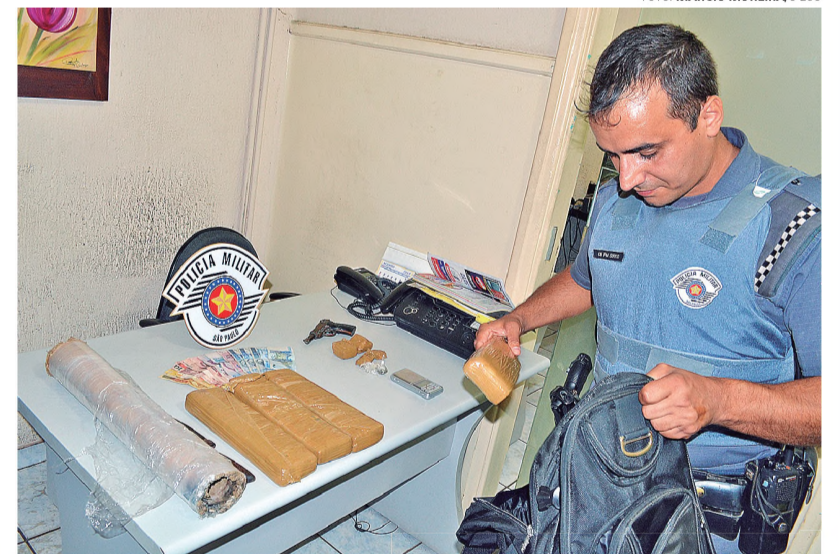
DROGAS - Polícia Militar chegou aos traficantes por meio de denúncia anônima

Pai e filha foram presos ontem à tarde na Vila Cruzeiro, em Lençóis Paulista, com mais de 4 quilos de maconha. De acordo com informações do cabo Serico, a Polícia Militar recebeu denúncia anônima que o morador guardava droga na residência. Sem titubear, o morador afirmou que realmente guardava maconha e liberou a entrada dos policiais que se surpreenderam