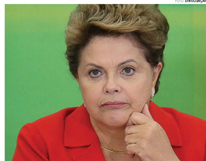
DILMA - Problemas com o PMDB está atrasando a reforma ministerial

O dólar comercial passou ontem de R$ 4, pela primeira vez na história. Desde a criação do Plano Real, em 1994, o dólar chegou a atingir R$ 4 durante do dia em 10 de outubro de 2002, mas nunca tinha superado esse valor. Às 14h05, a moeda norte-americana subia 1,87%, a R$ 4,055 na venda.