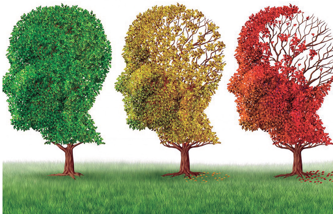
DOENÇA – Manutenção de atividade física e mental podem reduzir o risco de ter o Alzheimer