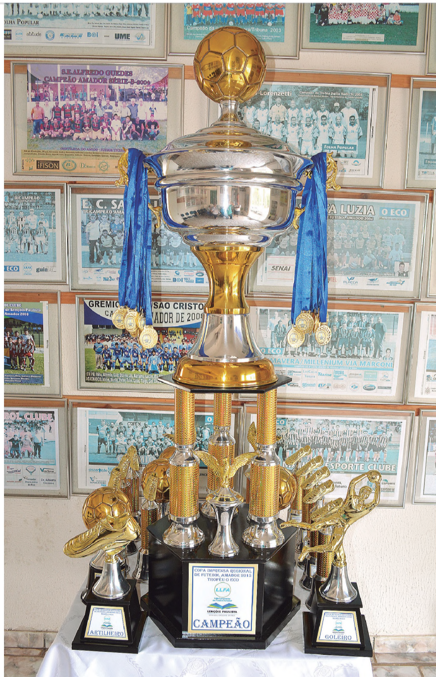
DISPUTADA - Troféus que serão entregues no domingo pela Copa O ECO aos campeões