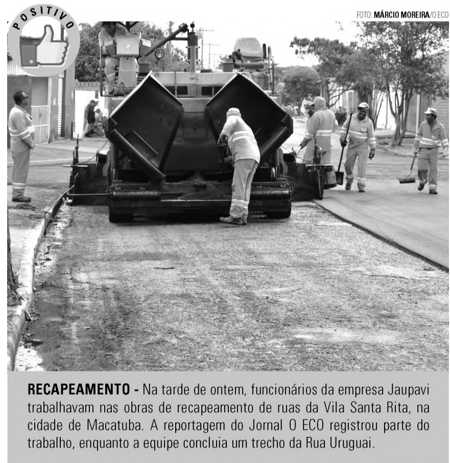
RECAPEAMENTO - Na tarde de ontem, funcionários da empresa Jaupavi trabalhavam nas obras de recapeamento de ruas da Vila Santa Rita, na cidade de Macatuba. A reportagem do Jornal O ECO registrou parte do trabalho, enquanto a equipe concluía um trecho da Rua Uruguai.