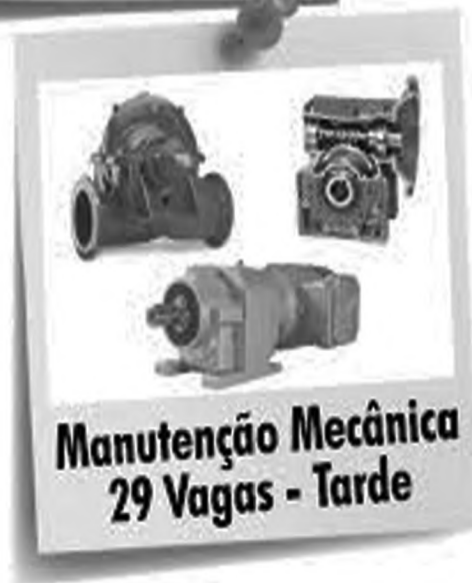
Manutenção Mecânica 29 Vagas - Tarde