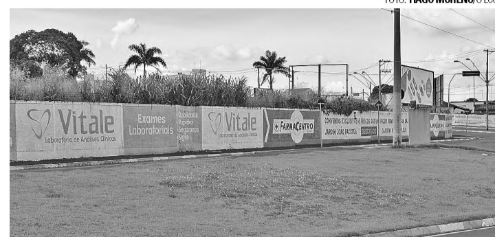
INVESTIMENTO - Área onde Jaú Serve vai construir novo mercado

Obtida a autorização, o Asilo fez o chamamento dos interessados e o Jaú Serve interessou-se. A empresa utilizará uma área de 4 mil m2, onde disponibilizará 2400 m2 de área de venda para a