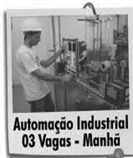
Automação Industrial 03 Vagas - Manhã

Prova de Seleção 13 de janeiro de 2016, às 8hs