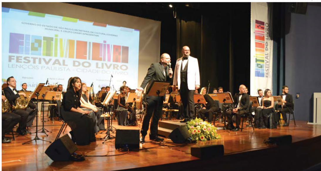
FESTIVAL - Abertura do Festival do Livro reuniu centenas de pessoas no Teatro em uma noite inesquecível

Hoje (22), o Centro do Empreendedor realiza inscrições gratuitas para os cursos a distância que serão realizados pelo Pronatec EAD. Serão 20 vagas para cada modalidade: Almoxarife, Assistente Administrativo, Operador de Caixa, Balconista de Farmácia, Cuidador de Idoso e Cuidador Infantil. Os interessados devem ter acima de 15 anos. Para se inscrever é preciso apresentar RG, CPF, Cartão Cidadão e comprovante de endereço.