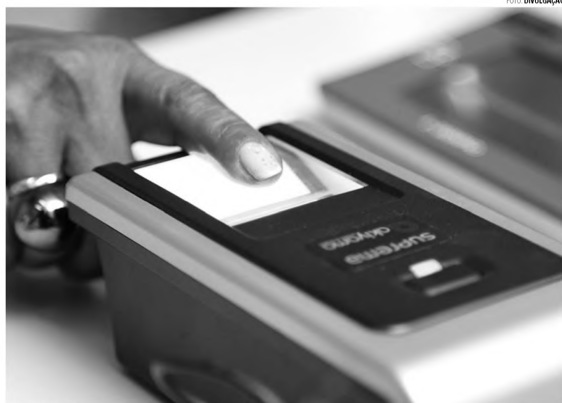
MUTIRÃO - Eleitores não precisam fazer agendamento para o cadastramento

Visando facilitar a realização do cadastramento para as pessoas que não têm disponibilidade durante a semana por conta do trabalho, em dezembro, o TRE-SP vai promover um mutirão de atendimento, especificamente com esta finalidade. No três primeiros sábados do mês, dias 2, 9 e 16, e também na sexta-feira (8), feriado da Justiça Federal, os cartórios eleitorais de todo o estado atende-