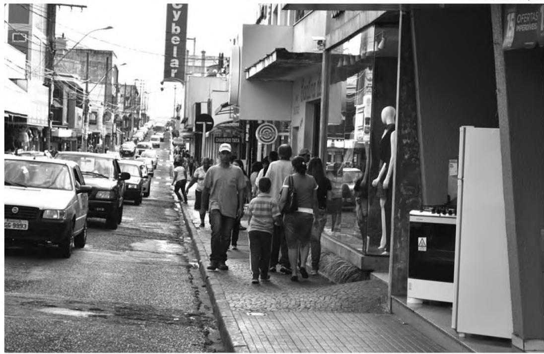
AQUECIDO - Comércio se prepara para vendas de Natal e impulsiona desempenho do Caged

Ainda segundo Neno, os dados também revelam uma sensível recuperação da economia do país. Para ele, os comerciantes estão otimistas com as vendas e têm investido mais em contratações esperando boa movimentação nas lojas. "Estamos observando sinais positivos, o que nos deixa bem confiantes. Esperamos um crescimento em torno de 5% nas vendas em relação ao ano passado. A movimentação deve