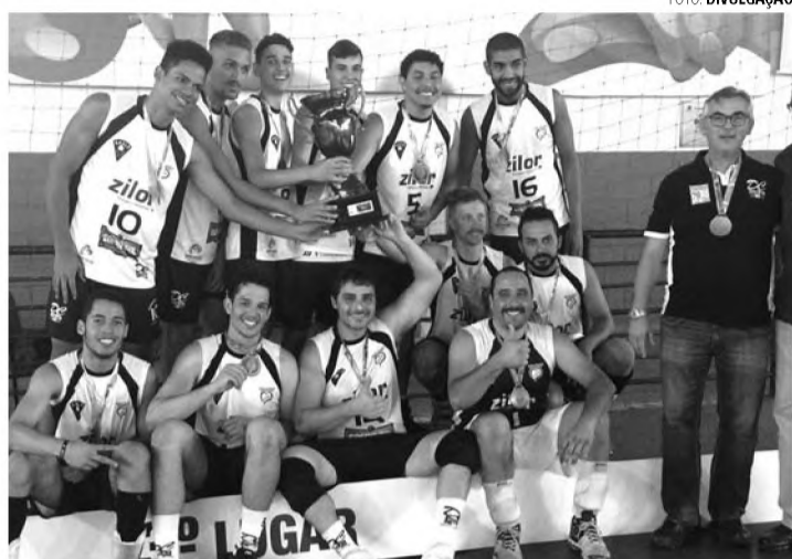
BRONZE - Vôlei Masculino livre e Futebol masculino sub-20 ficaram em terceiro lugar nos Jogos Abertos

Cidade também garantiu medalhas de ouro e prata no Atletismo ACD