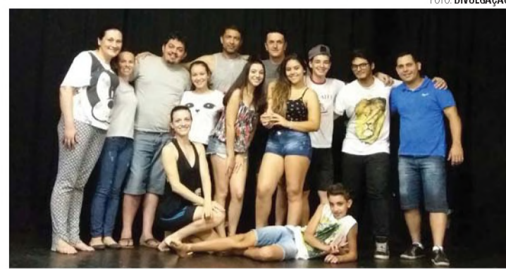
PALCO.COM - Companhia inicia hoje curta temporada da peça "O Cisne Prometido"

Este é o quarto espetáculo da companhia de teatro Palco.com, que estreou em 2015 com a peça "Rosa Choque Por Fora... Por Dentro Titânio", em homenagem às mulheres. A companhia também já apresentou as peças "Chapeuzinho Vermelho Escuro", pela qual recebeu o