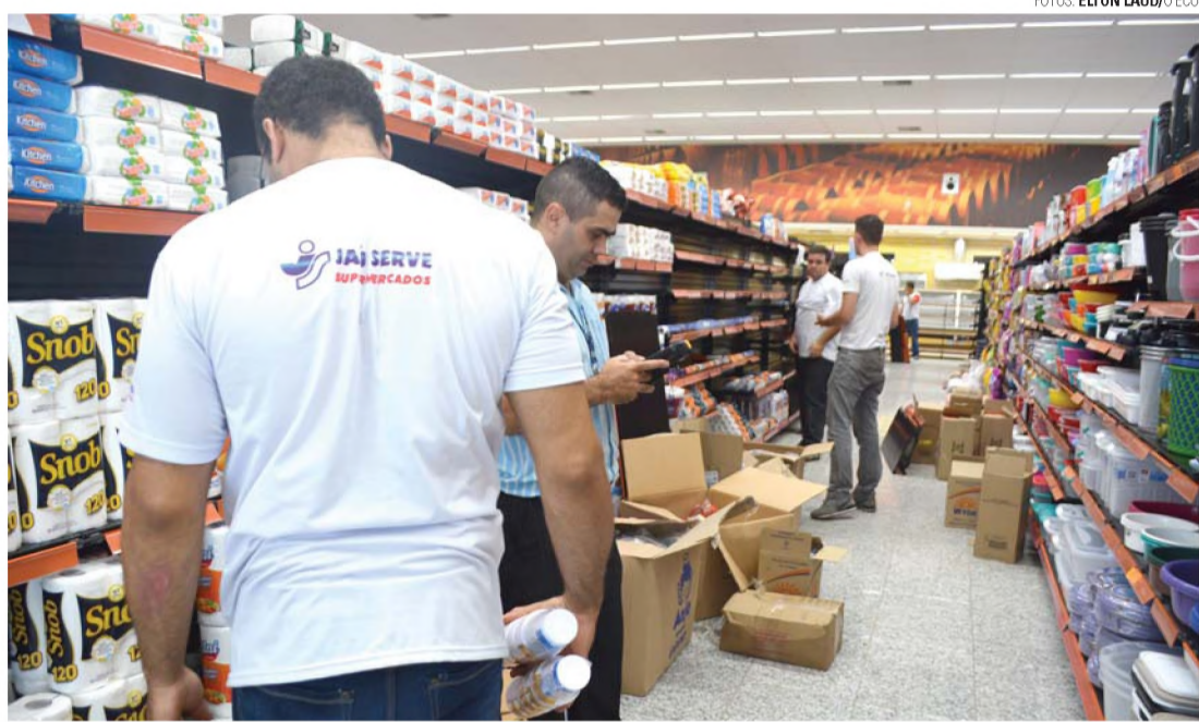
RITMO ACELERADO - Funcionários trabalham para acertar os últimos detalhes para a inauguração

"Lençóis é uma cidade muito próspera, com uma grande atividade comercial e industrial. A rede está aqui há 47 anos, sempre com bons resultados. Percebemos que a cidade comportava uma segunda loja, sobretudo nesta