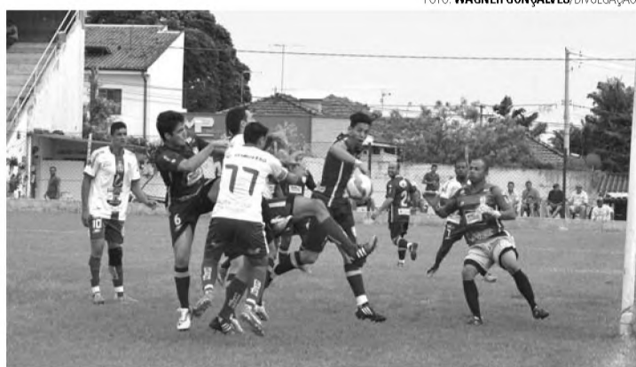
EMBATE - Asa Branca e Grêmio Cecap fazem clássico em Alfredo Guedes no Dia dos Pais

Pela Série A, em Alfredo Guedes, entram em campo as equipes do Grupo B. O destaque do dia promete ser o confronto entre Asa Branca e Alfredo Guedes, que abre a rodada às 8h. Com três