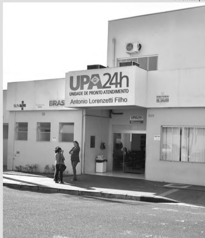
UPA - Entidades que se candidatarem à administração do serviço terão que cumprir uma série de exigências