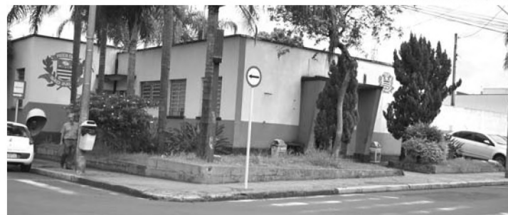
PRESO - Padrasto acusado de estupro está preso e pode pegar até 20 anos de prisão