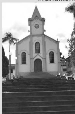
NO DISTRITO - Festa de São Benedito e Senhor Bom Jesus termina amanhã (13)

A partir das 14h tem o tradicional leilão