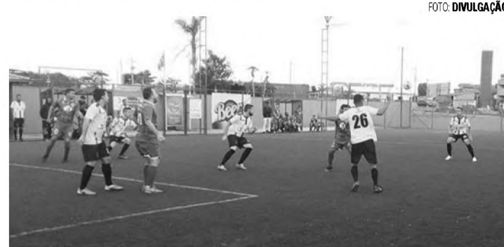
A BOLA VAI ROLAR - Soccer Brasil recebe jogos da segunda rodada 1ª Copa Beer Fast/Ventura FM de Futebol Society

Três jogos serão disputados hoje (12) na sede da Soccer Brasil