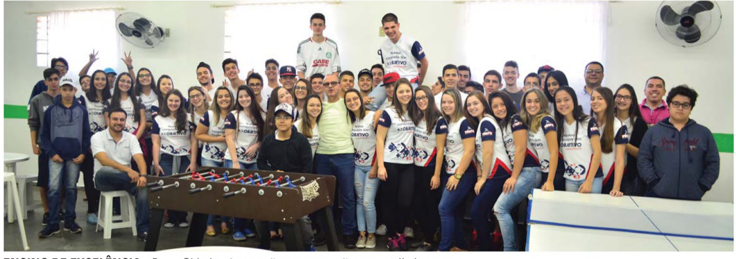
ENSINO DE EXCELÊNCIA - Preve Objetivo é campeão em aprovação nos vestibulares

O Preve Objetivo de Lençóis Paulista está localizado até o final desse ano na Rua Dr. Antônio Tedesco, 255, no Centro, na Galeria Guarani (2º andar). A partir do primeiro semestre de 2018, o colégio funcionará na Rua 28 de Abril, 586, Jardim Granville, (prédio da antiga Unicana). Os telefones para contato são o (14) 3269-3090 e o (14) 3264-6482.