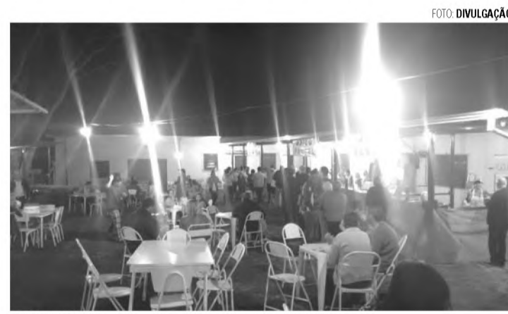
ESTRUTURA - Barracas de comidas e bebidas estarão montadas no pátio interno do Asilo

terão início na quinta-feira (17), com a novena preparatória que segue até o dia 25, com missas diárias celebradas na Capela do Asilo, sempre