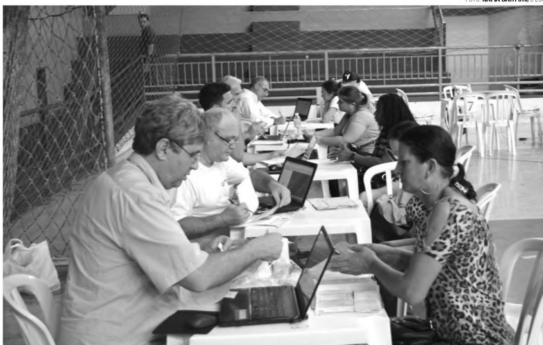
MINHA CASA MINHA VIDA - Pré-inscrição foi realizada no último final de semana, no ginásio Tonicão

Os representantes da Construtora avaliaram positivamente o evento de pré-cadastro. "Foi excelente. Esperávamos um grande número de pessoas, uma vez que fazia tempo que não saía um empreendimento nesse modelo em Lençóis Paulista. Distribuímos uma média de mil senhas por dia. No domingo o movimento foi mais