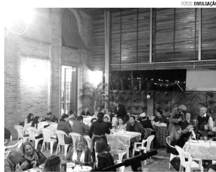
SEMANA ITALIANA - Deliciosas receitas poderão ser degustadas no Espaço Cultural

No sábado a programação ocorre entre 9h e 22h. No domingo, a programação começa às 9h e termina por volta de 14h. Ao meio-dia tem almoço italiano com música ao vivo. No cardápio, iguarias como gratine, macarrão ao sugo/ bolonhesa e frango ao molho. Os convites podem ser adquiridos na Sociedade Italiana ou Escritório Modelo, por R$ 20, até sexta-feira.