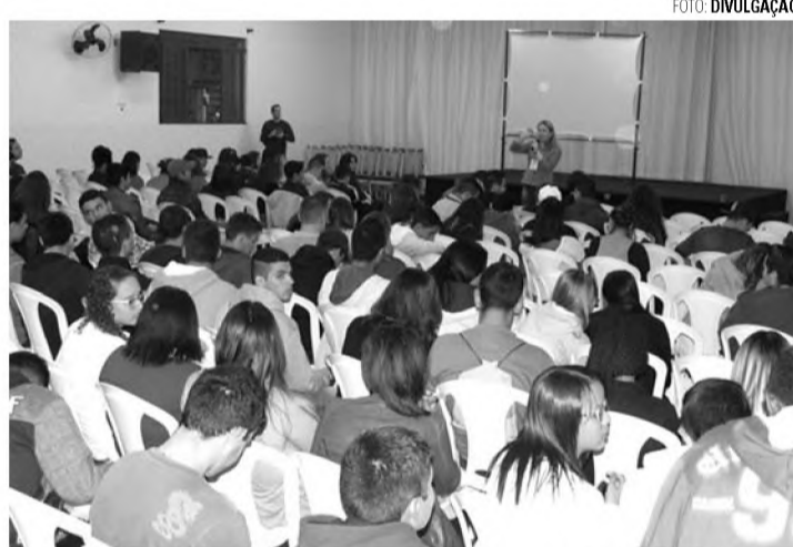
PROFITURO - Programação tem início às 19h e segue até as 22h30

A 8ª Profituro conta com o patrocínio do Grupo Lwart e parcerias com instituições de ensino de Lençóis Paulista e região. Mais informações podem ser obtidas pelo telefone (14) 3264-8888 ou facebook.com/projetolideres.