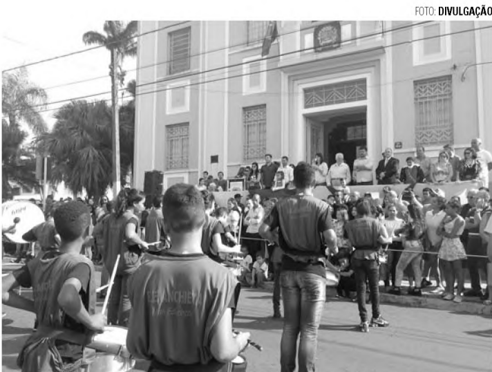
FESTA - Cerca de 10 mil pessoas acompanharam o desfile cívico em Pederneiras

Final de semana também teve inaugurações de pista de Jeep e motocross