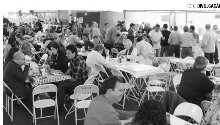
SALVE SANTO ANTONIO - Macatubenses realizam festa em honra ao padroeiro

No dia 13, fiéis realizam passeio ciclístico