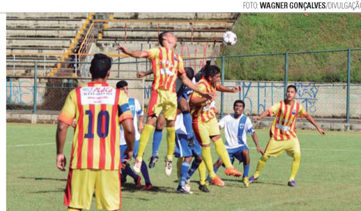
NÃO DEU - Sport Lençóis (listrado) saiu na frente, mas perdeu de virada para o Açaí

Com 10 equipes na briga pelo título, a Série A começa no domingo (4), com dois jogos disputados no Bregão, ambos válidos pelo Grupo A. Às 8h, entram em campo Expressinho e Atlético Paulista; em seguida, às 10h, jogam Duratex e Palestra. Como as equipes estão divididas em dois grupos de cinco (confira abaixo), a cada rodada uma fica 'de folga', como será o caso do Santa Luzia