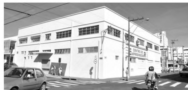
INSCRIÇÕES - Interessados devem comparecer ao Centro do Empreendedor

Disponibilidade de vagas deve ser consultada pelo telefone (14) 3263-2300