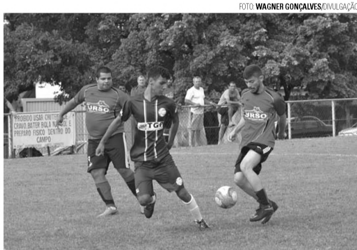
DECISÃO - Equipes decidem vagas na semifinal no Jardim América

As quatro equipes classificadas para a semifinal entram em campo no próximo domingo