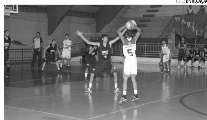
NA CESTA - Jogos do basquete acontecem no ginásio Tonicão

Campeões do futebol, basquete e voleibol avançam para a fase regional