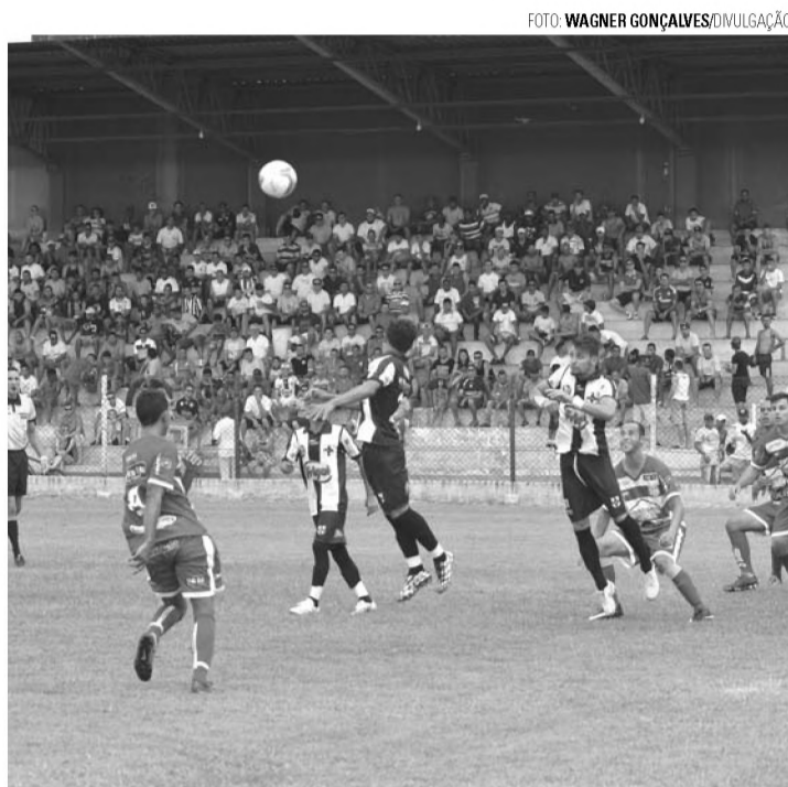
EMBATE - Expressinho e Athletic Lençoense brigam por vaga na final; no detalhe, confronto entre as duas equipes na edição de 2016

Expressinho e Athletic Lençoense entram em campo às 10h, no Bregão