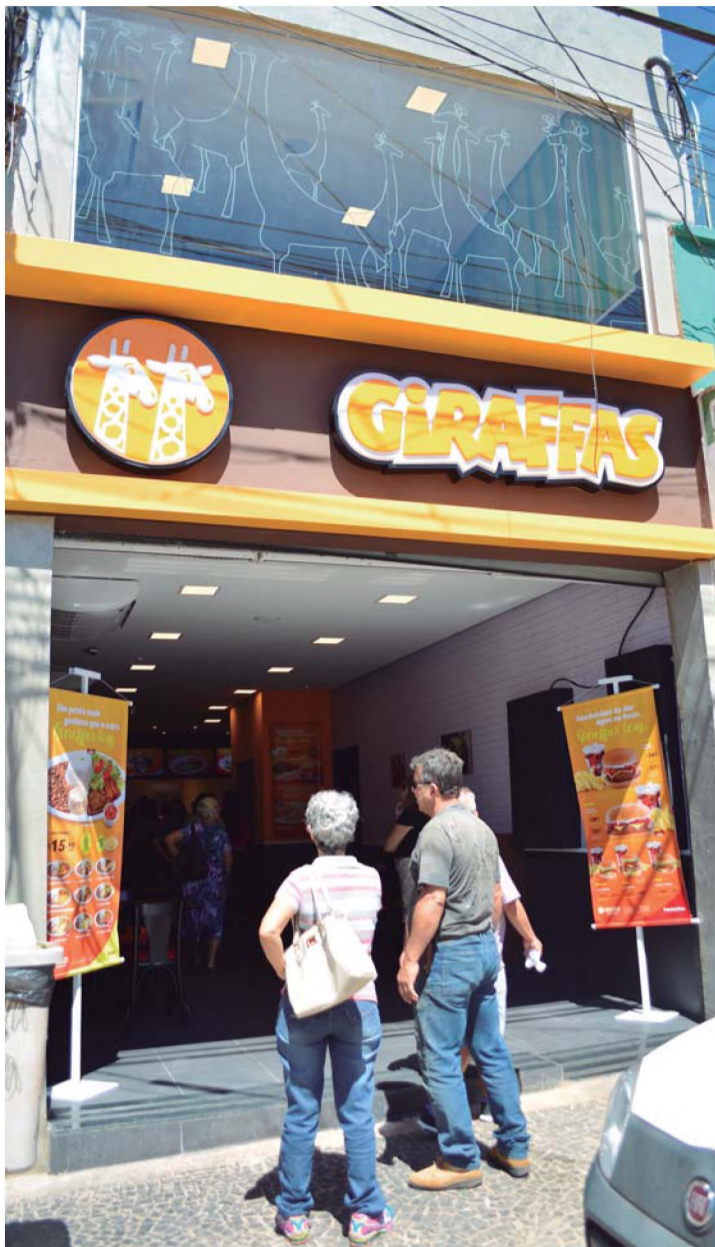
REDE - Unidade instalada na Rua Quinze de Novembro é a 420ª da rede

Instalado na rua Quinze de Novembro, rede de fast food abriu as portas na quinta-feira, oferecendo pratos, sanduíches e sobremesas