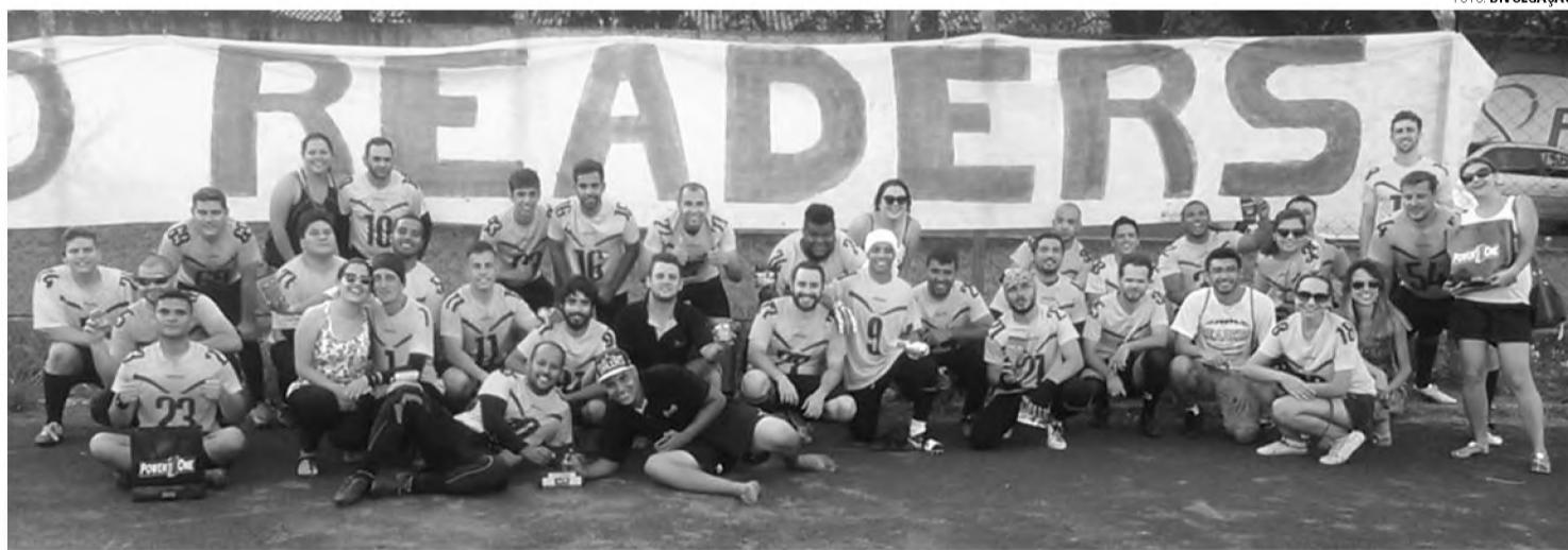
GO READERS - Anfitrião da vez, Lençóis Paulista Readers tenta título em torneio pré-temporada

Torneio foi disputado no último domingo (19) na pista de atletismo Juracy Cassita