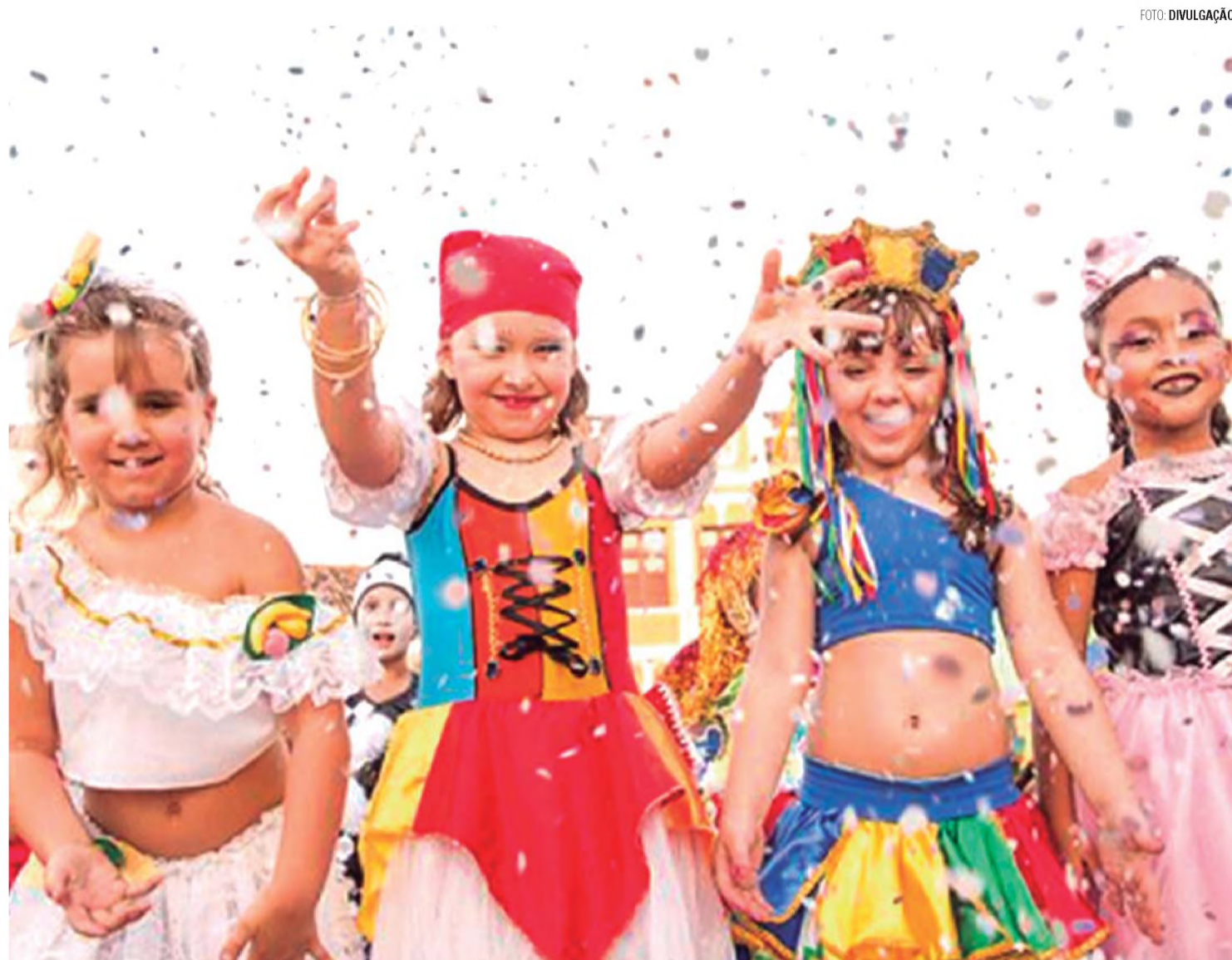
ATENÇÃO - Crianças precisam de atenção redobrada durante o carnaval, hidratação e proteção solar são os principais cuidados

Confira as dicas para curtir a folia com segurança e sem riscos para a saúde da criança