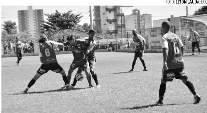
SEM PROBLEMAS - Grêmio Cecap goleia e encara o Palestra nas oitavas de final; na foto, lance da final de 2016 entre as duas equipes

Atual campeão derrotou o Atlético Kaju por 4 a 0 e encara o Palestra nas oitavas de final