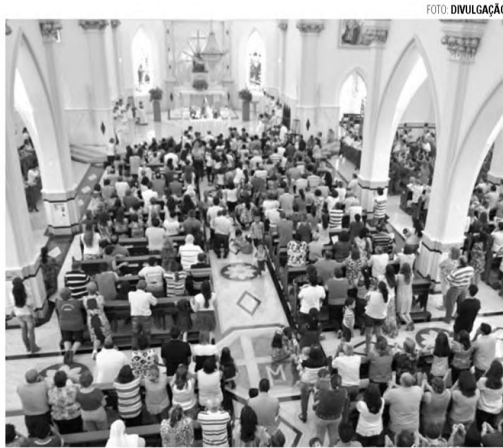
MOMENTOS DE FÉ - Fiéis lotaram o Santuário todos os dias no ano passado

O Cerco de Jericó, evento tradicional na cidade nesse período do ano, é uma celebração religiosa realizada para relembrar a chegada do Povo de Deus da cidade de Israel a Terra Prometida, que se unem durante sete dias em volta das muralhas para conseguir conquistá-la conforme narrado em uma passagem bíblica. Assim, nos dias de hoje, pretende-se com a celebração unir os fiéis em uma caminhada de oração e reflexão.