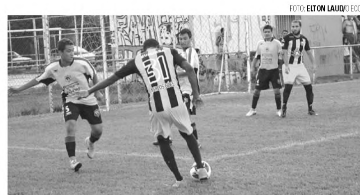
MUITOS GOLS - Segunda rodada termina com média de 5,5 gols por jogo

Pontes venceu Palestra por 5 a 3 no placar