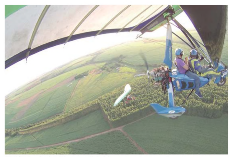
EM ALA - André, Ricardo e Fabrício se aproximaram durante um voo

nomia de até quatro horas de voo. Além disso, as aeronaves são equipadas com rádios comunicadores que sintonizam a frequência utilizada para o controle do espaço aéreo e podem contar com lançadores de fumaça e luzes de Led, que abrilhantam ainda mais o voo.