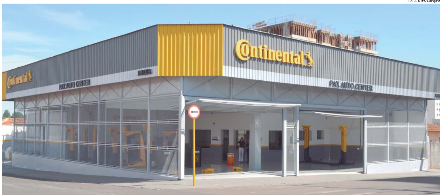
PAX AUTO CENTER - Inaugura sua 9ª loja da Rede em Lençóis Paulista

Inauguração acontece na próxima quarta-feira (1º), com novidades e promoções