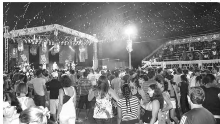
RETORNO - Último carnaval no recinto da Facilpa foi realizado no ano de 2012

Para colorir ainda mais o carnaval, um grupo de professores e alunos do curso de maquiagem da escola Éfac - Formação Profissional da Beleza, que é parceira do evento, vai estar no recinto caracterizando os foliões com maquiagens típicas de carnaval.