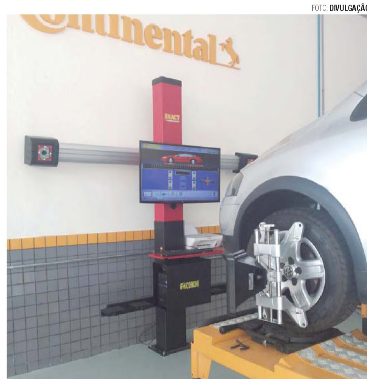
INOVAÇÃO - Exclusivo alinhamento 3D Corgi, maior precisão e eficiência