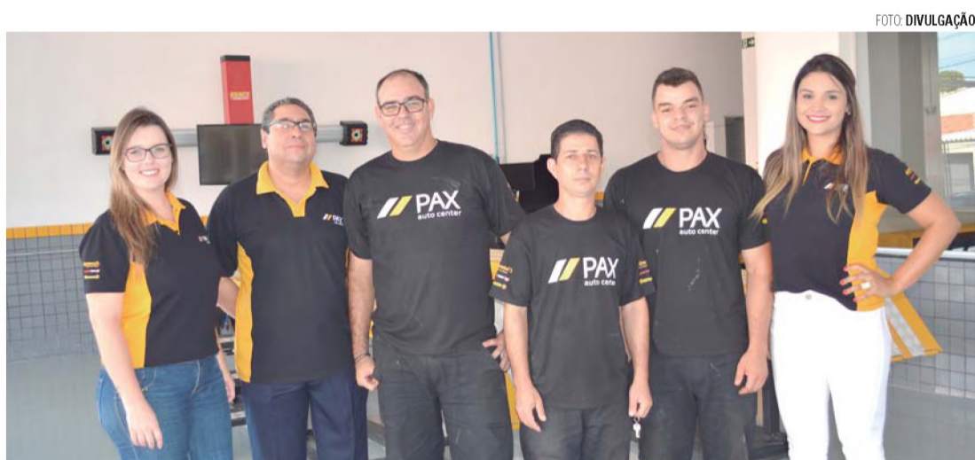
EQUIPE - Loja conta com profissionais capacitados e preparados para dar o melhor atendimento

Rede Pax Auto Center será inaugurada na rua Treze de Maio, 1002, no Centro (esquina com a Nove de Julho). Os telefones para contato são (14) 3264-8989 e (14) 9 9849-0701. Para mais informações sobre os produtos e serviços, acesse o site: www.paxautocenter.com.br.