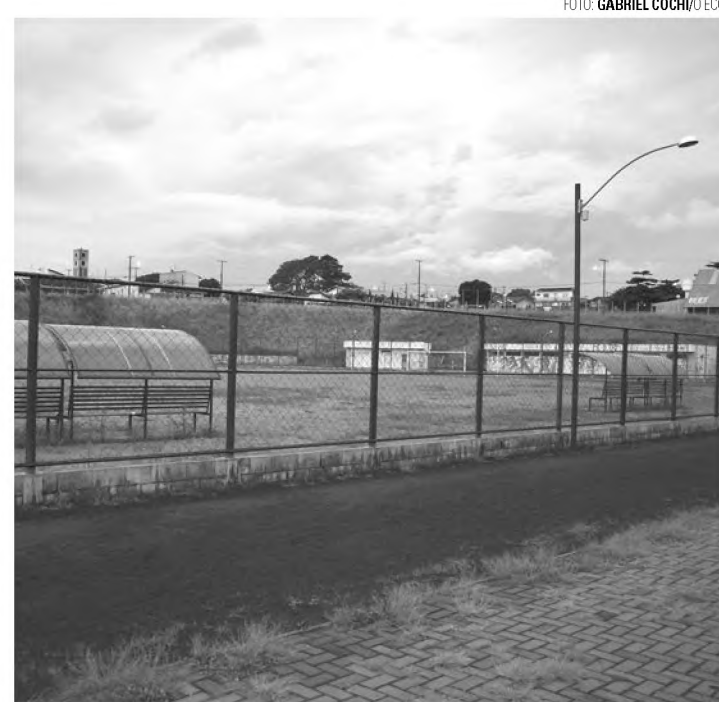
DEPENADO - Vários objetos foram furtados do Estádio João Roberto Vagula (Vagulão)