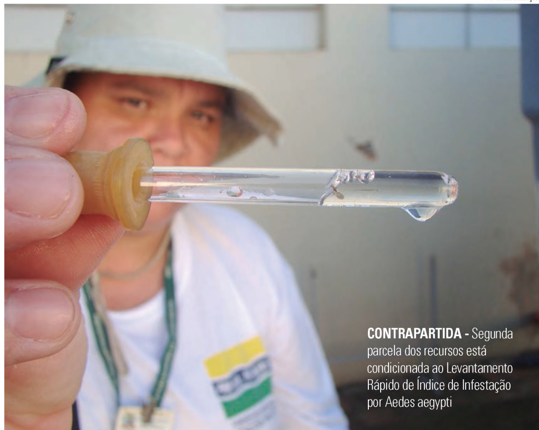
CONTRAPARTIDA - Segunda parcela dos recursos está condicionada ao Levantamento Rápido de Índice de Infestação por Aedes aegypti

Elaborado pelo Ministério da Saúde, em conjunto com estados e municípios, o Levantamento Rápido do Índice de Infestação pelo Aedes aegypti (LIRAA), é considerado um instrumento fundamental para orientar as ações de controle da dengue, o que possibilita aos gestores locais de saúde anteciparem as ações de prevenção. O último LIRAA, divulgado pelo Ministério da Saúde, em novembro deste ano, apontou que 855 cidades encontram-se em situação de alerta e risco de surto de dengue, zika e chikungunya. Isso repre-