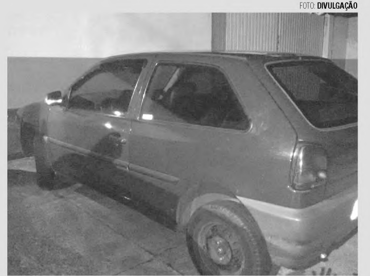
RECUPERADO - Gol furtado no Jardim Cruzeiro foi localizado pela equipe da Força Tática

Um Gol furtado no Jardim Cruzeiro foi localizado pela equipe da Força Tática no iní-