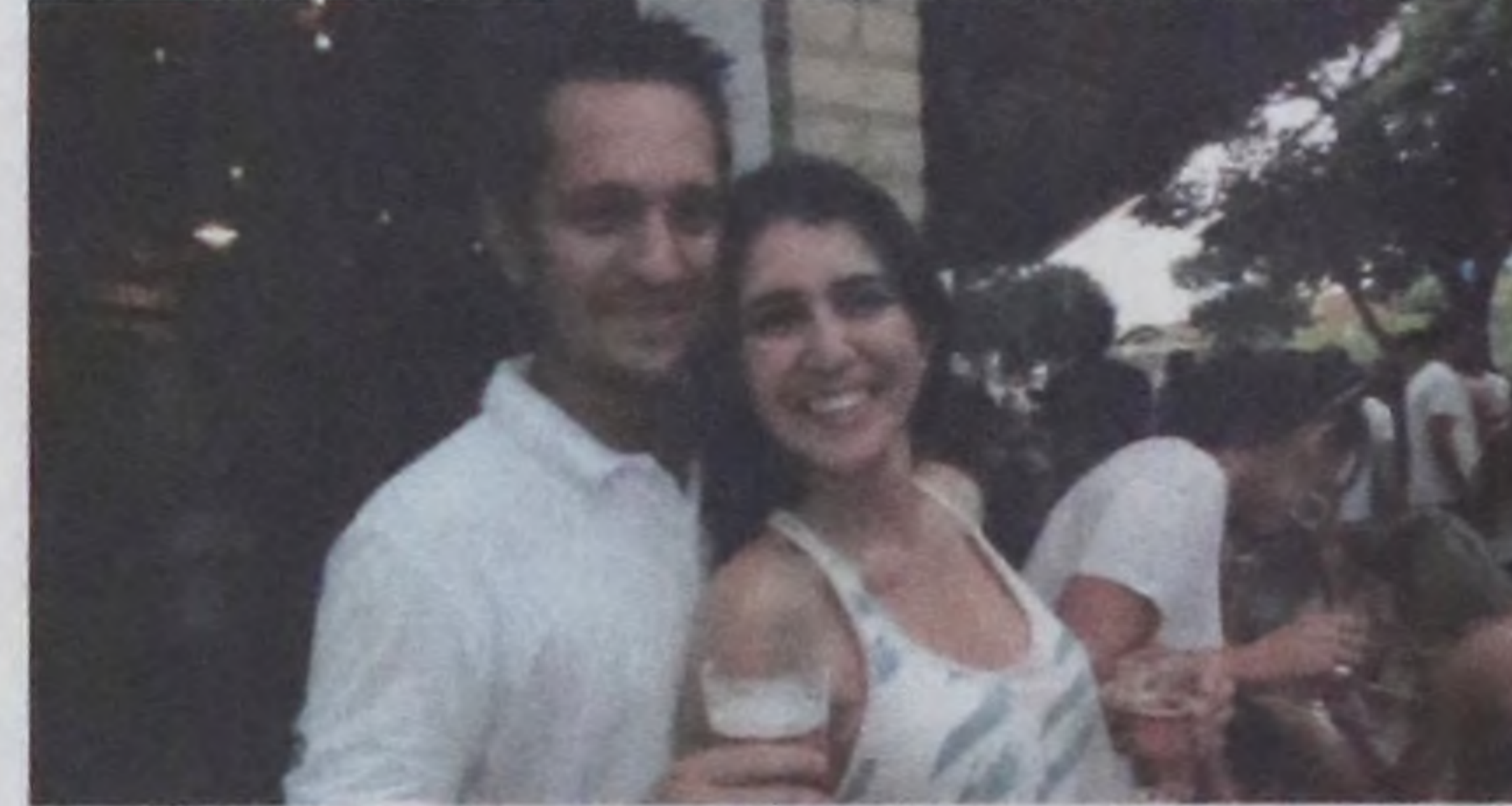
Edson Correia/Notícias de Lençóis