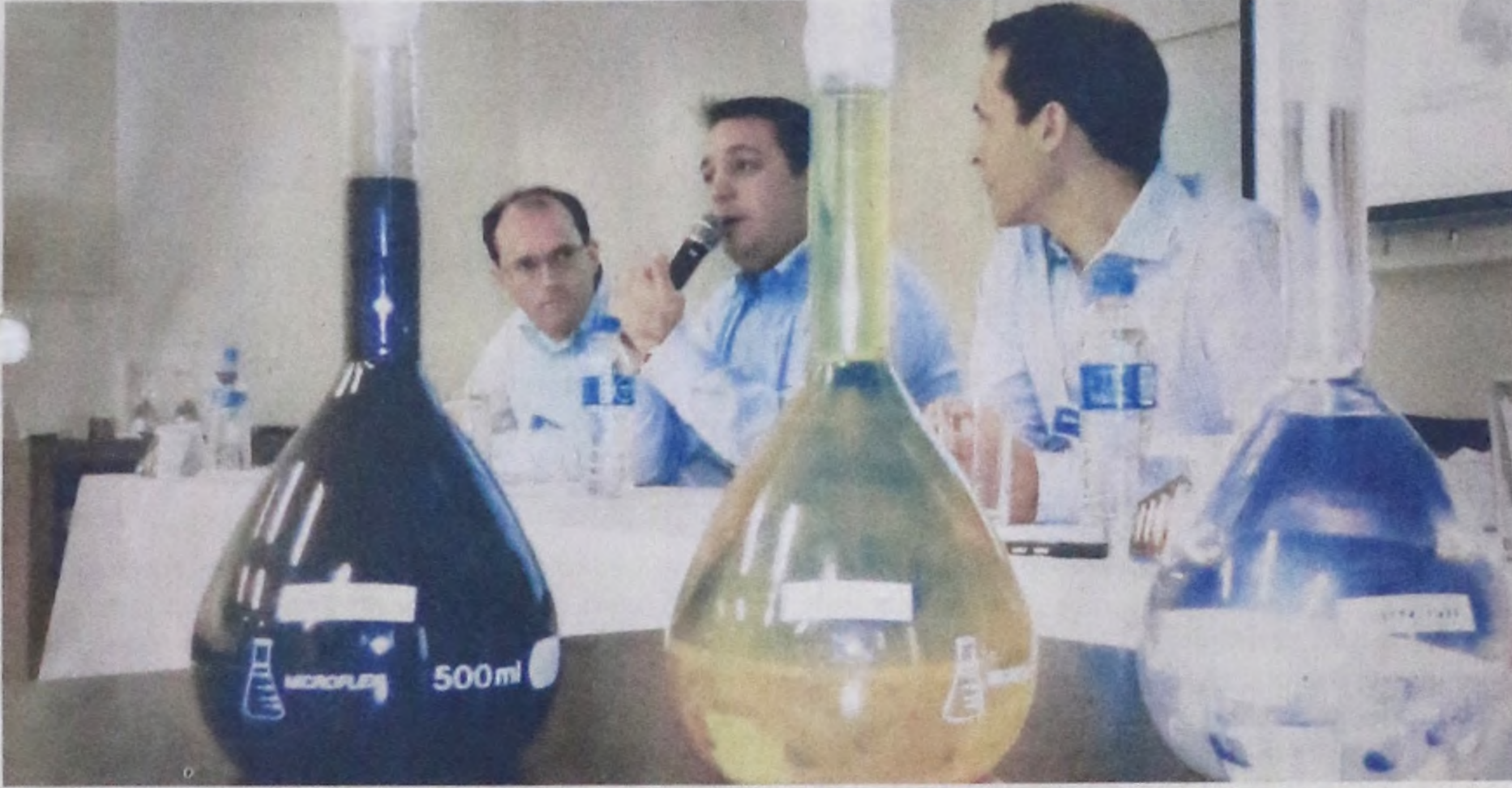
Durante a coletiva de imprensa oferecida a jornalistas da região, foi apresentado o novo óleo produzido pela Lwart Lubrificantes (à direita)

Na última quarta-feira, 5 de novembro, representantes do Grupo Lwart deram uma entrevista coletiva na sede da empresa, em Lençóis Paulista, para anunciar o lançamento da nova linha de produção da Lwart Lubrificantes, que será responsável por colocar o grupo em uma posição de destaque no mercado internacional, com o processamento do óleo mineral básico tipo II, utilizado na