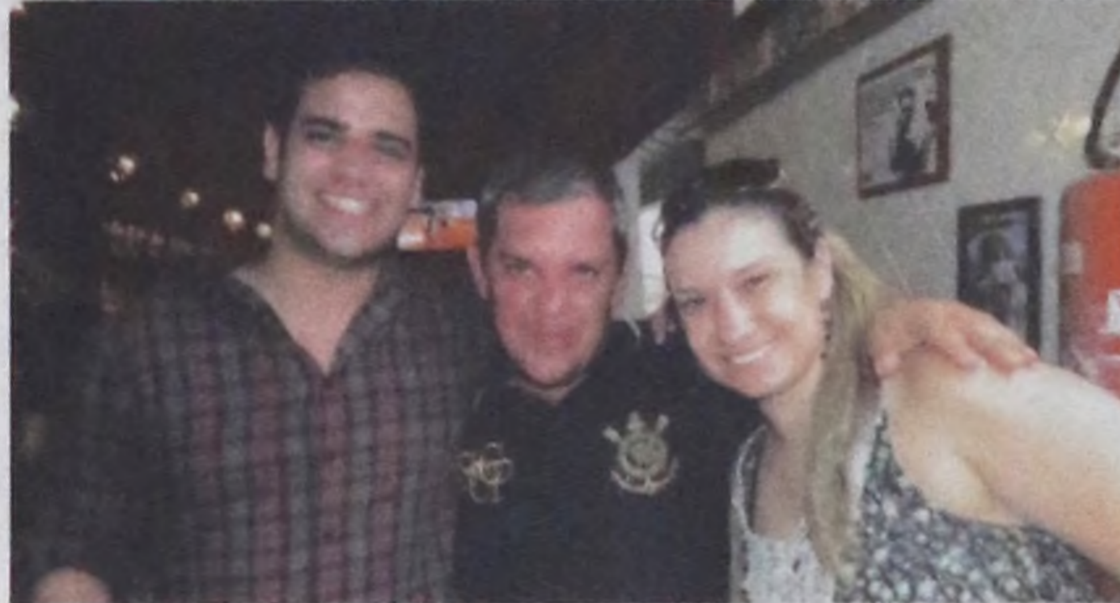
Edson Correia/Notícias de Lençóis