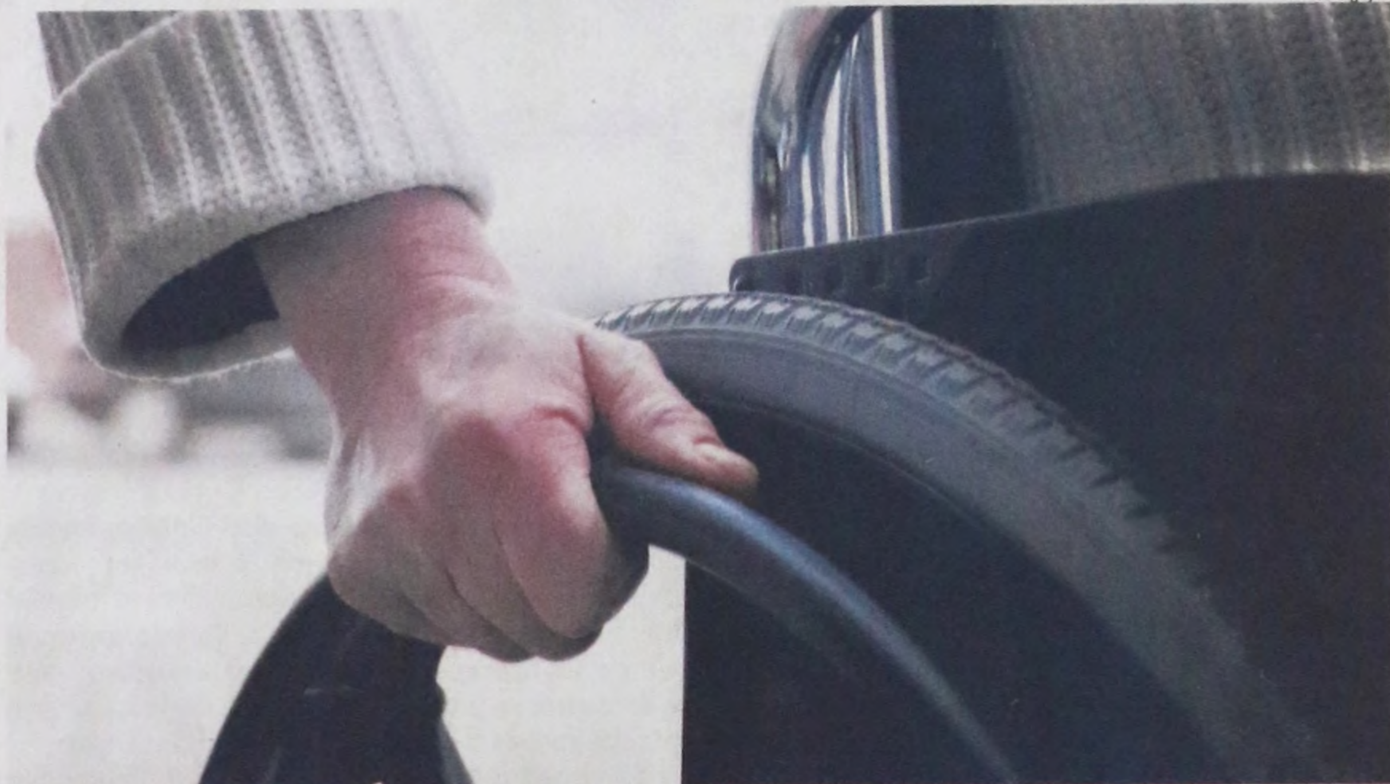
A Unidade de Negócios Florestal que abriga o viveiro de mudas da Duratex conta com a inclusão de 24 funcionários PCDs

Sediada na cidade de São Paulo e empregando cerca de 10,5 mil colaboradores, a Duratex possui unidades industriais espalhadas por estados como São Paulo, Rio Grande do Sul, Minas Gerais, Pernambuco, Paraíba e Rio de Janeiro. Referência na produção de painéis de madeira industrializada, louças e metais sanitários, a empresa já se consolidou como líder no mercado nacional. Mas é através de uma iniciativa em particular que ela busca deixar sua verdadeira marca.