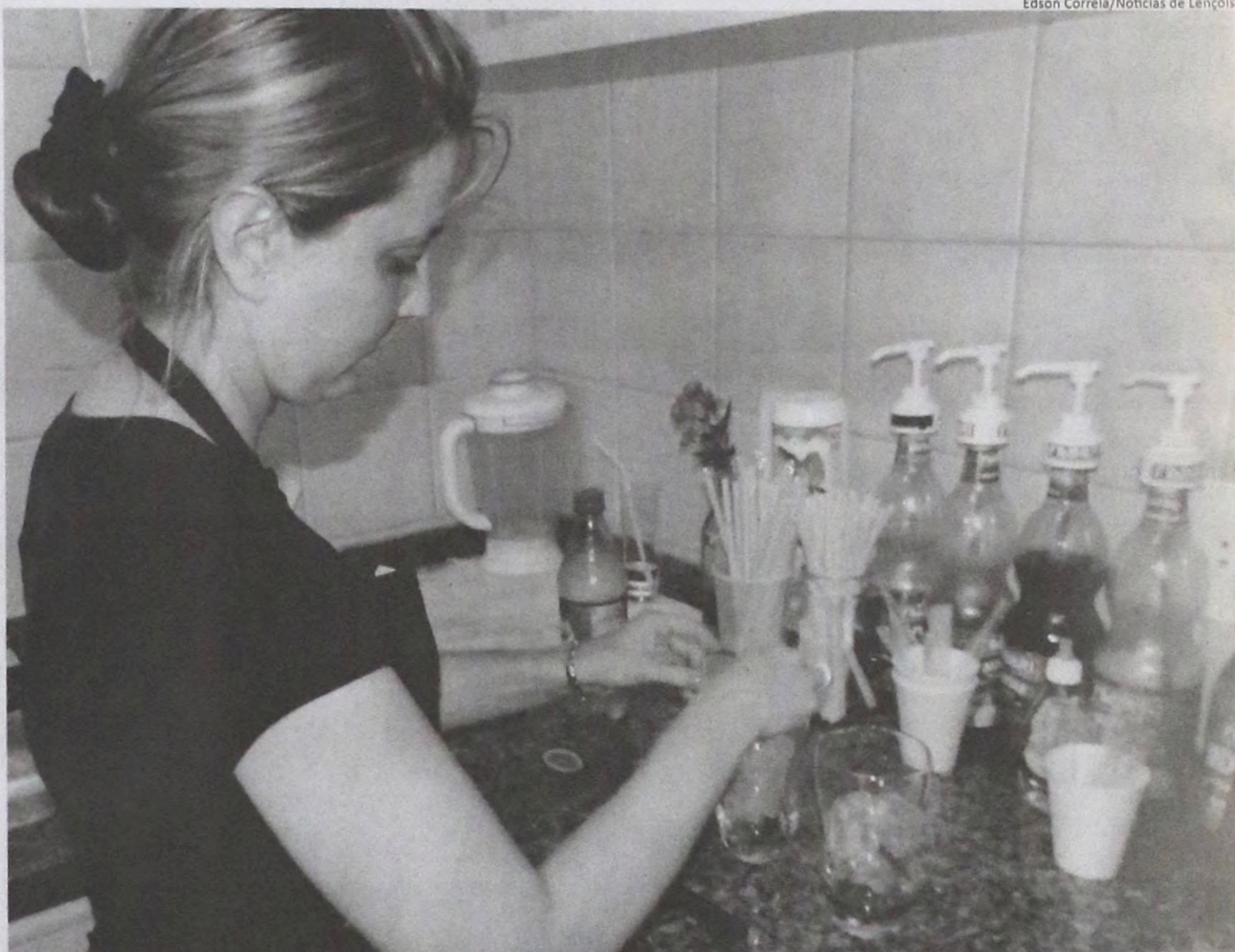
A soda italiana e os lanches naturais são alguns dos principais atrativos da cafeteria Dolce Aroma

Trabalhando ao lado de suas três funcionárias, a proprietária da Dolce Aroma não esconde a satisfação em ver o projeto prosperando, mesmo que algumas vezes certos obstáculos pareçam intransponíveis. As lições aprendidas com eles, no entanto, são o que movem a empresária. "A maior dificuldade que enfrentei nesses seis anos foi o medo, principalmente quando a cidade recebeu, recentemente, a franquia de uma grande rede de cafeterias. Mas, conforme o tempo foi passando, vi que minha