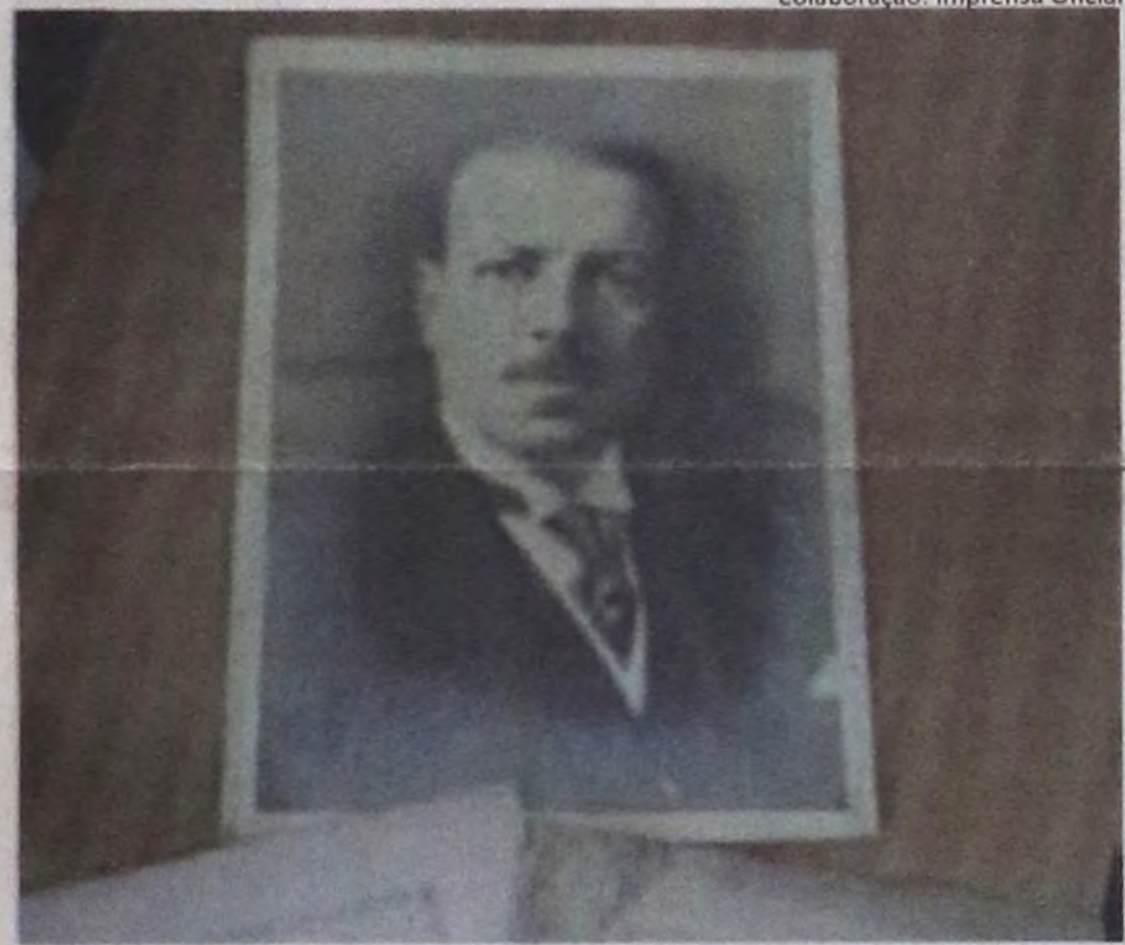
Colaboração: Imprensa Oficial

Depois da limpeza pesada, três pessoas se dedicaram a restaurar os processos. Foram nove meses de trabalho envolvendo cerca de 10 mil documentos sujos, mofados e empoeirados. Em uma primeira etapa estão sendo resgatados os documentos até 1940. Na outra, serão separados por ano e data. O futuro de todo esse trabalho será a digitalização dos documentos e arquivos na Casa Civil do Governo para onde todos os documentos serão transferidos quando o processo for finalizado.