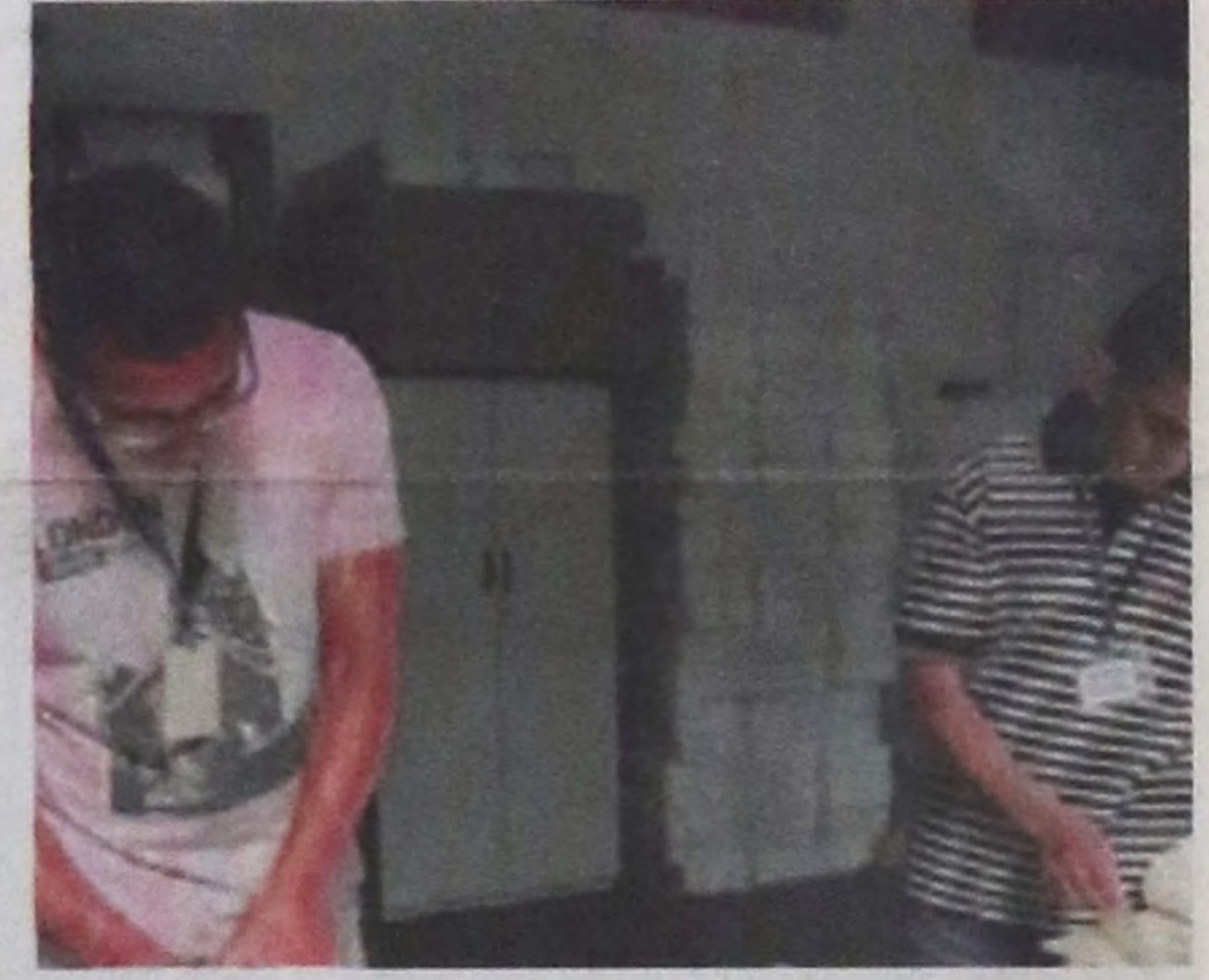
Colaboração: Imprensa Oficial