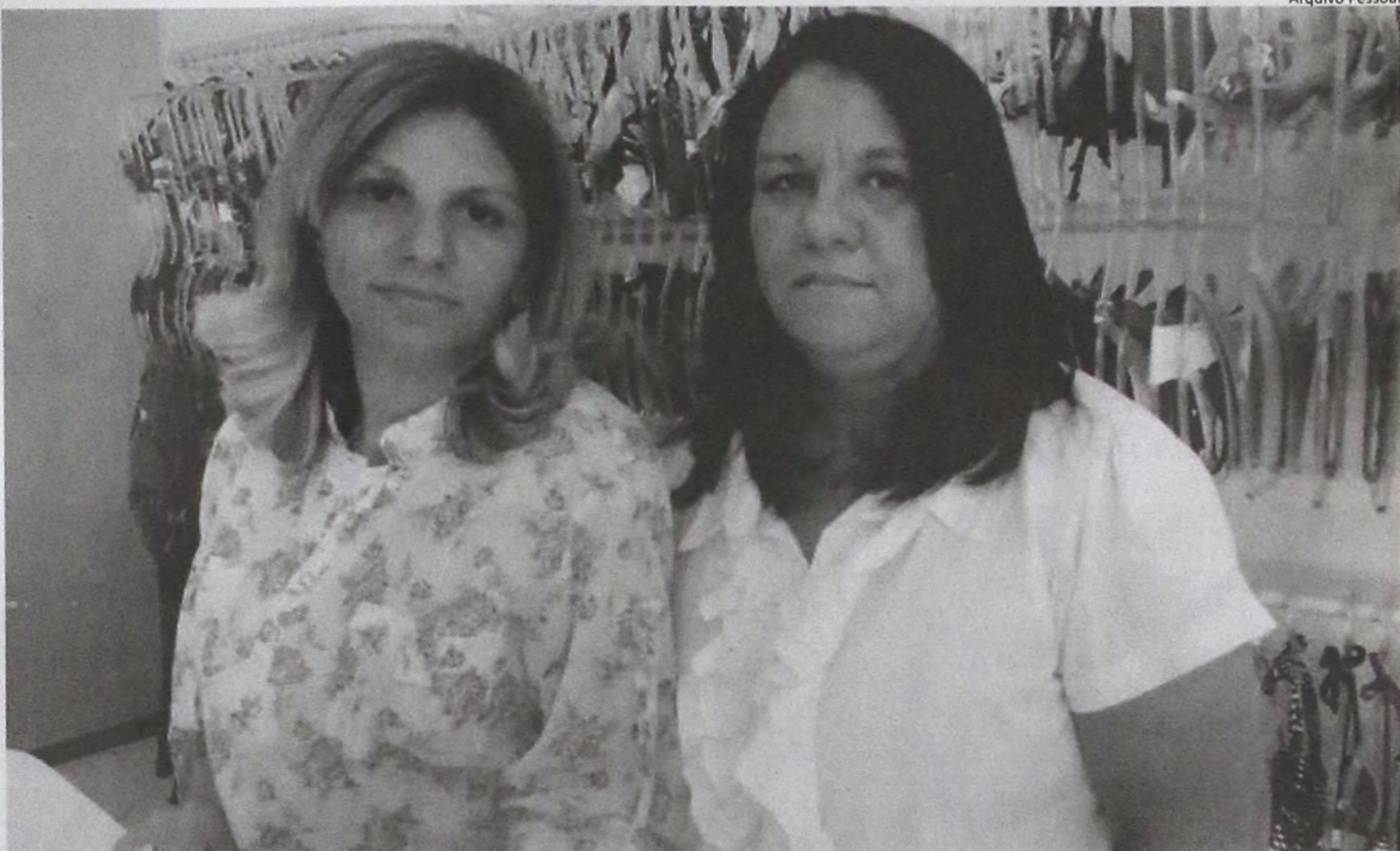
As irmãs estão a frente da Ousadia há mais de vinte anos

Alternativa diante de lojas tradicionais que não conseguem oferecer aos clientes produtos com tamanhos e modelos condizentes com as exigências de cada um, a loja carrega como marca registrada a confecção de peças sob medida. Diferencial que também leva seu nome para fora de Lençóis Paulista. "Antiga-