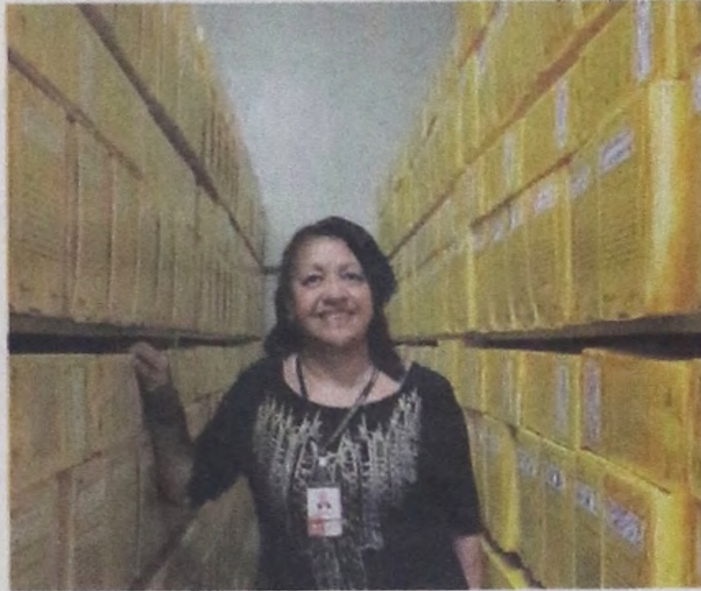
Colaboração: Imprensa Oficial

Consegue ressocializar e reinserir homens que cumprem pena em regime semiaberto no presídio