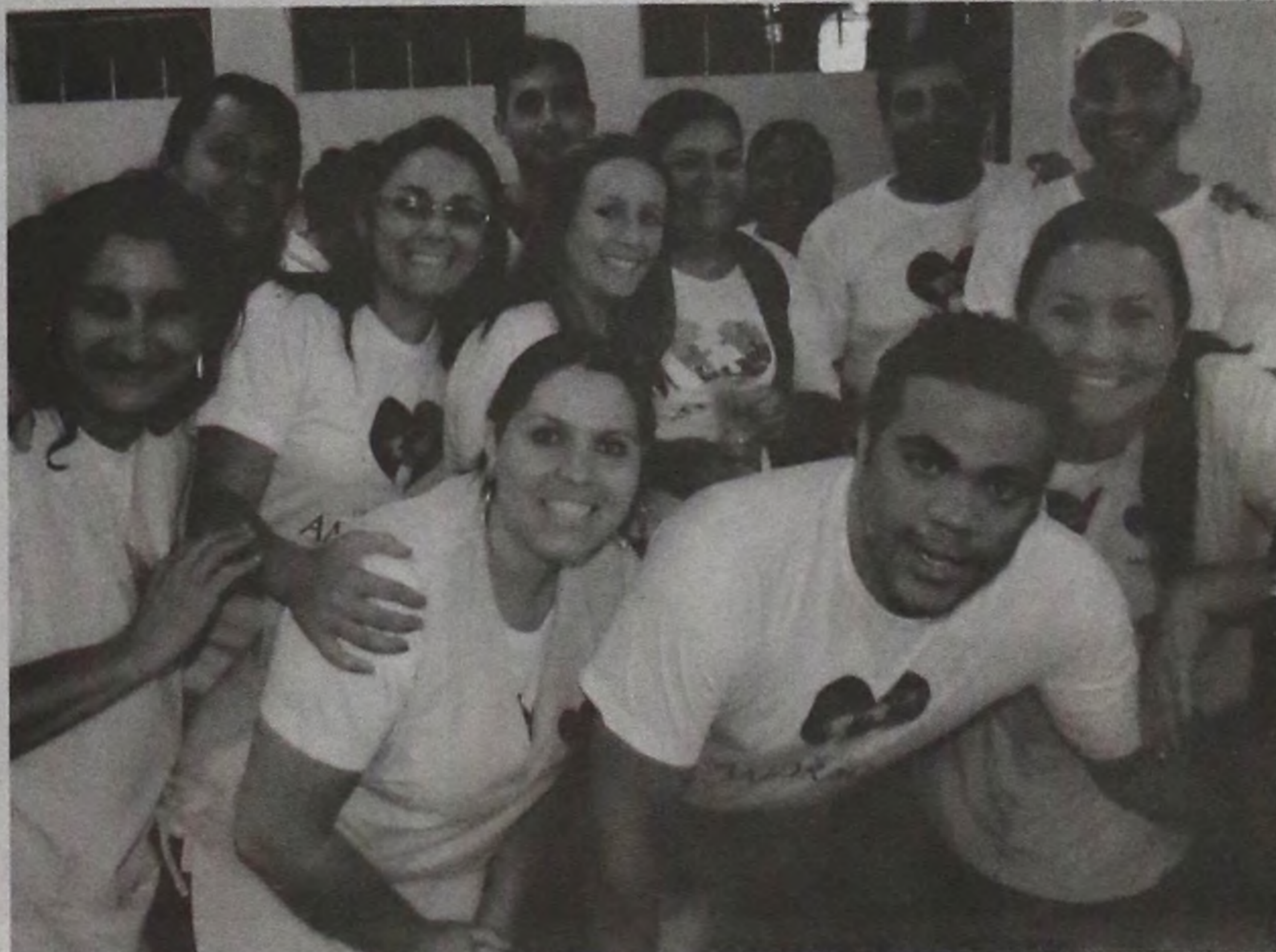
Equipe de voluntários e funcionários da Casa Abrigo Amorada