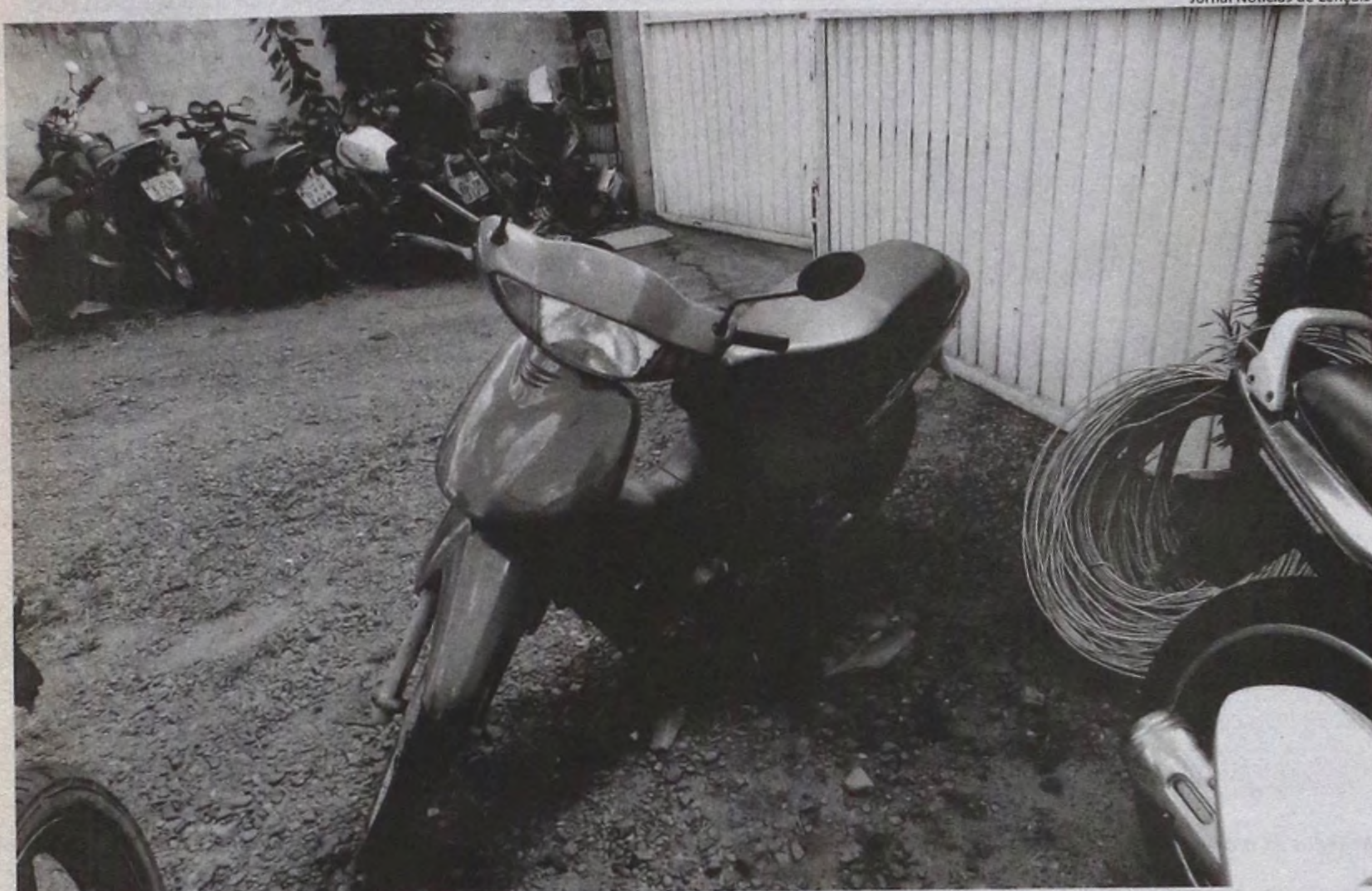
Honda Biz sem placa era utilizada pelo adolescente para comercialização de drogas

Em menos de três horas, dois adolescentes são surpreendidos comercializando entorpecentes