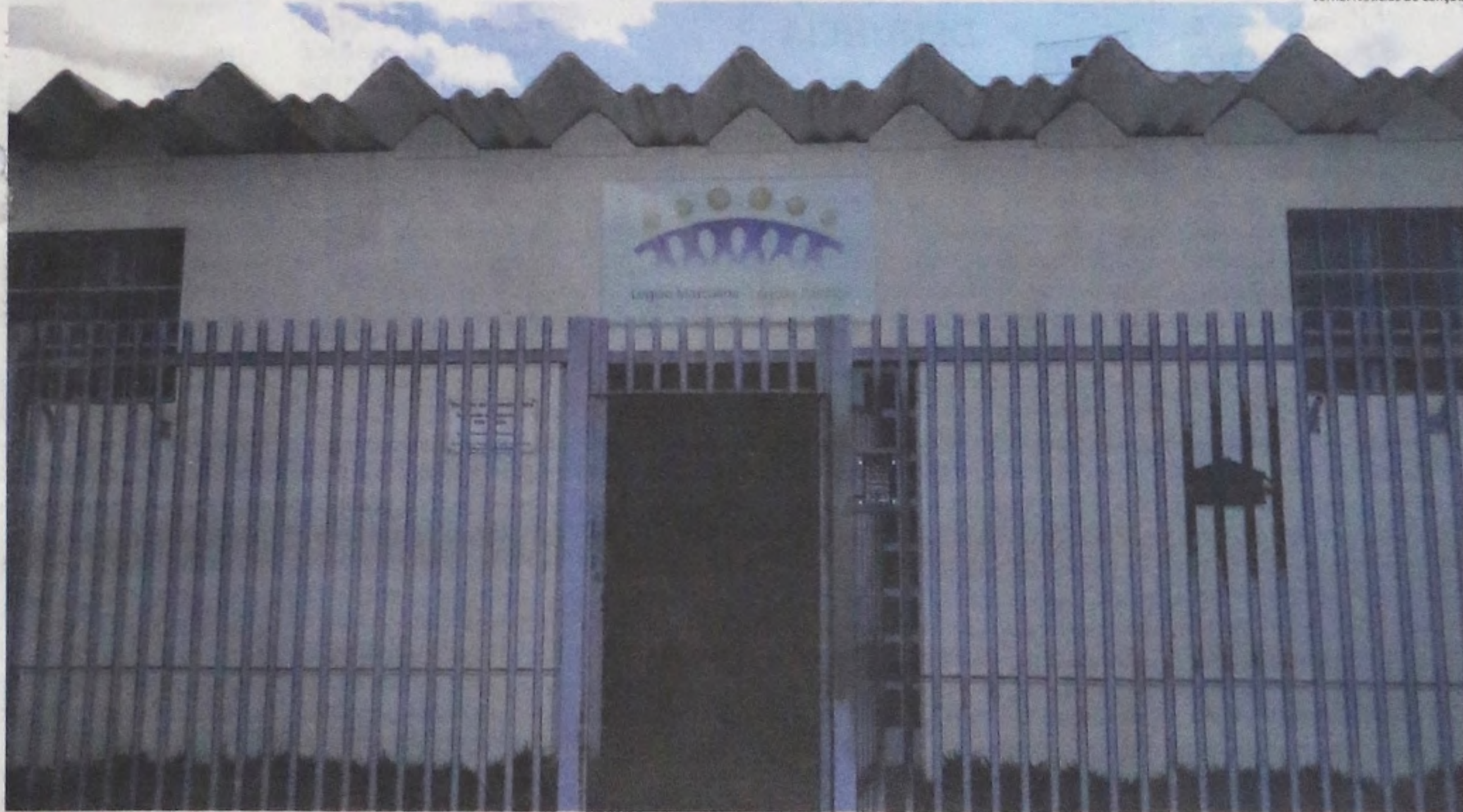
A Legião Mirim de Lençóis Paulista foi fundada no dia 21 de outubro de 1970, e já formaram, aproximadamente, quatro mil jovens

O Rotary Club, mantenedor da Legião Mirim, está promovendo o Show de Prêmios em prol da entidade. O evento acontece hoje às 20h no Rotary Club e adesão de R$ 10,00.