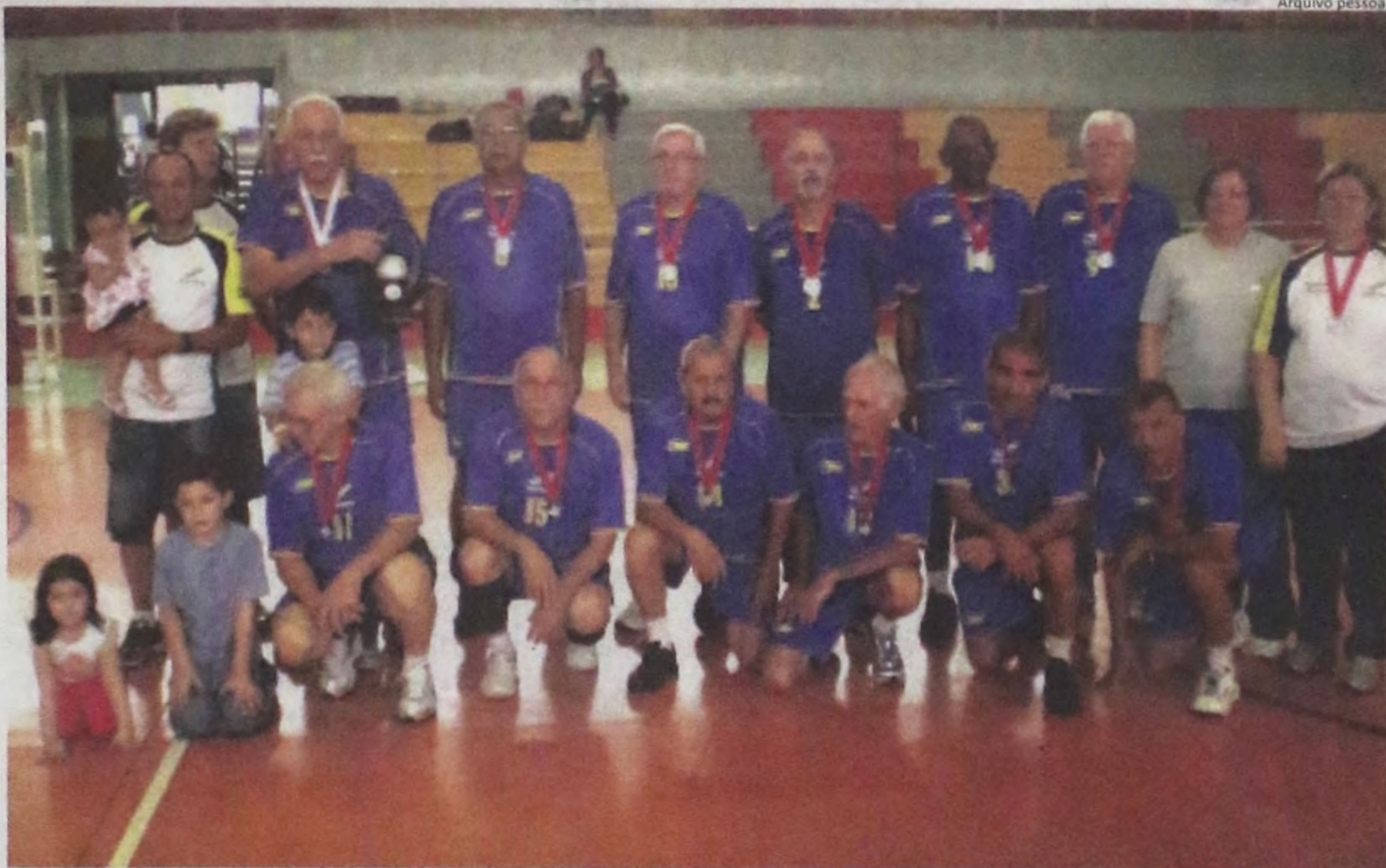
Equipe de Lençóis Paulista conquistou a segunda colocação

Na quarta-feira (16), dois adolescentes foram surpreendidos comercializando entorpecentes com uma diferença quase duas horas, na Vila Contente. Um rapaz de apenas 13 anos no cruzamento das Ruas Martin Afonso e Cristovão Colombo. E o outro, também de menor, na Rua São Pedro. Ele utilizava uma Honda biz vermelha, furtada na semana passada em Bauru, para realizar a venda da droga. O jovem tem mais de 30 ocorrências por tráfico, com ele já foram apreendidos, aproximadamente, R$ 2000,00 em espécie em todas as atuações. Página 4