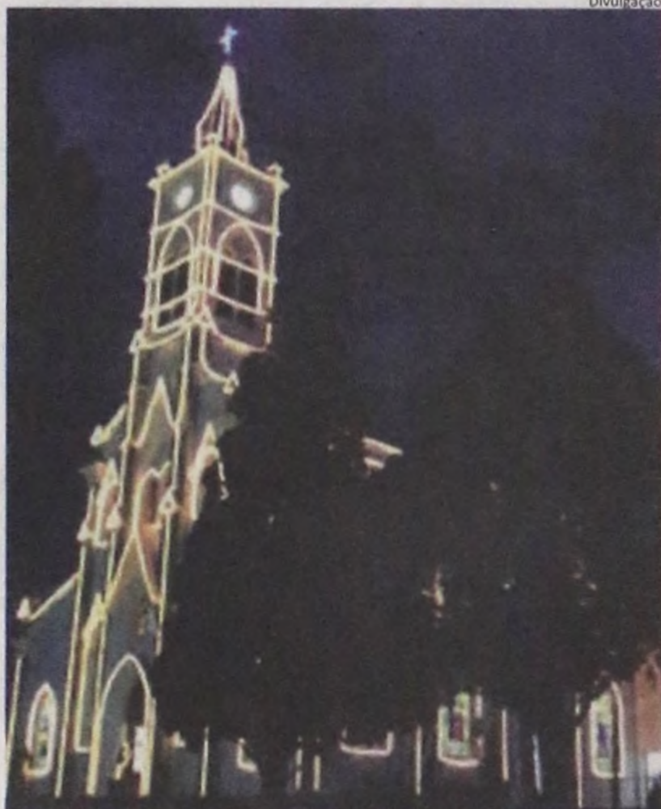
O Natal está chegando e a cidade já começa a ficar iluminada