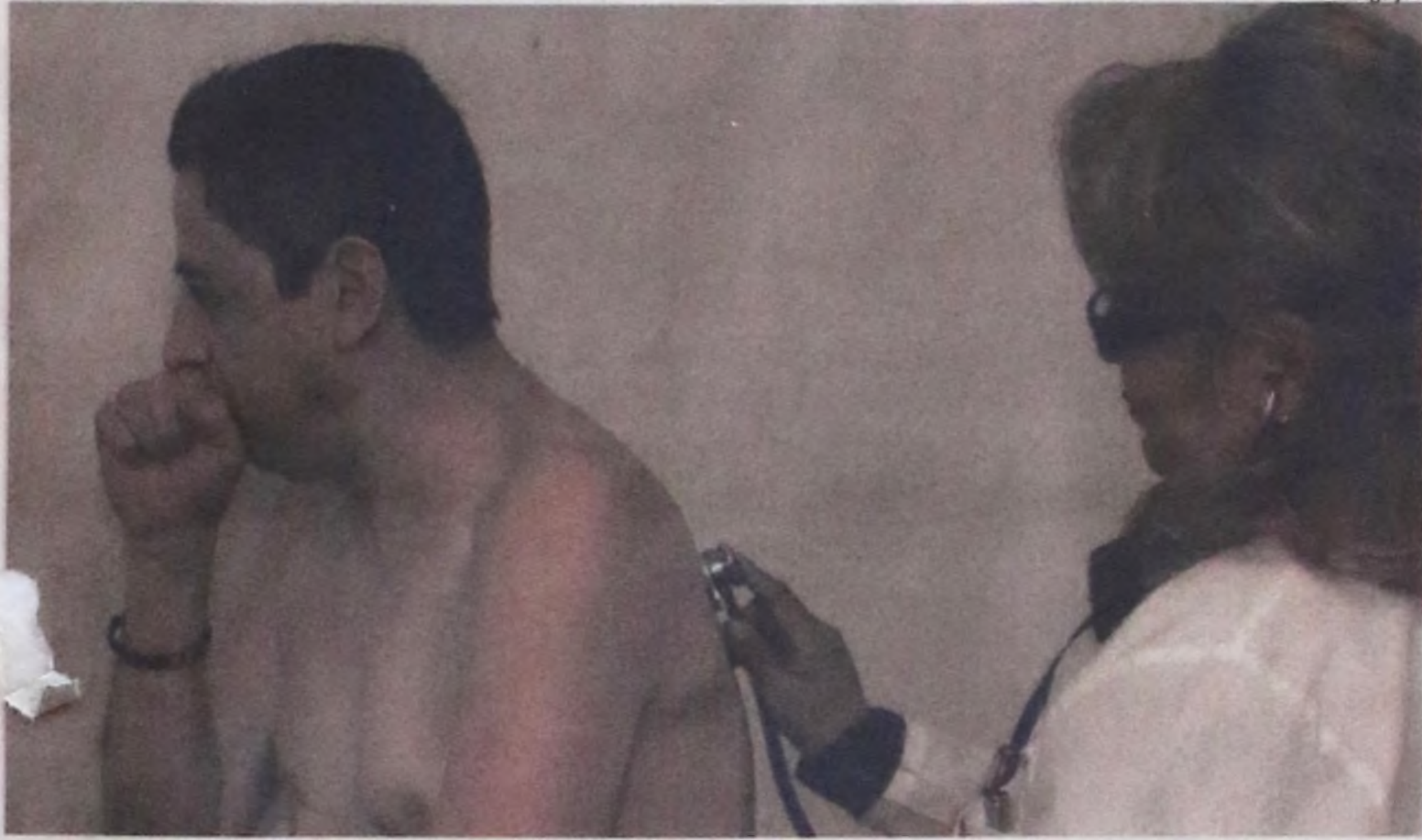
Tosse com expectoração de catarro por mais de duas semanas, pode ser tuberculose

Entre os dias 5 e 22 de novembro, as Unidades de Saúde do município de Lençóis Paulista darão início à campanha para detecção de casos de tuberculose na cidade. A iniciativa vai de encontro às dificuldades que a população ainda possui para diferenciar simples casos de gripe de um quadro mais grave acarretado pela doença.