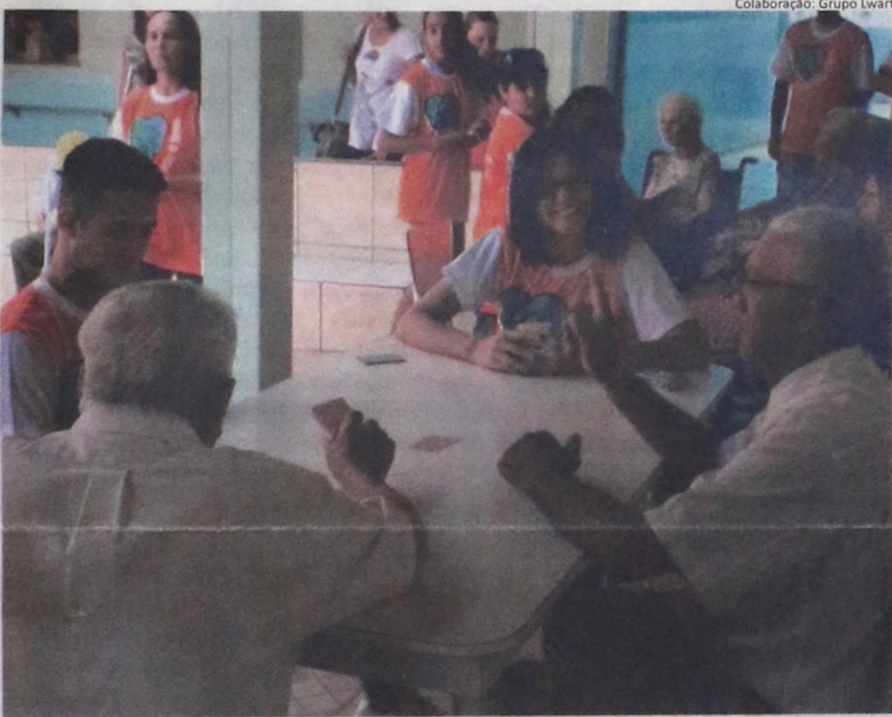
Colaboração: Grupo Lwart

Neste ano, Lençóis Paulista já registrou 17 casos da doença.