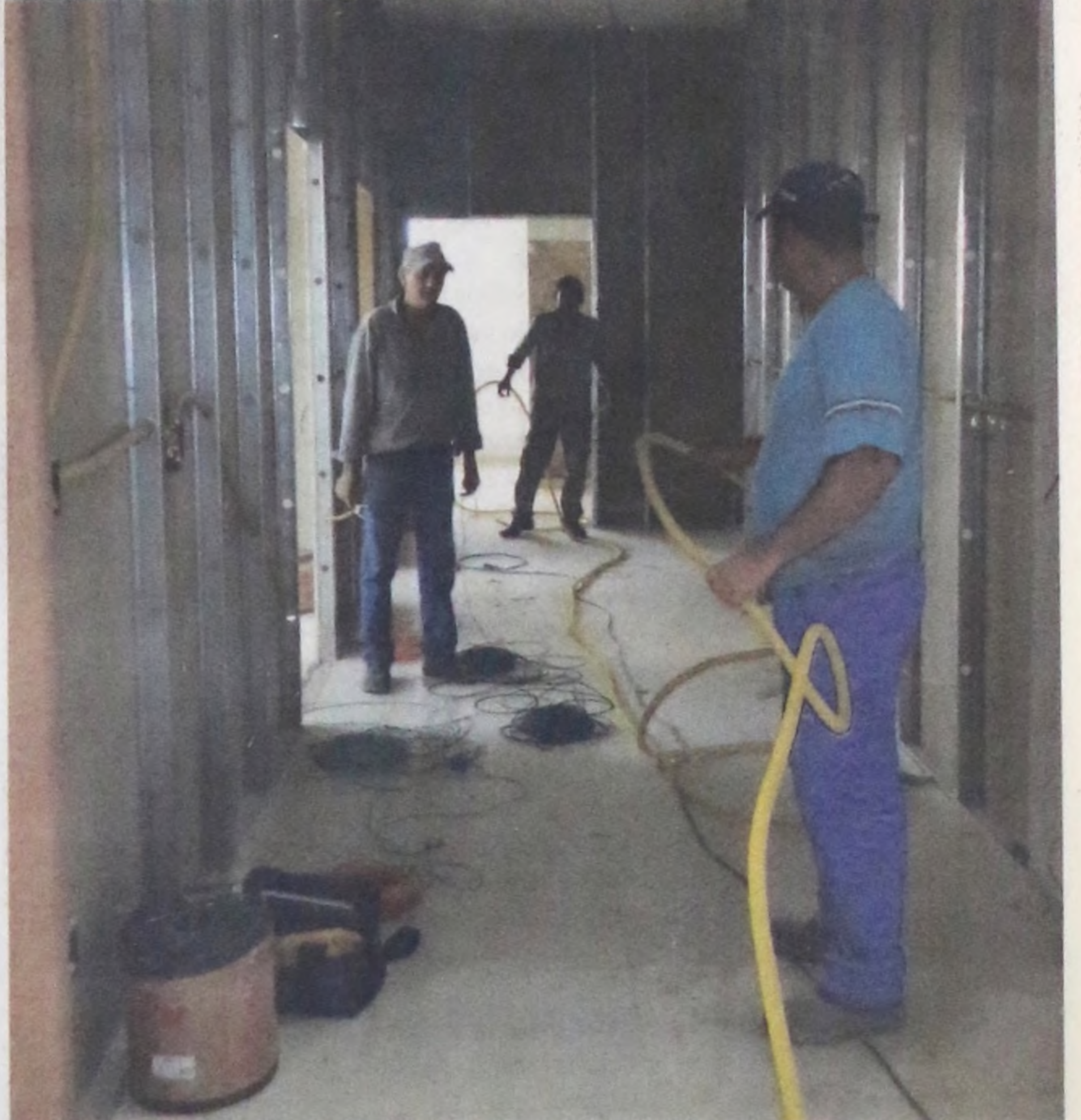
A execução das obras encontra-se em fase de pintura e acabamento

Após sua conclusão, a UPA possuirá uma área construída de 1.007,26 metros quadrados.