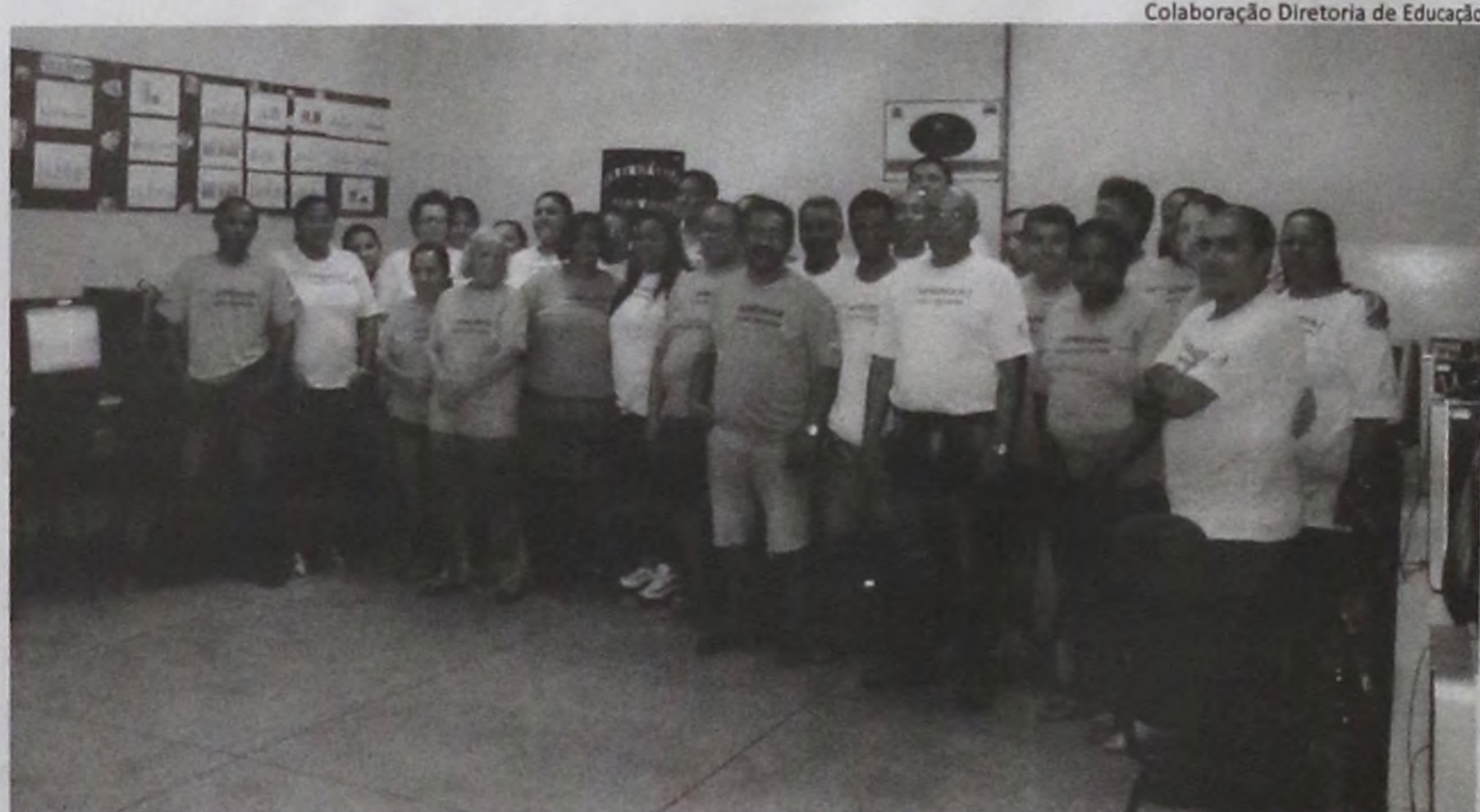
A maioria dos 70 alunos do curso, nunca se quer ligaram um computador