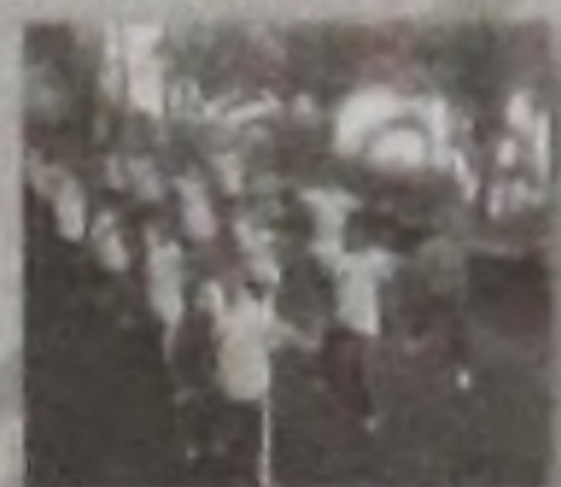
Lian Gong em 18 Terapias

Técnico em Reabilitação, Bacharel em Psicologia, Acupunturista, Especializado em Medicina Tradicional Chinesa