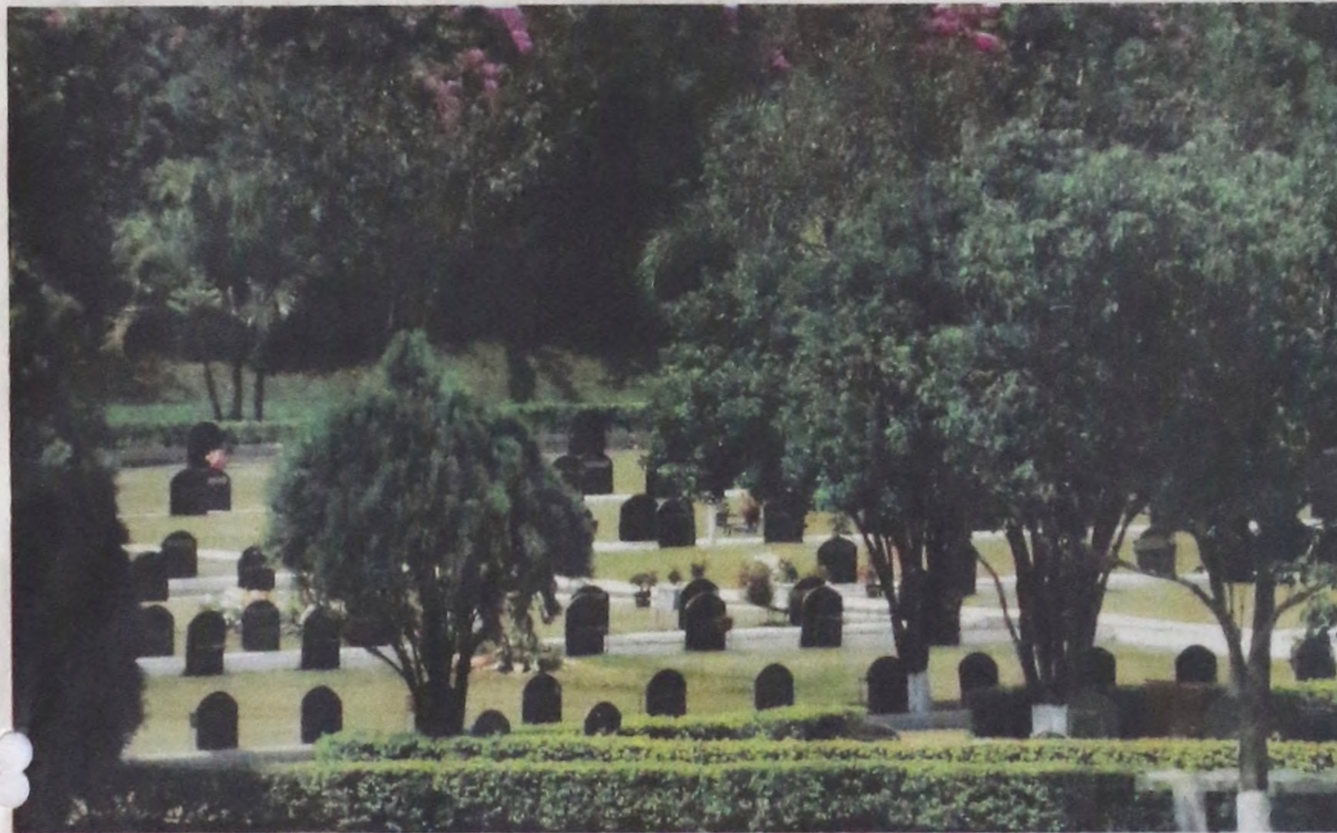
No feriado de finados o Cemitério Paraíso da Colina estará aberto das 7h às 19h