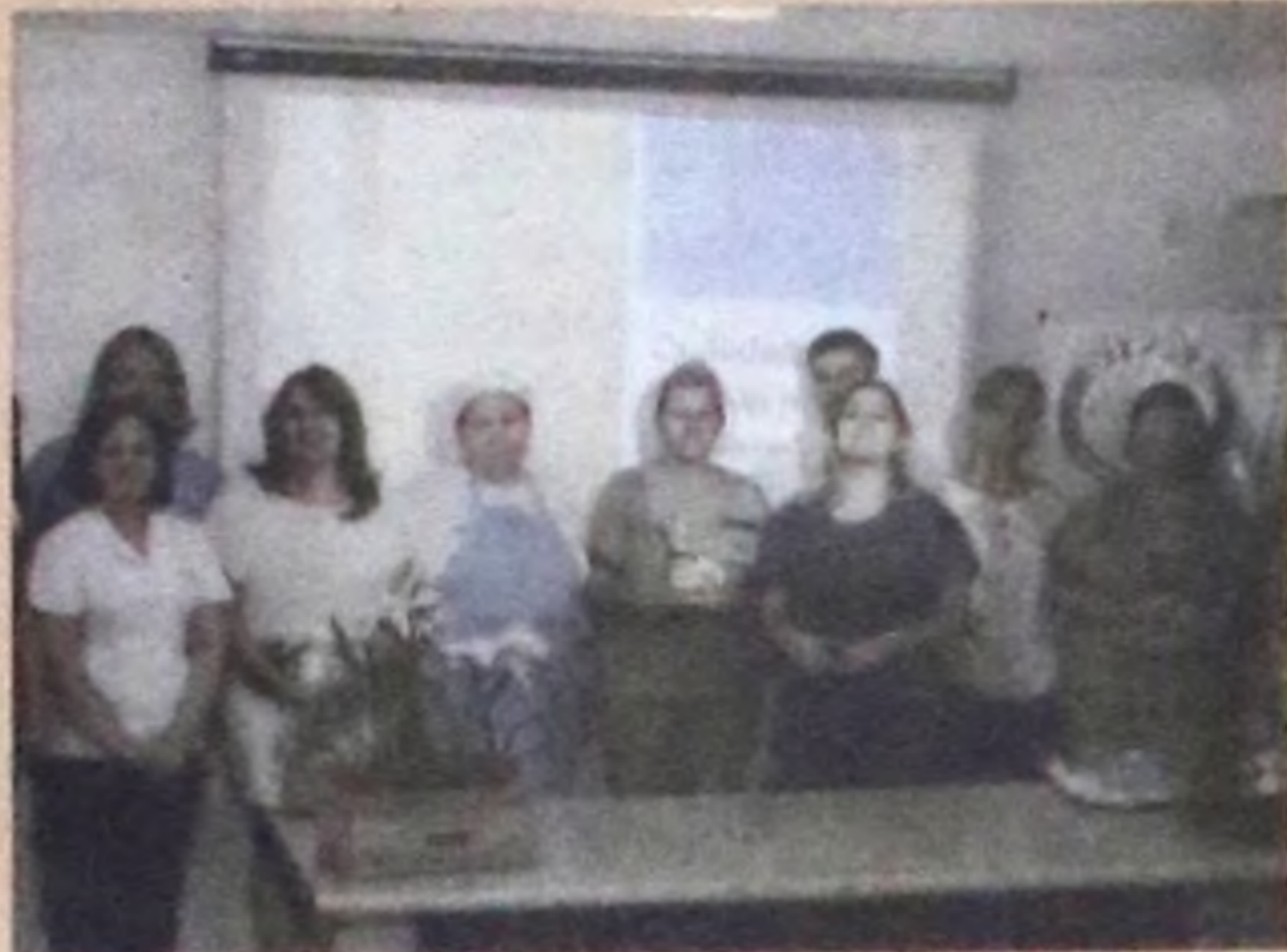
Palestrante e colaboradores do Hospital Nossa Senhora da Piedade