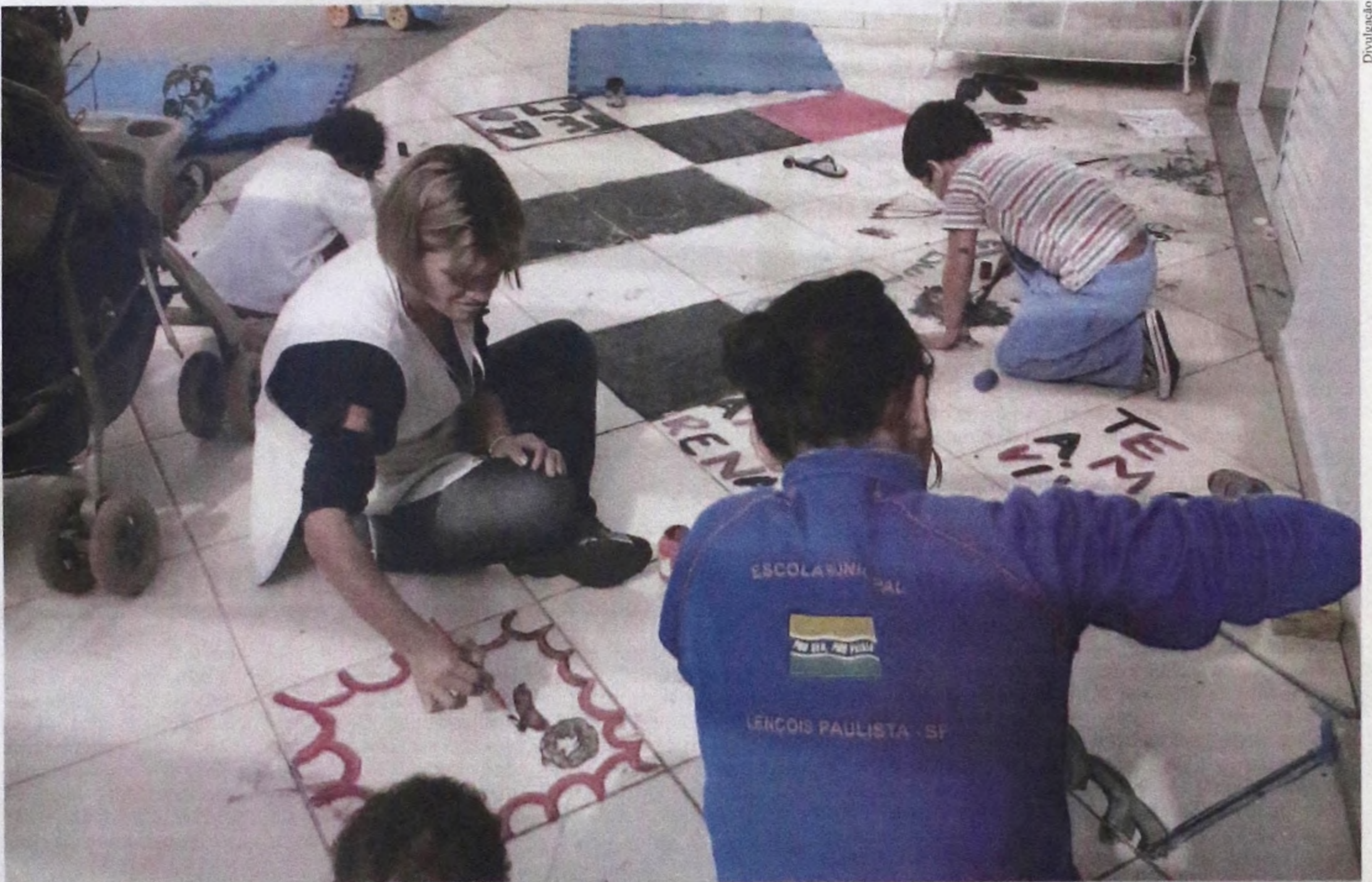
Crianças da Casa Abrigo Amorada participam de atividades recreativas e se divertem utilizando da imaginação e criatividade