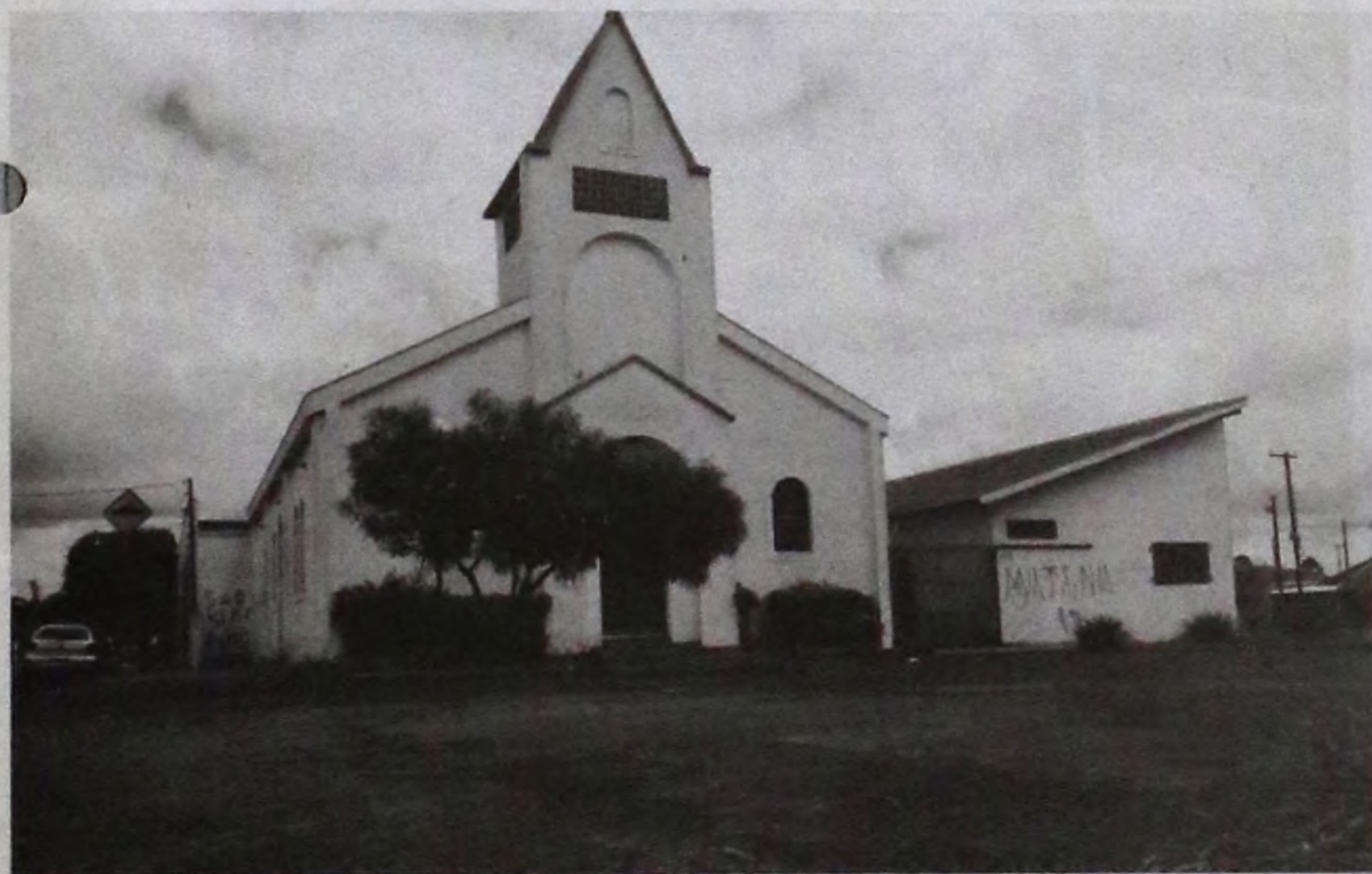
Estacionamento sem estrutura gera transtornos a fiéis da Igreja Mãe Rainha