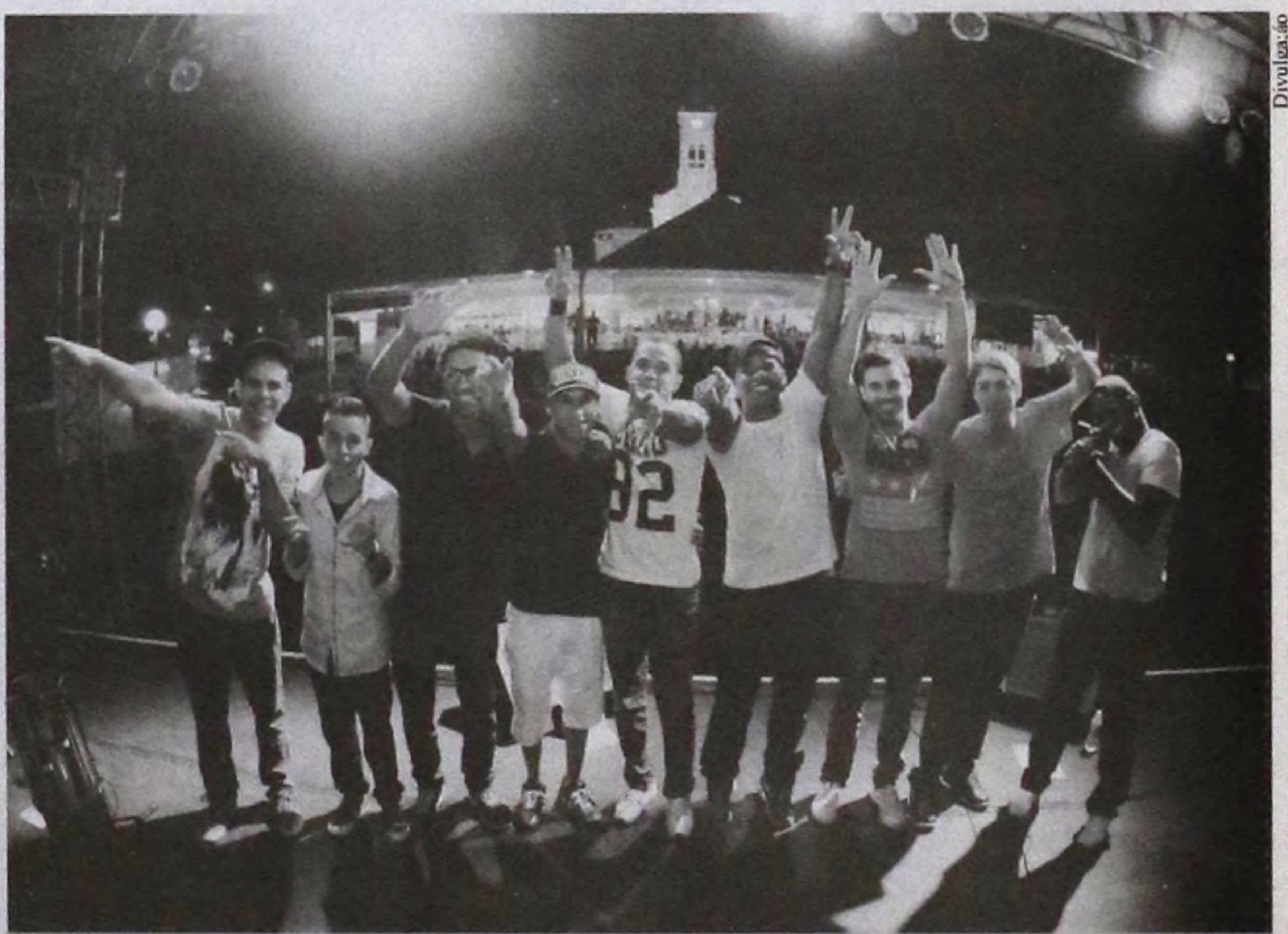
Galera do Toke Novo em show realizado na tradicional festa da padroeira

Com dedicação e trabalho, músicos de Lençóis apresentam repertório variado em apresentações pela região