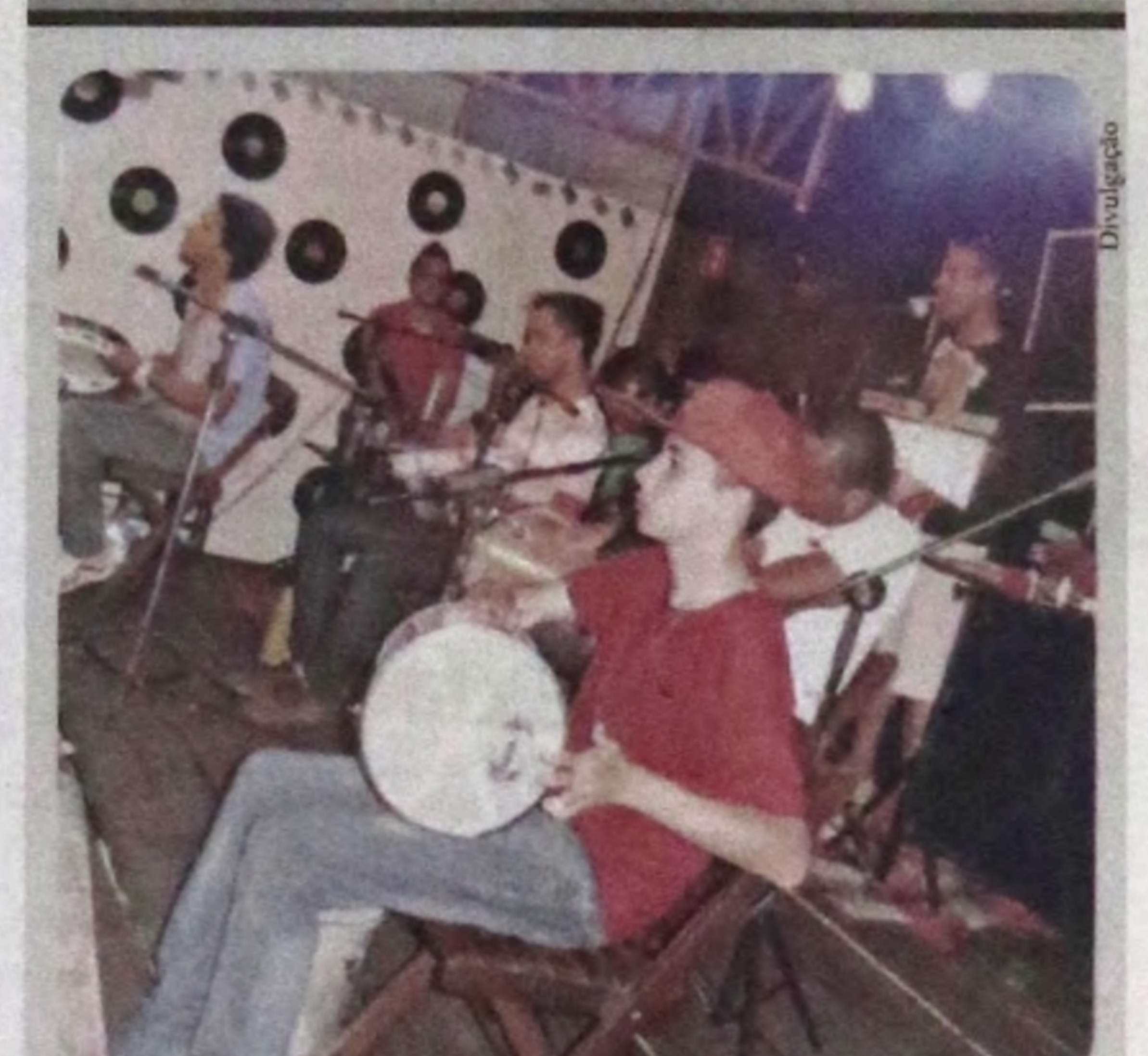
Músicos lençoenses agitam o público com muito samba e pagode