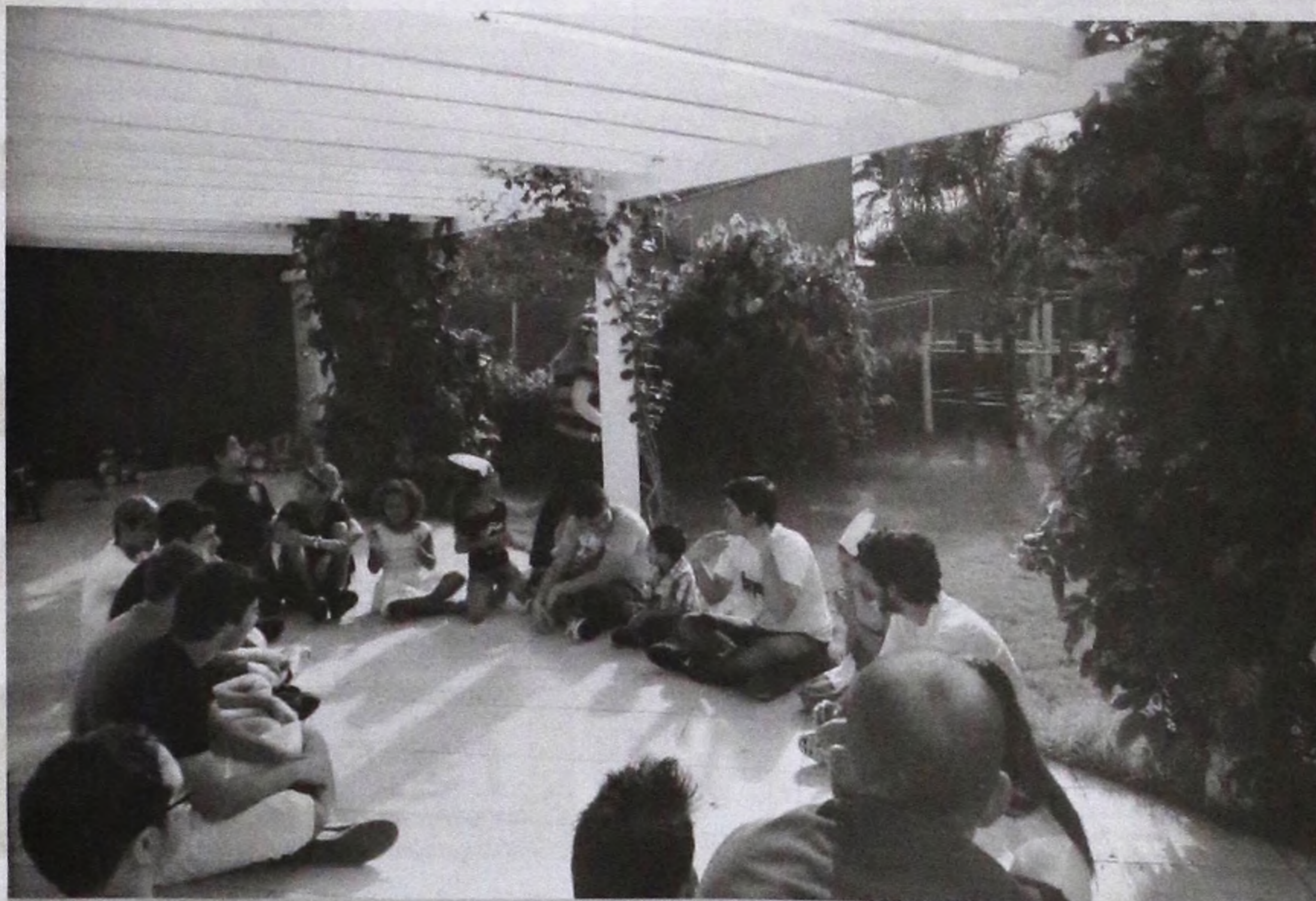
Abrigo oferece um ambiente agradável para as crianças que são acolhidas, com área de lazer e amplo espaço

Abrigo da cidade em parceria com o Conselho Tutelar trabalha com responsabilidade social a favor da família