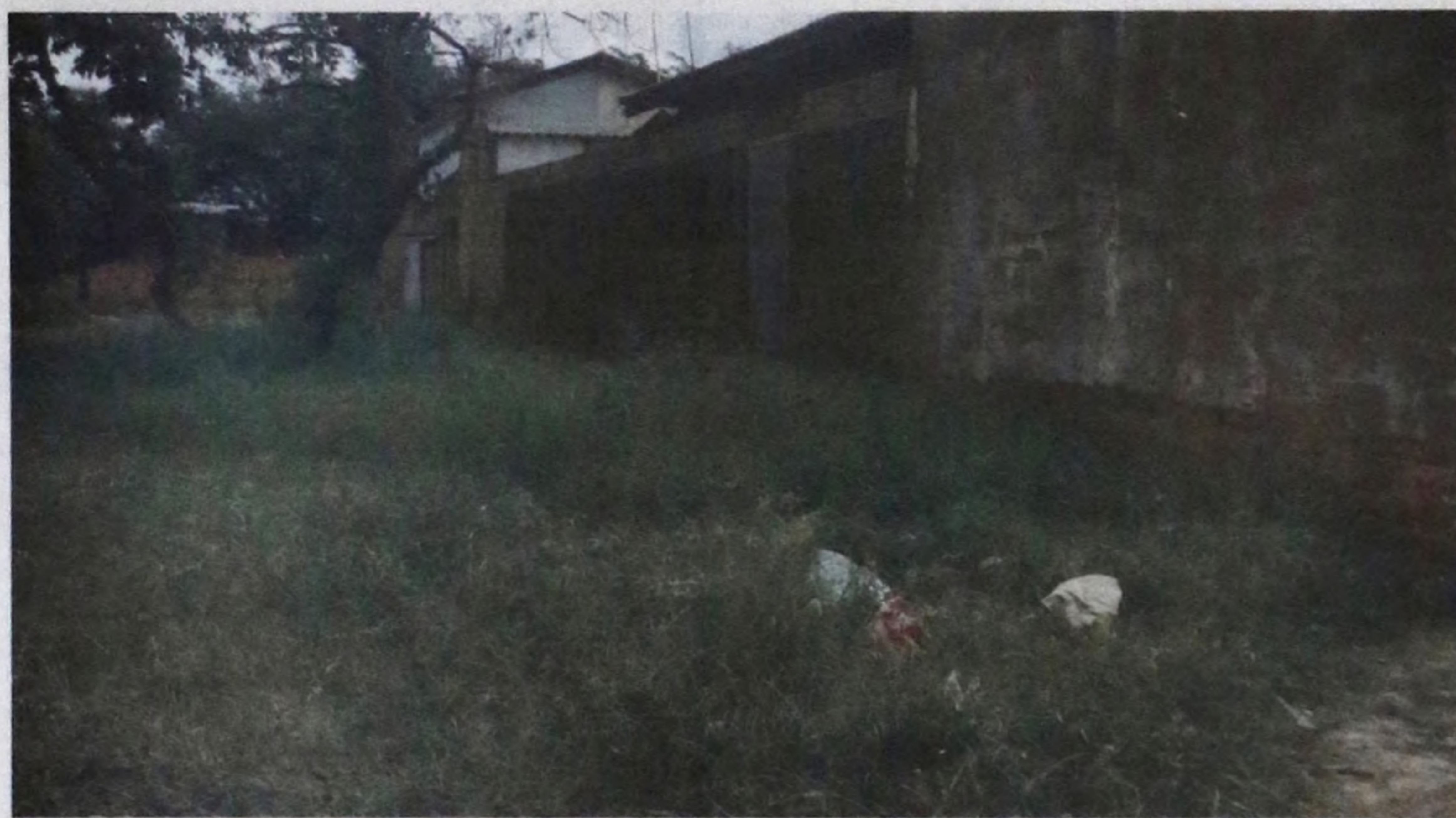
Terreno localizado no bairro Jardim Nova Lençóis acumula lixo e gera transtornos aos moradores