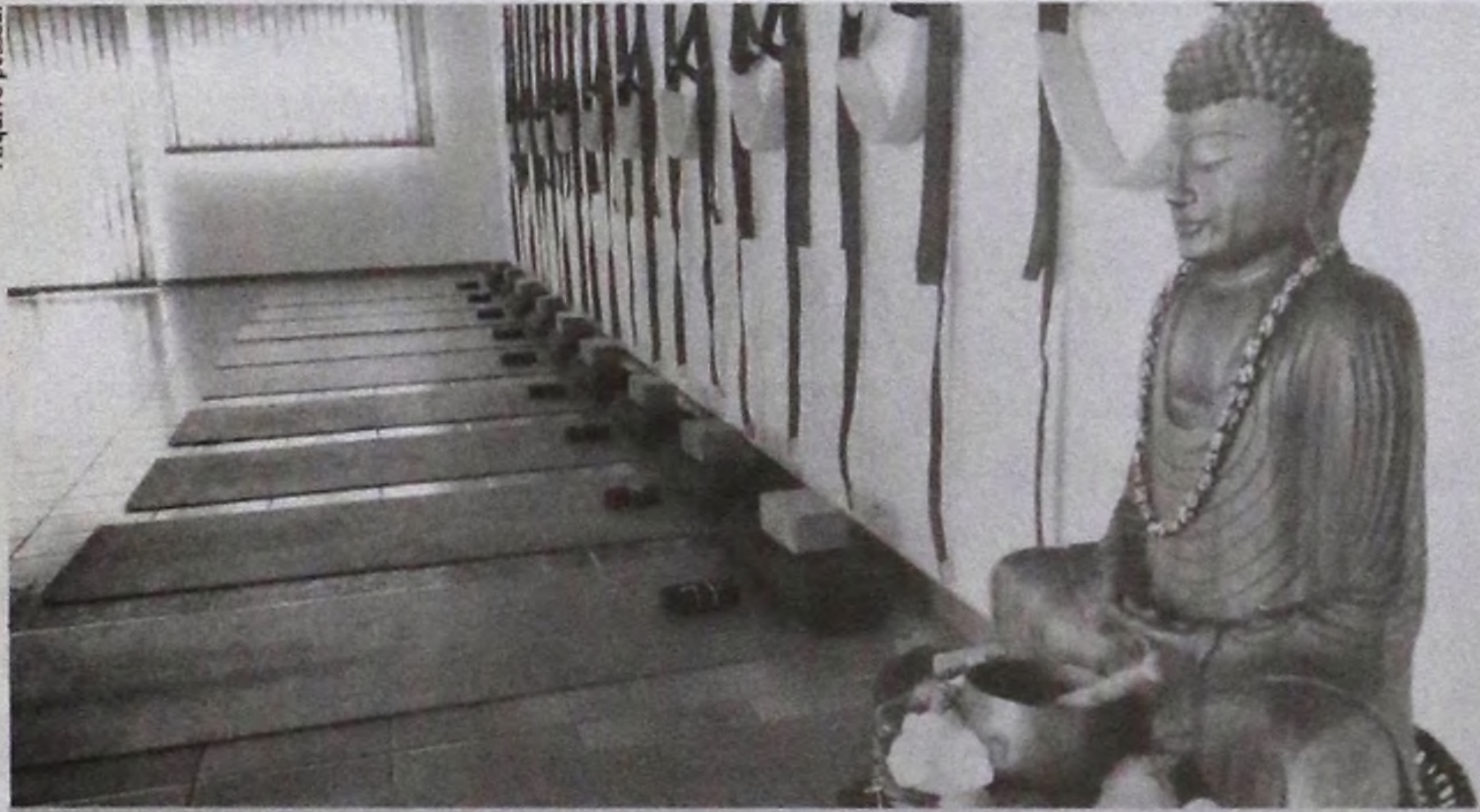
Casa de Cultura Oriental Shenmen oferece aulas de ginástica chinesa

Através das técnicas de Yoga e Meditação, o Centro de Cultura Oriental realiza atividades que ajudam no bem-estar físico e mental