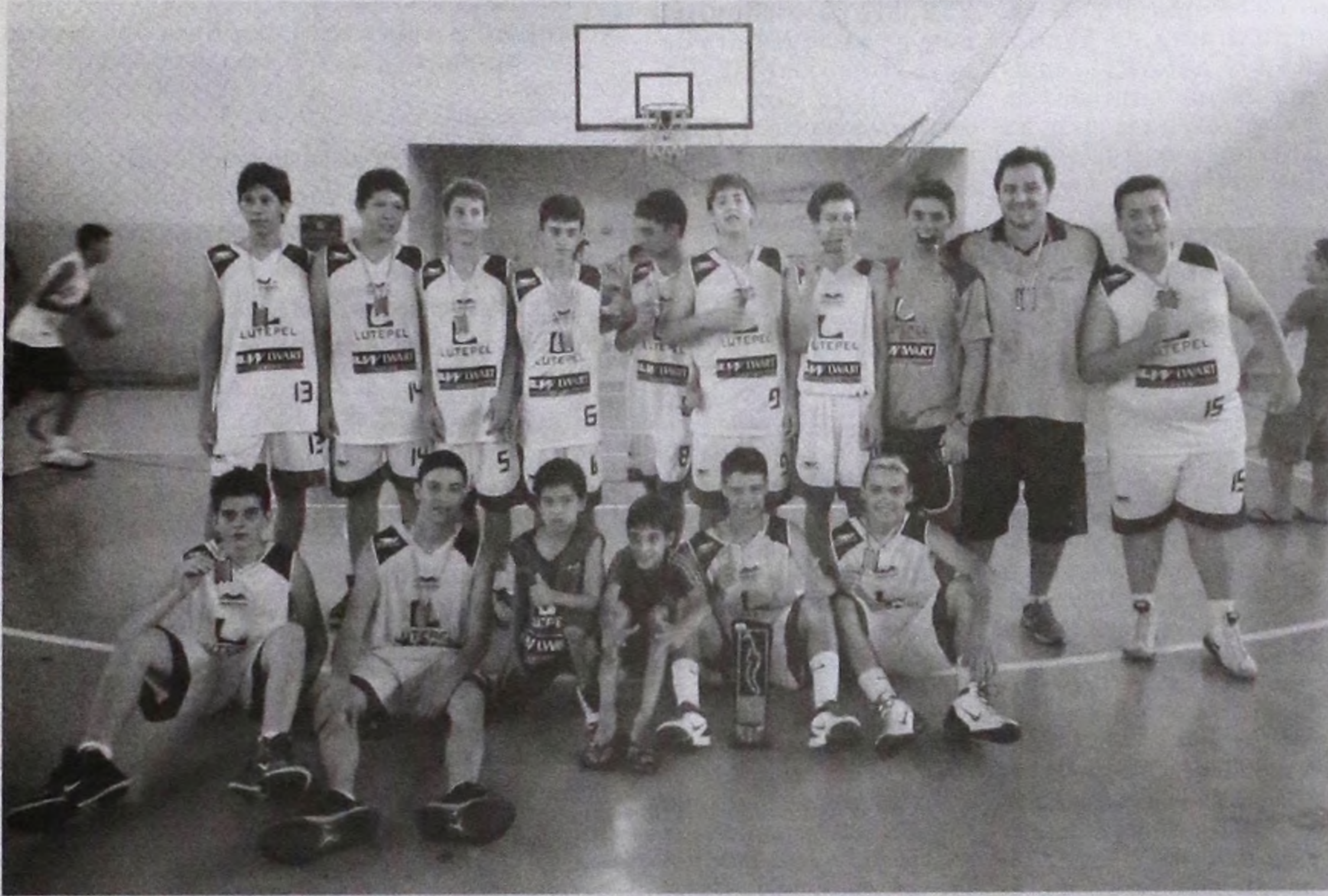
Basquete sub-14 da ALBA vence final contra Maracá e comemora título da LBC com muita empolgação

Equipe de Lençóis Paulista comemora título da Liga de Basquete do Centro Oeste Paulista