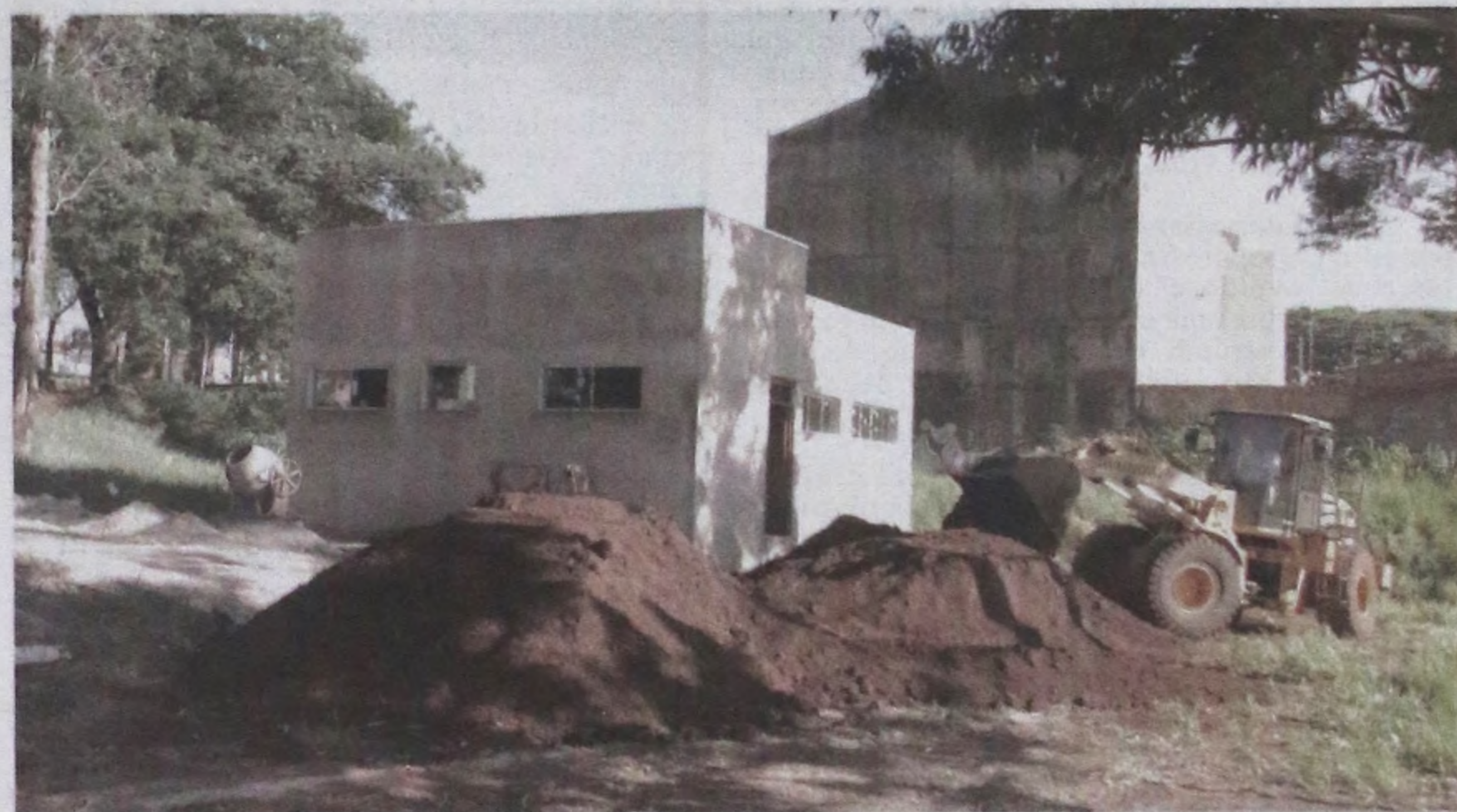
Funcionários da Prefeitura trabalham para terminar o calçamento ao lado dos vestiários no campo da Sidelpa

Nesta última semana, a Prefeitura deu início a terraplanagem para construção de calçamento ao lado dos vestiários instalados no campo da Sidelpa.