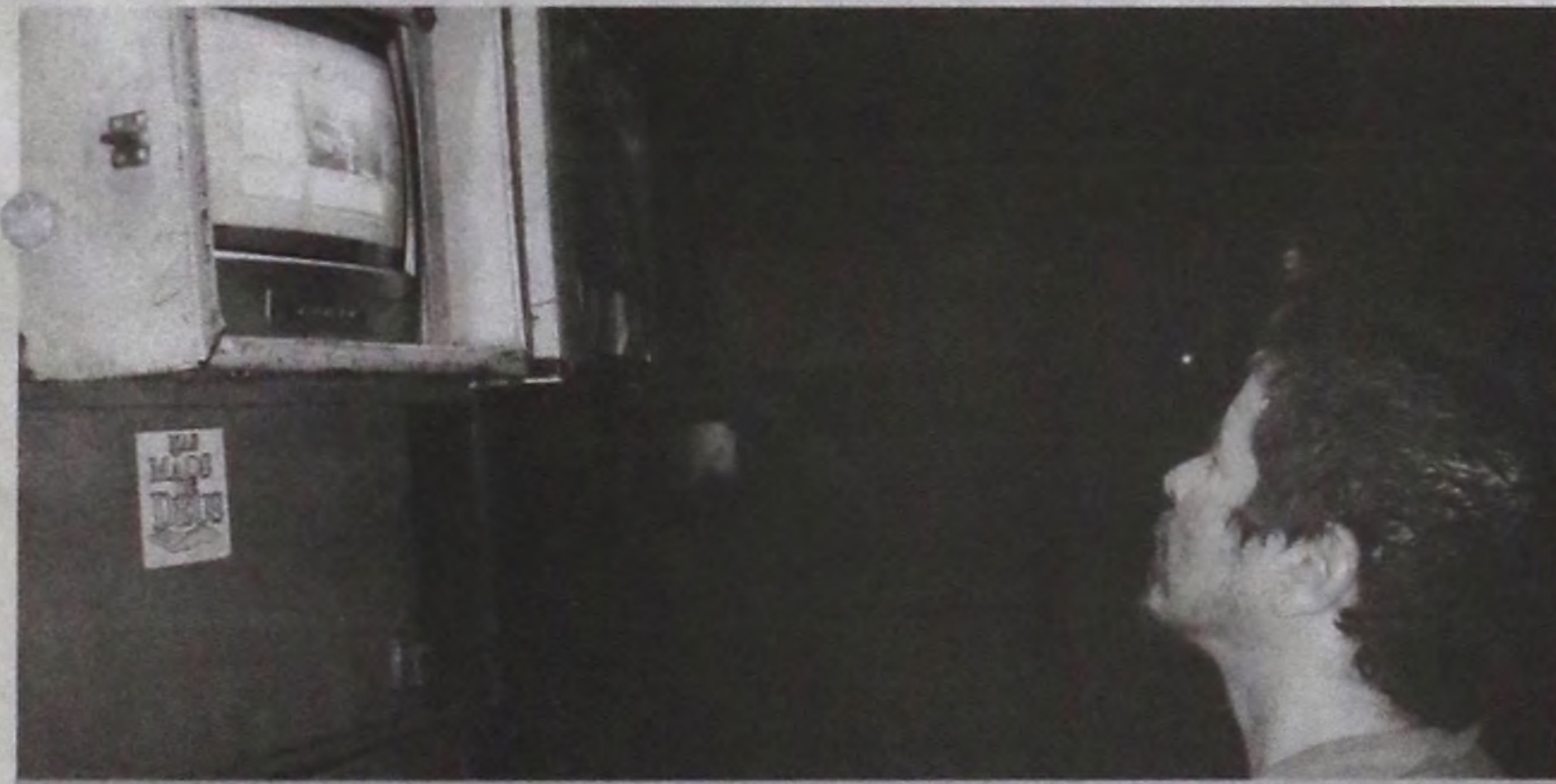
José (nome fictício) assiste suas novelas preferidas na televisão do ponto de táxi