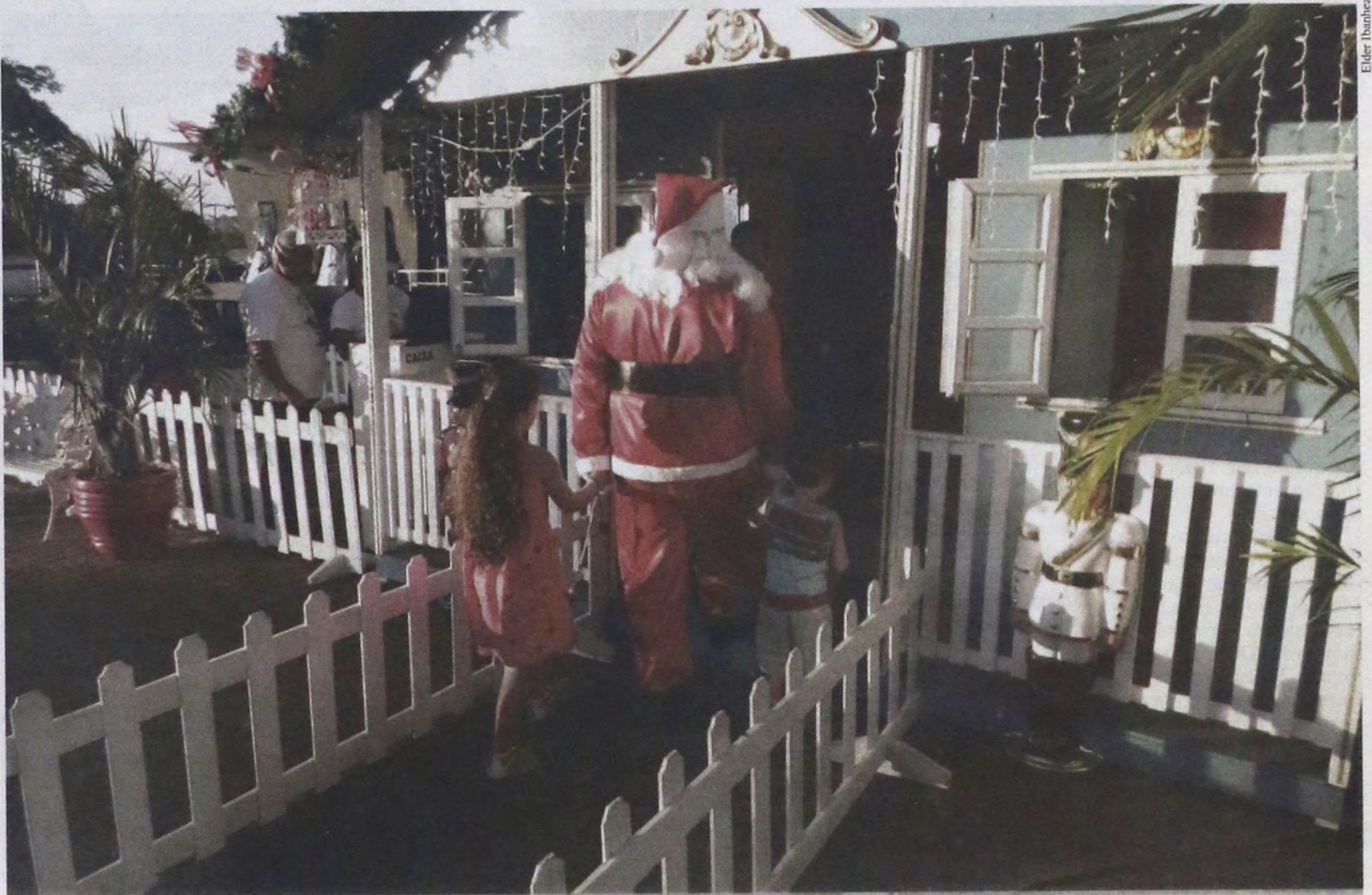
A casinha decorada com bonecos e enfeites de natal irá atender o público até o dia 23 de dezembro na Praça Concha Acústica