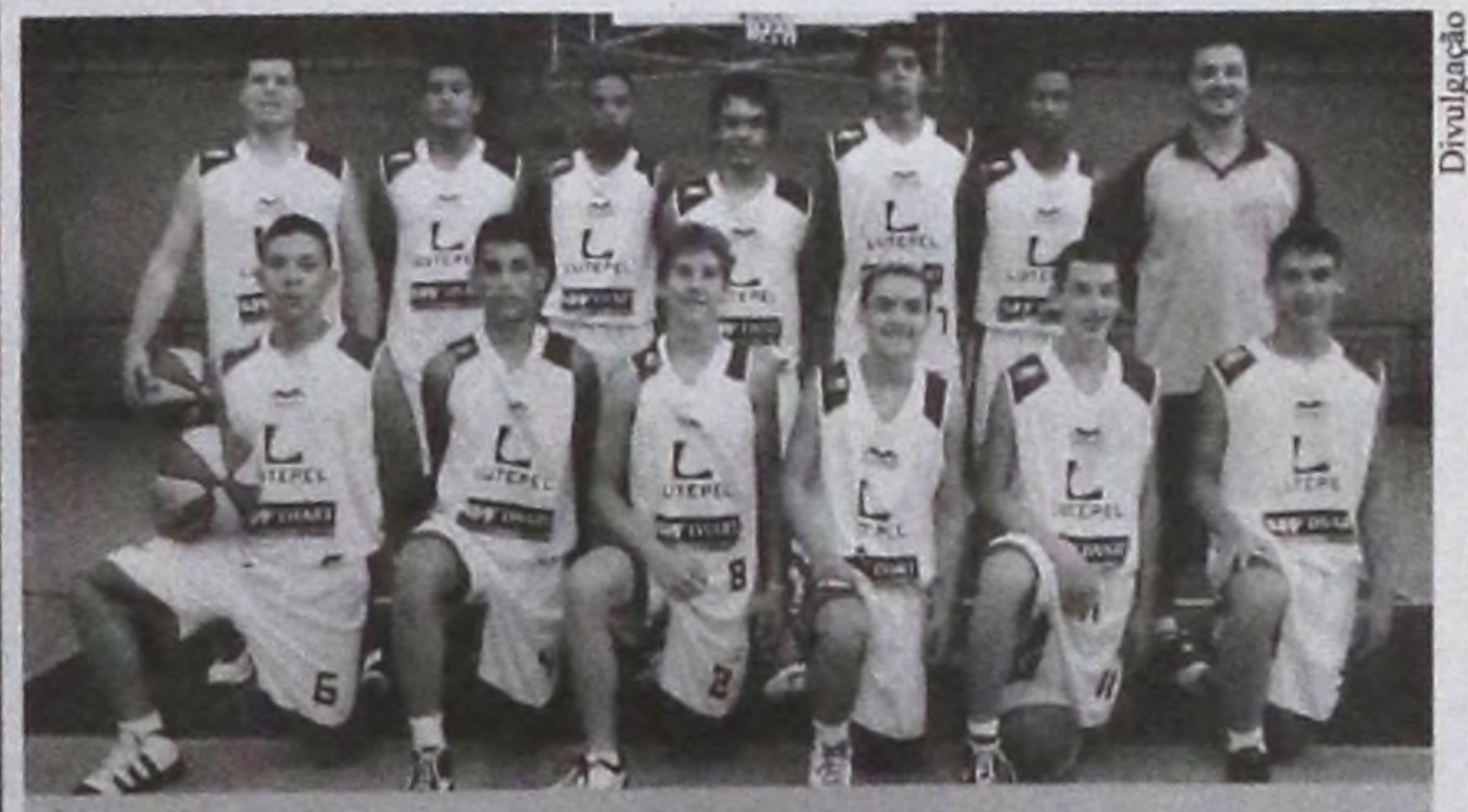
Sub-16 da ALBA termina o ano campeão da LBC