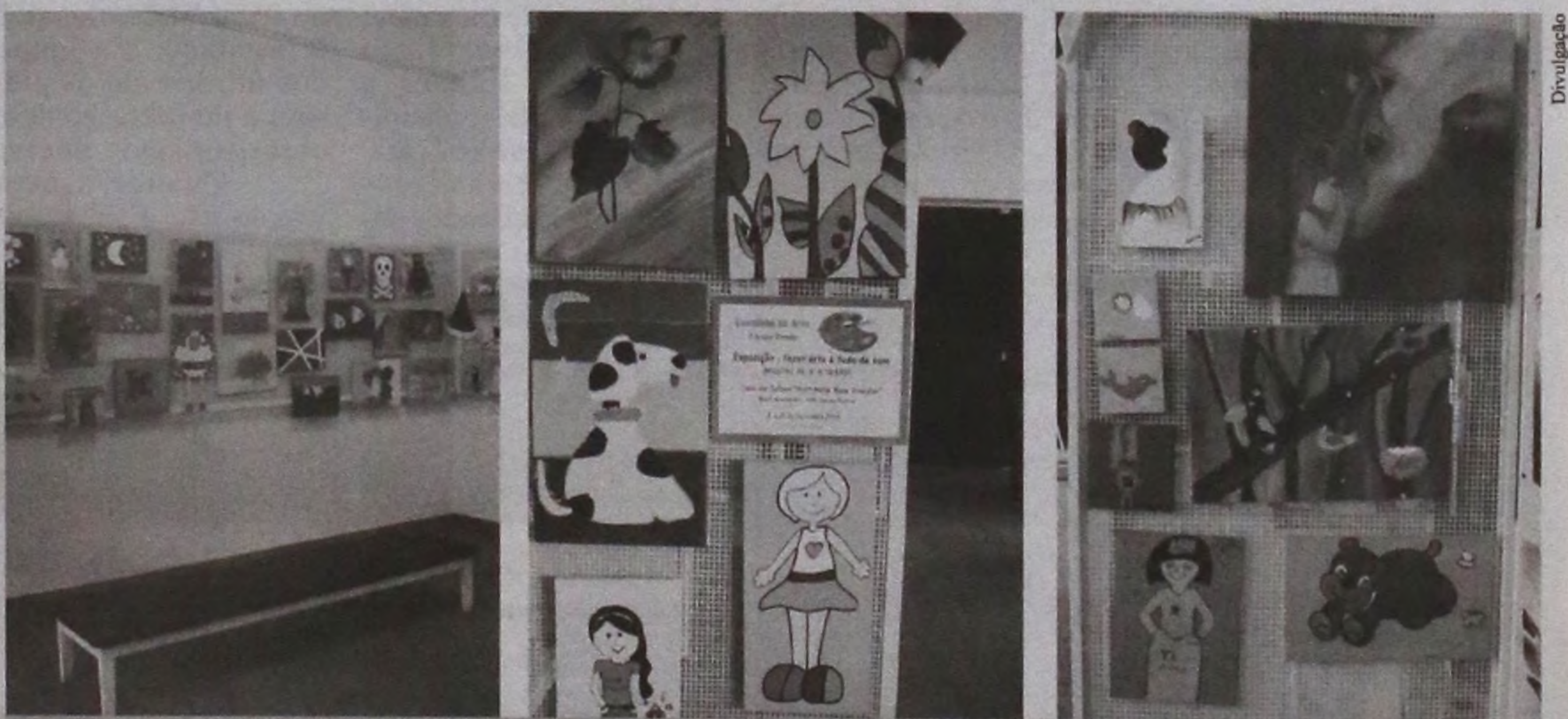
Em espaço cedido na Casa da Cultura de Lençóis, pinturas representam as poéticas dos artistas mirins

O próximo projeto da artista plástica será um mural com a aplicação da técnica indireta de mosaico, utilizando cacos de cerâmicas, louças e sucatas de metal. O Atelier fica na Rua 13 de Maio, 532.