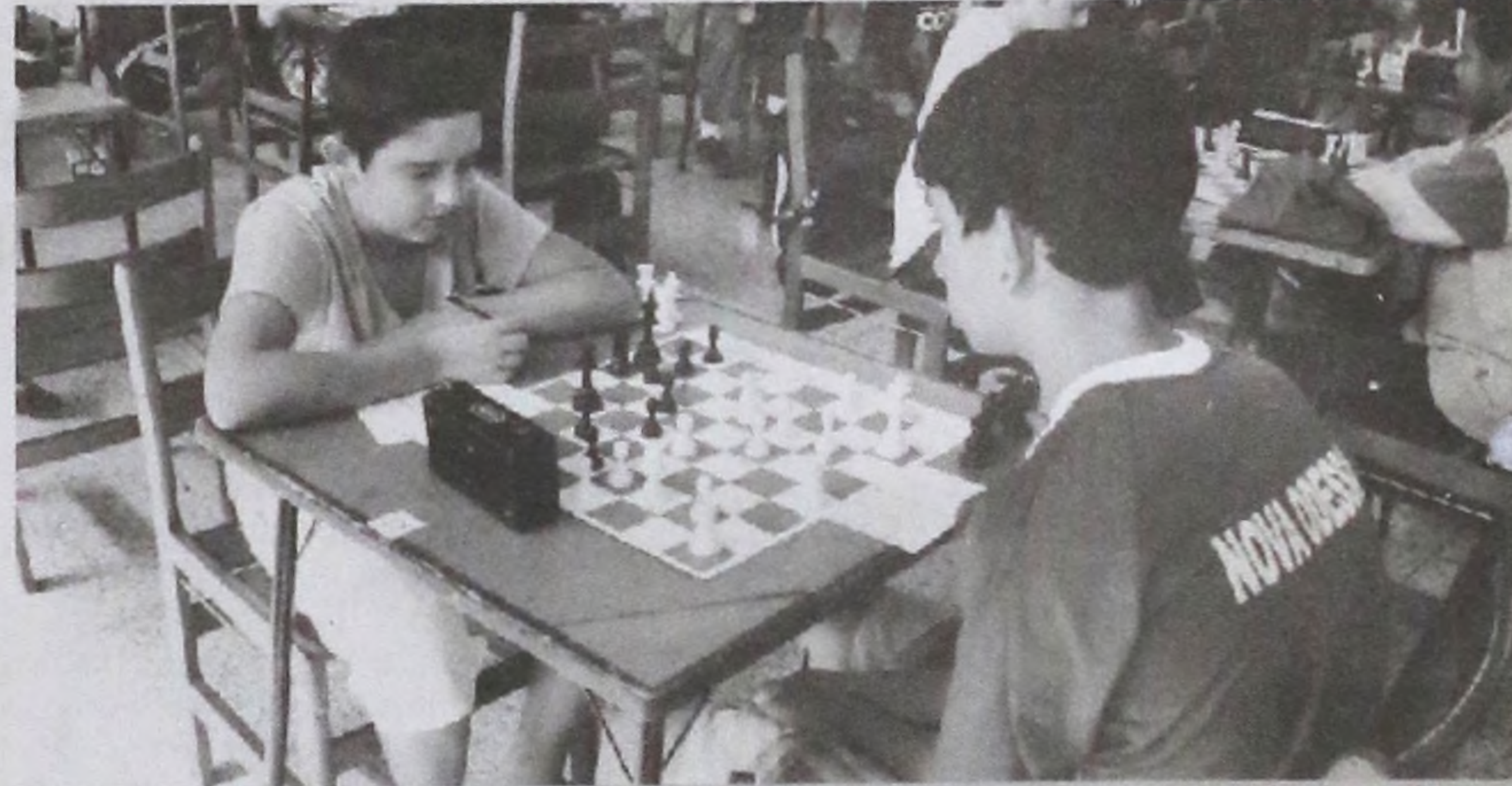
O esporte é considerado um jogo nobre, que reúne estratégia, cálculo e lógica