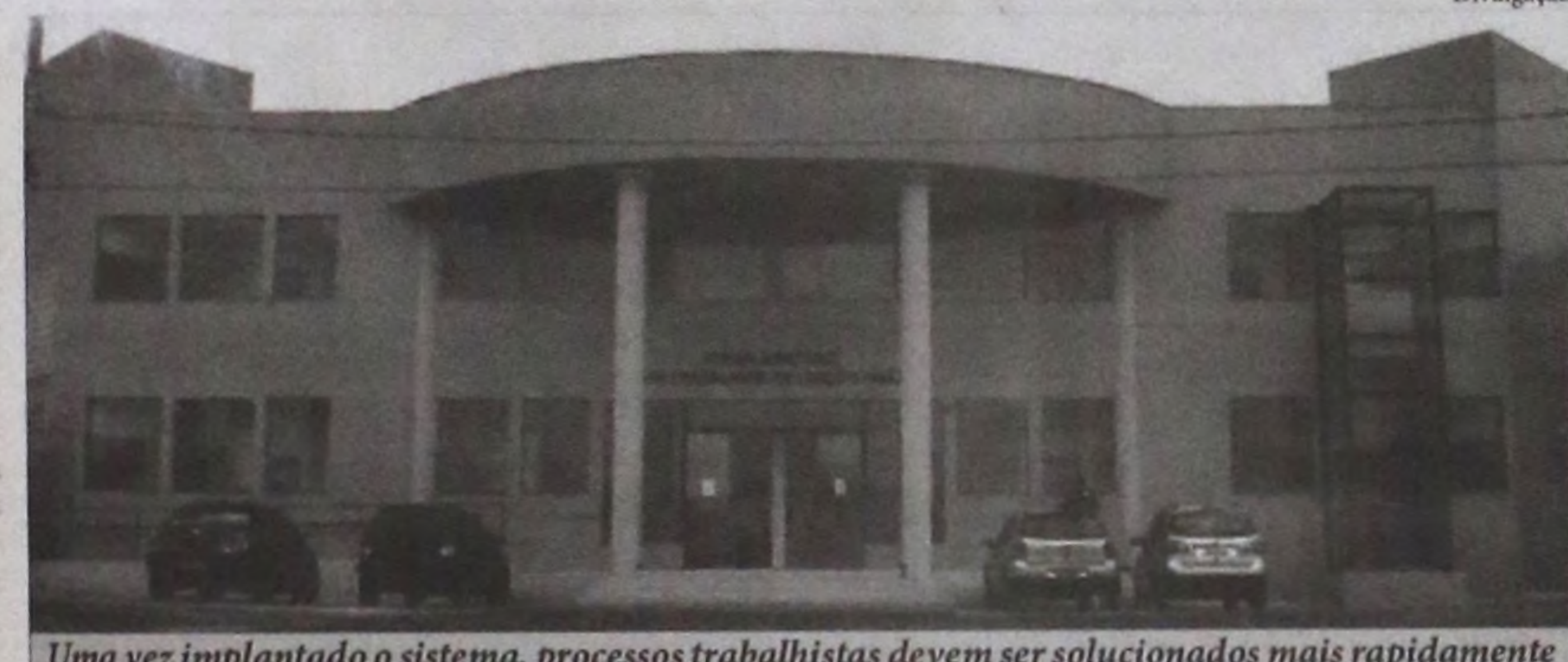
Uma vez implantado o sistema, processos trabalhistas devem ser solucionados mais rapidamente