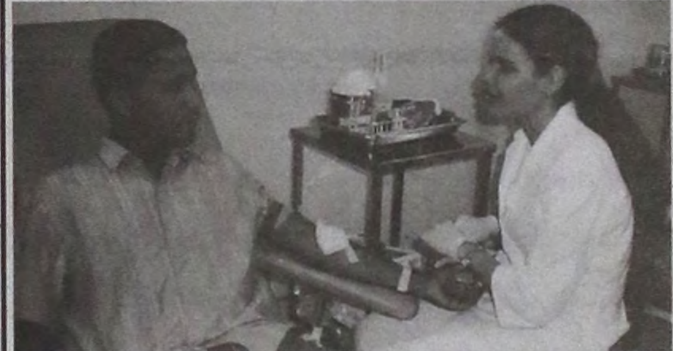
Defasagem de doações preocupa bancos de sangue

No próximo sábado, (25), será realizada uma ação para doação de sangue.