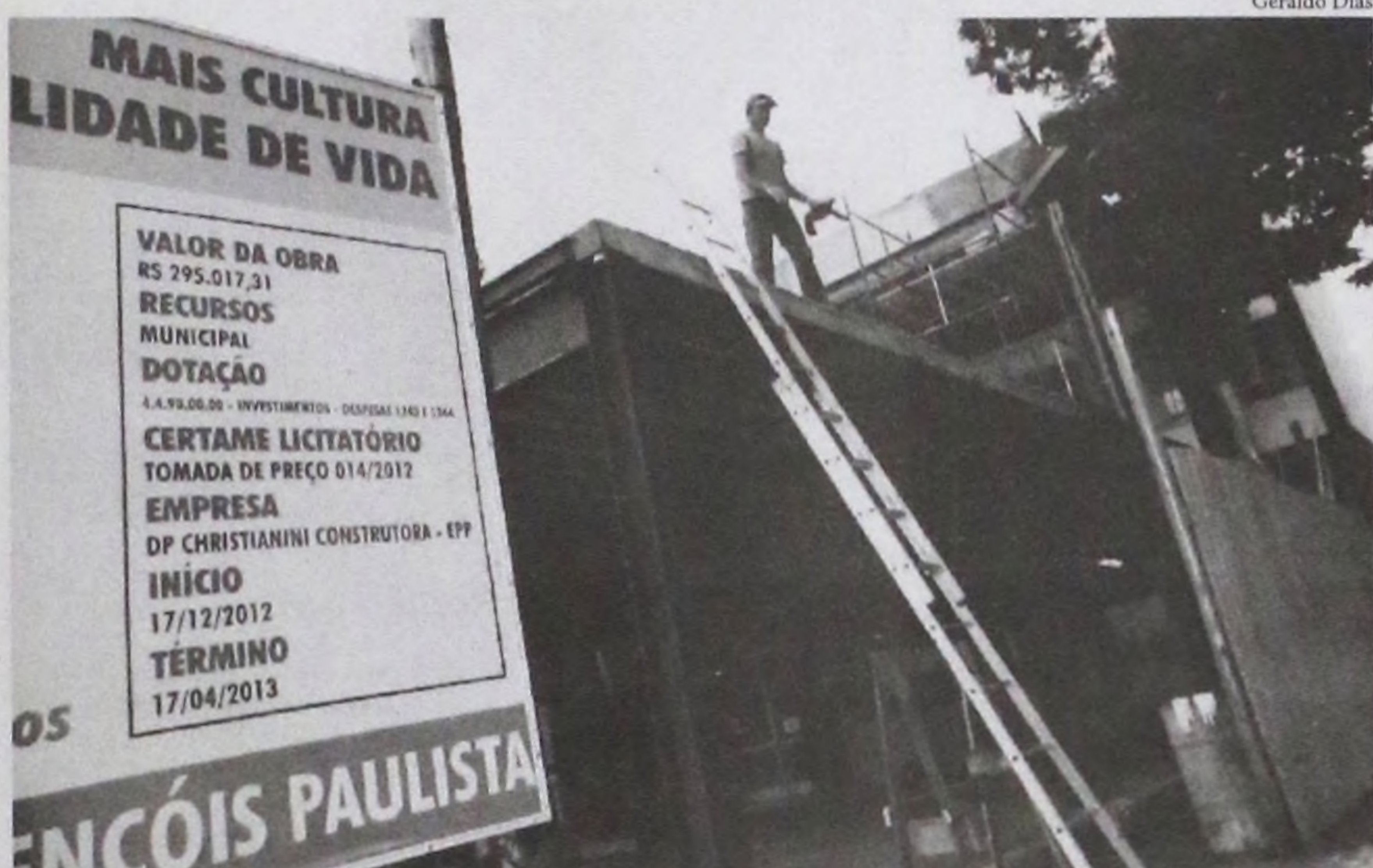
Placa de propaganda revela o atraso de um mês nas reformas da Biblioteca Municipal