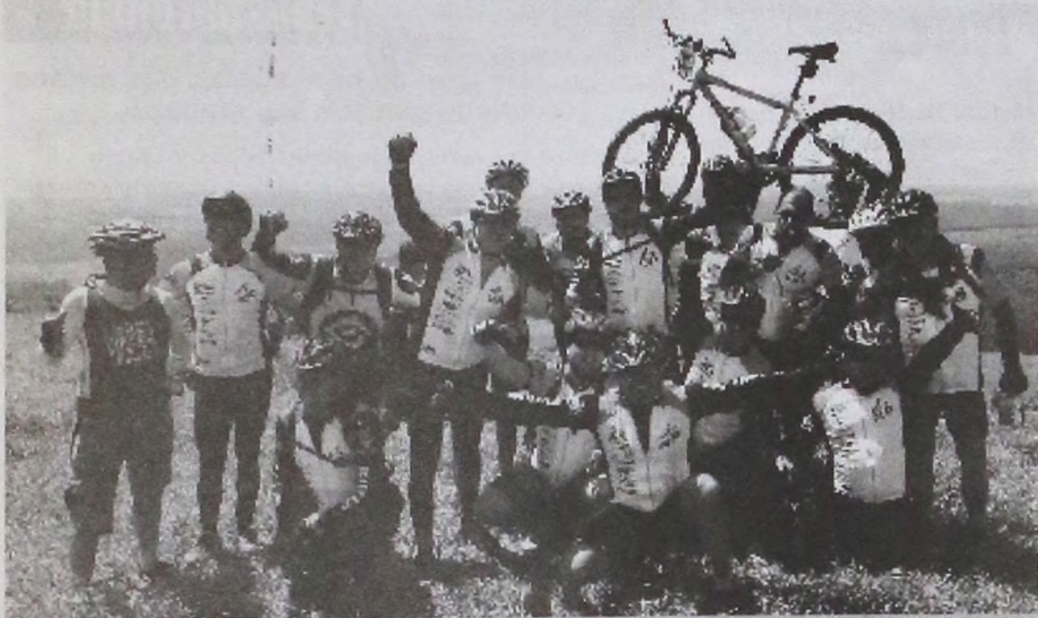
O grupo de ciclistas do Bike LP visitam a Cuesta de Botucatu, há 55Km de Lençóis