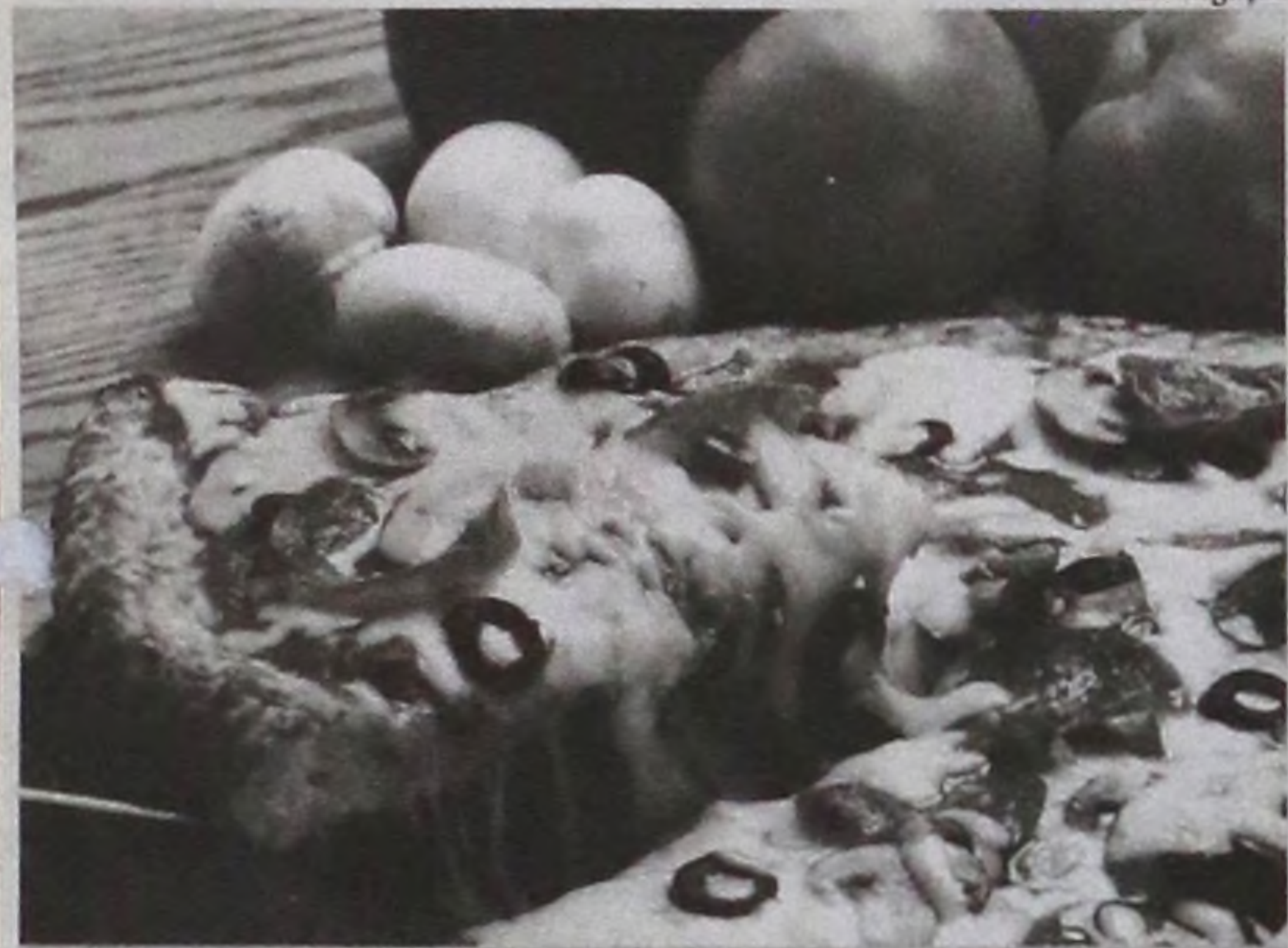
Verba arrecada será destinada à Instituição Assistencial

Amanhã, (18), a Casa da Amizade e o Rotary Club, vão promover a 2ª Tarde da Pizza.