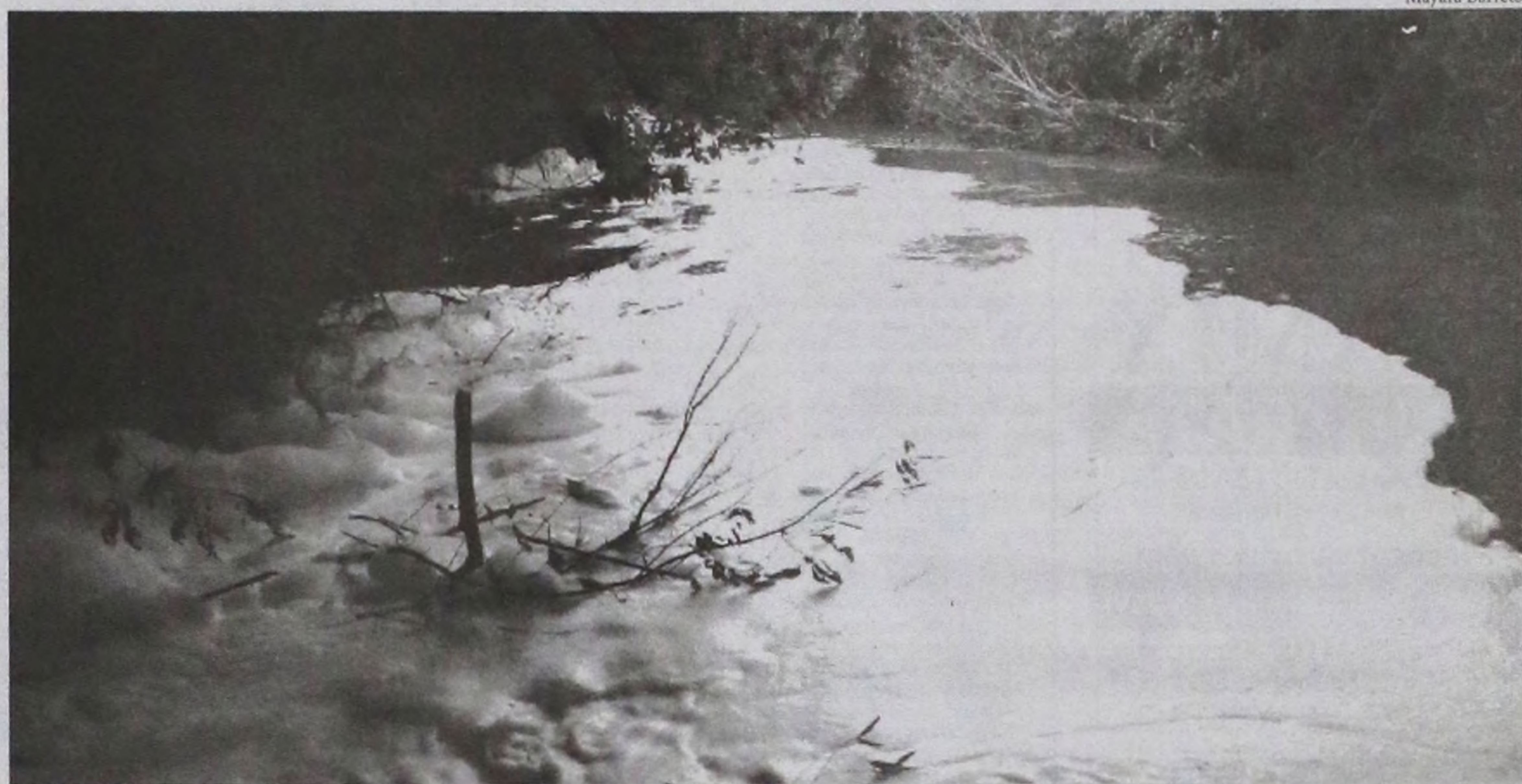
Camada de espuma que cobre as águas do rio Lençóis desde a última segunda-feira de acordo com denúncias