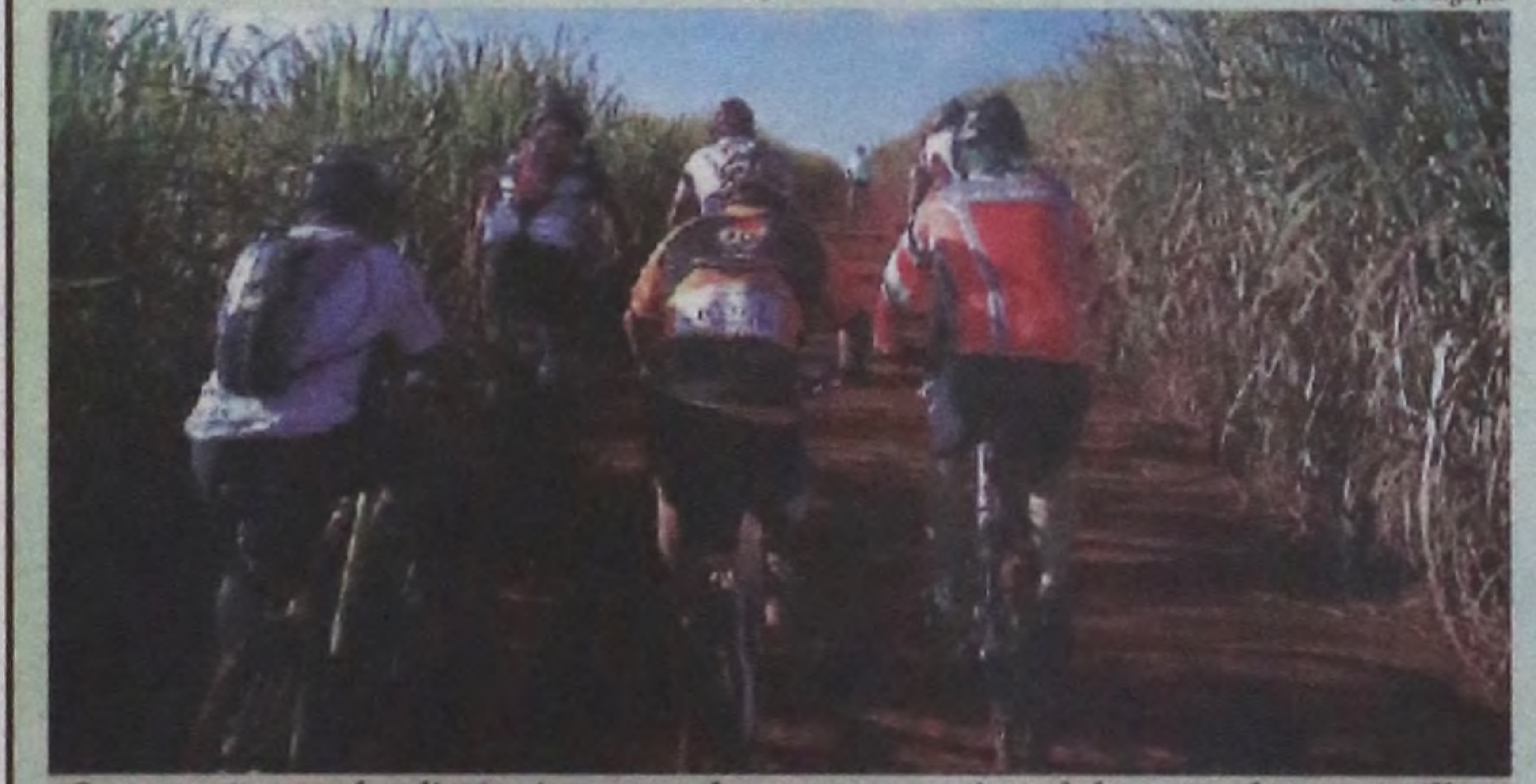
Grupo não mede distâncias quando o assunto é pedalar por longas trilhas

Pelo menos três vezes por semana os ciclistas do grupo Bike LP se reúnem para desbravar novos lugares, conhecer novas paisagens e ganhar mais qualidade de vida por meio do esporte. Eles percorrem estradas de asfalto e trilhas de bicicleta. O grupo já desbravou muitas fronteiras regionais. As terças e quintas-feiras são os dias dedicados aos treinos de 30 a 40 km pedalando pela região. Aos sábados eles combinam qual será a opção do dia: "sábado longo" ou "sábado curto". As escolhas se resumem a pedalar até 50 km no circuito curto e acima dos 80 km no trecho longo. Pág 06