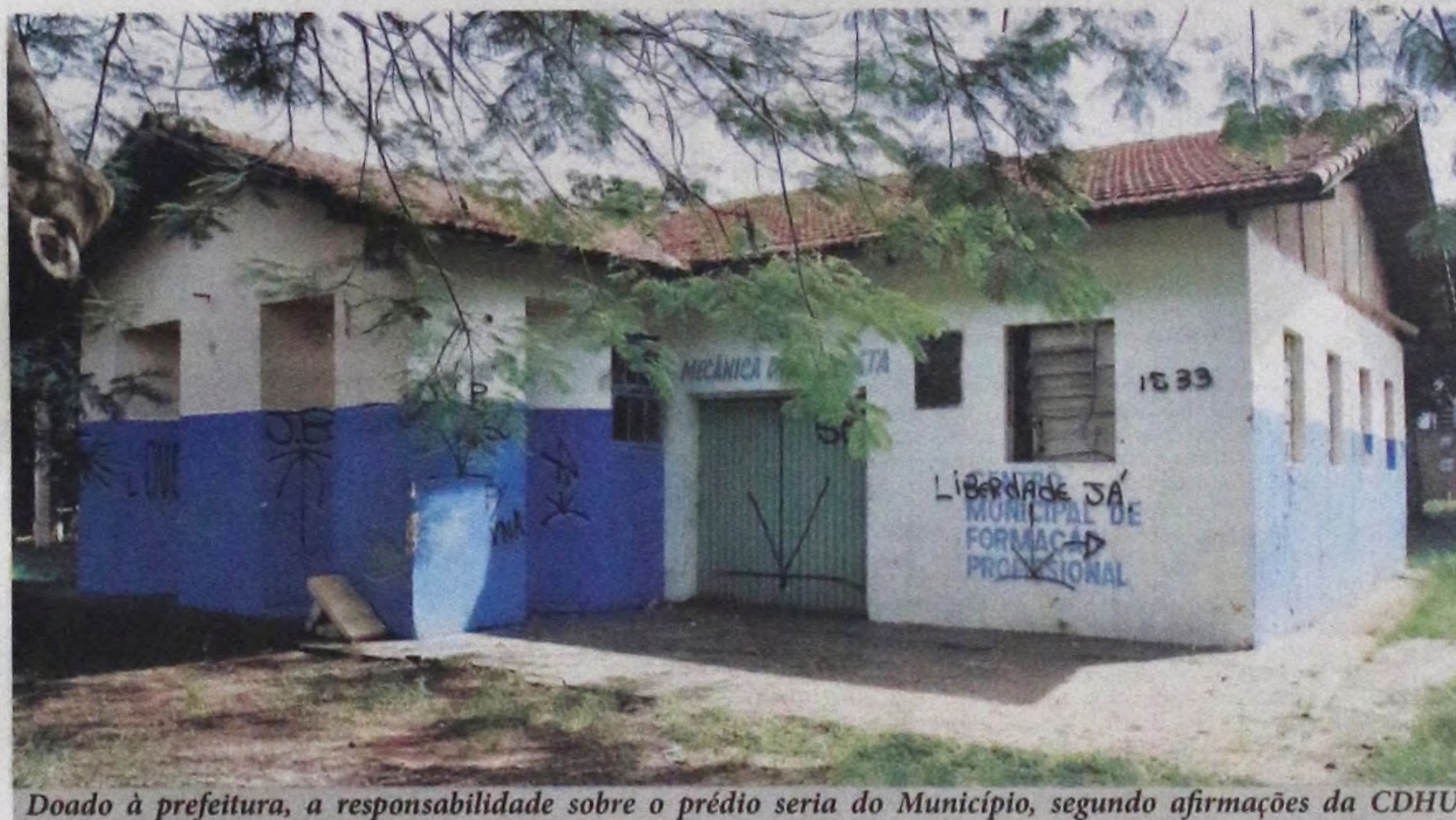
Doado à prefeitura, a responsabilidade sobre o prédio seria do Município, segundo afirmações da CDHU

Abandono, depreciação e uso de drogas. É nesse cenário que se encontra o "Centrinho" do Júlio Ferrari. O prédio foi doado pela CDHU à Prefeitura Municipal de Lençóis e segundo populares, o espaço está desativado desde dezembro de 2008. Desde então não houve qualquer interesse do município em revitalizar o loteamento. Pág 03