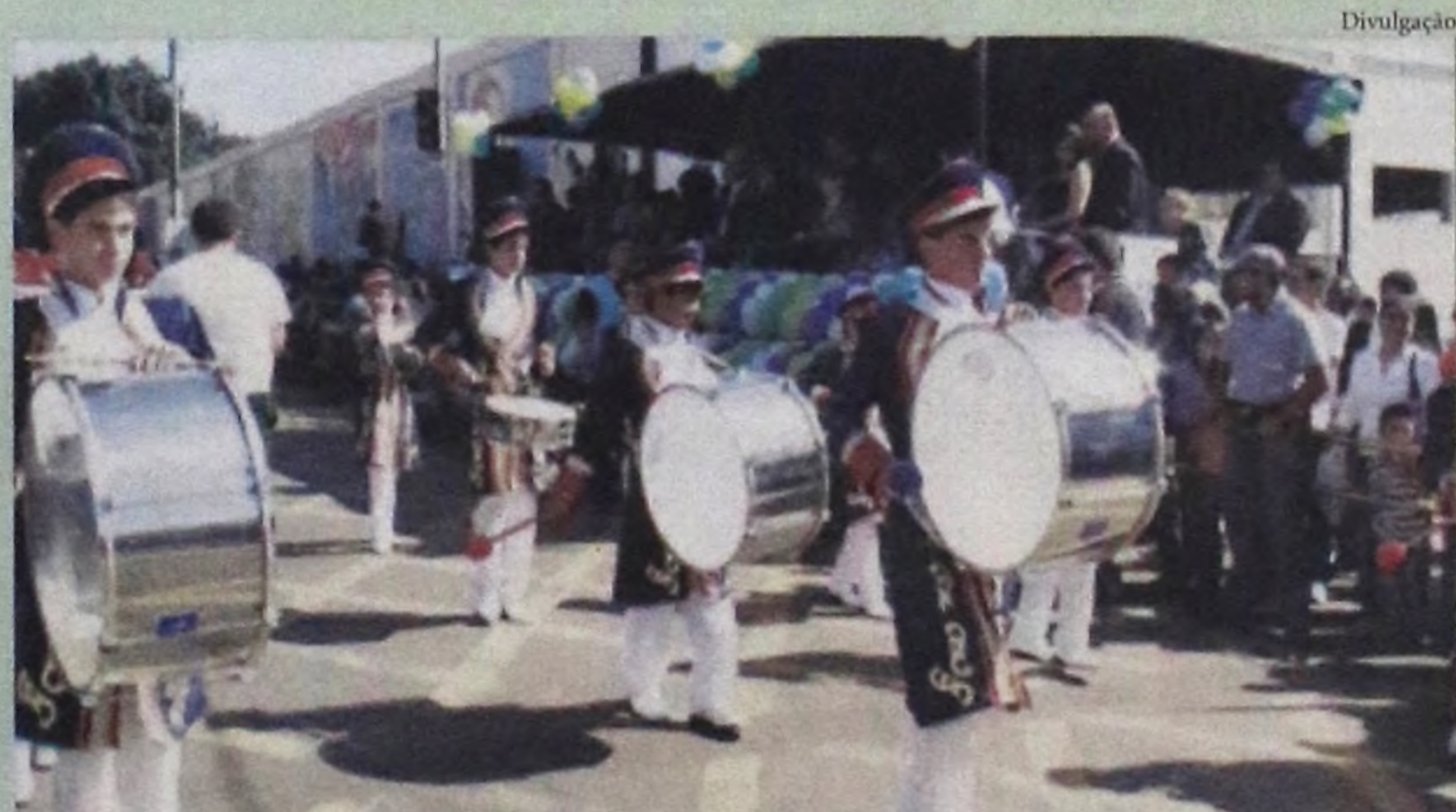
Escolas e instituições estão sendo mobilizadas para a realização do Desfile Cívico

Neste ano, o desfile Cívico em comemoração aos 155 anos da cidade será no dia (27), sábado, a partir das 9h na Avenida Padre Salústio. Entre instituições e escolas, serão 2.500 participantes na avenida.