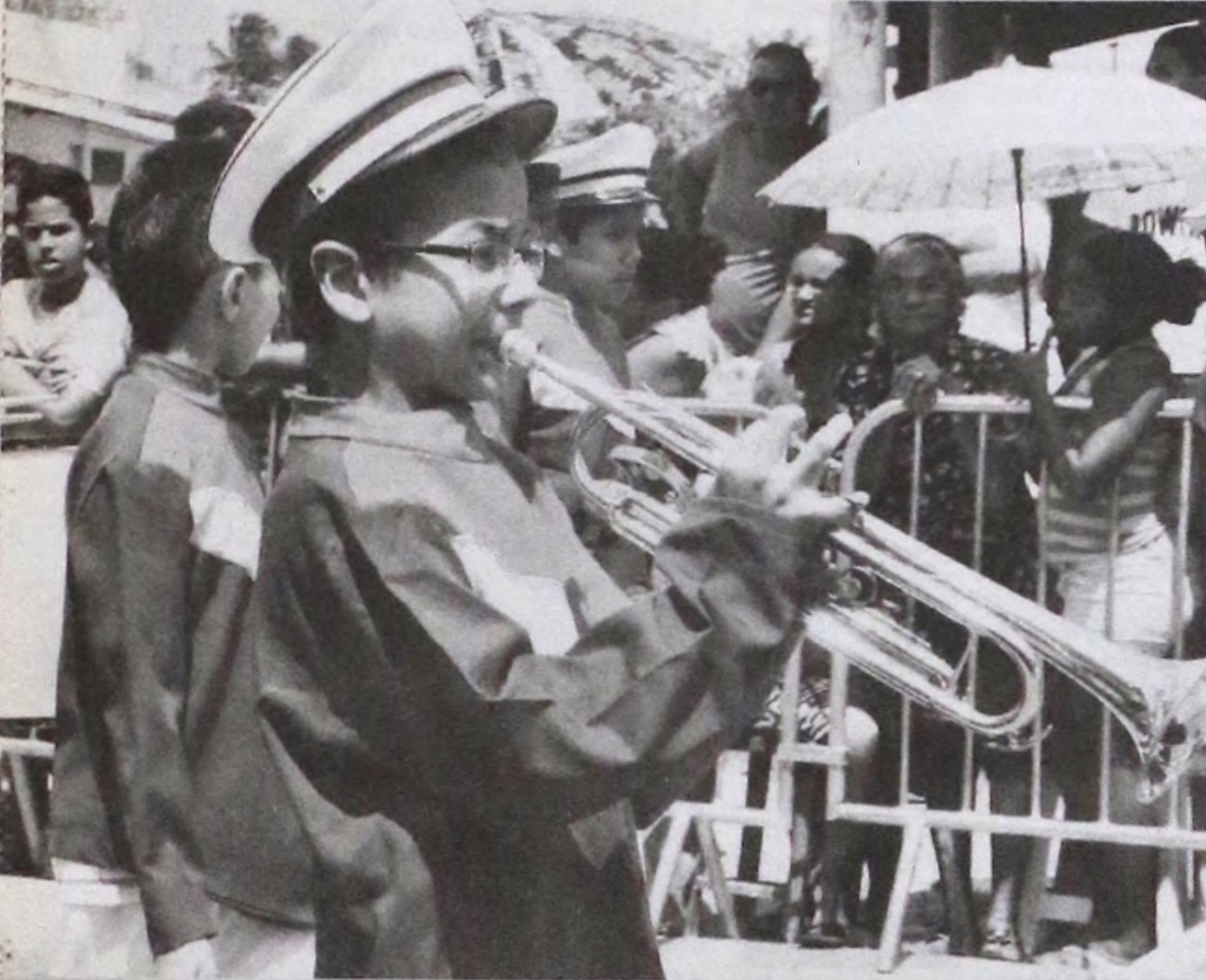
Desfile Cívico sempre é marcado pelo som das fanfarras de Lençóis Paulista