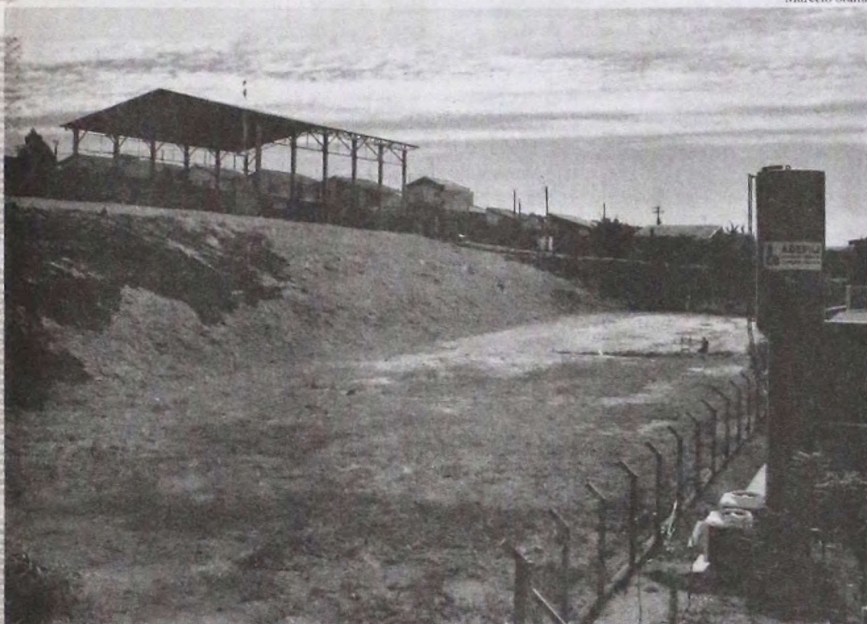
Terreno reservado para a construção do ginásio esportivo recém aprovado