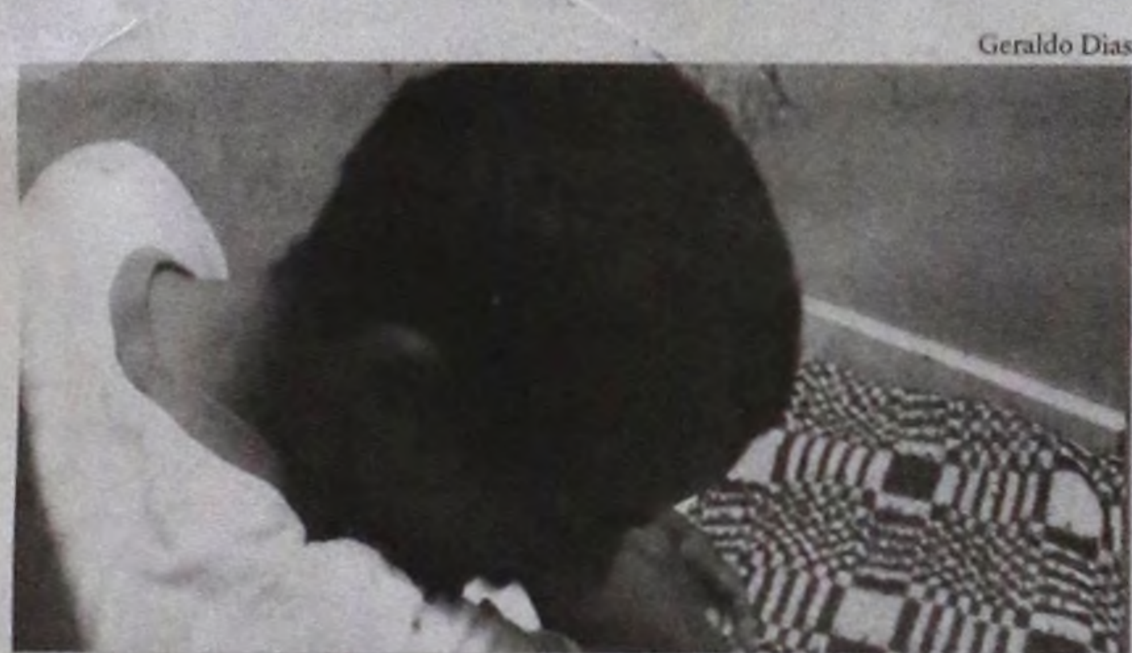
Assaltante detido depois de ser flagrado pela PM