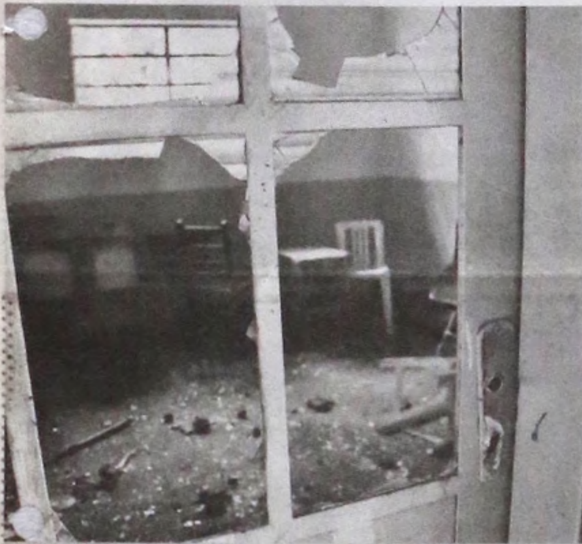
O local está totalmente depredado depois do abandono