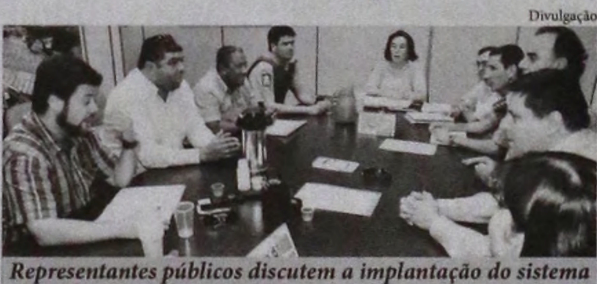
Representantes públicos discutem a implantação do sistema