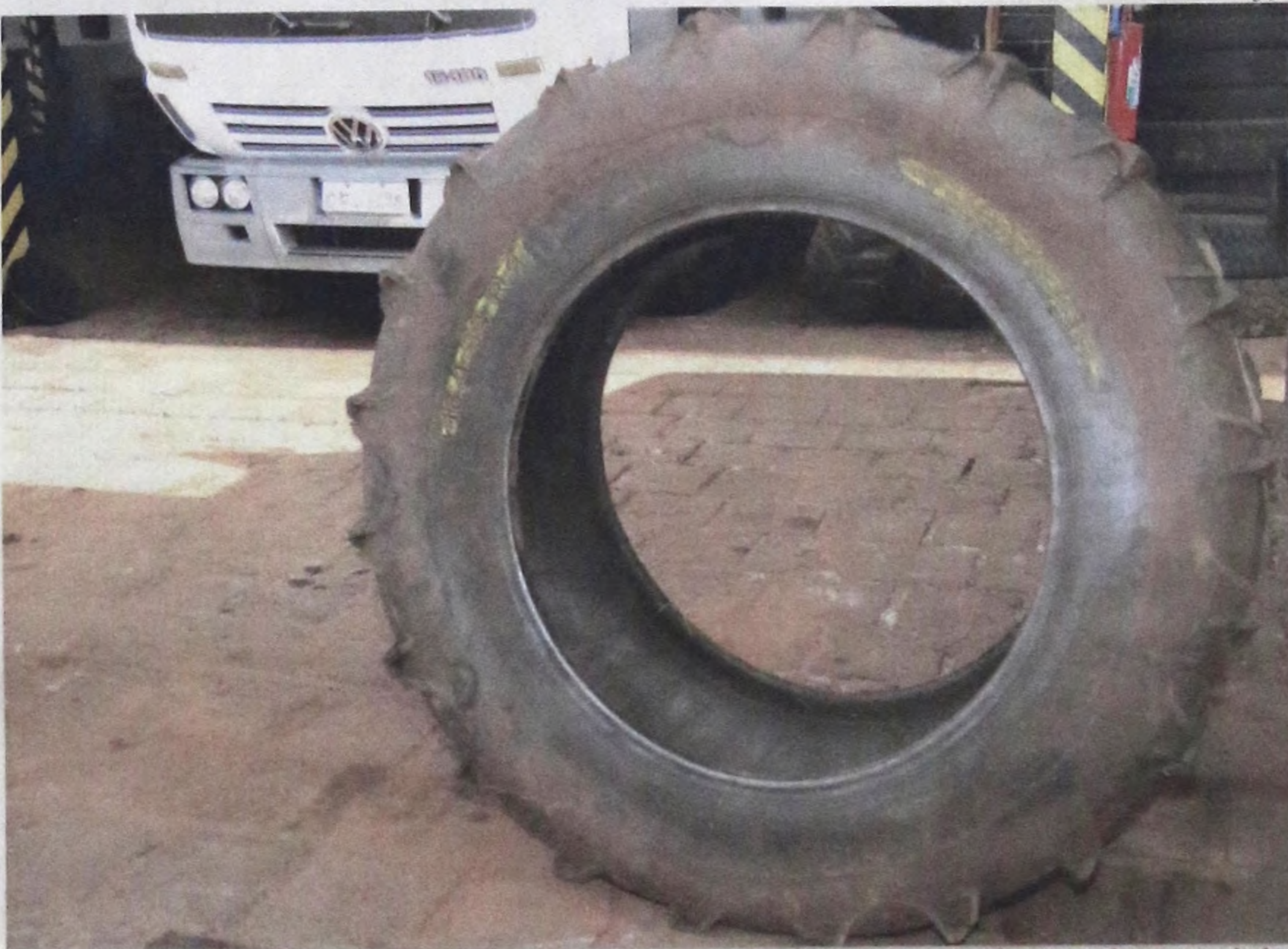
Pneus de marcas desconhecidas teriam vida útil curta, o que teria motivado a determinação de marcas de primeira linha

O encontro foi definido após reunião entre legislativo, representantes da polícia militar, e da associação de bairros. Pág 05