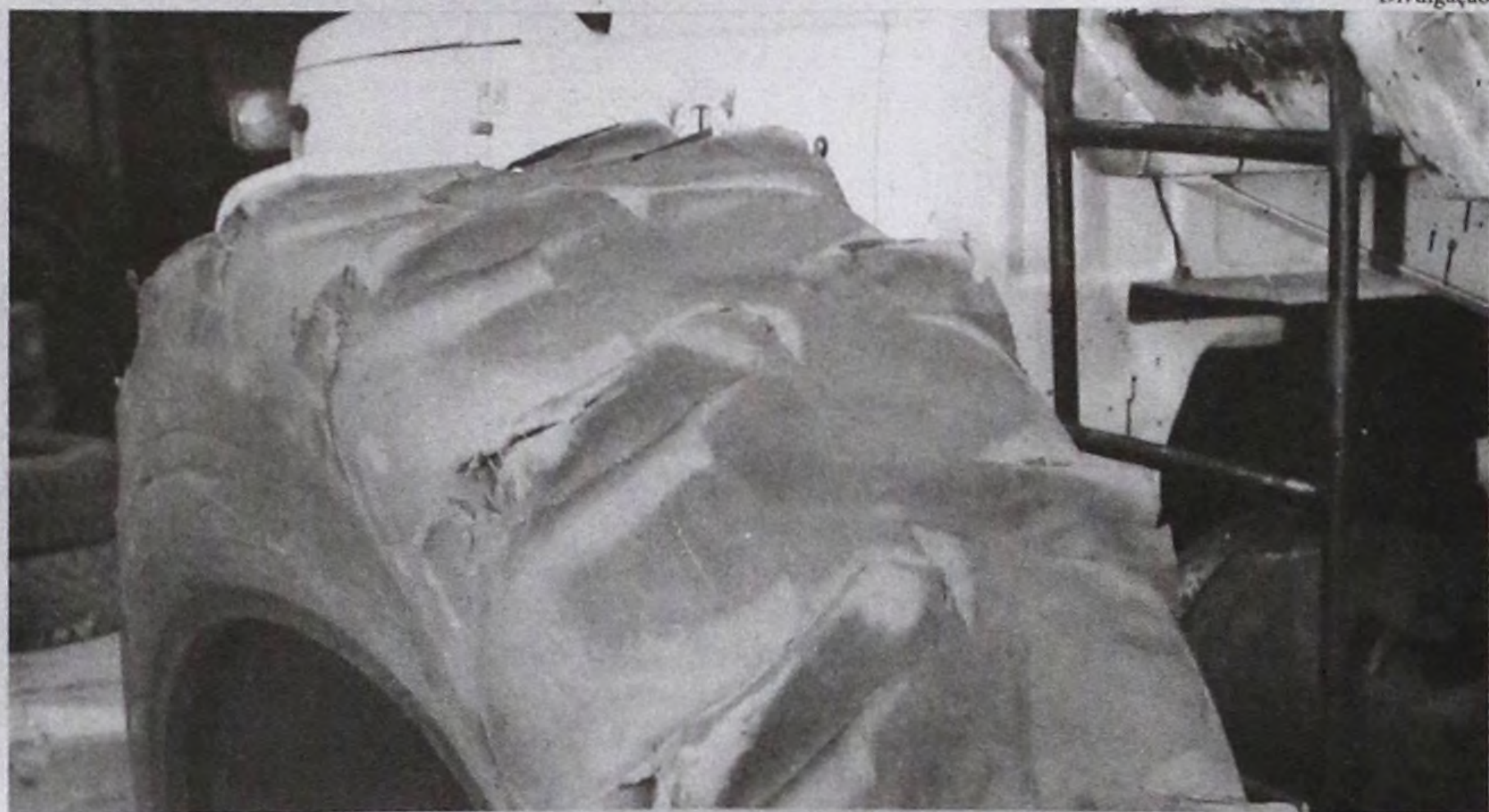
Pneu desgastado após dois meses de uso, segundo Diretor de Suprimentos da Prefeitura

Ainda no edital do Pregão, é citado que por conta da relação custo-benefício, economicidade e de acordo com o princípio constitucional da eficiência da Administração Pública, ficou previamente reprovadas duas marcas tendo em vista o desempenho da mes-