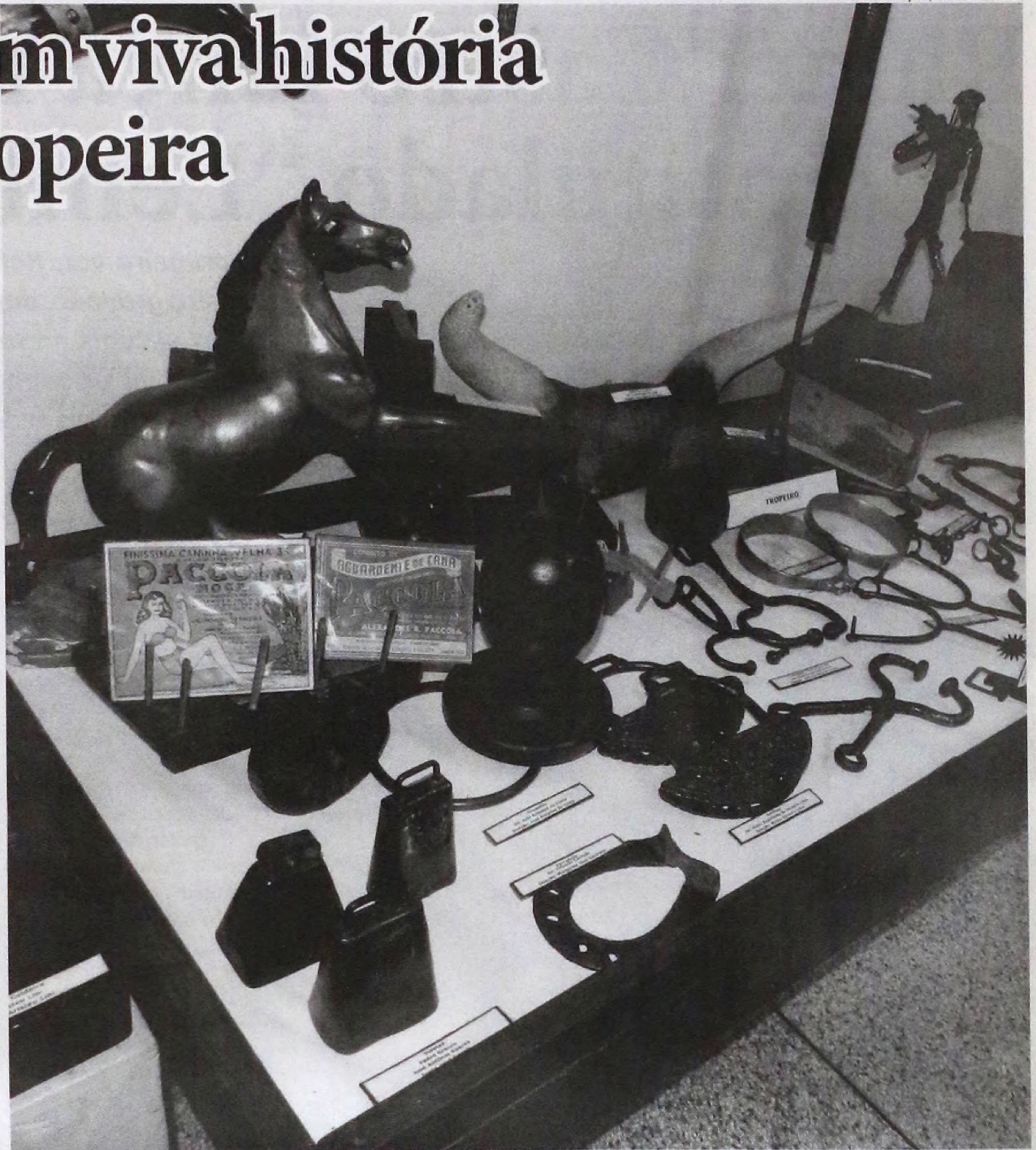
Algumas das ferramentas utilizadas na época pelos tropeiros foram resgatadas e estão em amostra no Museu Alexandre Chitto

Na FACILPA, há a lembrança da Cultura Tropeira, com artesanatos e vendas de roupas que remetem ao passado, revitalizando e tentando buscar nossas raízes interioranas, pois muitos dos tropeiros que vieram, acabaram ficando.