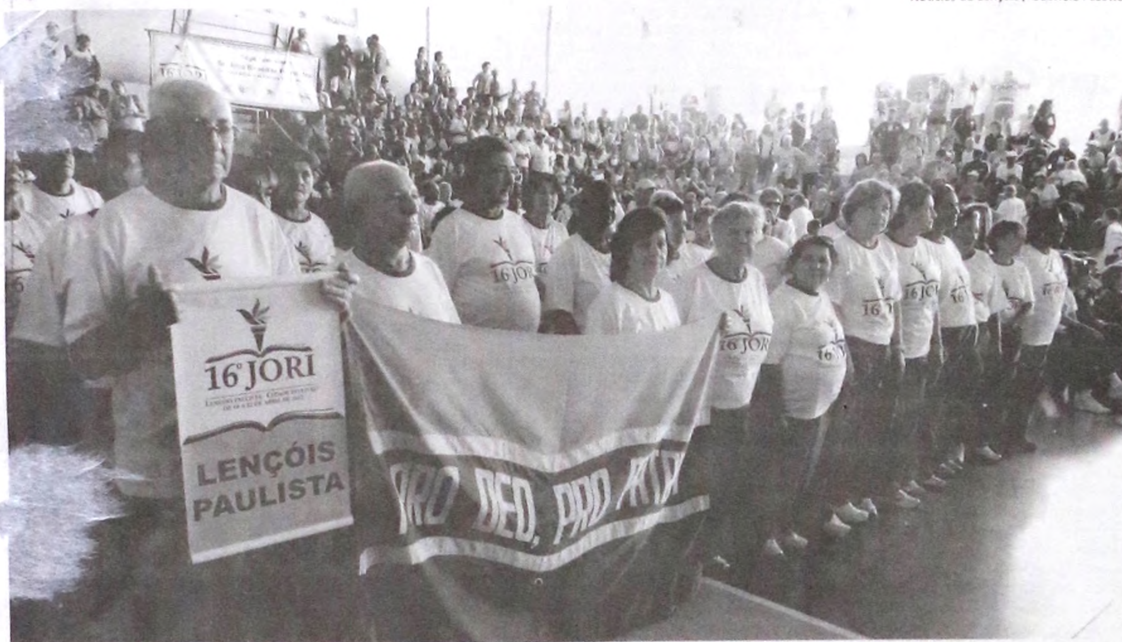
A equipe de Lençóis Paulista teve destaque na abertura dos Jogos Regionais do Idoso

O JORI teve início nesta última quarta-feira com a vinda dos participantes e a entrega dos documentos na reunião que aconteceu às 10 horas. A cerimônia de abertura oficial do JORI aconteceu ontem, no CSEC. A Cerimônia contou com a presença da presidente do Fundo Social de Solidariedade do Estado de São Paulo e 1ª dama Lu Alckmin.