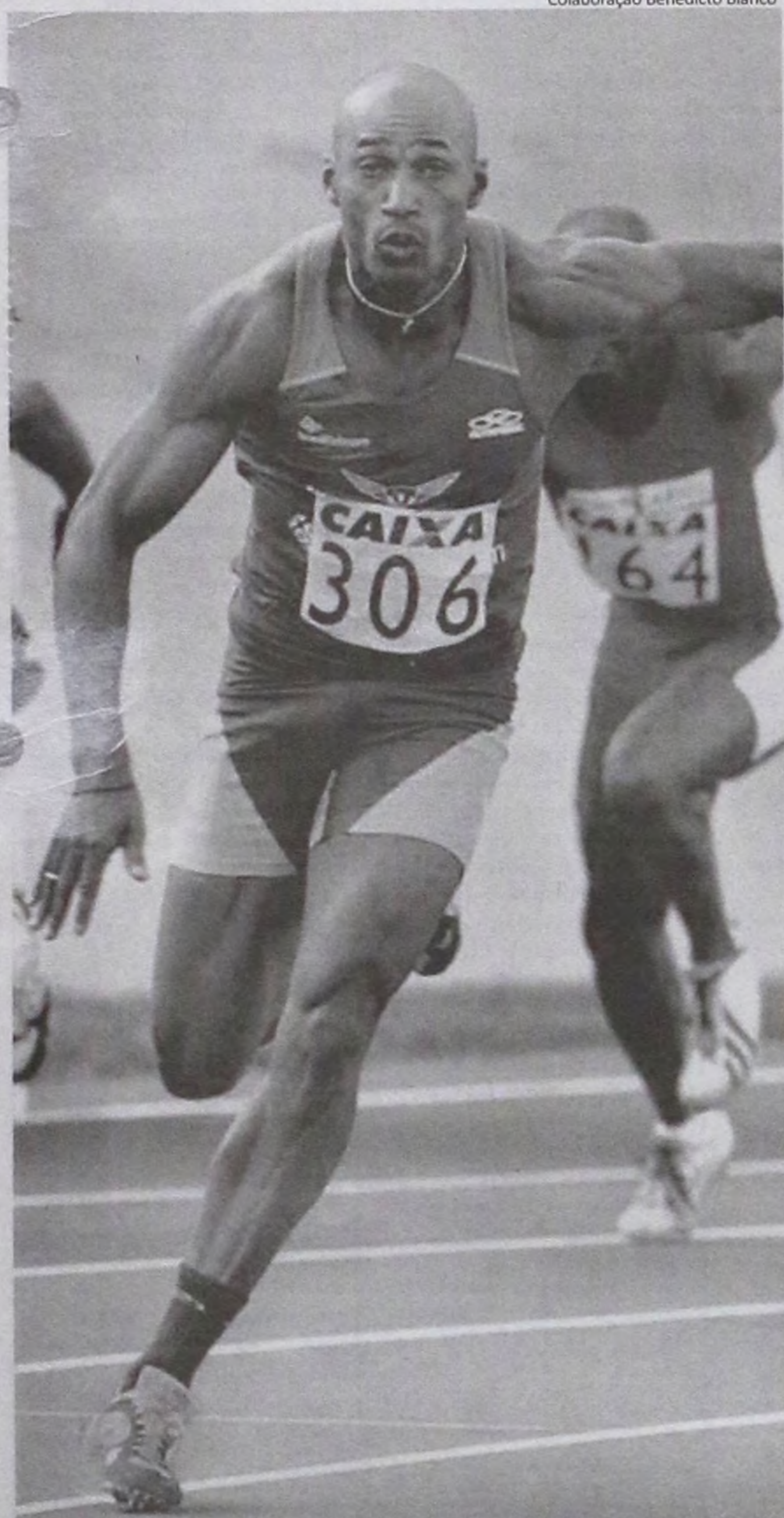
Quirino nasceu em Lençóis e foi criado em orfanato até os 17 anos

C laudinei Quirino da Silva nasceu em Lençóis Paulista, no dia 19 de novembro de 1970. Filho de pais pobres acabou morando em um orfanato toda a sua infância e parte de sua adolescência, até os dezessete anos. Devido às dificuldades que passou, quase caiu na marginalidade antes de ser descoberto por um técnico de atletismo, quando ainda trabalhava num bar na beira da estrada, então, começou treinando em Presidente Prudente, superando todos os seus problemas físicos e dificuldades financeiras, tornando-se um dos maiores velocistas brasileiros de todos os tempos. Suas especialidades eram as provas de 100m, 200m, 400m e 4x100m rasos. É detentor dos recordes sul-americanos nos 200m rasos, com a marca de 19s89, e do revezamento 4x100m rasos, pela equipe do Brasil, com a marca de 37s90. Em 2000, participou das Olimpíadas de Sydney, na Austrália, sendo até hoje, o único atleta lençoense a participar de uma olimpíada.