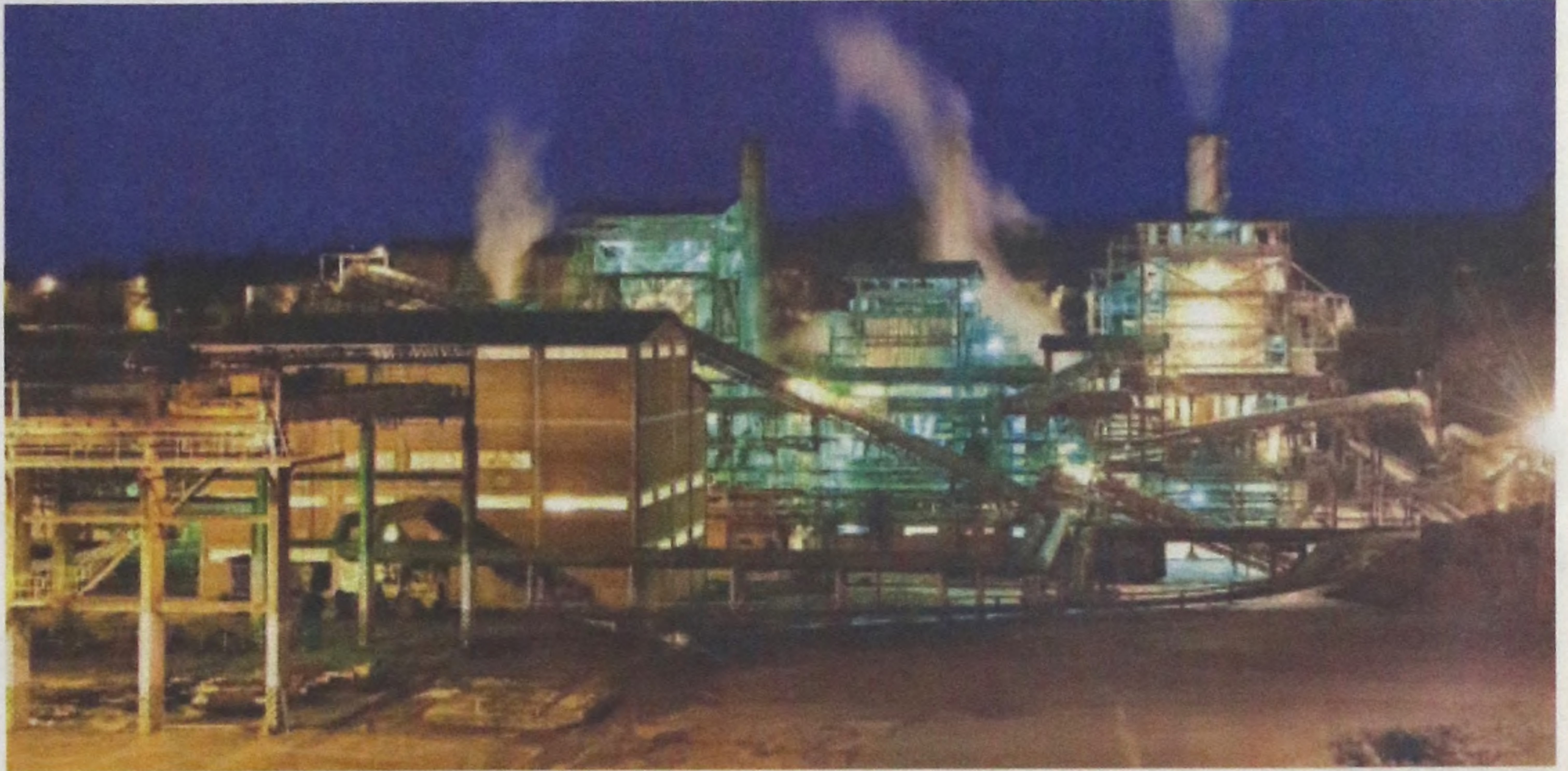
As vagas estão distribuídas entre as três unidades. Na foto vista geral da Usina Barra Grande

Os estagiários serão acompanhados pelos gestores da Zilor e farão parte de um Programa de Desenvolvimento em que receberão orientações sobre Mercado de Trabalho e Carreira; Ética, Postura Profissional e Comunicação; Noções de Planejamento e Administração do Tempo; Atitude Empreendedora; Relacionamento Interpessoal e Trabalho em Equipe.