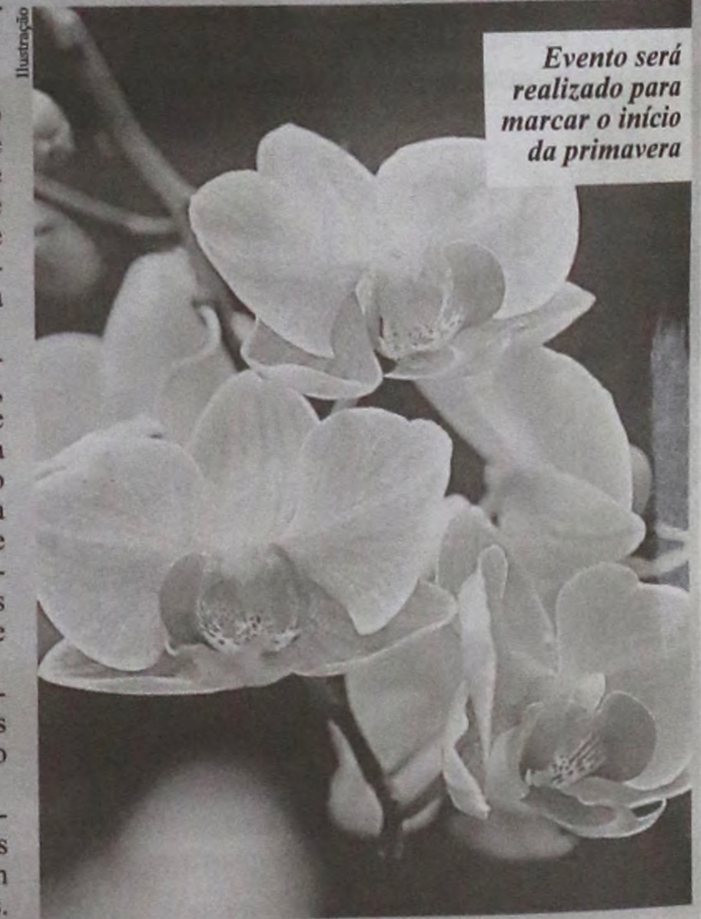
Evento será realizado para marcar o início da primavera

A variedade de espécies, cores e tamanhos das orquídeas prometem impressionar os visitantes.