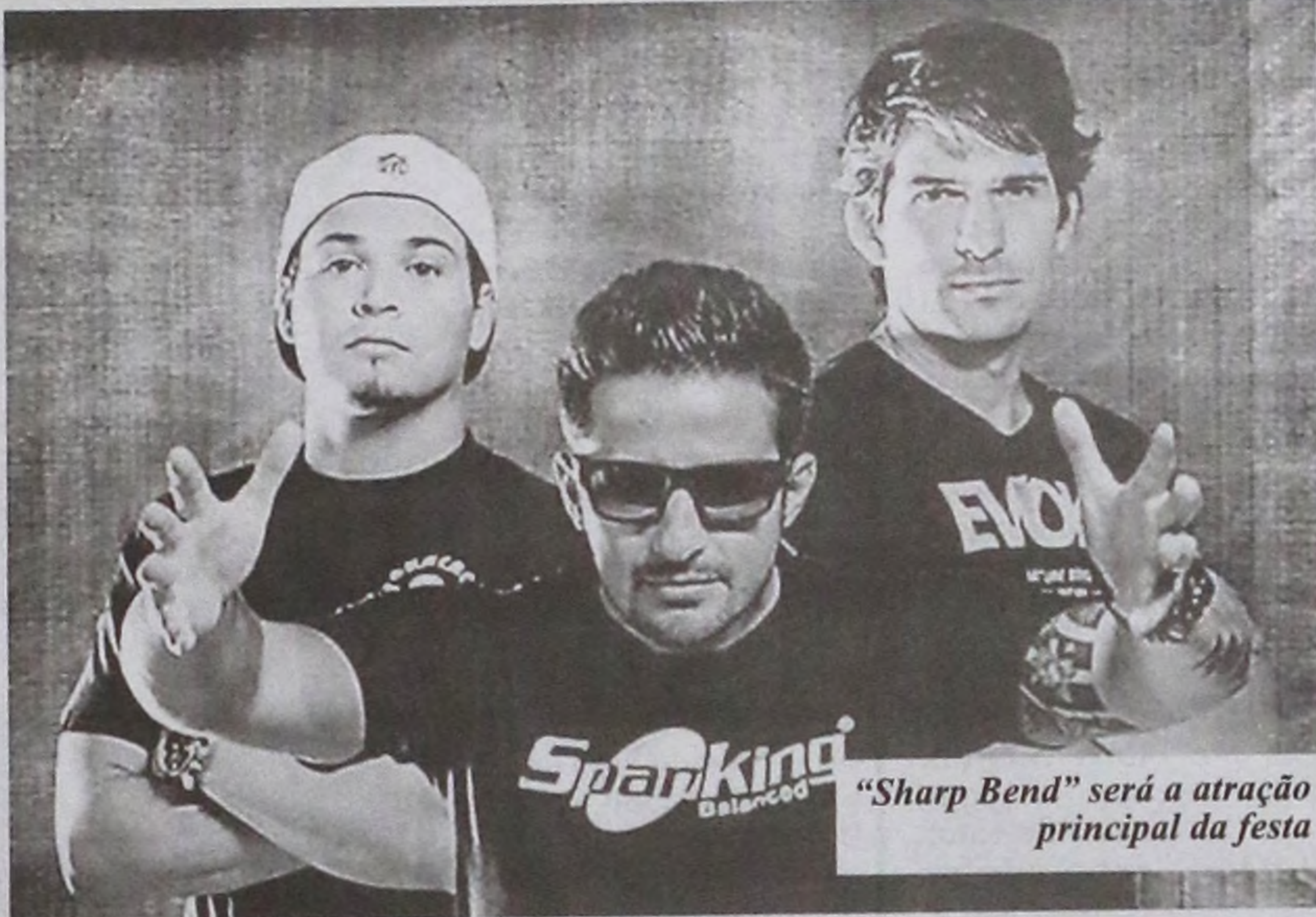
“Sharp Bend” será a atração principal da festa

A grande atração da noite fica por conta da “Sharp Bend”, um projeto