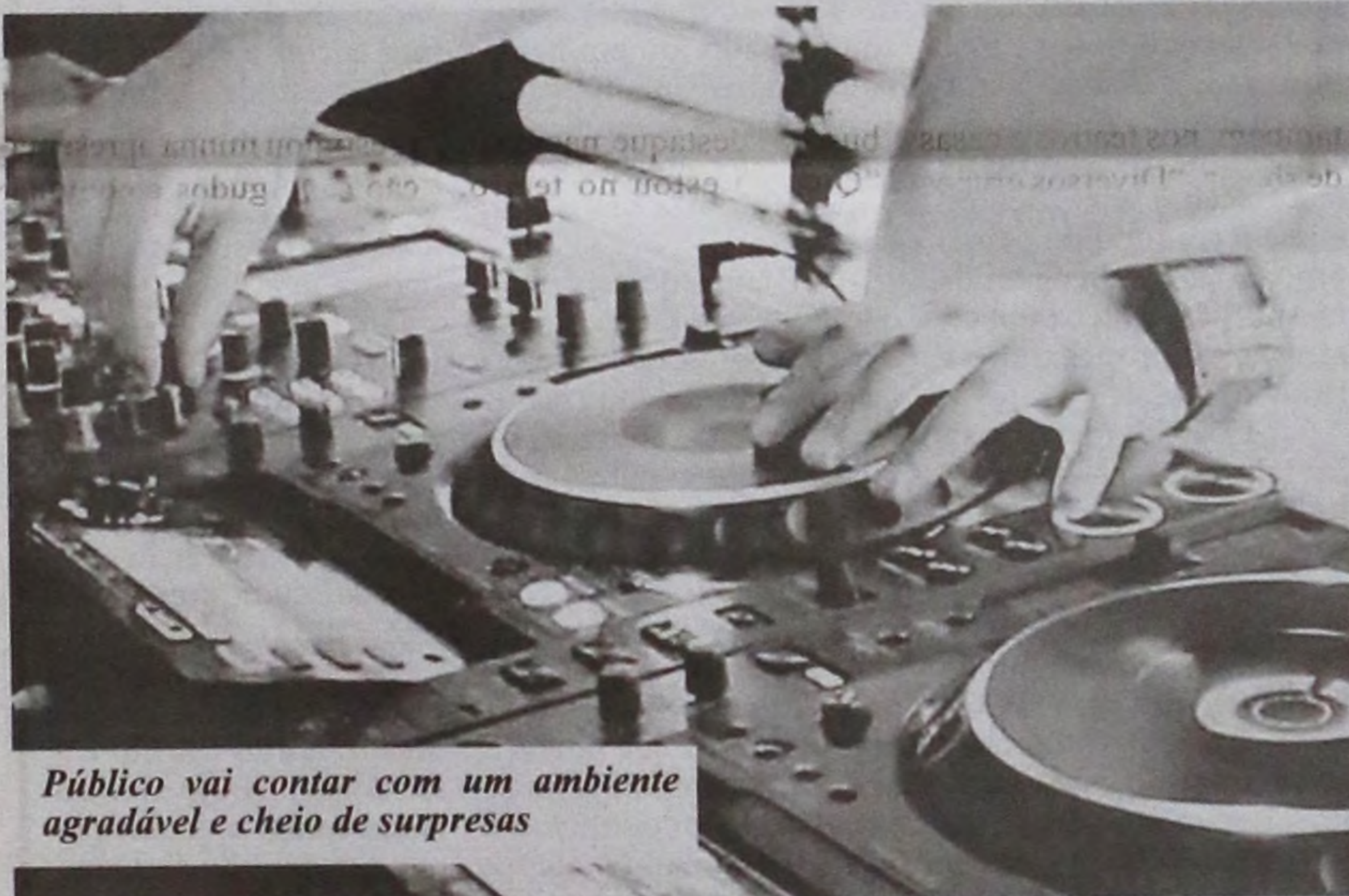
Público vai contar com um ambiente agradável e cheio de surpresas

“Only Black Sunset” em Lençóis Paulista Quando: 25 de outubro Onde: Sítio Fazenda Nova Horário: 22h Valor: R$ 40 / Portaria R$ 50 Informações e vendas de convites: (14) 9 8805-6495 *Não será permitida entrada de menores de 18 anos