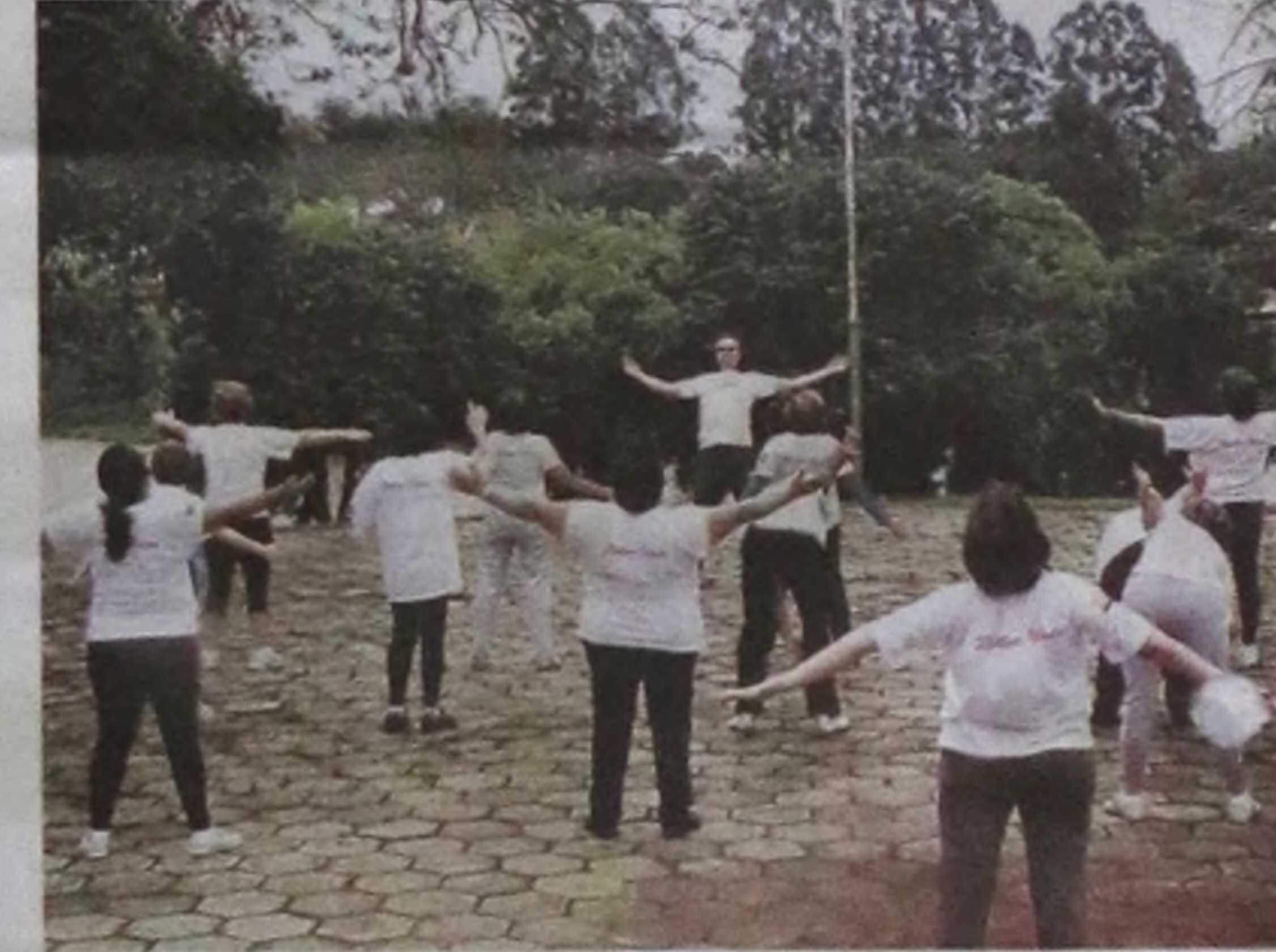
Momentos de muita paz no parque