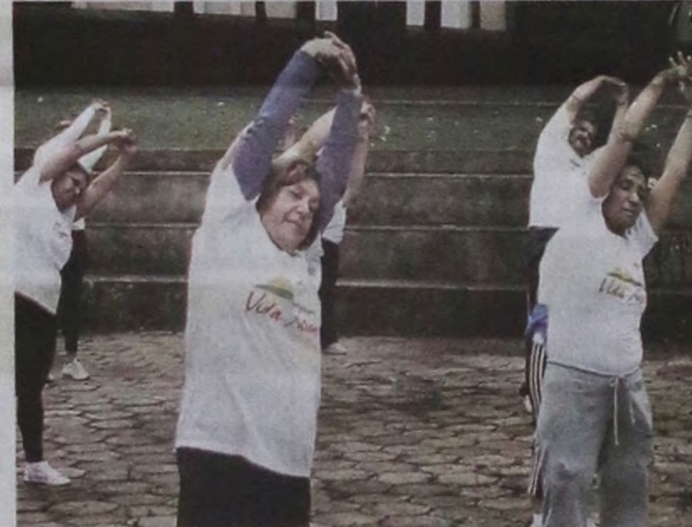
Participantes aproveitaram a aula ao ar livre