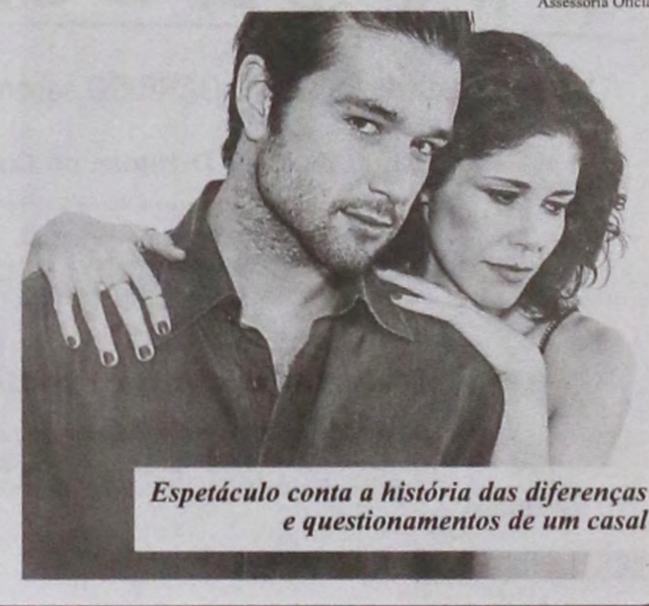
Espectáculo conta a história das diferenças e questionamentos de um casal