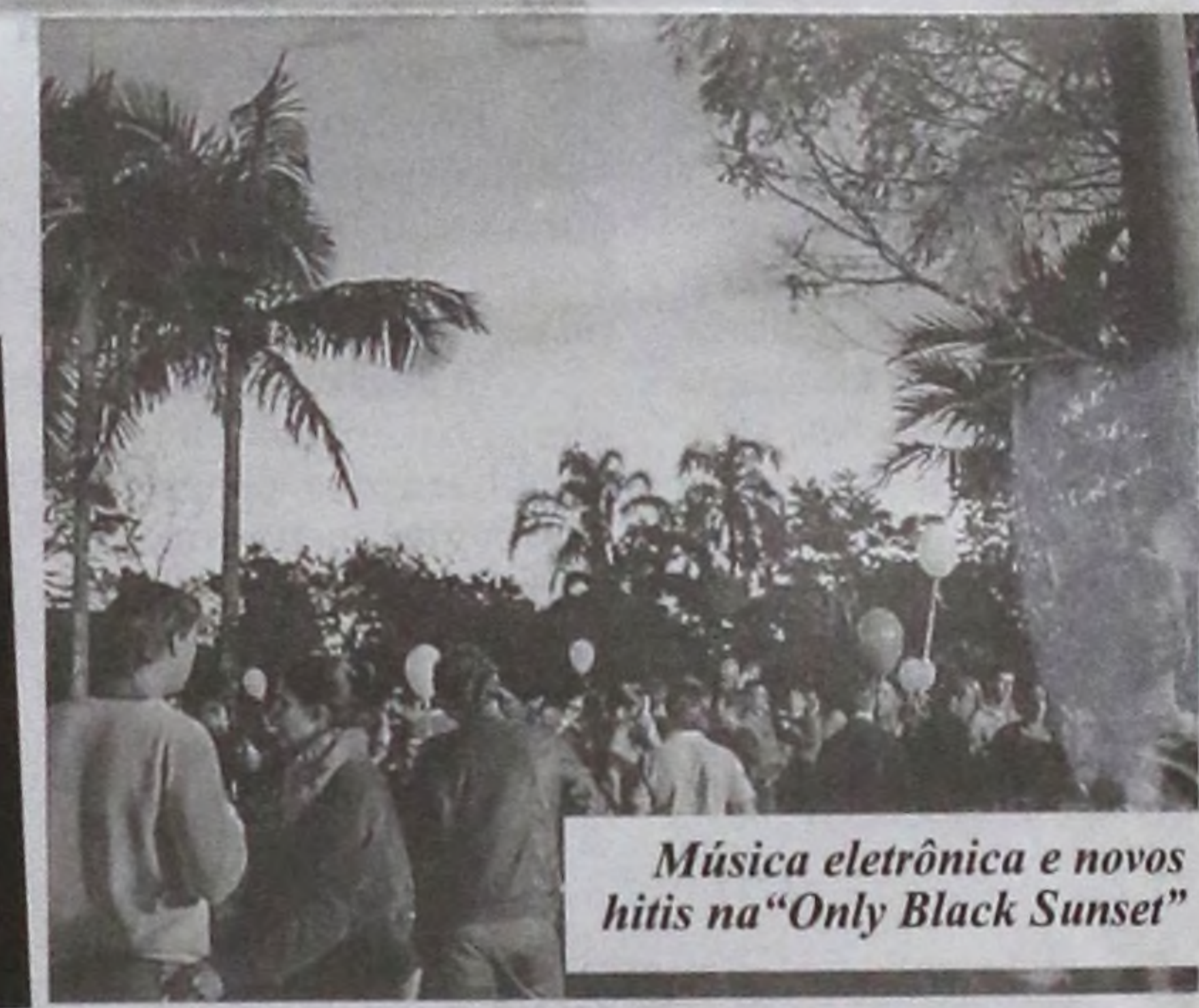
Música eletrônica e novos hits na “Only Black Sunset”

As informações acima foram obtidas dos atos oficiais do Diário Oficial do Estado, Portais Transparência da Prefeitura, Câmara, SAAE, IPREM e CMFP.