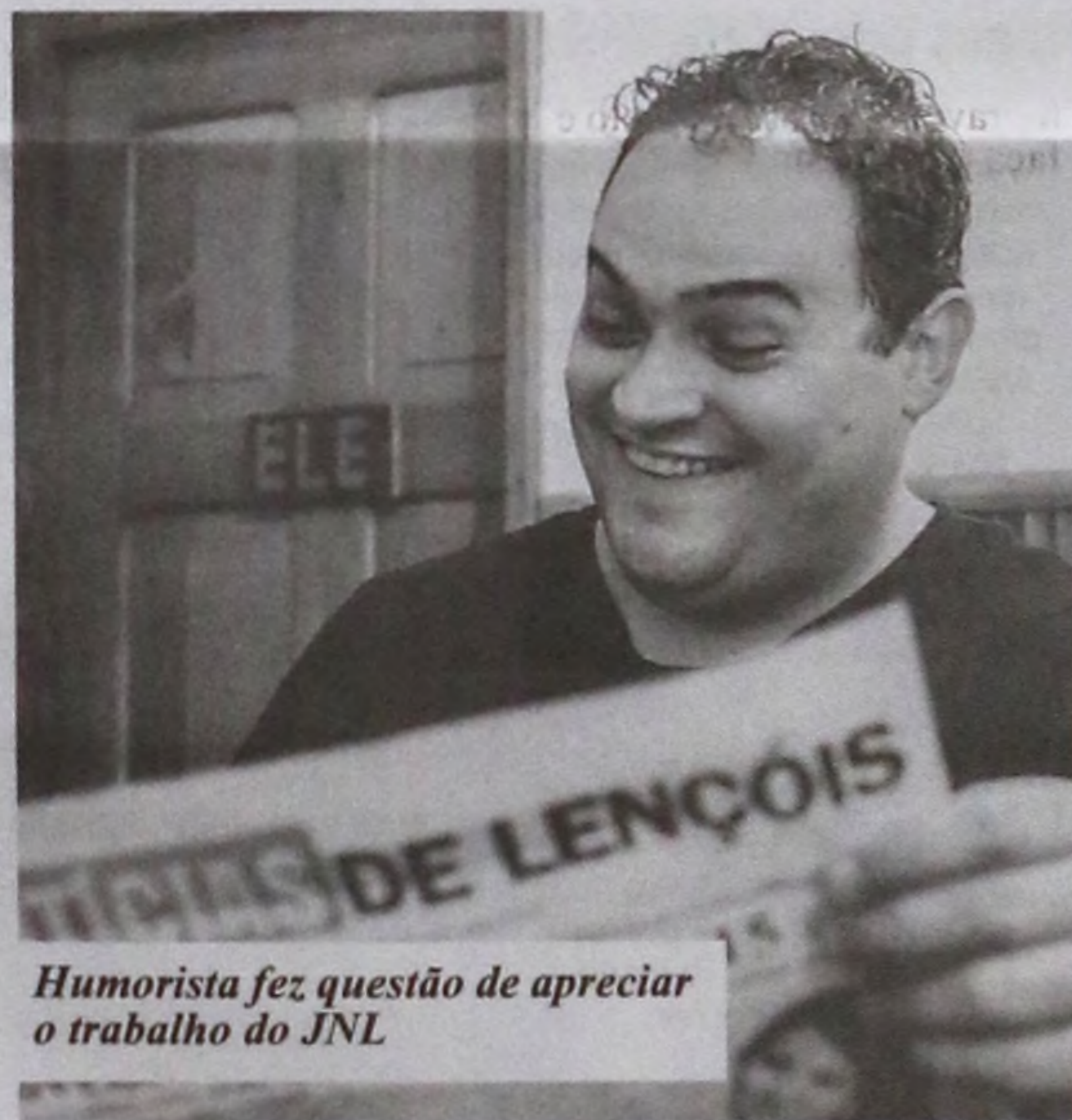
Humorista fez questão de apreciar o trabalho do JNL

Para ele, fazer uma apresentação no formato stand-up é fácil quando existe a participação do público. "Geralmente o show tem duração mínima de uma hora e meia, mas quando a plateia interage, a gente acaba se estendendo e tudo vira uma grande brincadeira. Em