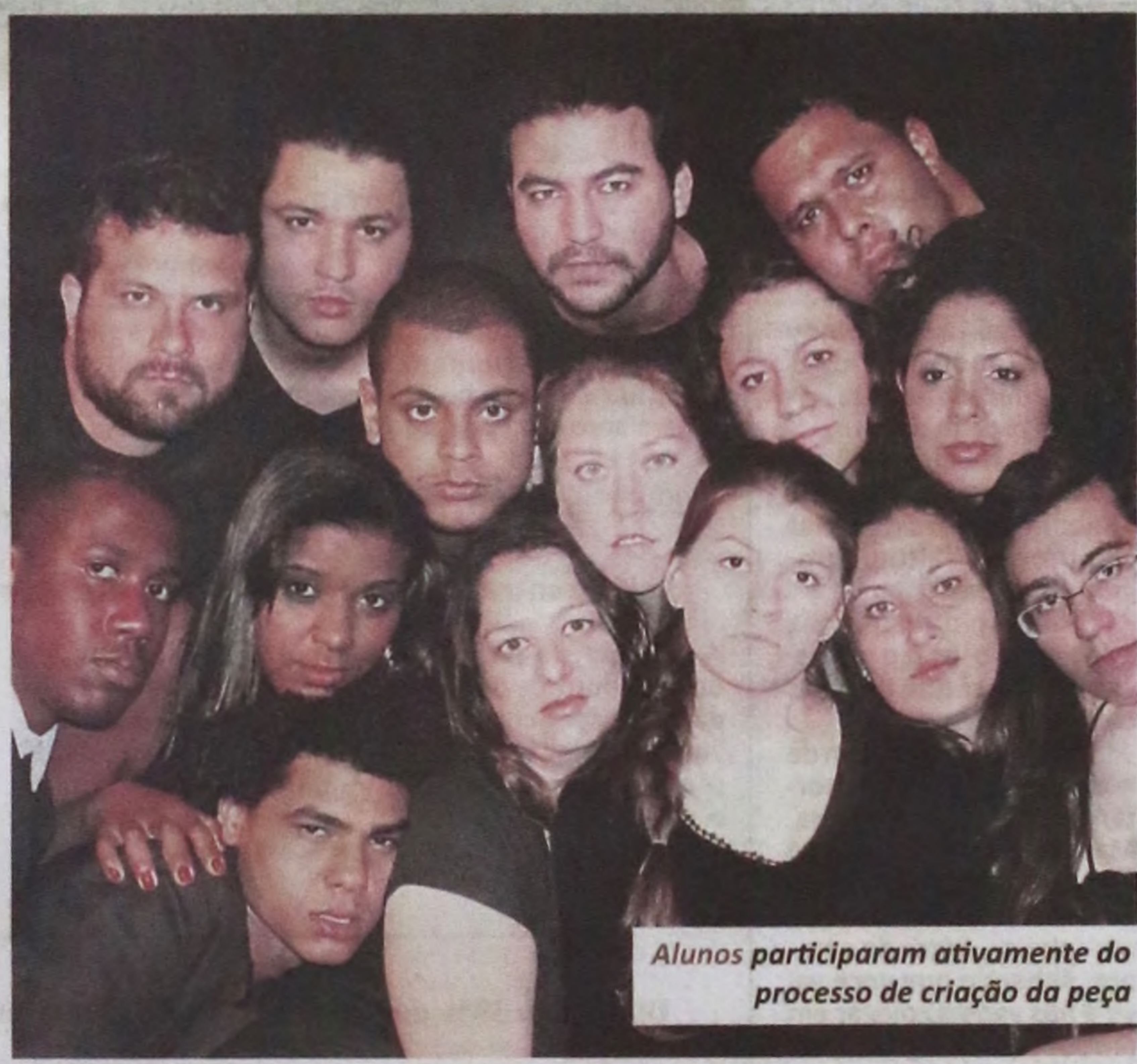
Alunos participaram ativamente do processo de criação da peça