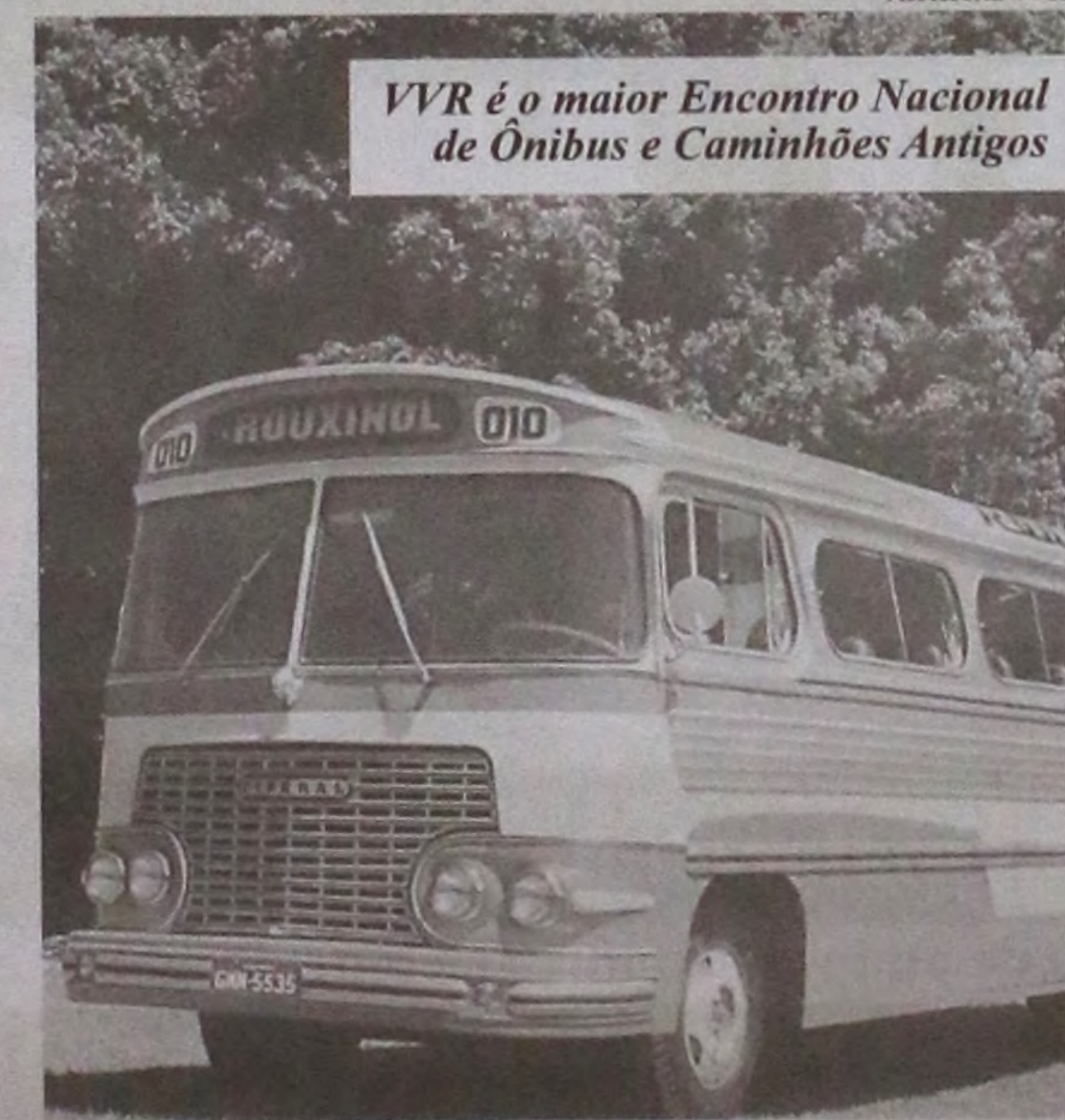
VVR é o maior Encontro Nacional de Ônibus e Caminhões Antigos