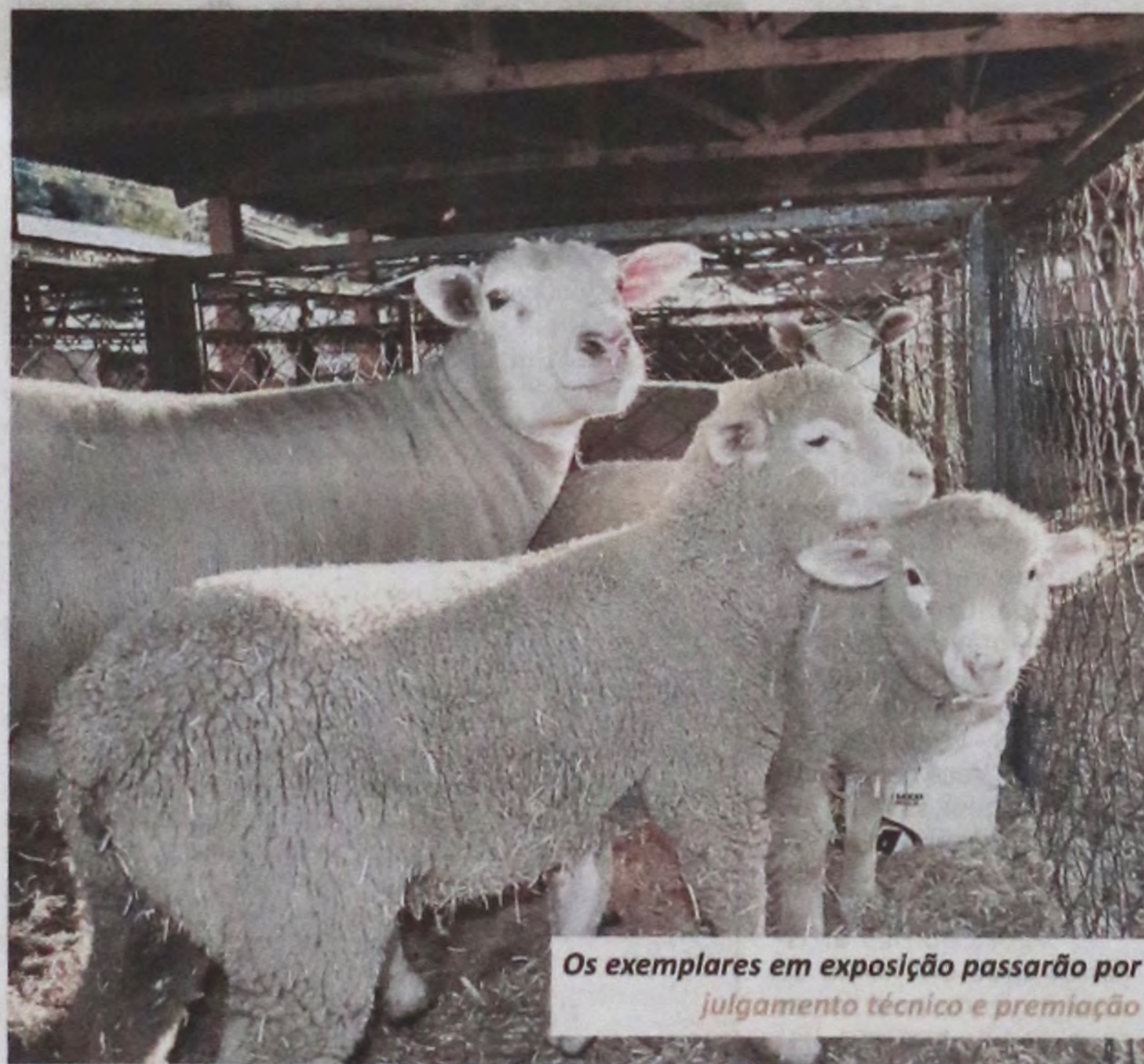
Os exemplares em exposição passarão por julgamento técnico e premiação