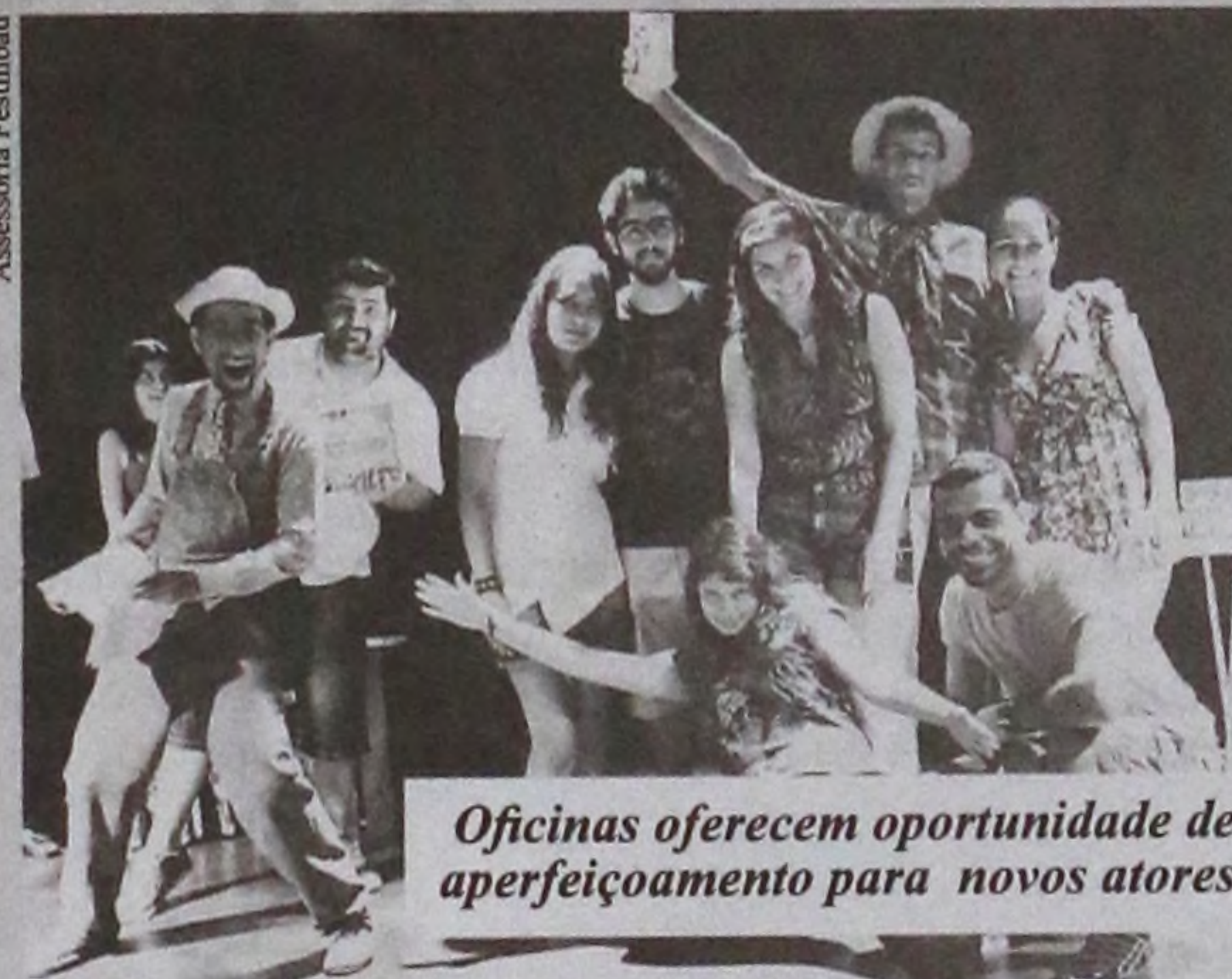
Oficinas oferecem oportunidade de aperfeiçoamento para novos atores

O Festibau é uma realização da Casa de Cultura