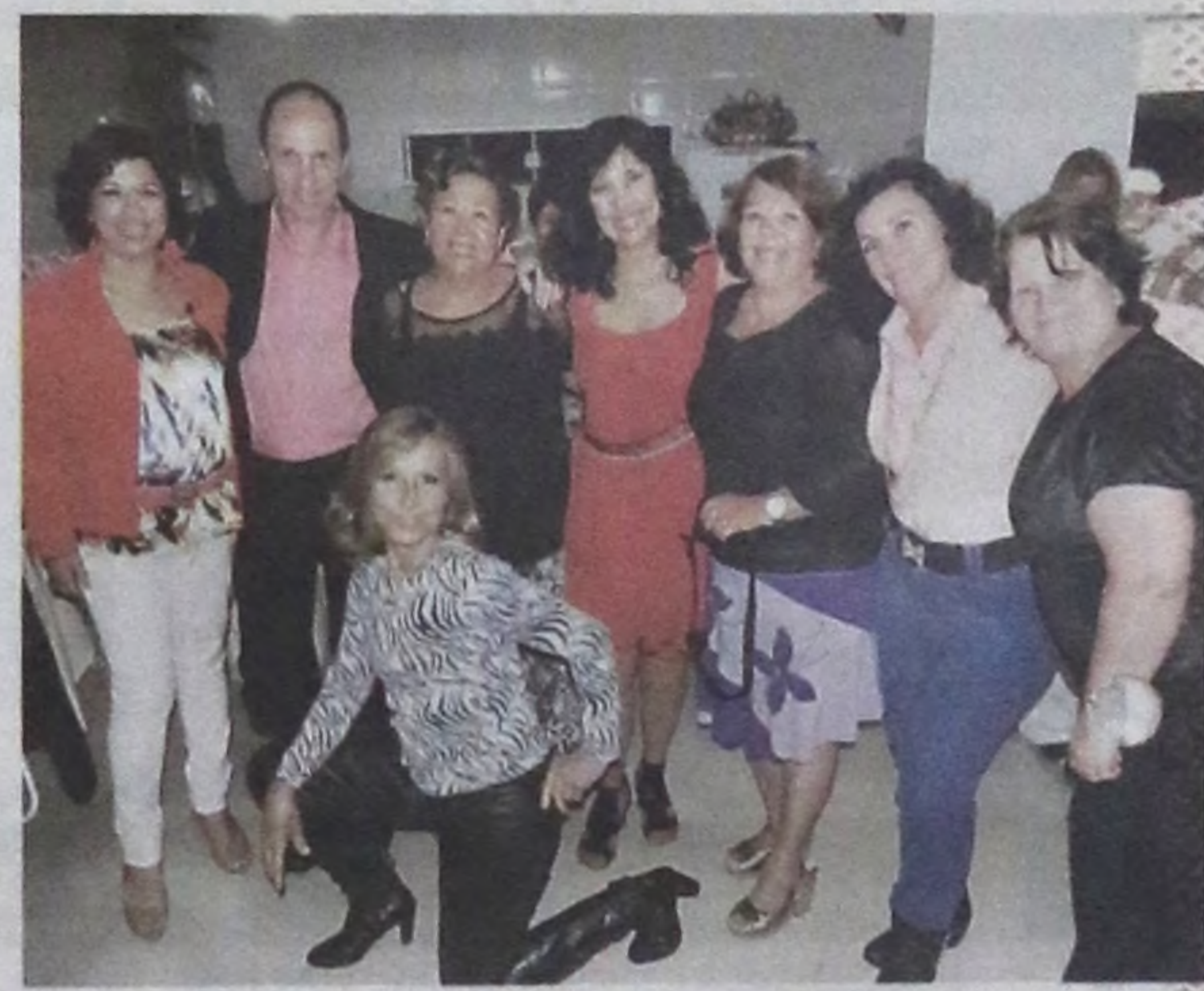
Deise contou com a companhia de vários amigos