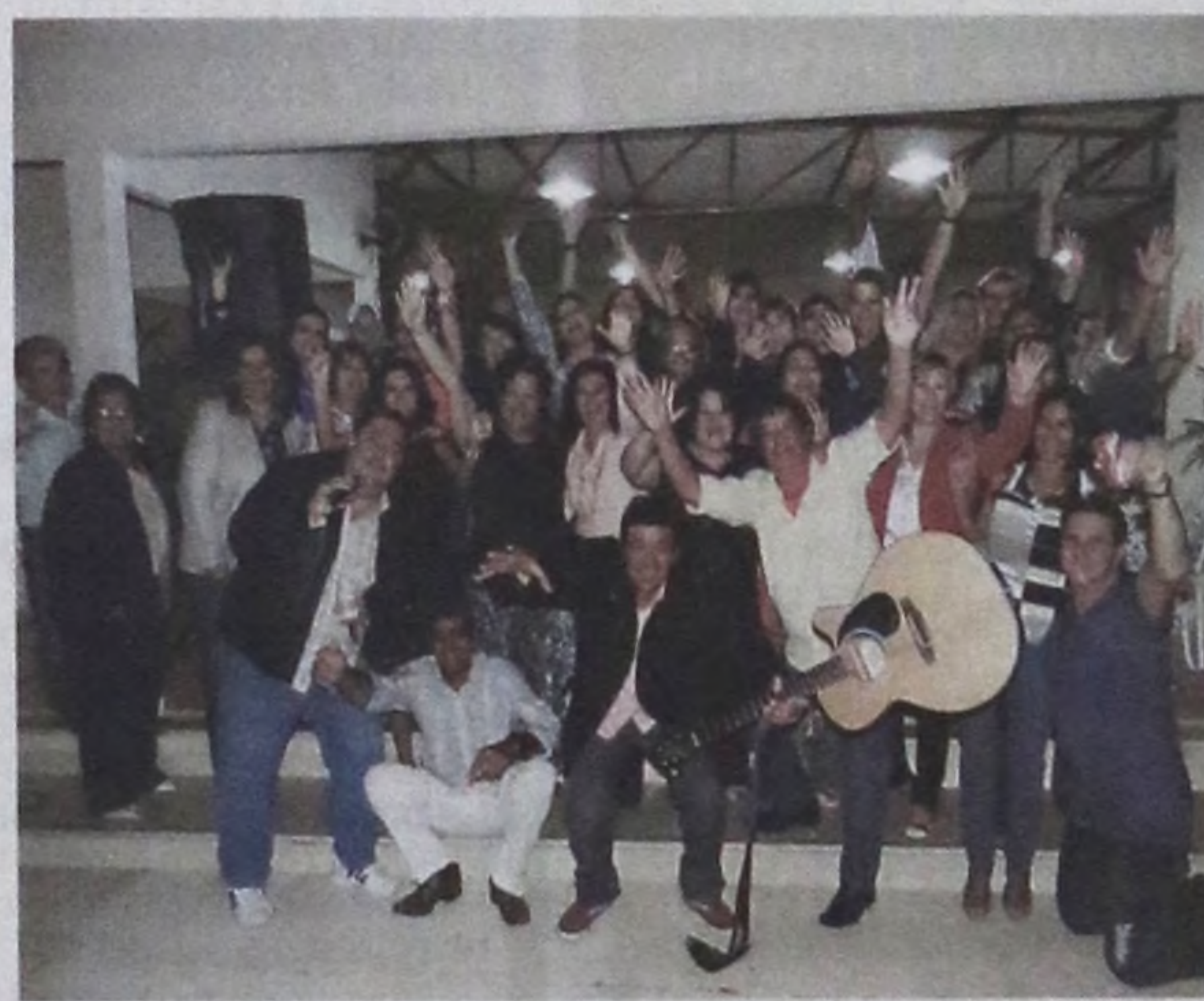
Galera animada no aniversário da empresária