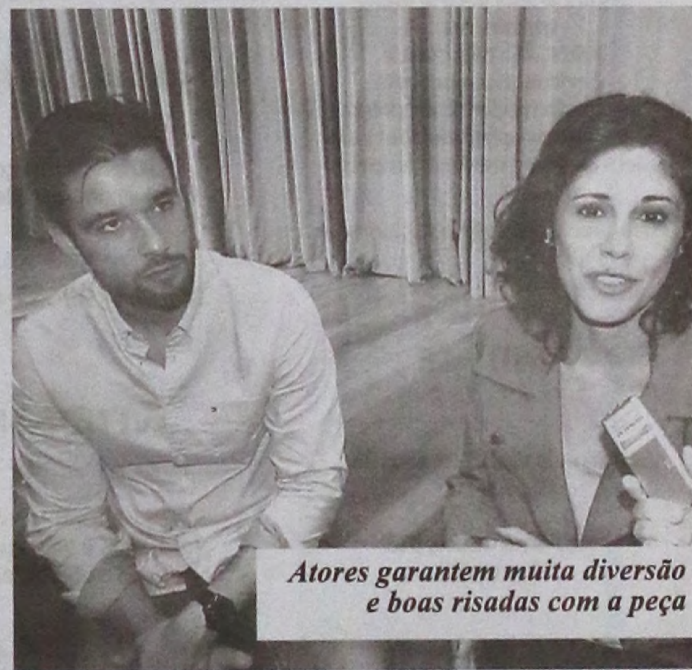
Atores garantem muita diversão e boas risadas com a peça

"Venham ver a peça quando estivermos na cidade de vocês. Garantimos muita diversão e risadas. É uma história de amor deliciosa", finalizam os atores.