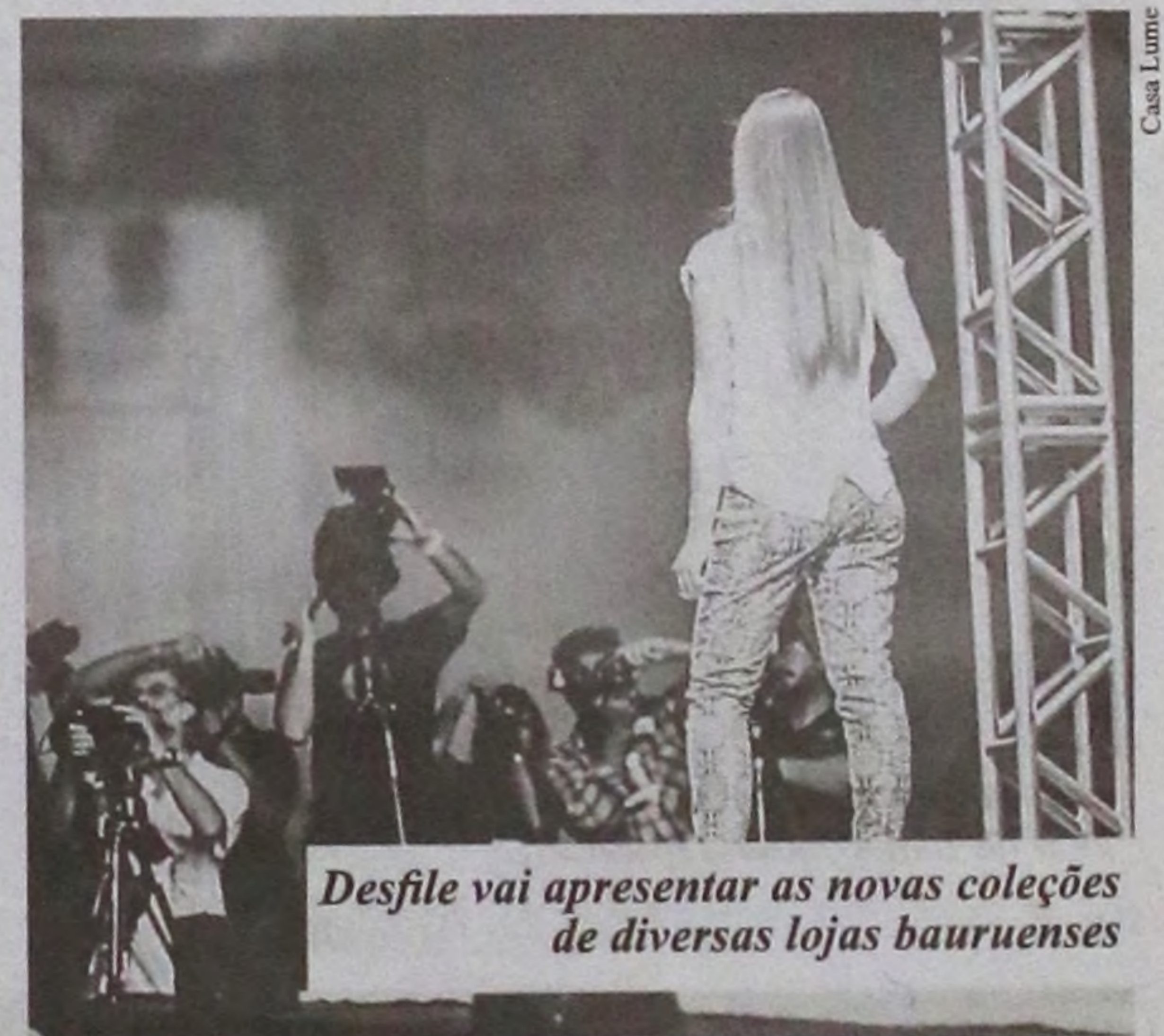
Desfile vai apresentar as novas coleções de diversas lojas bauruenses