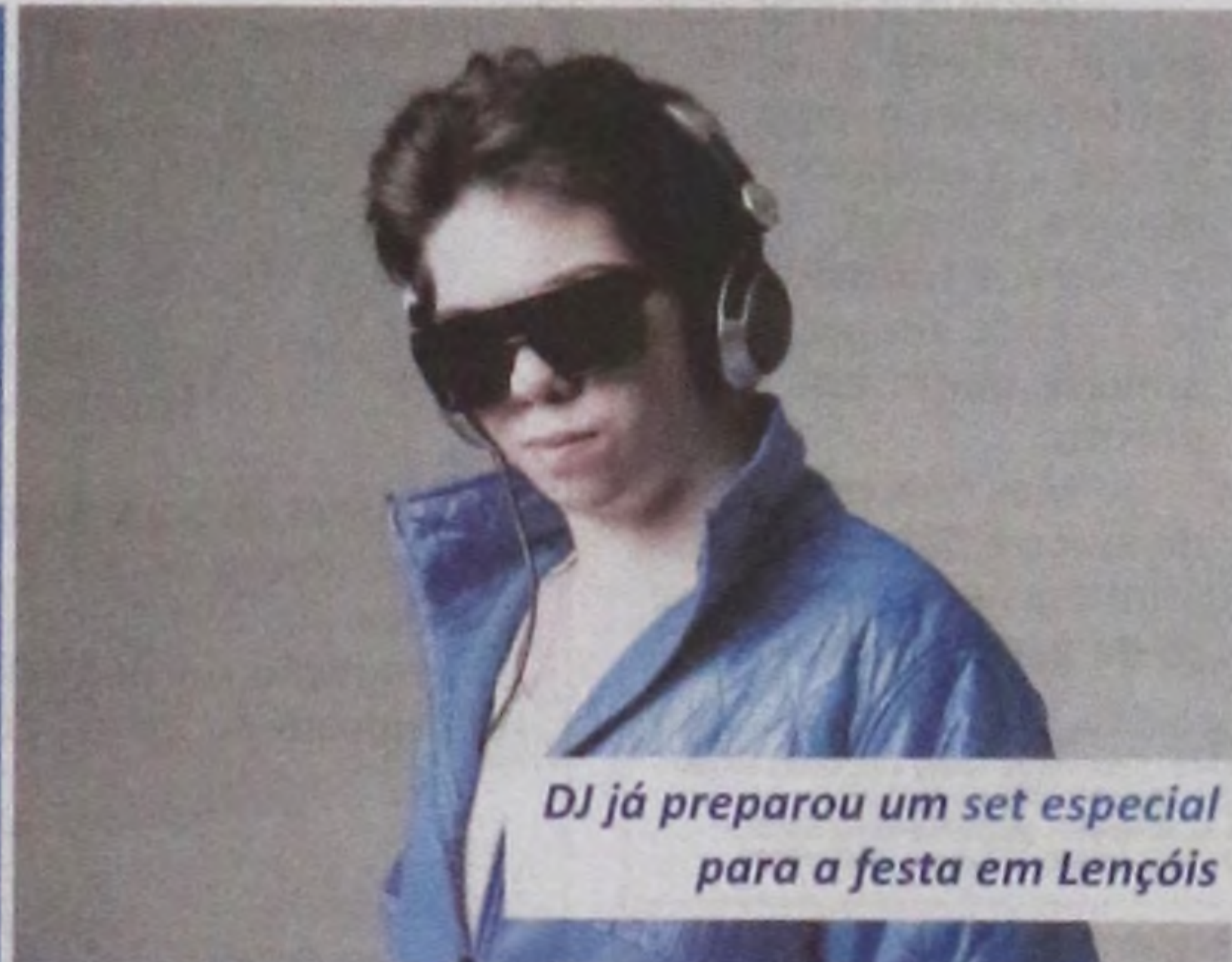
DJ já preparou um set especial para a festa em Lençóis

Desde então, o jovem se apaixonou pela música eletrônica e vem conquistado seu