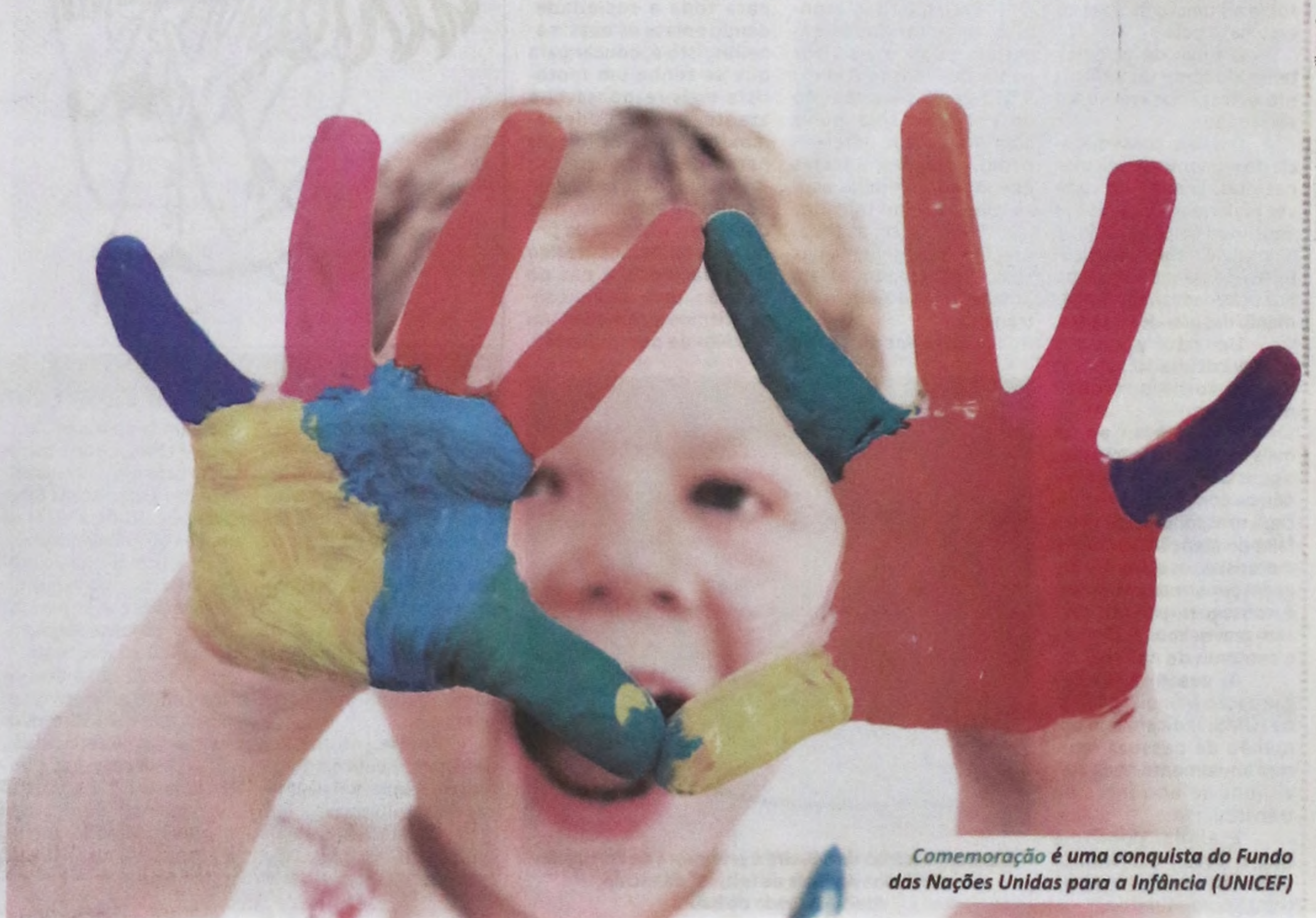
Comemoração é uma conquista do Fundo das Nações Unidas para a Infância (UNICEF)