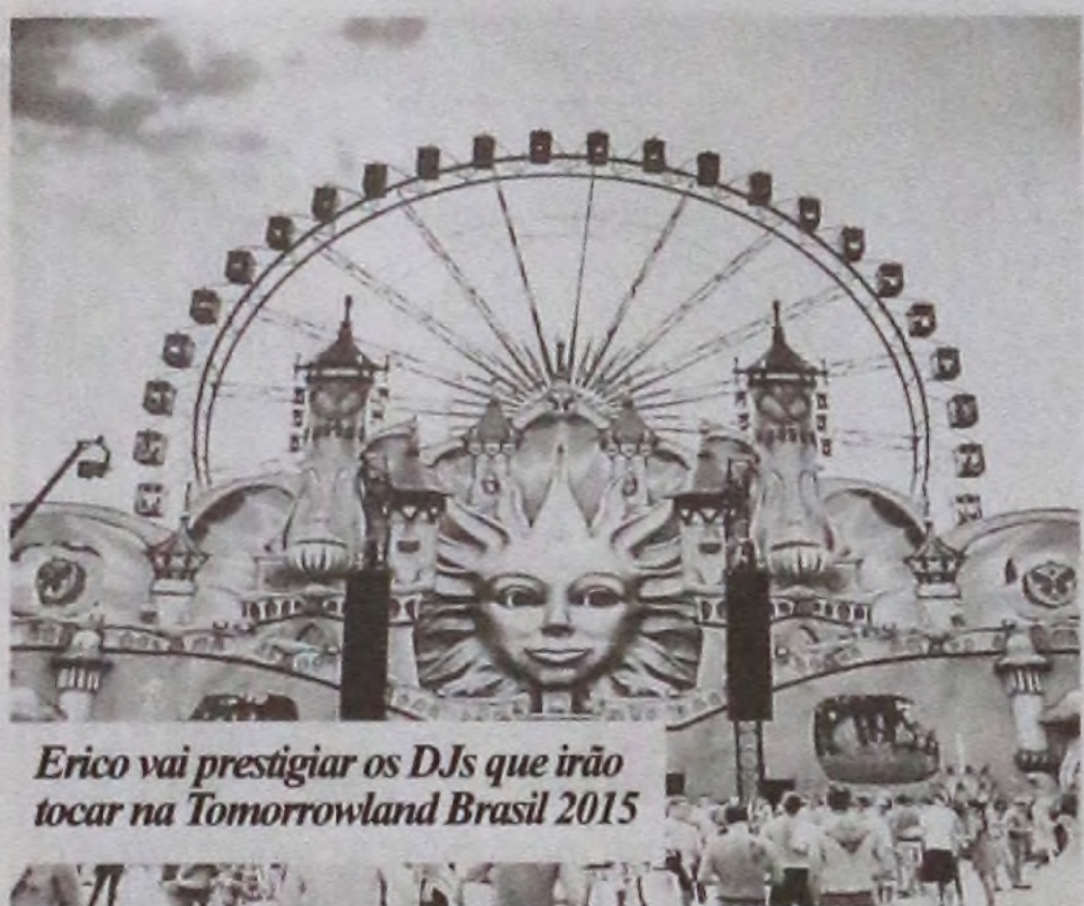
Erico vai prestigiar os DJs que irão tocar na Tomorrowland Brasil 2015

"Seguir a carreira como DJ não é fácil. É preciso dedicação e, principalmente, gostar muito do que faz", finaliza o DJ.