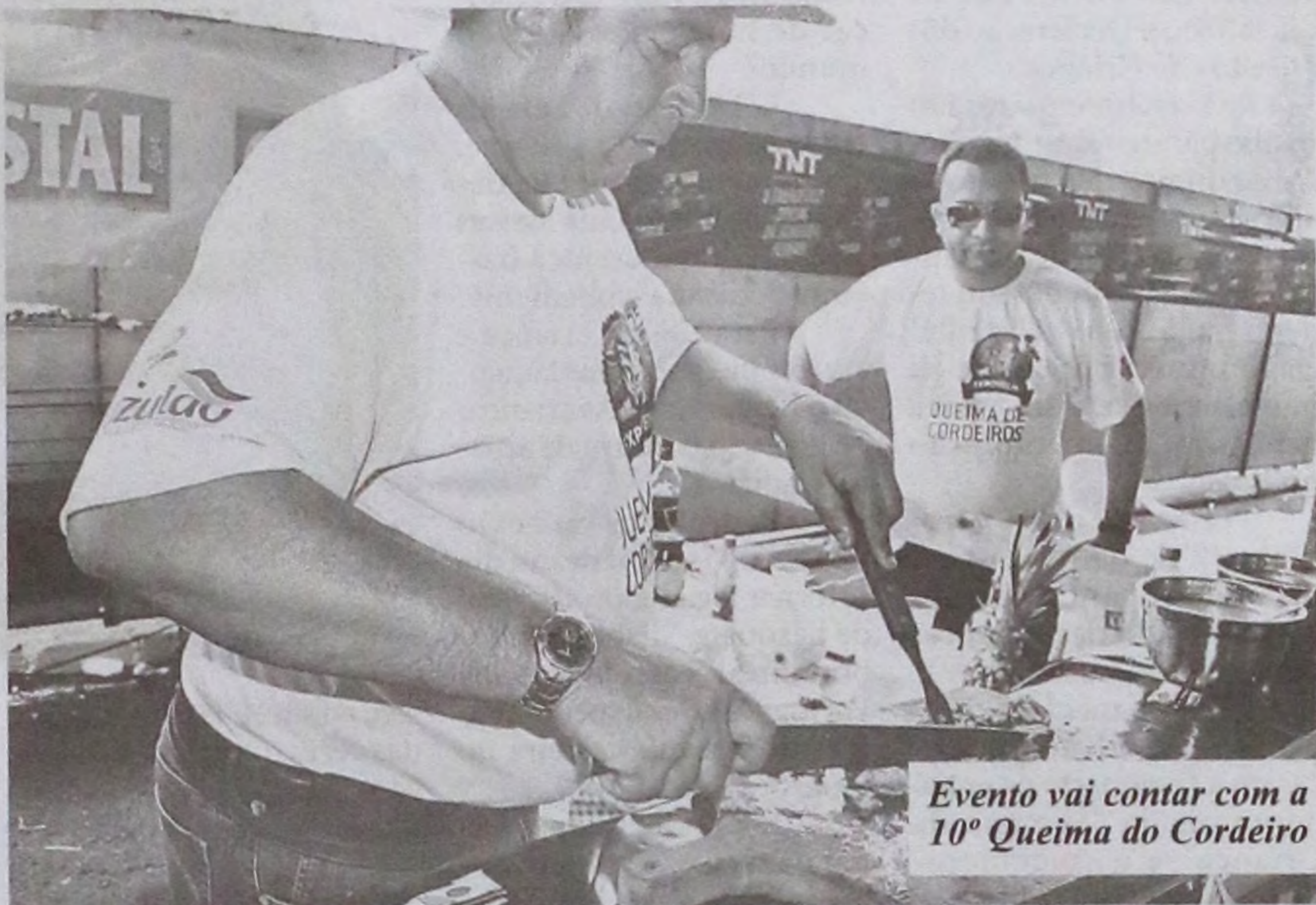
Evento vai contar com a 10ª Queima do Cordeiro

Ao lado da série de eventos técnicos - que in-