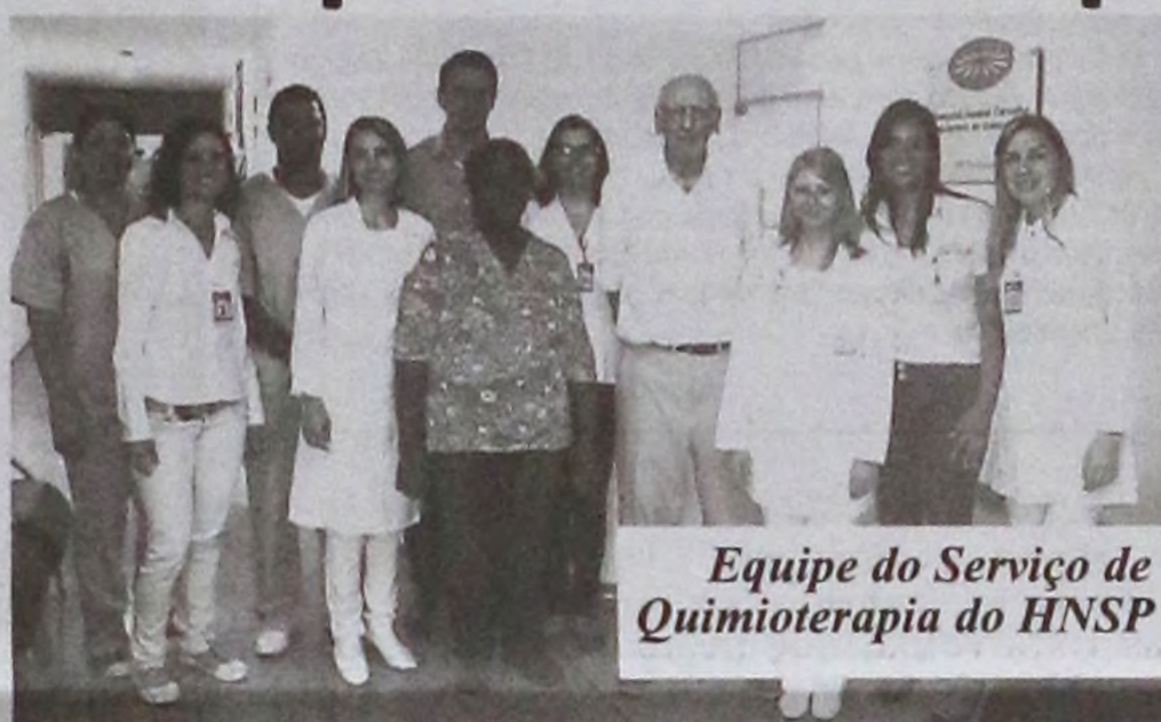
Equipe do Serviço de Quimioterapia do HNSP