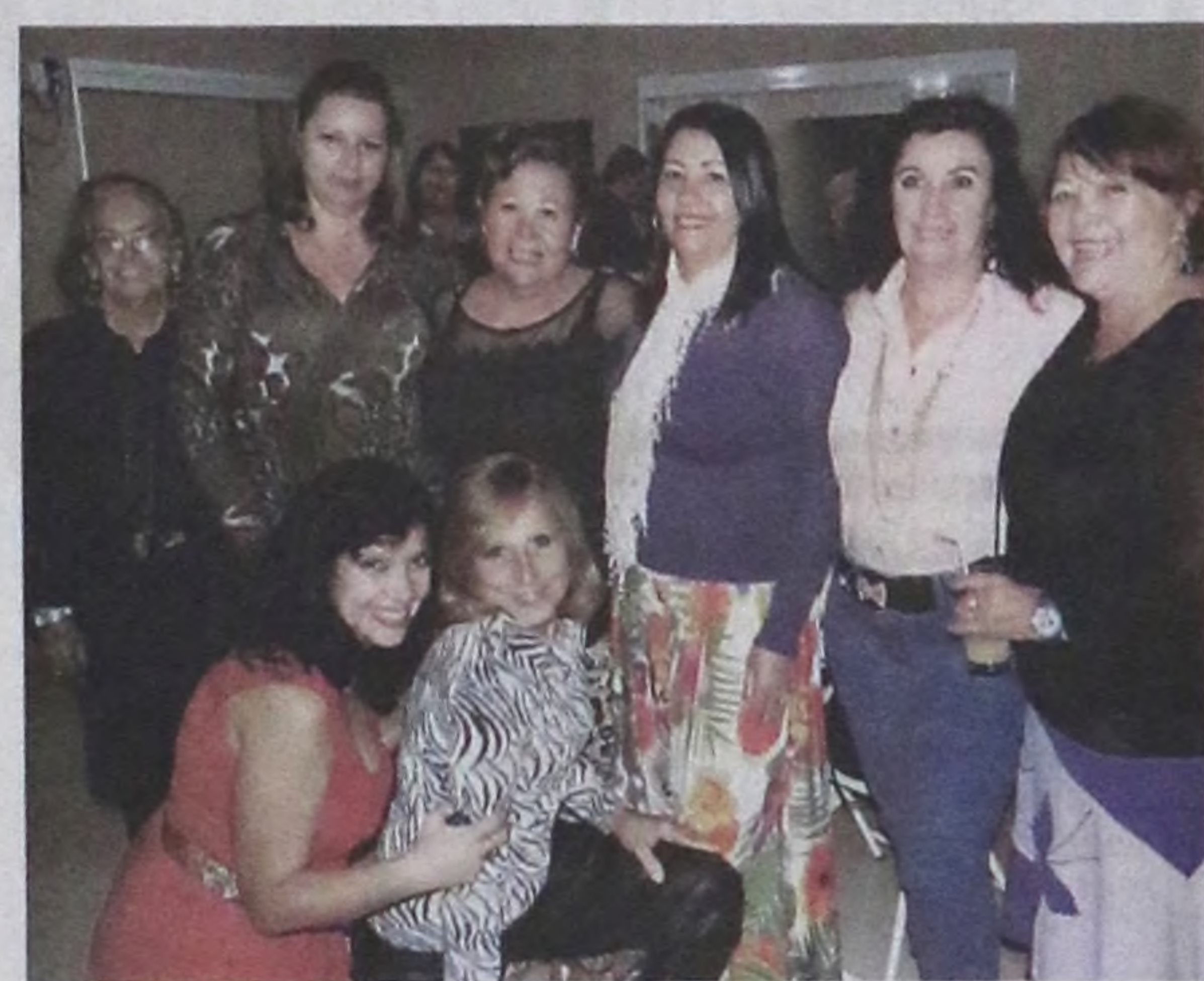
Amigas posam para a foto sorridentes