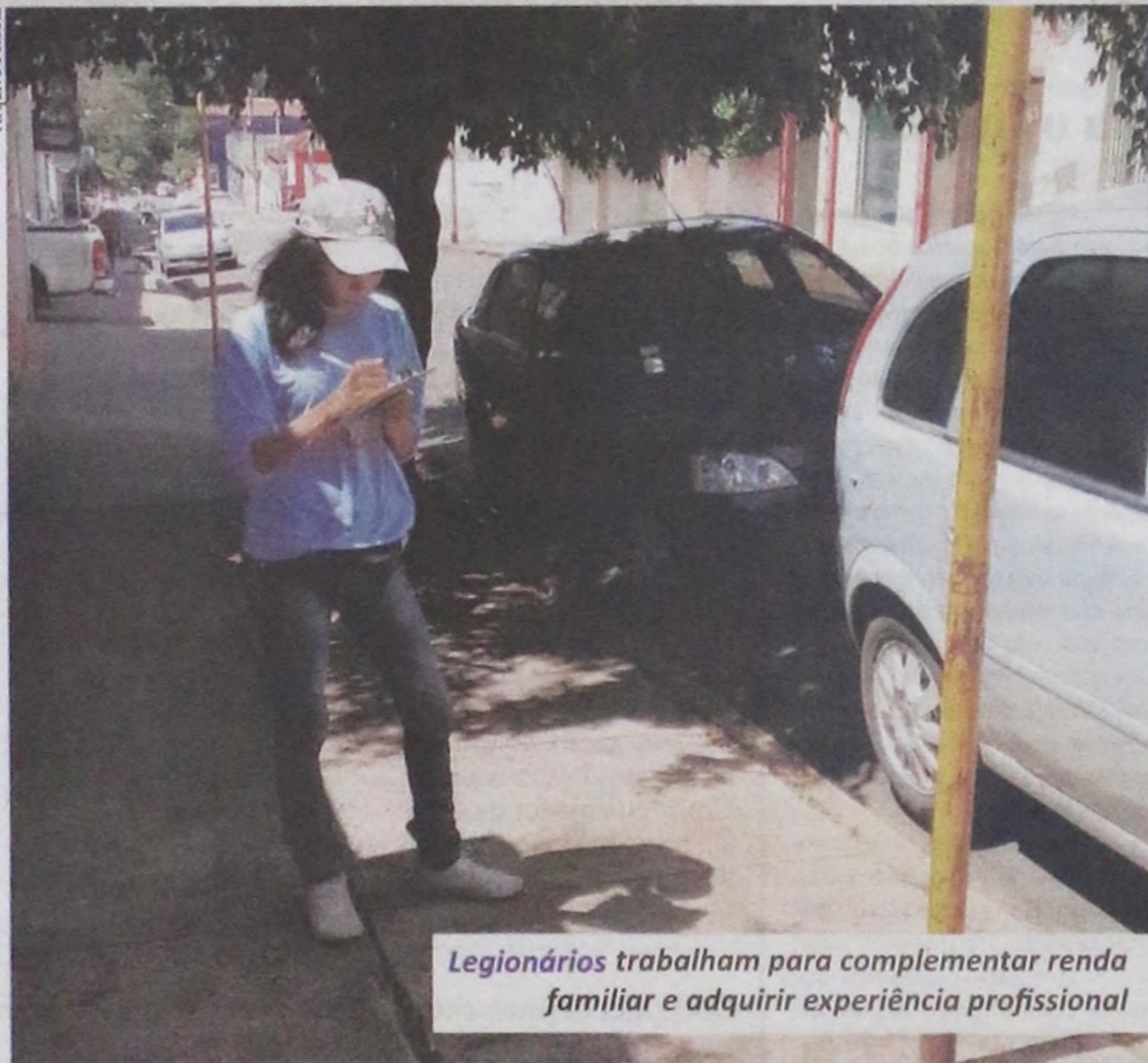
Legionários trabalham para complementar renda familiar e adquirir experiência profissional