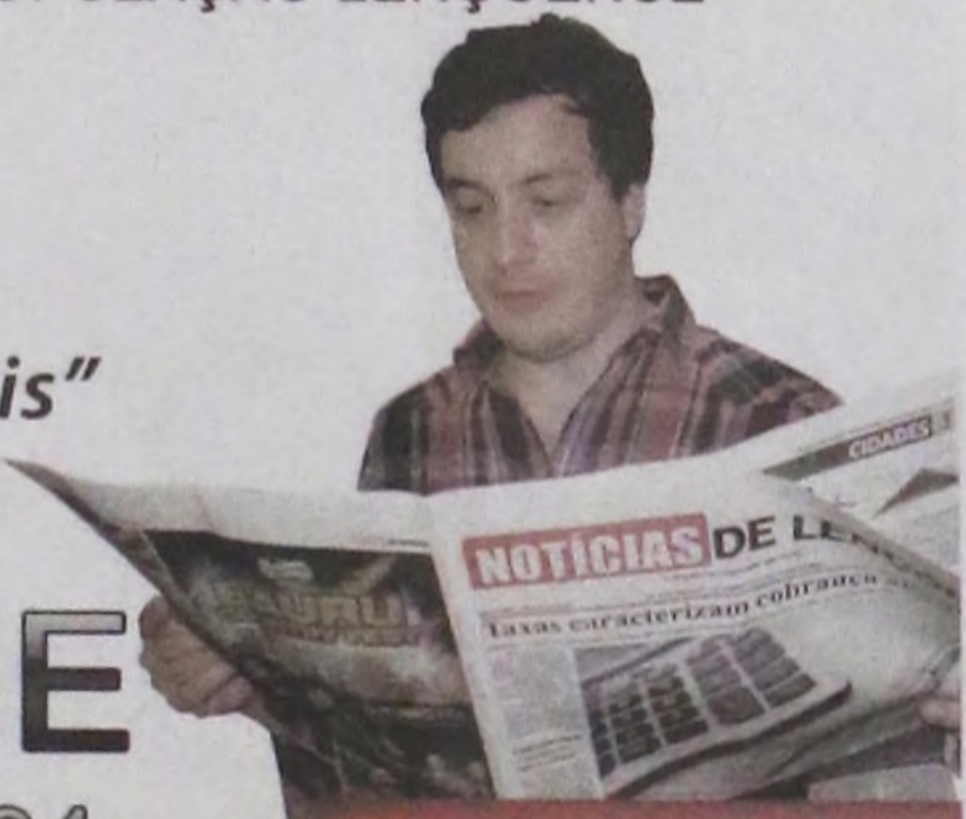
Rafael Cortez Humorista