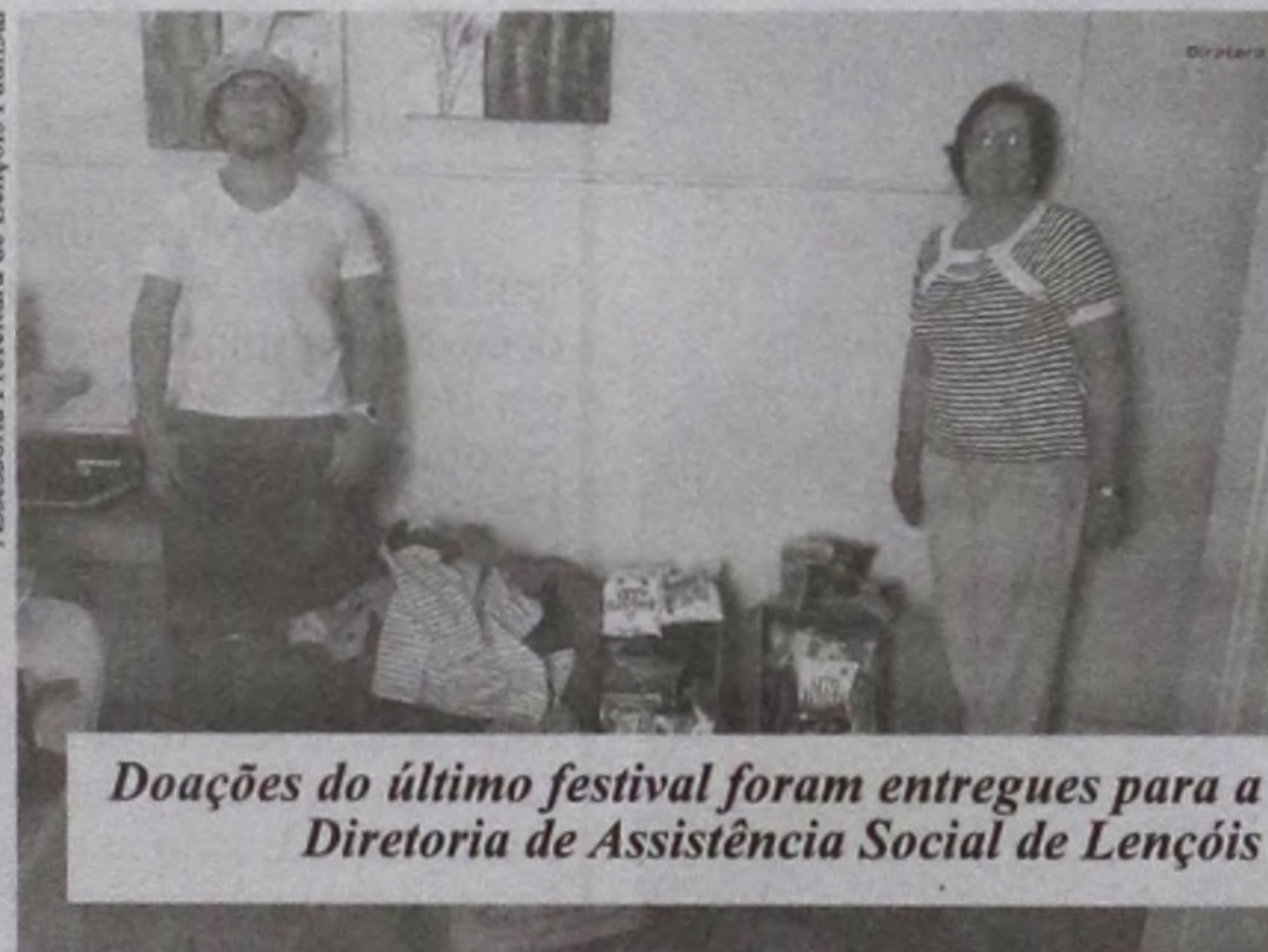
Doações do último festival foram entregues para a Diretoria de Assistência Social de Lençóis

O próximo passo para os organizadores do evento é a realização do festival solidário na cidade de Bauru.