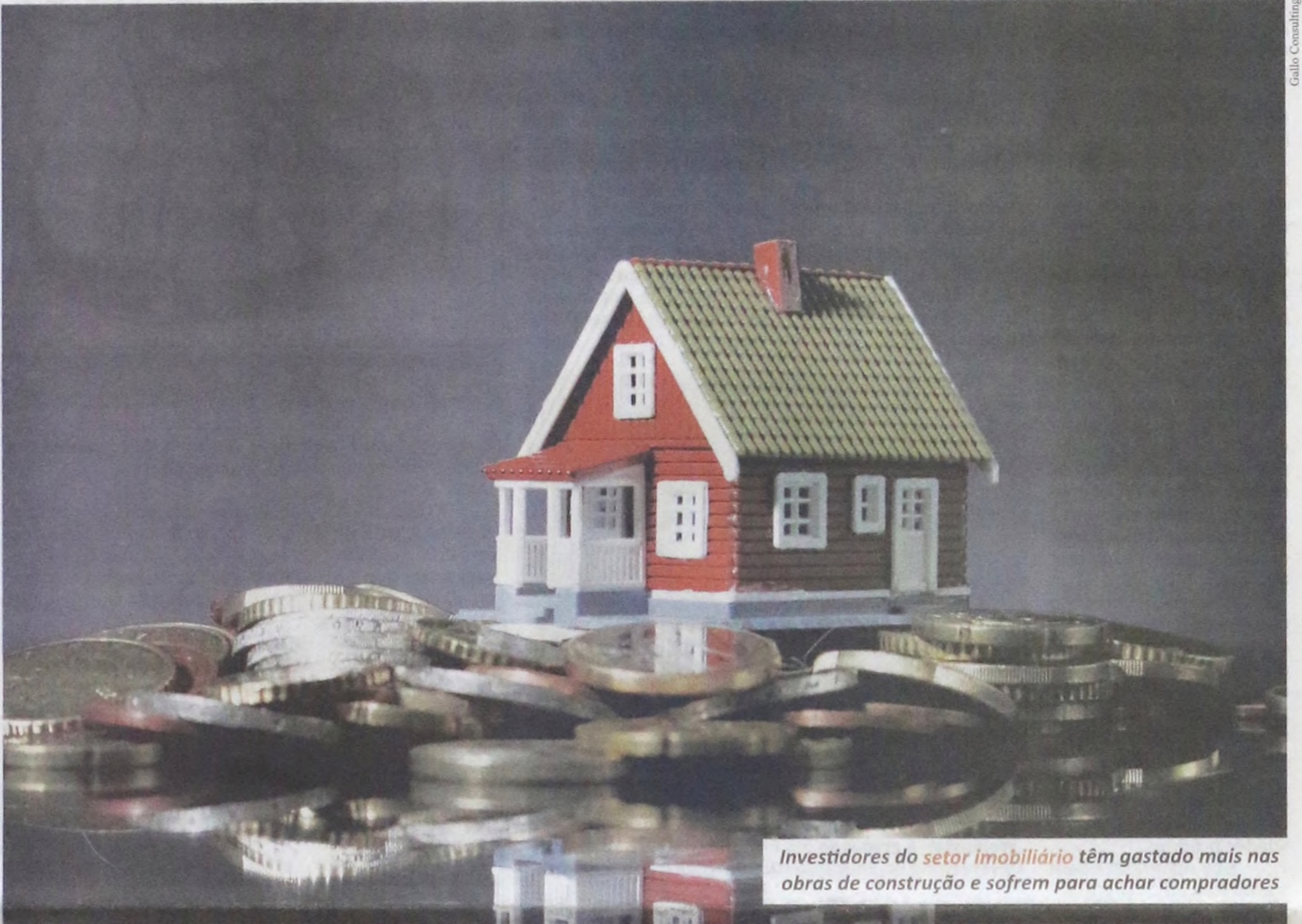
Investidores do setor imobiliário têm gastado mais nas obras de construção e sofrem para achar compradores