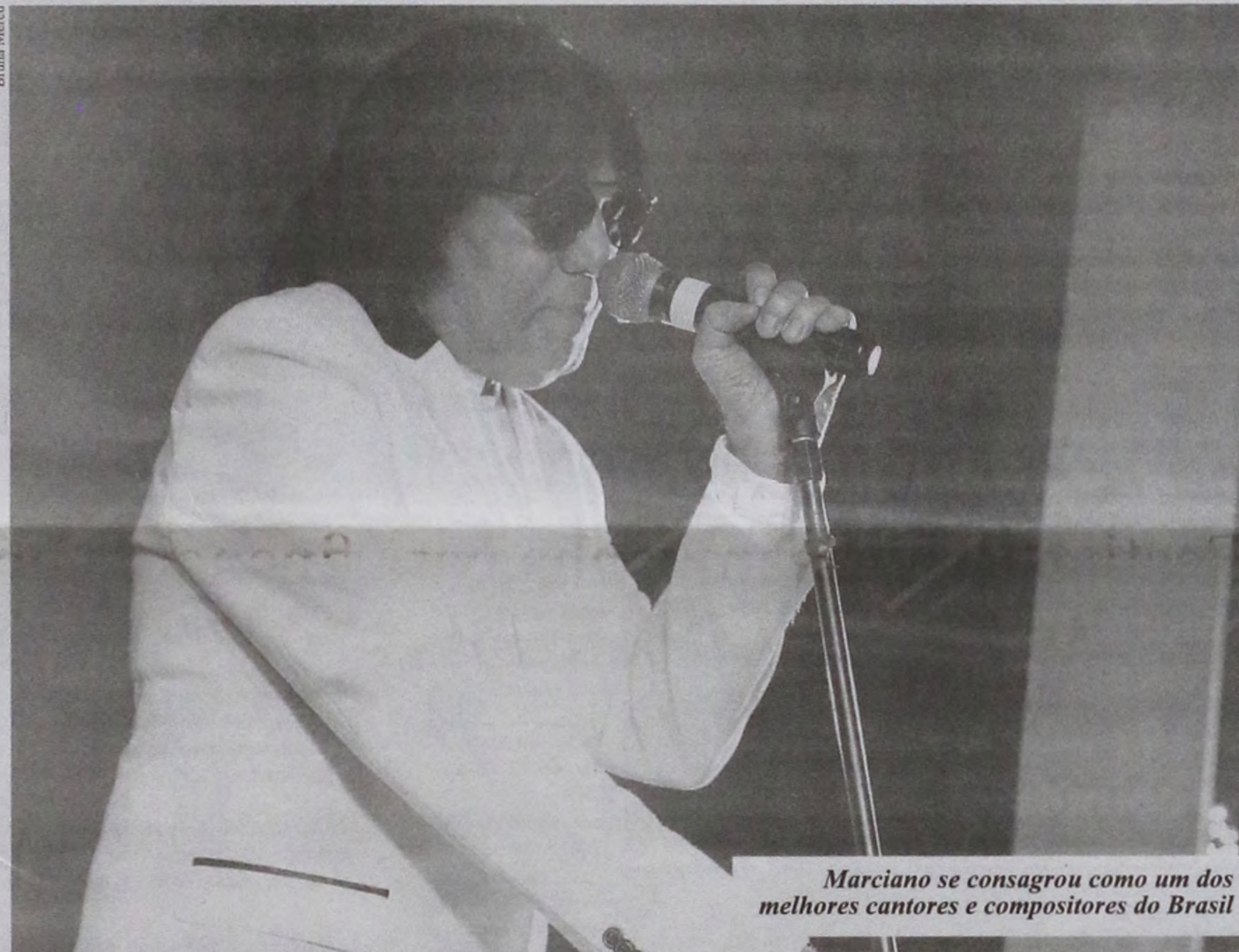
Marciano se consagrou como um dos melhores cantores e compositores do Brasil

músicas autorais, algumas com a ajuda de parceiros, ele se tornou um dos mais respeitados artistas do país.