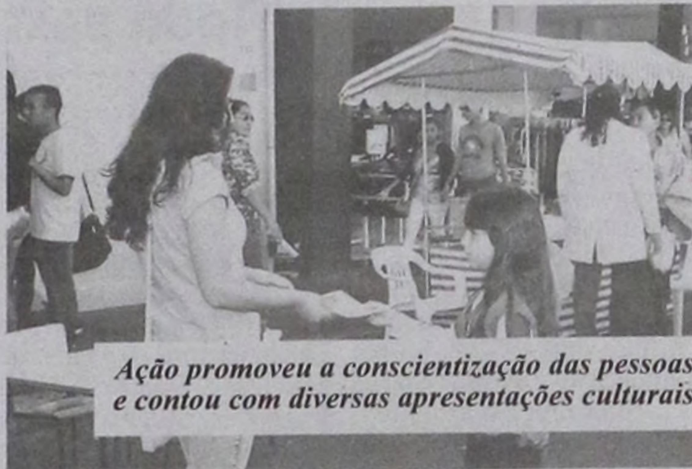
Ação promoveu a conscientização das pessoas e contou com diversas apresentações culturais