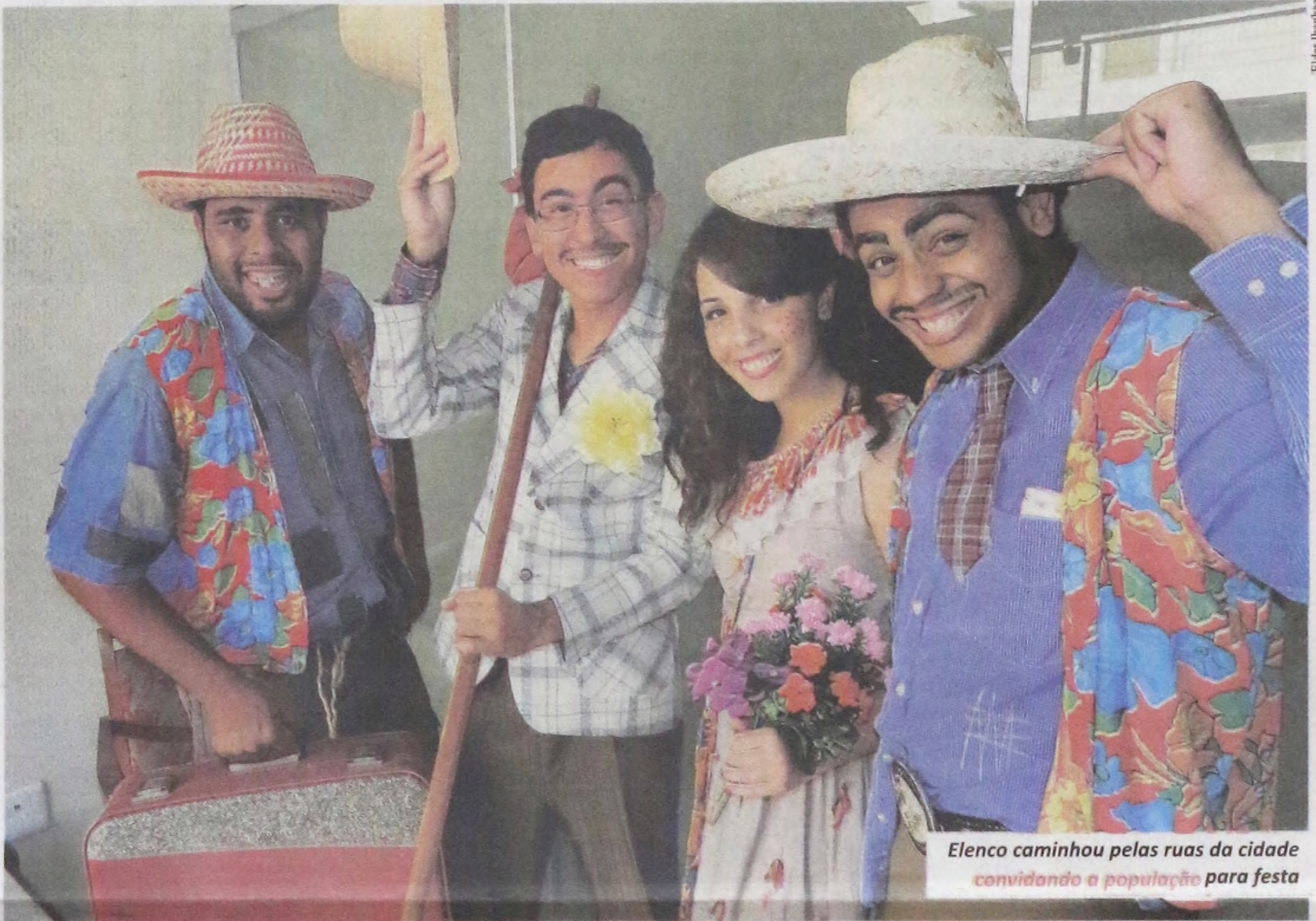
Elenco caminhou pelas ruas da cidade convidando a população para festa