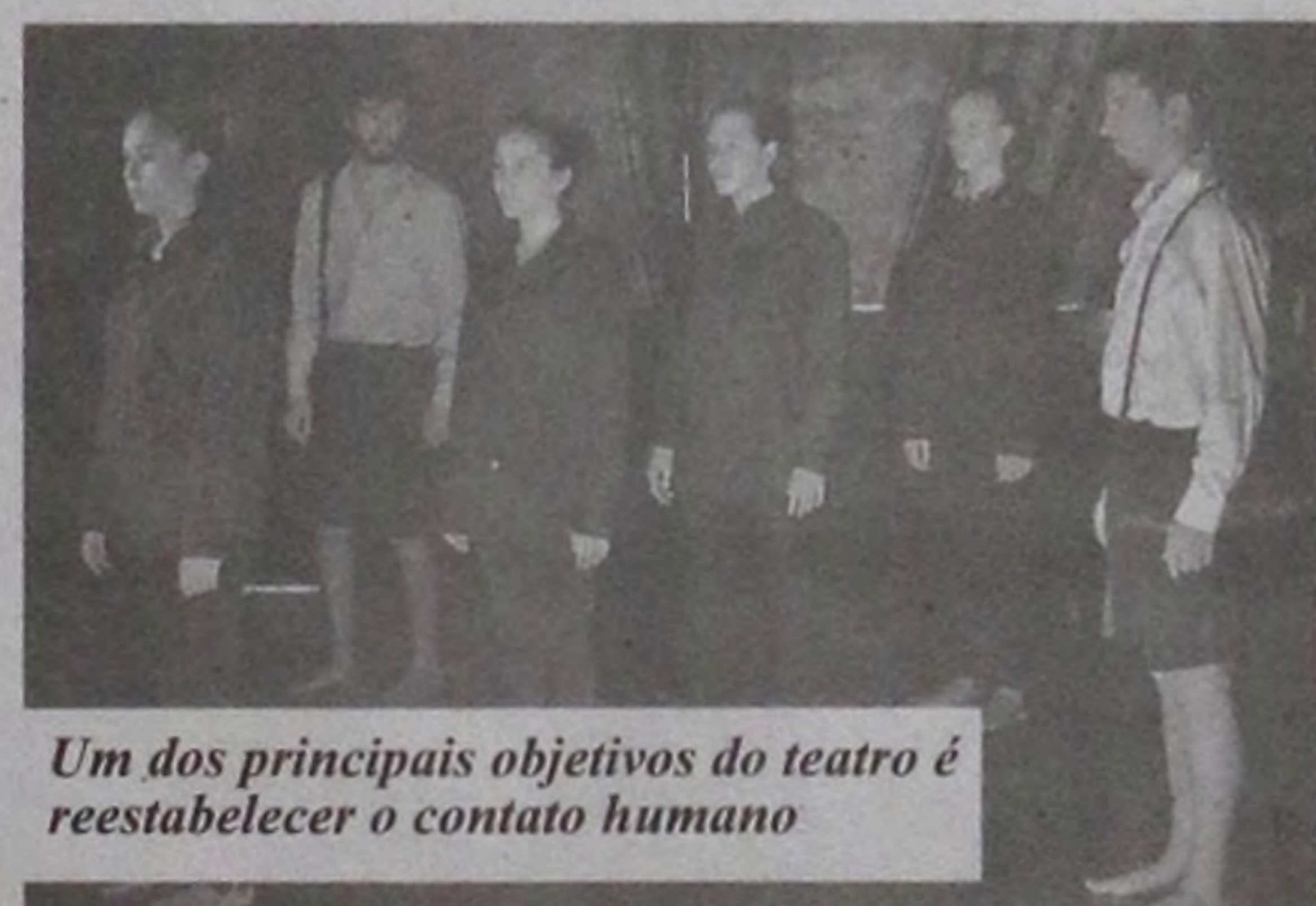
Um dos principais objetivos do teatro é reestabelecer o contato humano

ráter coletivo da casa. "A política é muito agregadora, tem este caráter coletivo, de valorizar e reunir outros grupos e iniciativas envolvendo teatro e cultura no geral".