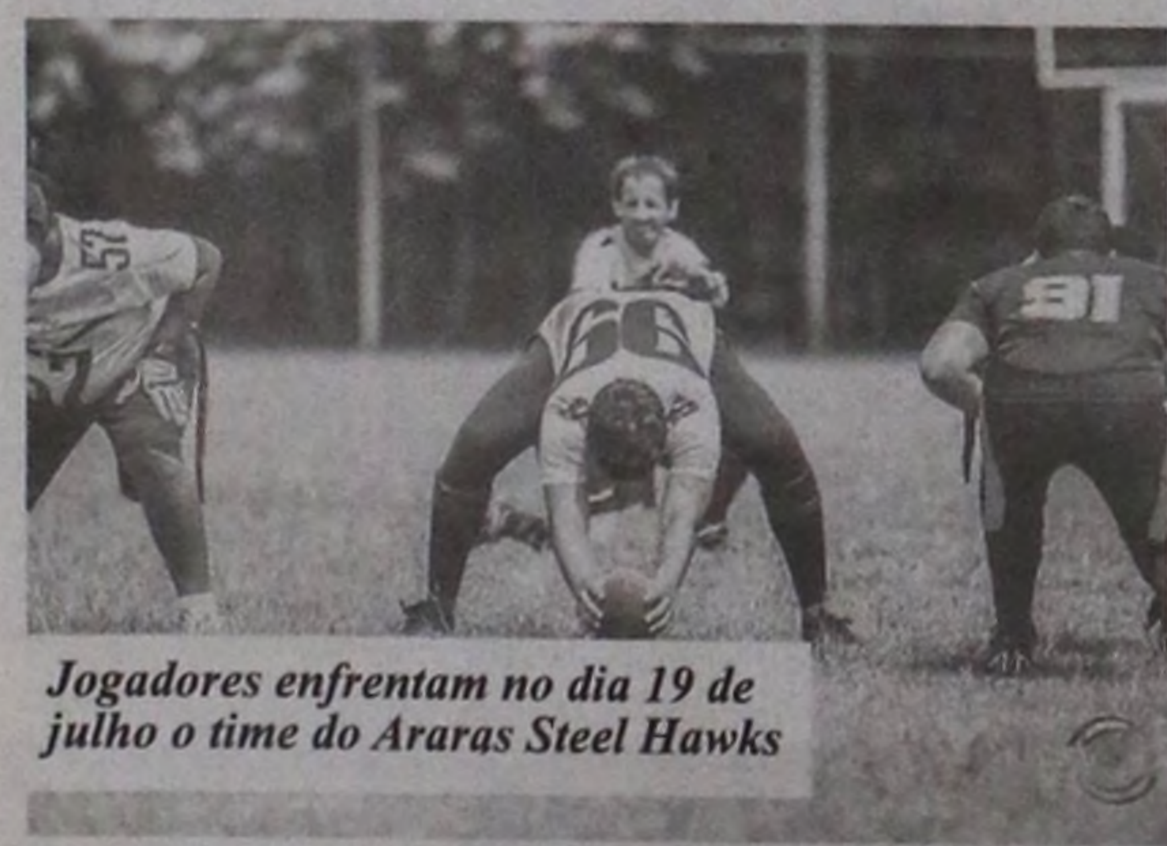
Jogadores enfrentam no dia 19 de julho o time do Araras Steel Hawks