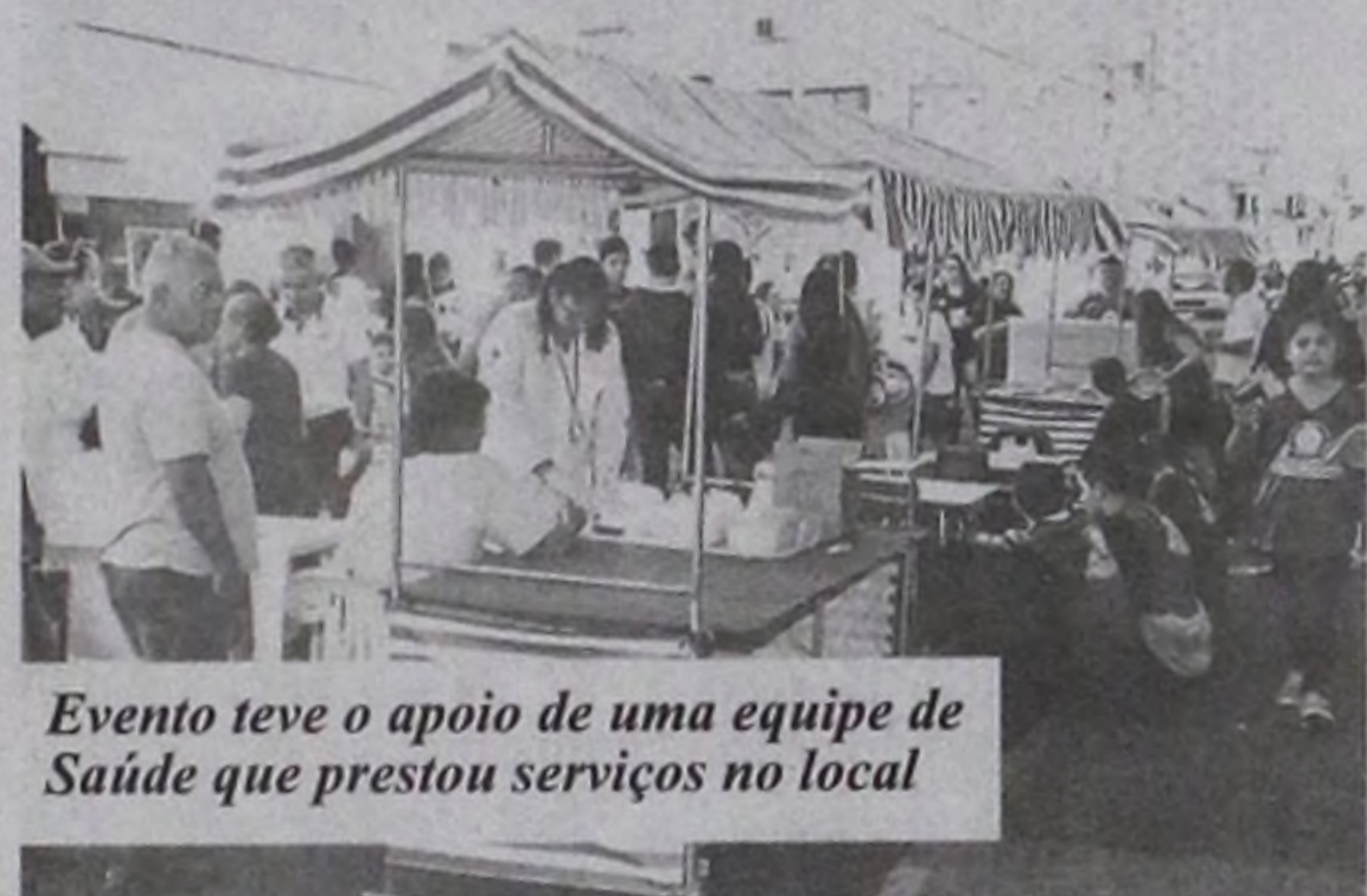
Evento teve o apoio de uma equipe de Saúde que prestou serviços no local