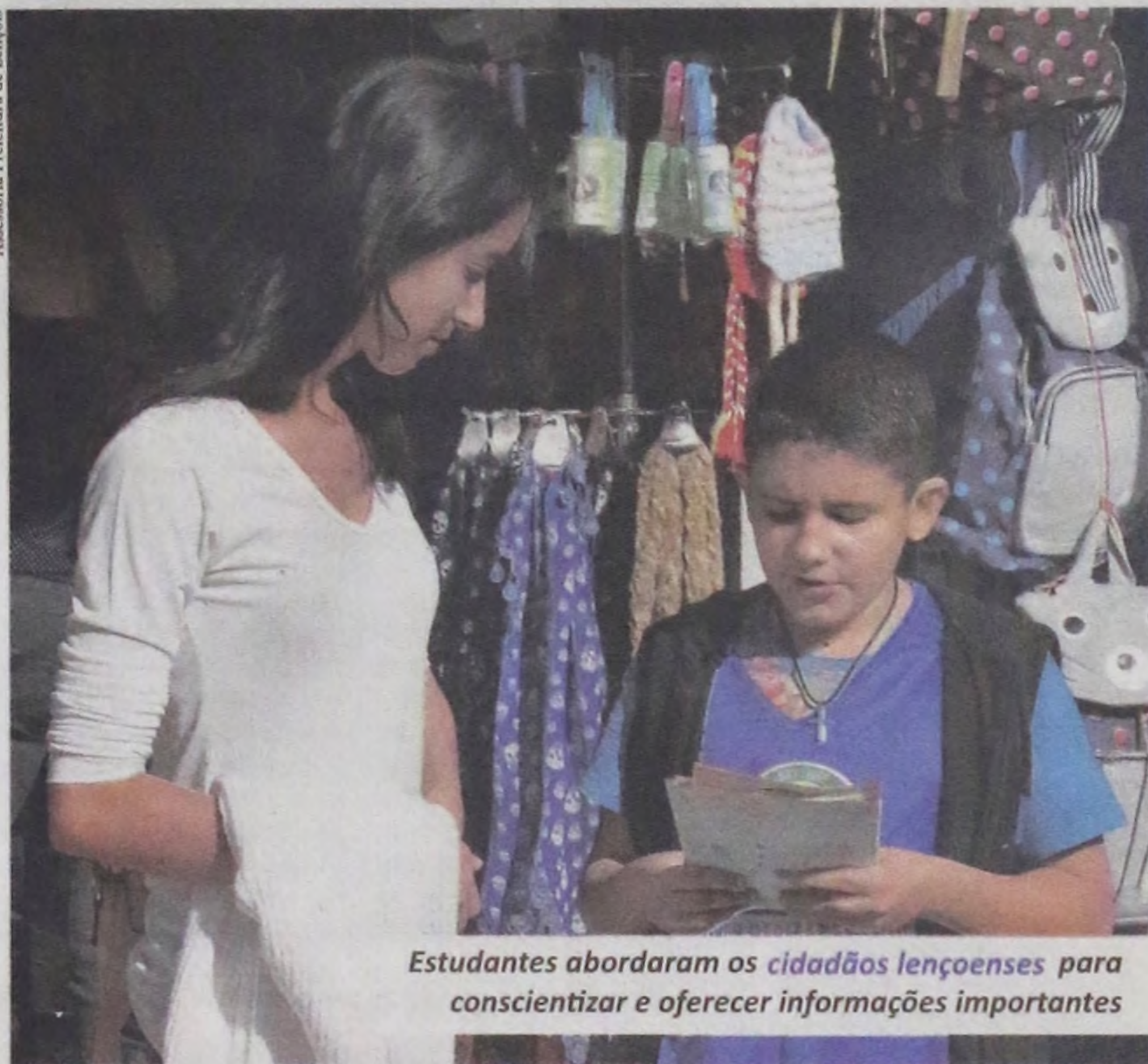
Estudantes abordaram os cidadãos lençoenses para conscientizar e oferecer informações importantes