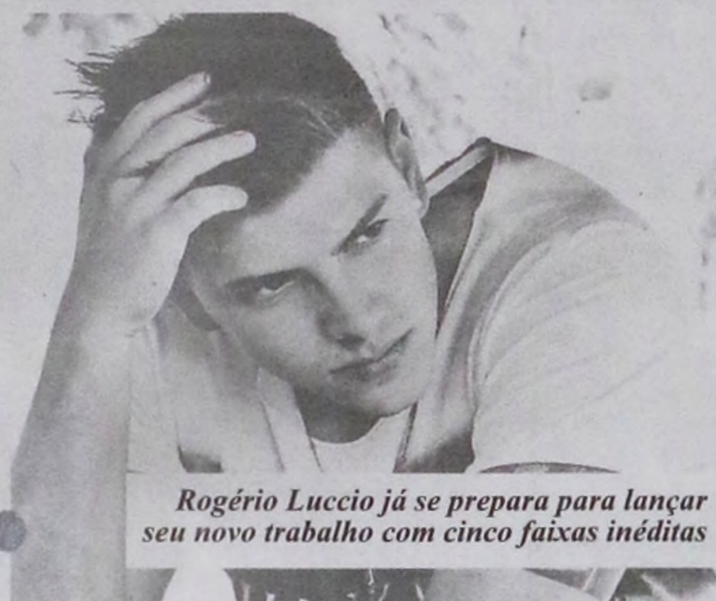
Rogério Luccio já se prepara para lançar seu novo trabalho com cinco faixas inéditas