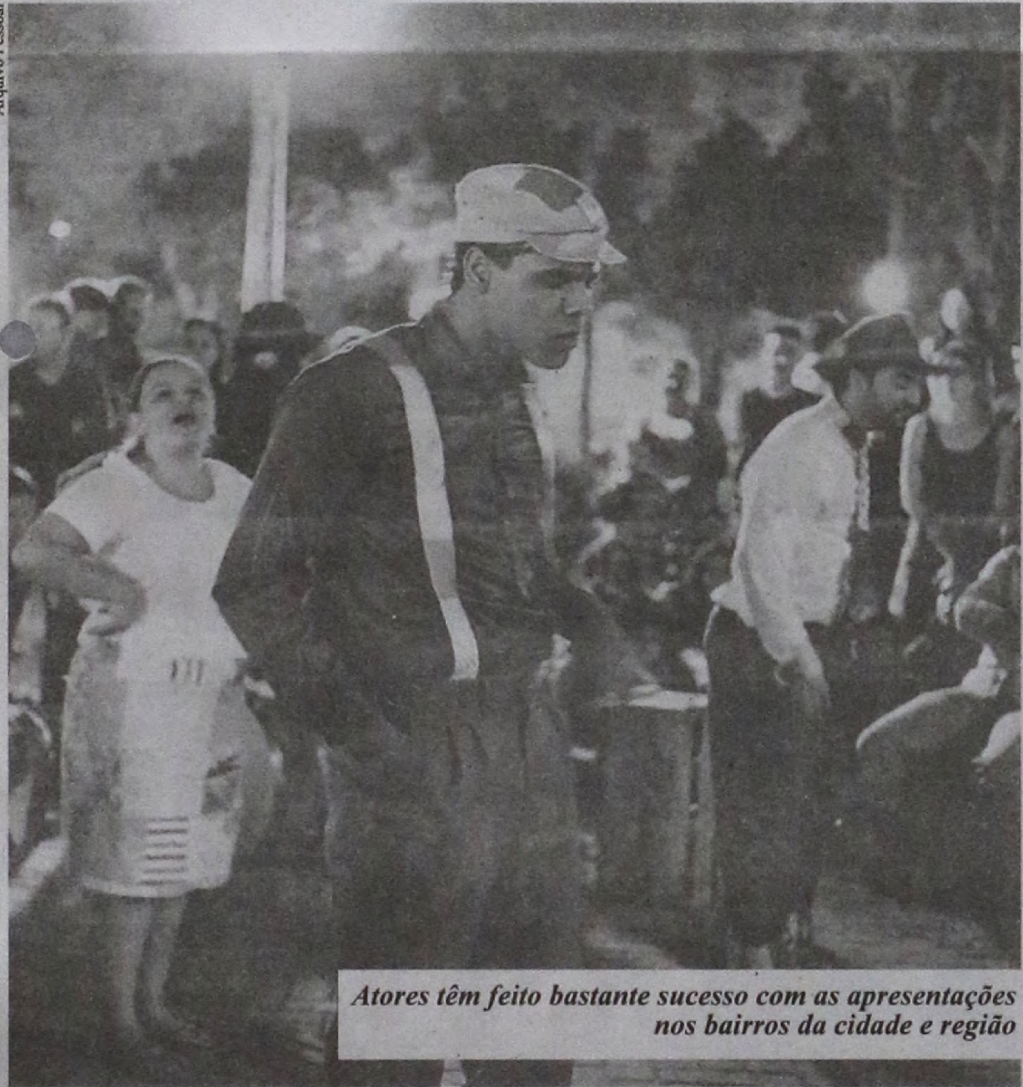
Atores têm feito bastante sucesso com as apresentações nos bairros da cidade e região

"A dança transforma. Toda pessoa que dança é mais feliz. Dançando é possível fazer novos amigos e interagir com as pessoas. Podemos cantar, dar boas risadas e se divertir praticando essa atividade", finaliza a professora.