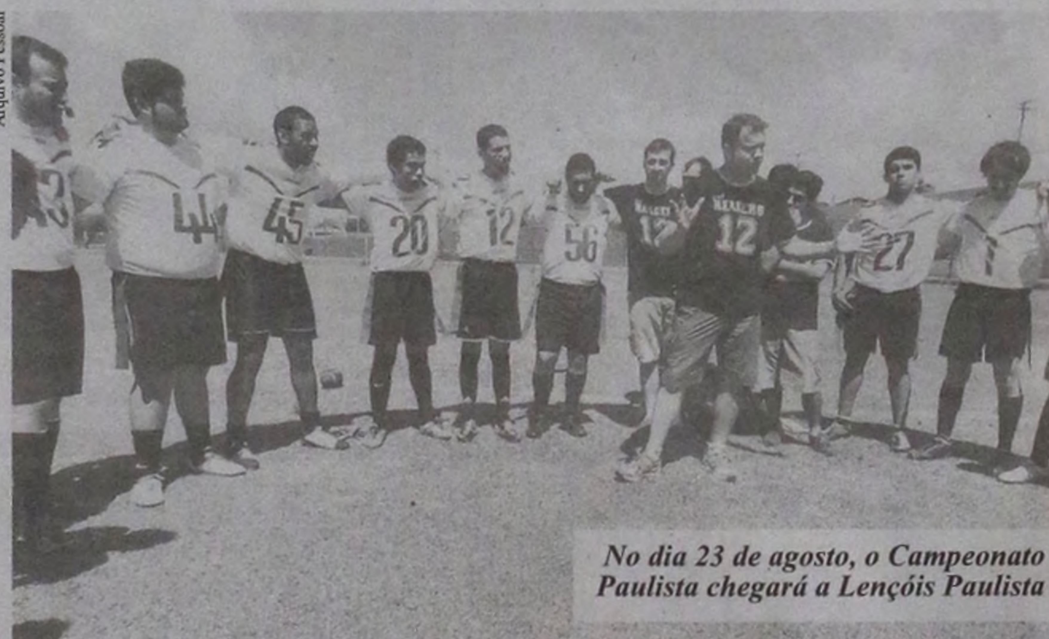
No dia 23 de agosto, o Campeonato Paulista chegará a Lençóis Paulista