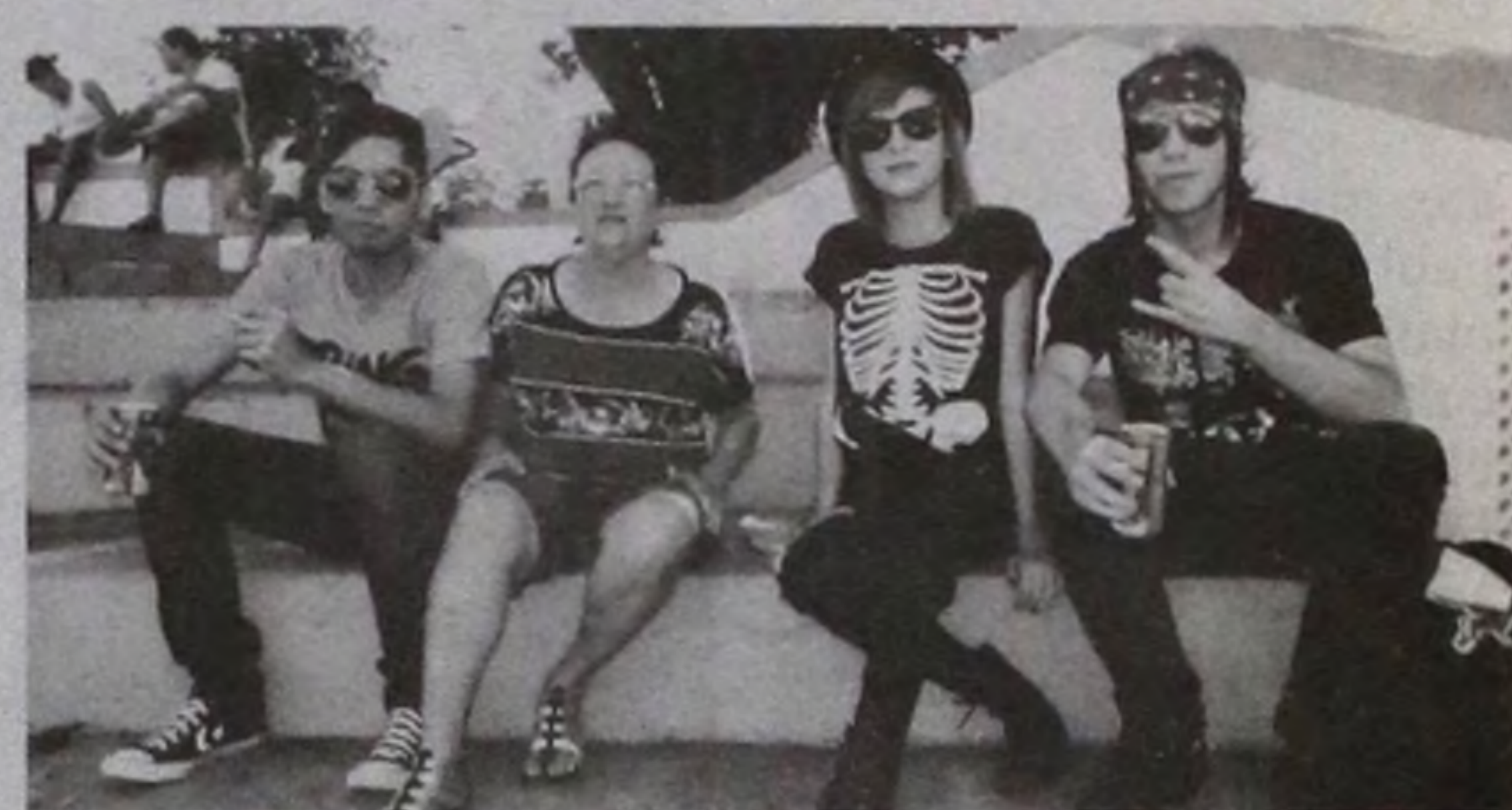
Diversas tribos curtiram a apresentação dos DJs

Uma união de cultura, lazer e caridade que certamente fez toda a diferença e transformou a Concha Acústica em uma verdadeira pista de dança.