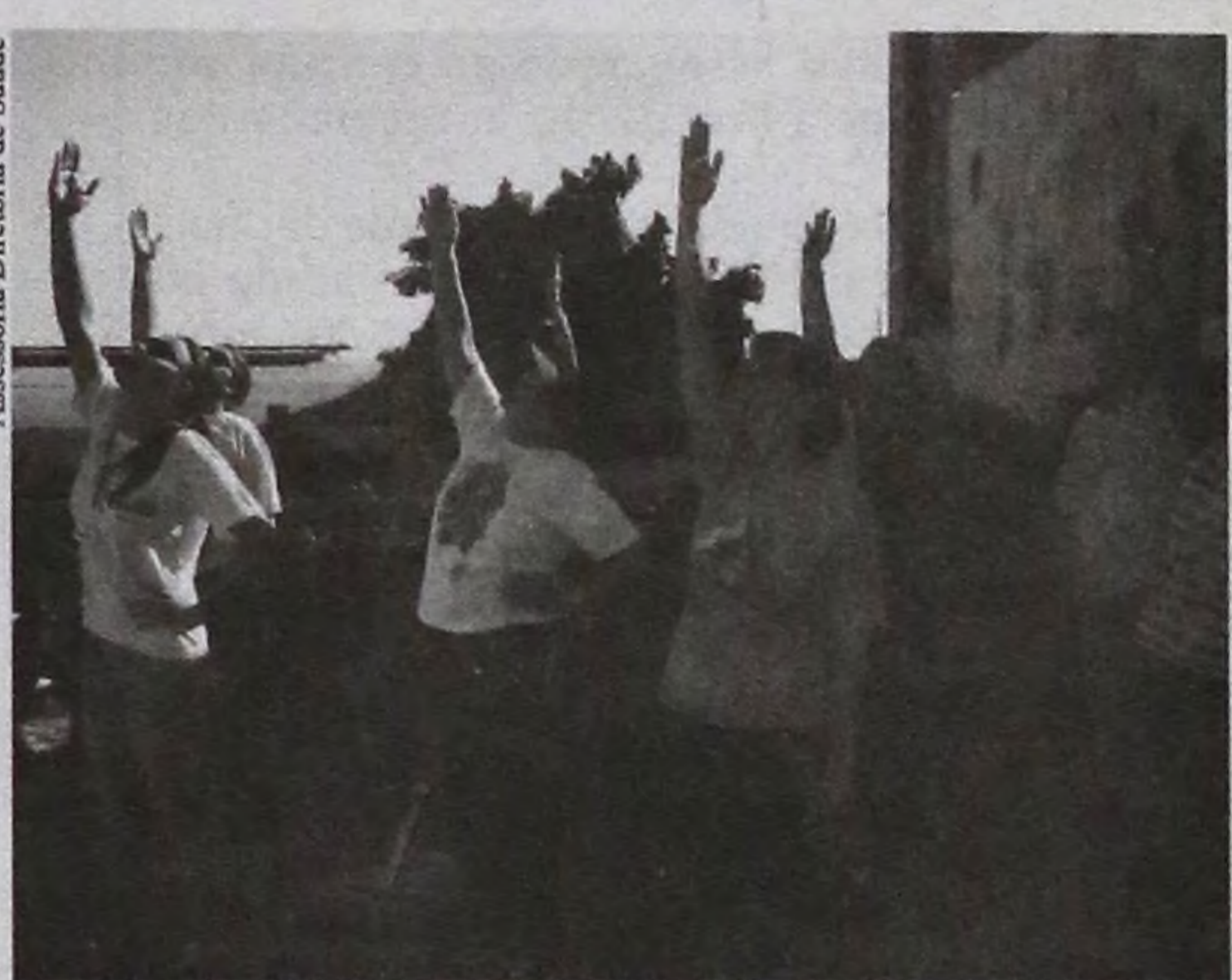
Caminhada é acompanhada por profissionais

Quem quiser, também pode aproveitar a presença da enfermeira e