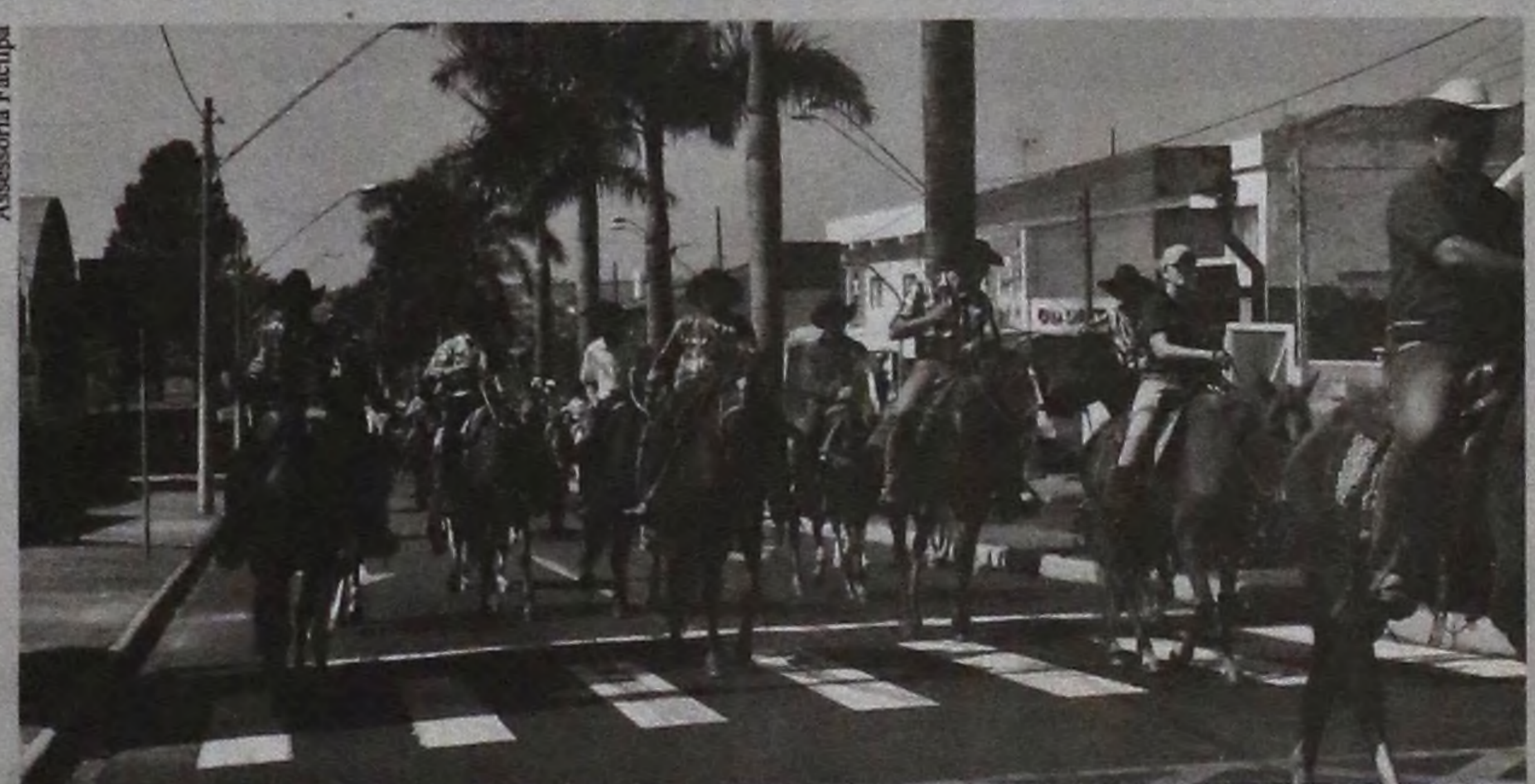
Cavaleiros e amazonas desfilam pelas ruas de Lençóis Paulista

A chegada, conforme manda a tradição, é no recinto José Oliveira Prado, onde acontece o almoço de confraternização (adesão a R$ 20,00 para os não cavaleiros e amazonas).