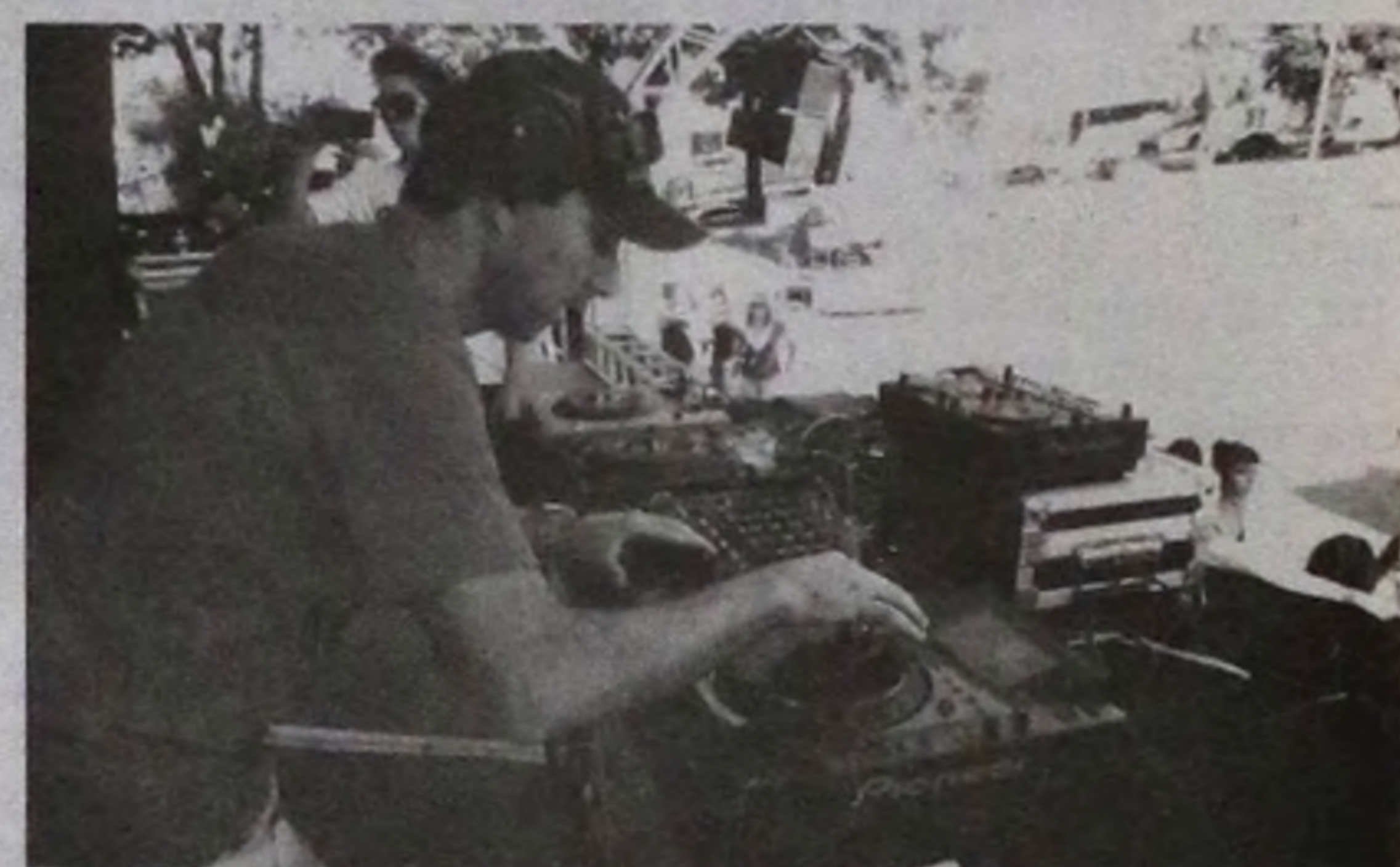
DJs da região marcaram presença no evento