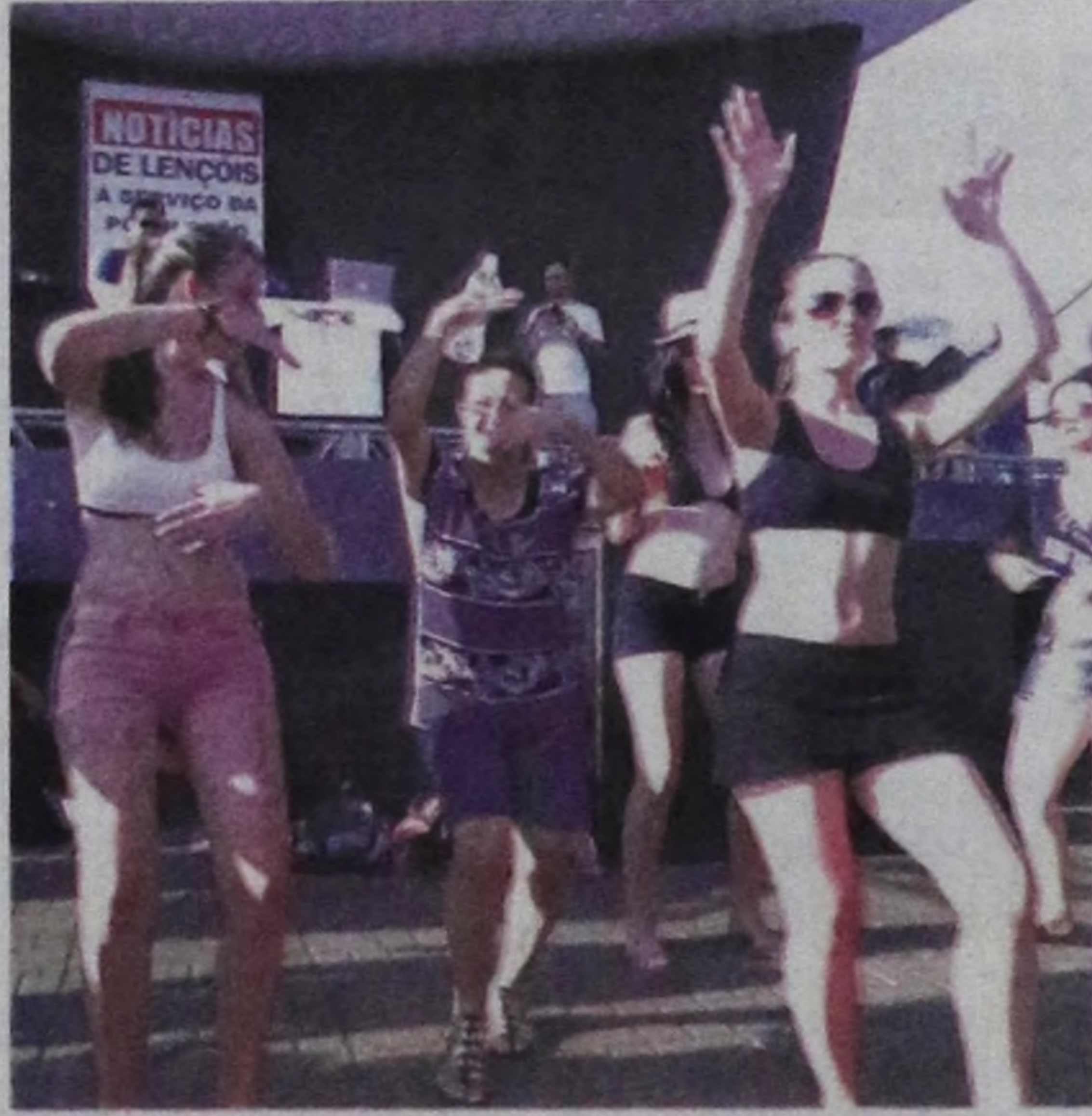
O evento contou com um público bastante animado