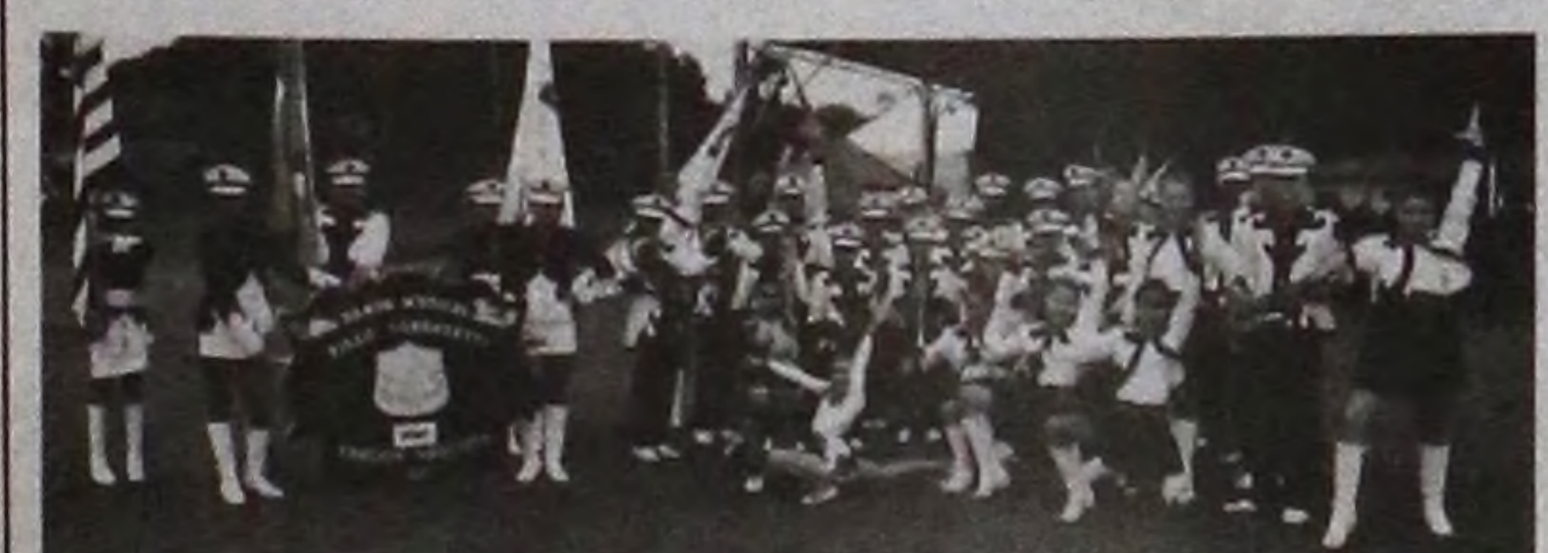
Integrantes da Banda Musical Zillo Lorenzetti

7 a 10 anos - 8h às 9h30 ou das 13h30 às 15h, de segunda e quinta-feira; 11 a 15 anos - 9h30 às 11h ou das 15h às 16h30, de terça e quinta-feira.