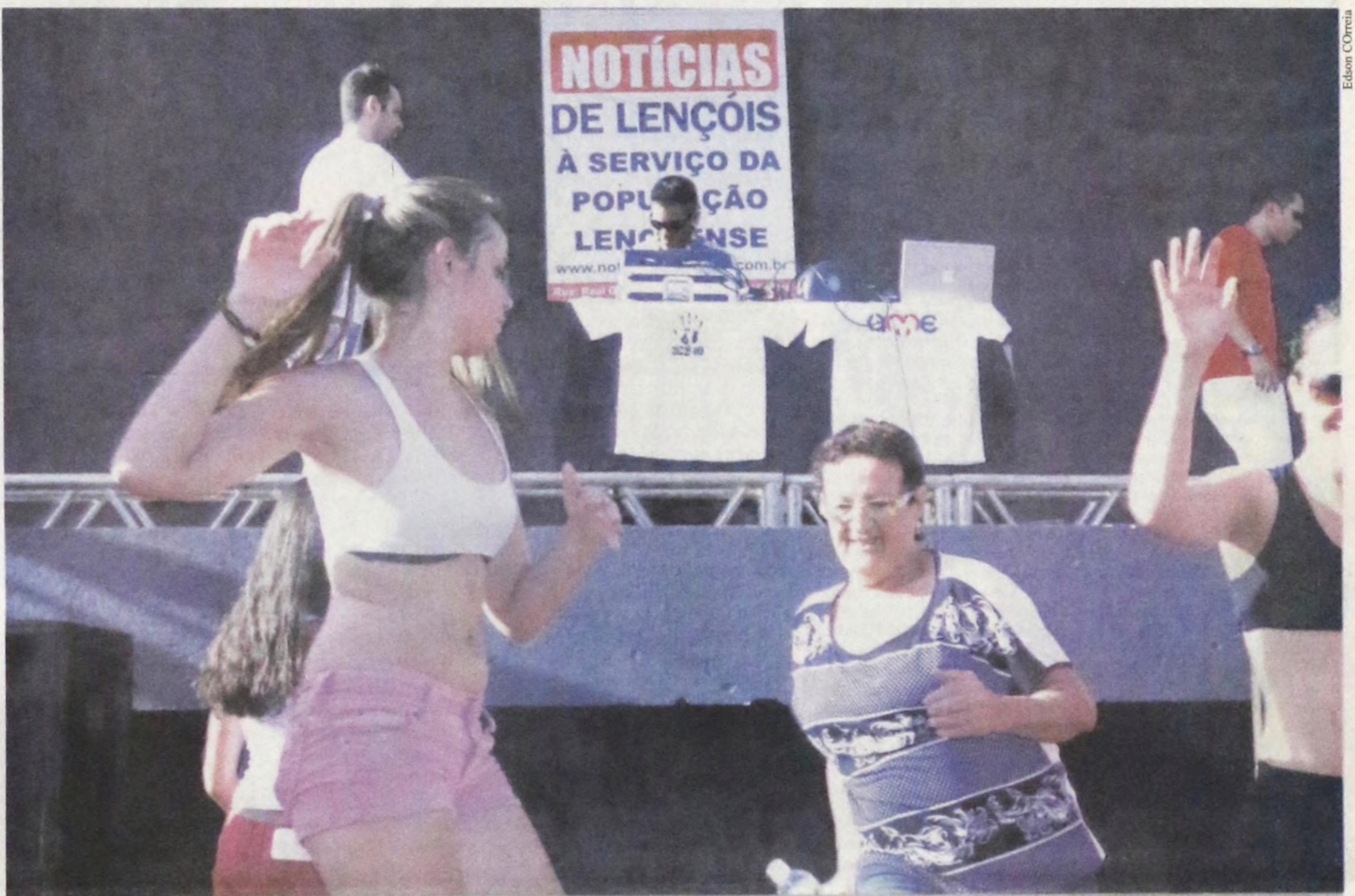
Pessoas de todas as idades se divertiram ao som dos sets alternativos apresentados pelos DJs convidados para o evento