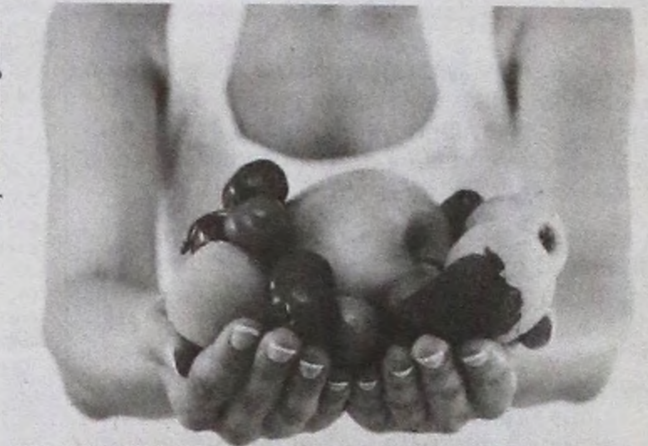
Dieta é elaborada de acordo com cada paciente

Um profissional que atua neste ramo tem como principal objetivo atender as necessidades exclusivas de seus pacientes que variam desde a reeducação alimentar particular ou familiar, manutenção do peso, variação ou adequação do plano alimentar, até a montagem de cardápio diário.