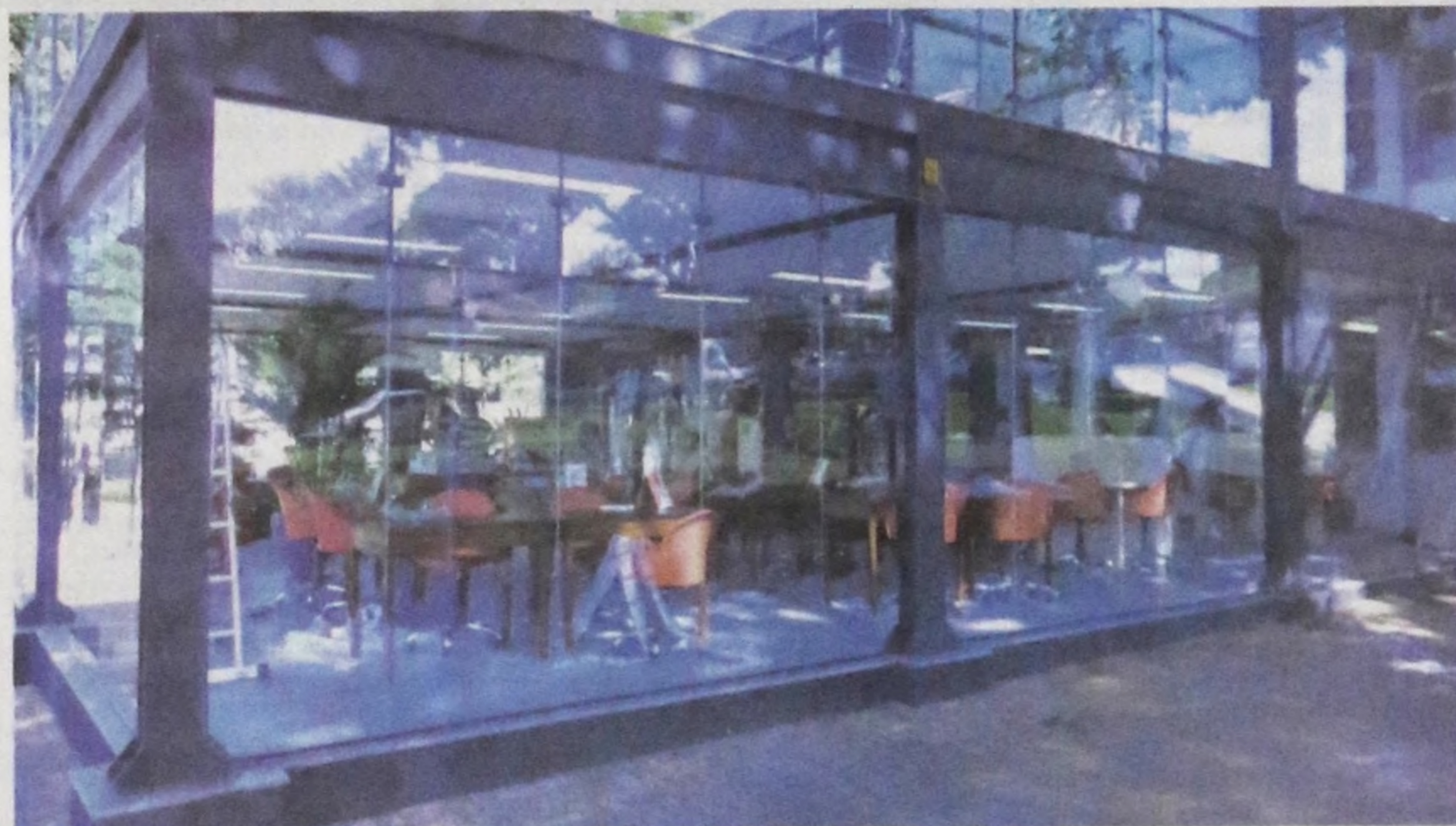
O local conta com um amplo espaço para leitura, iluminação natural e uma decoração impecável

A Biblioteca Municipal é considerada uma das melhores bibliotecas públicas do país.