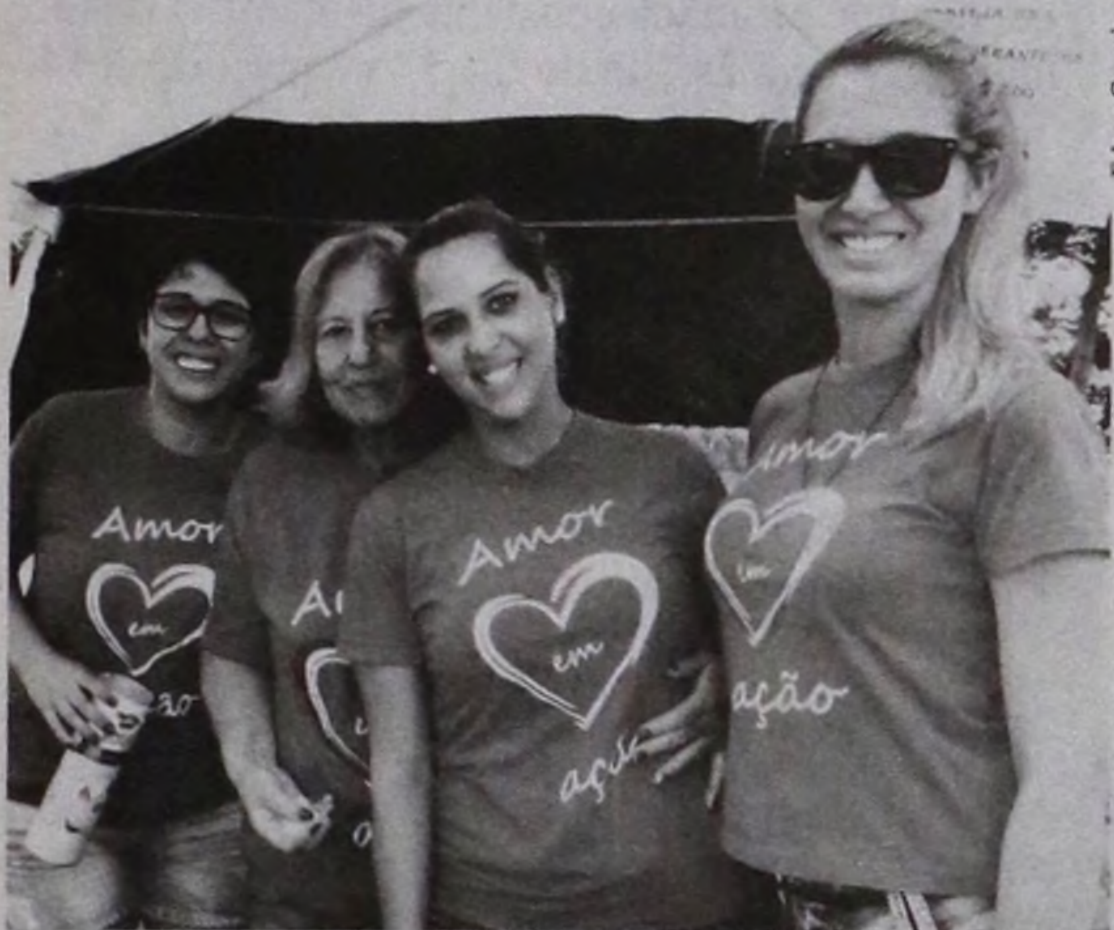
A iniciativa teve o apoio do Projeto "Amor em Ação"