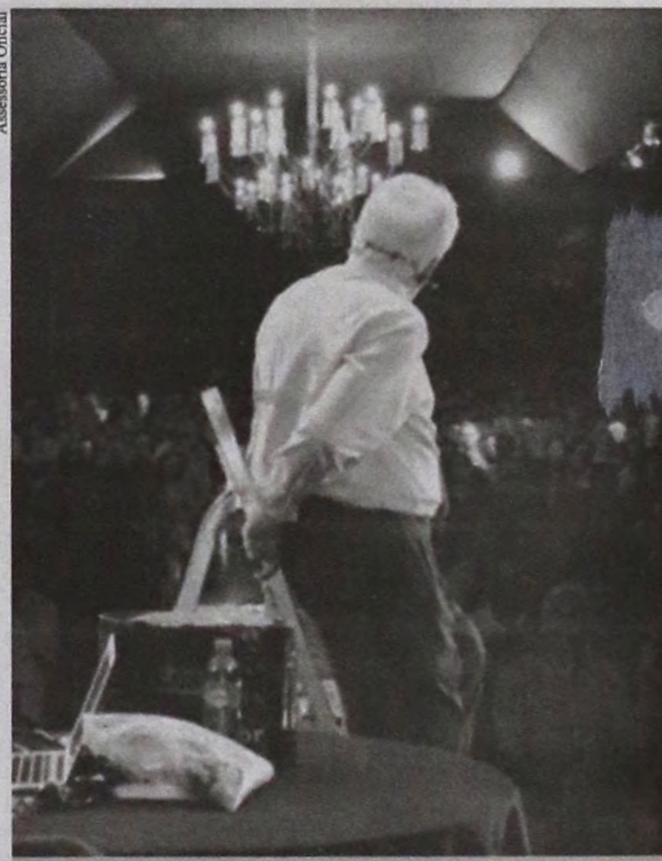
Em suas palestras ele interage bastante com o público

As informações acima foram obtidas dos atos oficiais do Diário Oficial do Estado, Portais Transparência da Prefeitura, Câmara, SAAE, IPREM e CMFP.