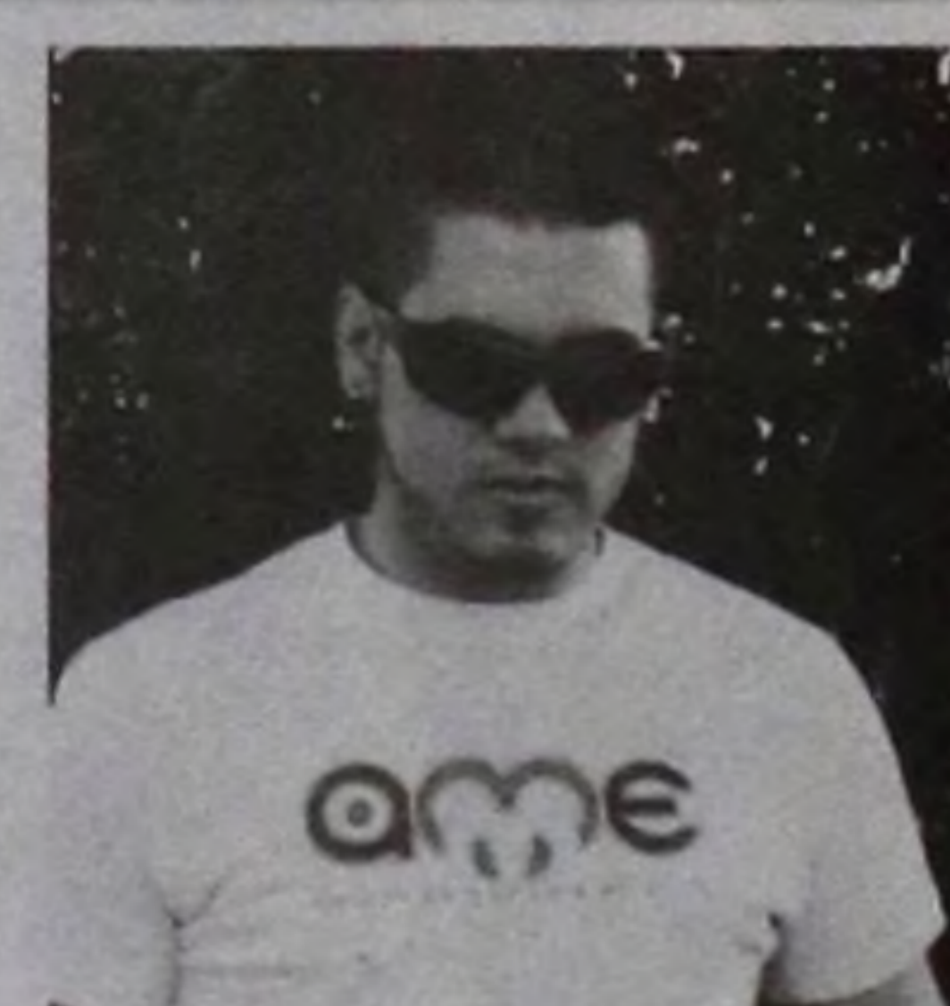
solidariedade, cultura e muita música eletrônica", finaliza.

Ele entende que a cultura começa aos poucos e já faz planos para que projeto se firme no município. "As pessoas só têm a ganhar com um projeto como este, realizado na praça, gratuitamente e com um caráter solidário. Que toda a galera esteja com a mente aberta para frequentar a AME, um evento que une