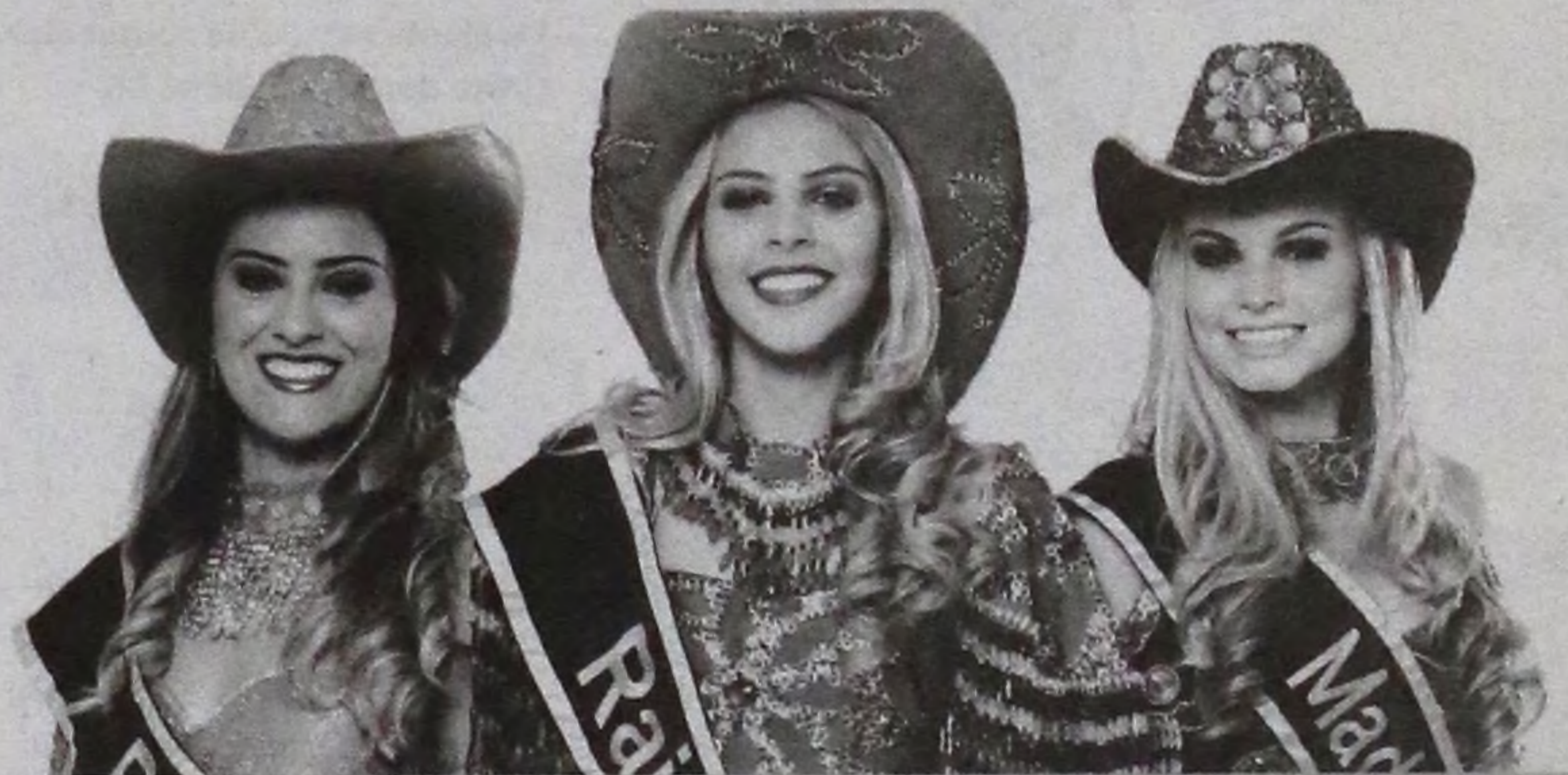
Este ano o concurso de beleza dará ao todo R$ 7,5 mil em prêmios

Na agenda, as 12 finalistas deste ano desfilam na tradicional cavalgada do dia 27 e no desfile cívico do dia 28.