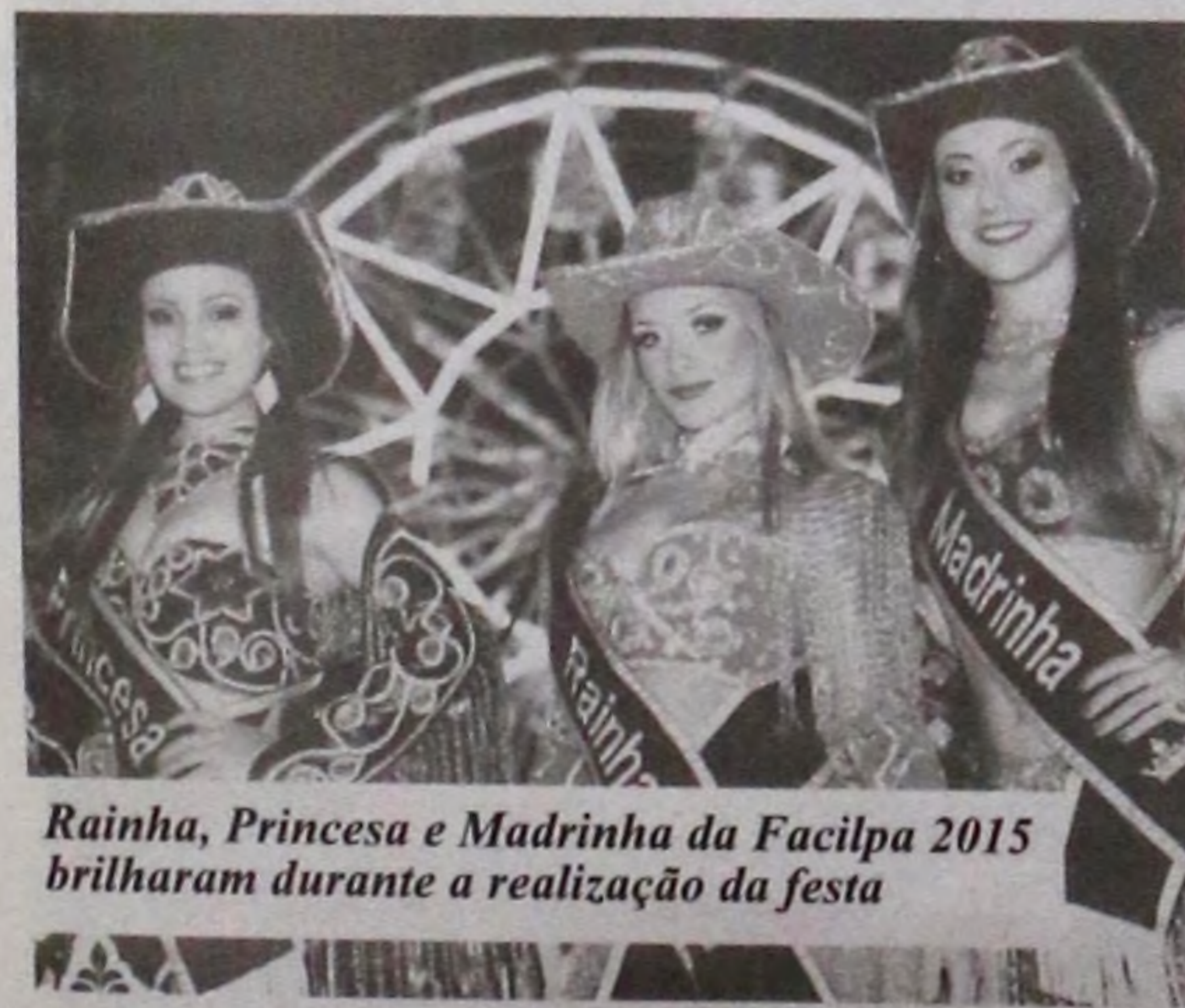
Rainha, Princesa e Madrinha da Facilpa 2015 brilharam durante a realização da festa