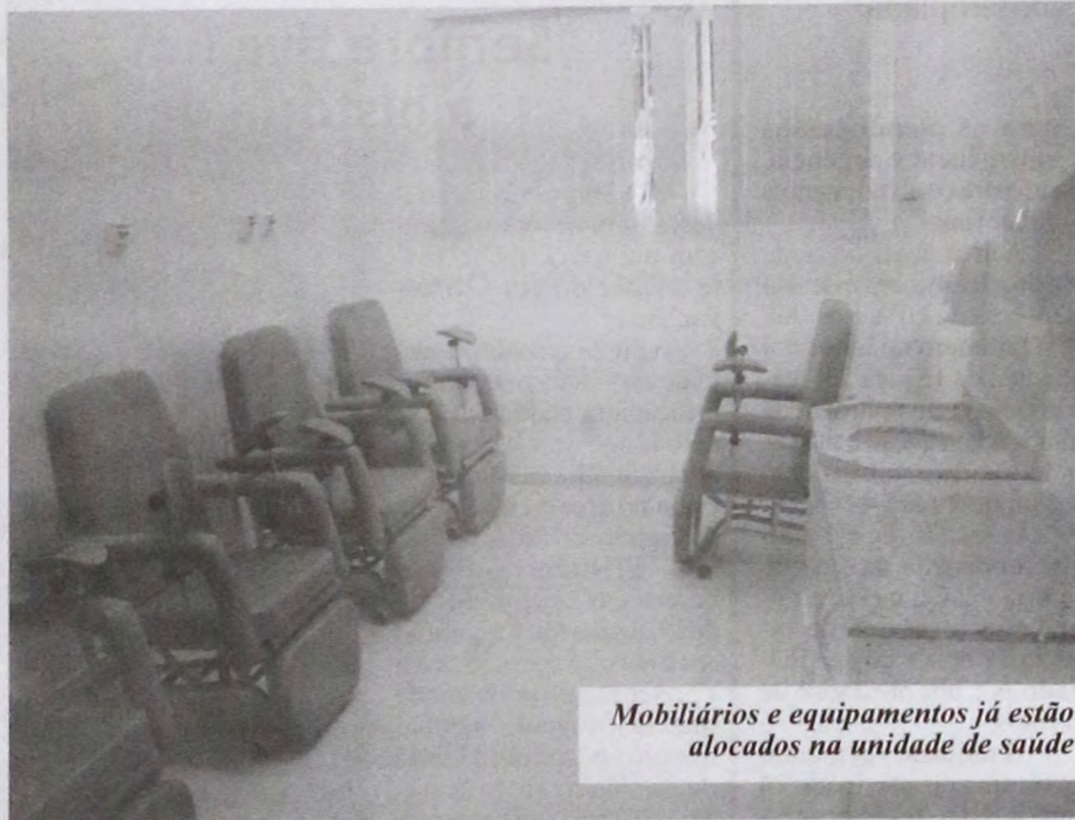
Mobiliários e equipamentos já estão alocados na unidade de saúde

nova licitação foi realizada e a Corcrl concluiu a obra no segundo semestre de 2013.