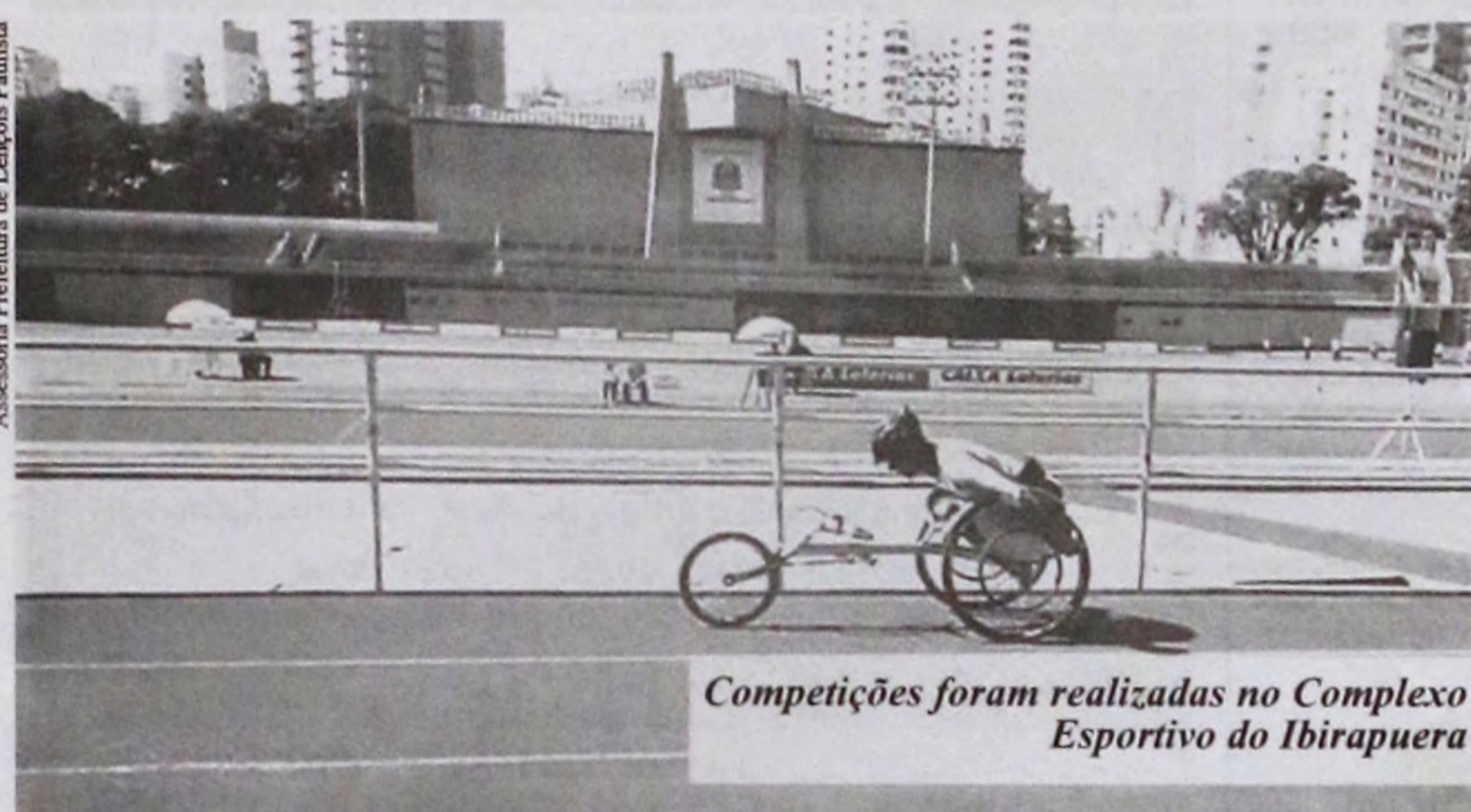
Competições foram realizadas no Complexo Esportivo do Ibirapuera

Amanhã, 23, nove jogos abrem o torneio de futsal livre, às 13h50, no Ginásio de Esportes Antônio Lorenzetti Filho, o Tonicão.