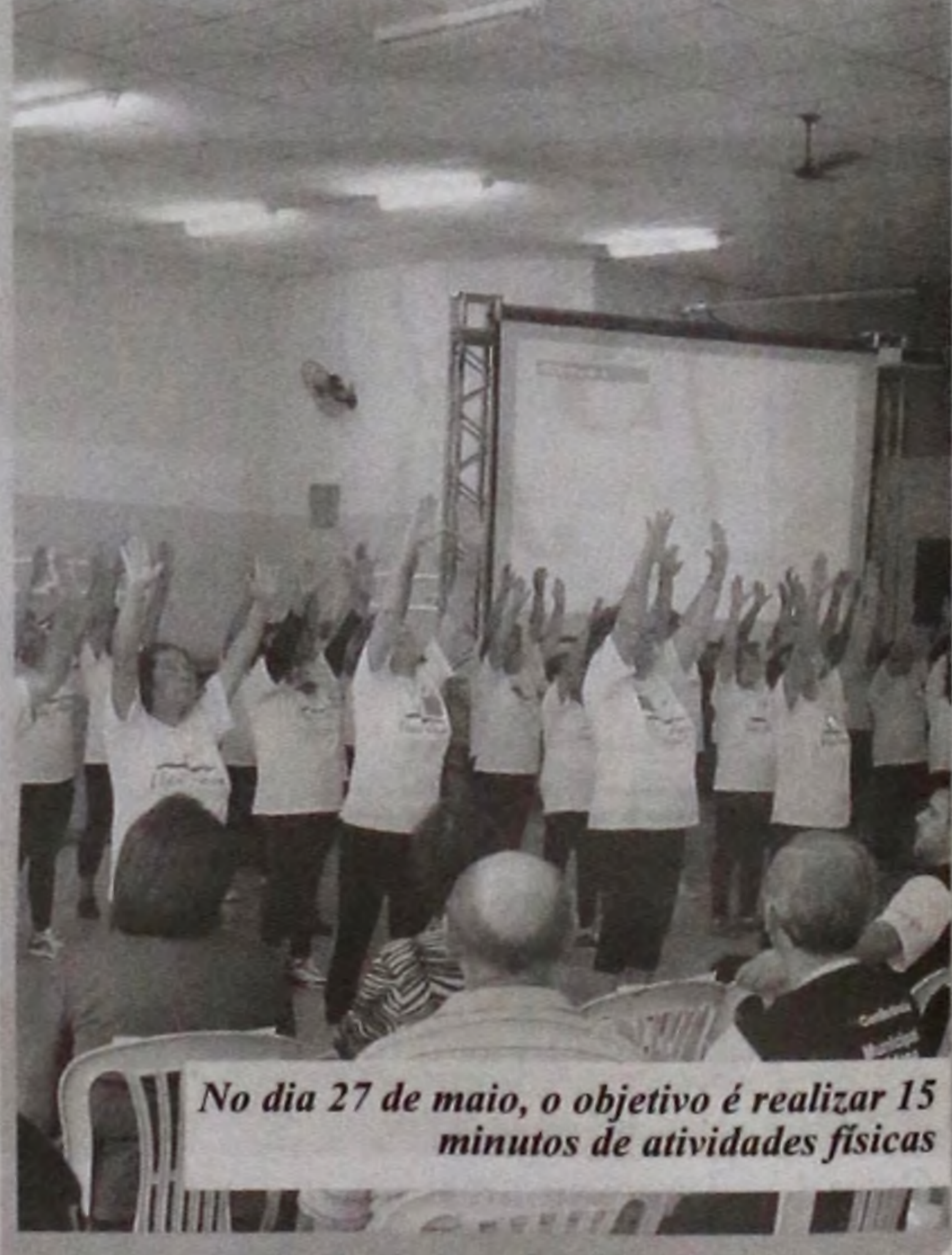
No dia 27 de maio, o objetivo é realizar 15 minutos de atividades físicas

Assessoria Prefeitura de Lençóis Paulista