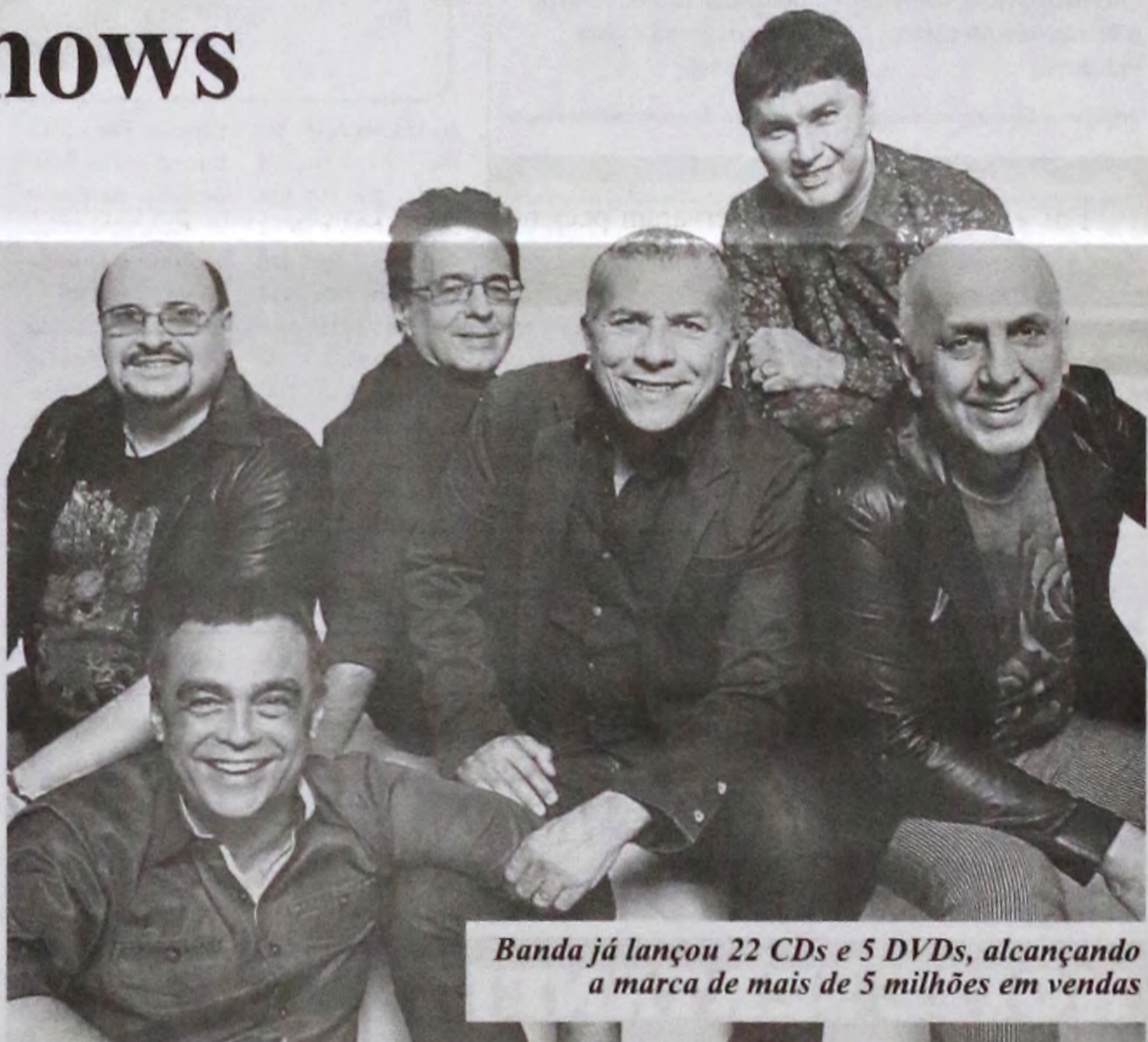
Banda já lançou 22 CDs e 5 DVDs, alcançando a marca de mais de 5 milhões em vendas

O DVD "Cruzeiro Roupas Nova", onde os artistas interpretam suas músicas em um transatlântico em alto mar traz uma mistura