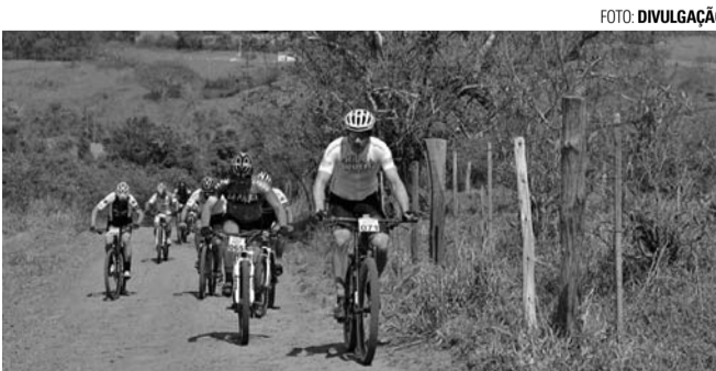
MTB - Lençóis Paulista recebe neste domingo, a partir das 9h, a última etapa do ano da Copa Pedal Sem Limites de MTB, que deve reunir mais de 200 ciclistas de toda a região. A competição será disputada em diversas categorias nas modalidades Pró, com percurso de 55 quilômetros, e Sport, com trajeto de 30 quilômetros, ambas com trechos de asfalto e estradas de terra. A largada será do Recinto de Exposições José oliveira prado (Facilpa).