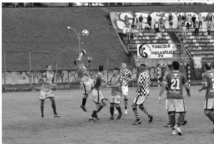
DIA DE DECISÃO - Estreante, Unidos do Júlio Ferrari (uniforme quadriculado) enfrenta São Cristovão por título da Copa Cidade do Livro

Vale lembrar que em caso de empate o título será decidido em cobranças de pênaltis. Após o confronto será realizada a cerimônia de premiação, com a entrega dos troféus e medalhas para os campeões e vice-campeões. Também serão premiados o melhor goleiro e o artilheiro da competição.