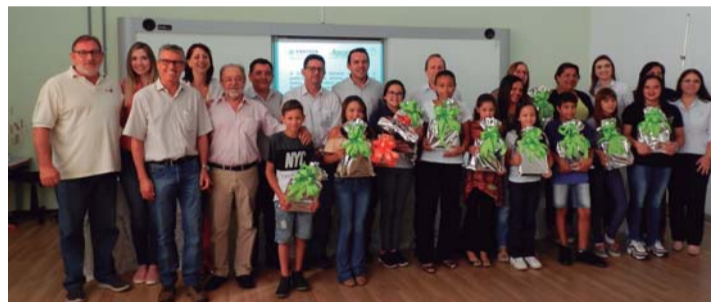
PREMIAÇÃO - Confira como foi a entrega dos prêmios em Lençóis Paulista, Macatuba e Pederneiras

os alunos vencedores foram premiados com um notebook e seus professores receberam um porta-