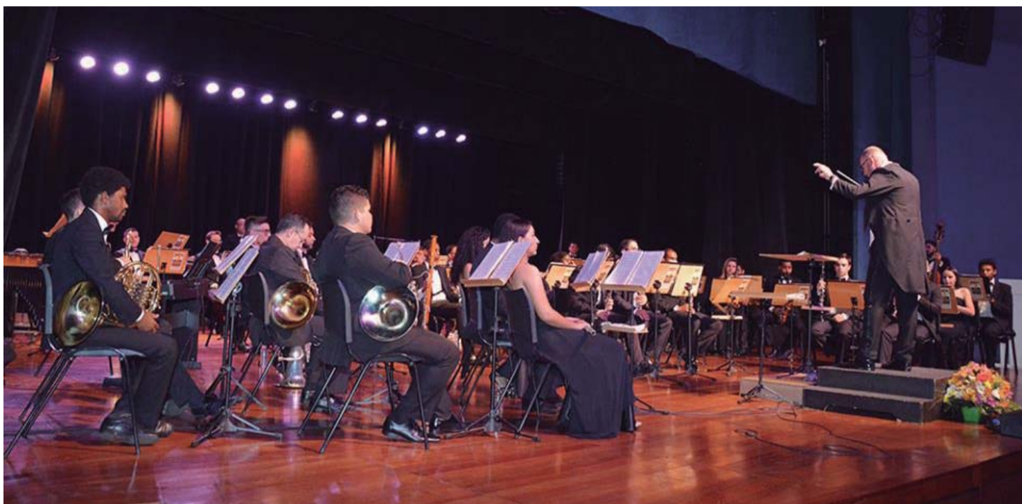
TRIBUTO - Teatro Municipal recebe projeto Queen Sinfônico na próxima quarta-feira (5)

Apresentado pela Orquestra Municipal de Sopros, show terá participação de vários artistas locais