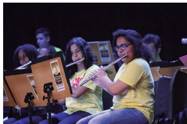
OPORTUNIDADE - Inscrições para o Projeto Guri estão abertas nos polos de Macatuba e Pederneiras