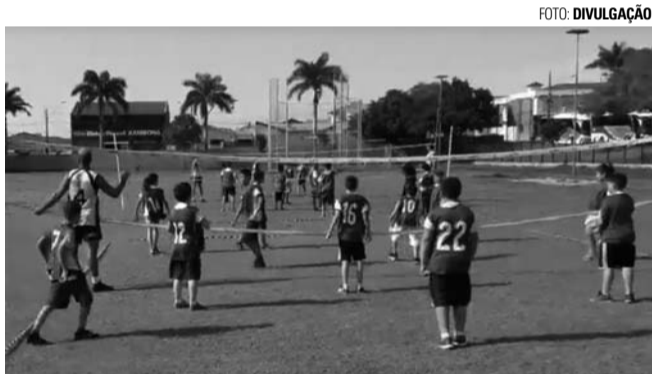
VOLEIBOL - Dando sequência à programação em comemoração aos 80 anos do voleibol de Lençóis Paulista, o Programa Sempre Vôlei promoveu nessa sexta-feira (30) a 18ª edição do Fest Sempre Vôlei, que reuniu dezenas de alunos das escolinhas de habilidades dos 16 polos espalhados pela cidade. O evento foi realizado na Pista de Atletismo Juracy Cassita e no Ginásio Municipal de Esportes Antonio Lorenzetti Filho (Tonicão).

Também na segunda-feira (3), a partir das 20h20, a representação da Associação Atlética Botucatuense entra em quadra contra o Jahu Futsal pelo jogo de ida das quartas de final. As equipes decidem a classificação na quarta-feira (5), no mesmo horário.