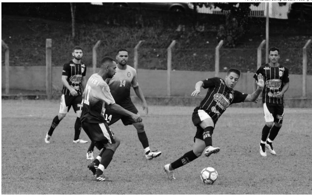
SEMI...FINAL - Com eliminação de equipes locais, Maringá fica com título e Borebi com o vice-campeonato da Copa Imprensa

"Em janeiro deste ano criamos o Código Disciplinar Desportivo Lençoense, que serve justamente para coibir e punir esse tipo de infração cometida no âmbito esportivo, desde a parte de atletas e comissões técnicas até as equipes de arbitragem. Todas as pessoas que participam das competições locais assinam um termo de ciência dessa regulamentação, que segue os moldes da adotada nas competições oficiais do estado", relata o secretário, que avalia como justa a punição